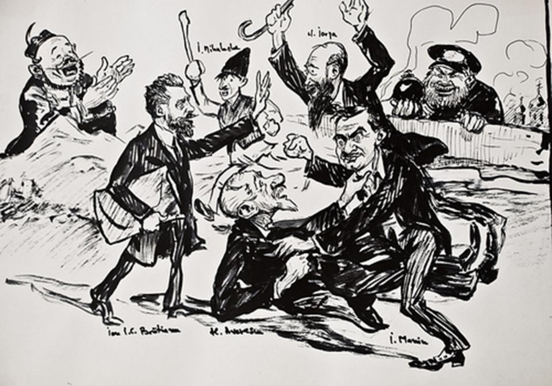
Viața politică românească în perioada interbelică (caricatură)