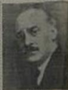
I. G. DUCA