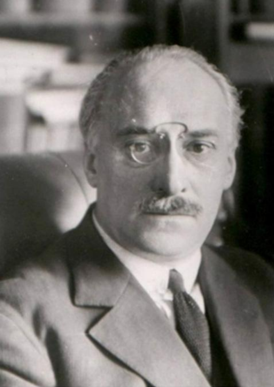
Ion Gheorghe Duca