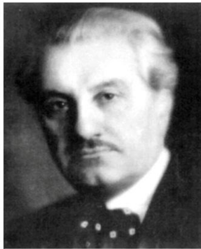
Constantin Titel Petrescu