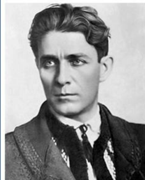
Corneliu Zelea Codreanu