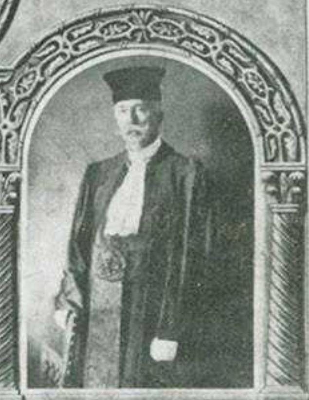
1895-96 MIHAIL CRISTEA PAPA ROMANIEI