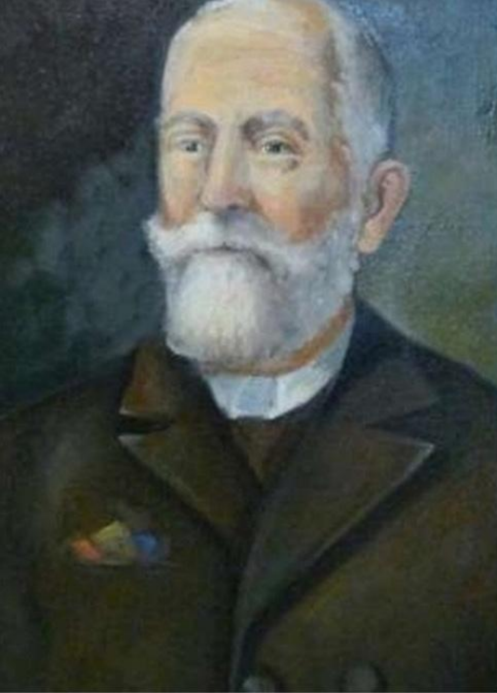
Gheorghe Pop de Băsești