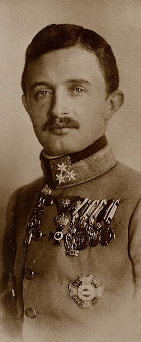
Carol I de Habsburg