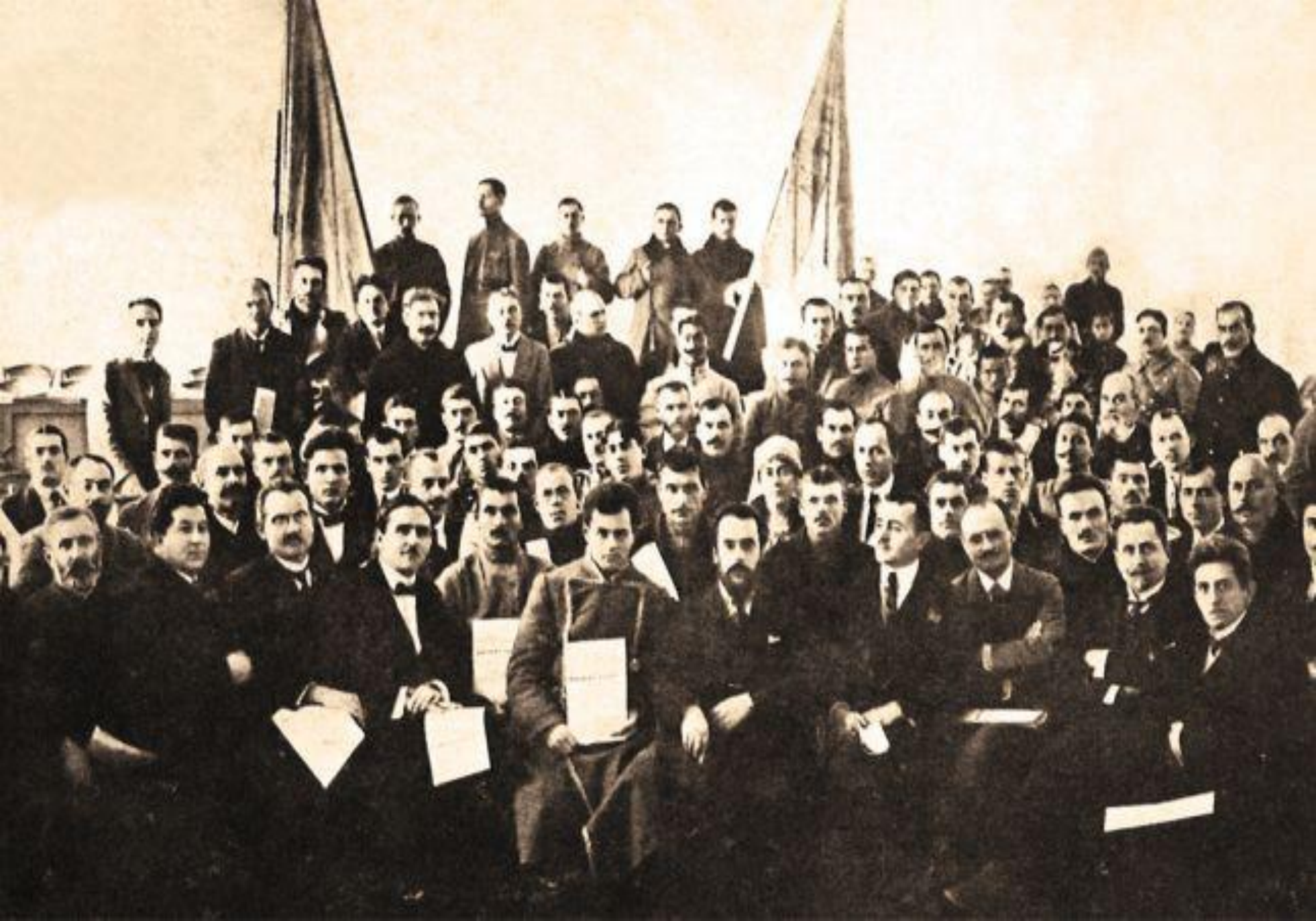
Sfatul Țării (1918)