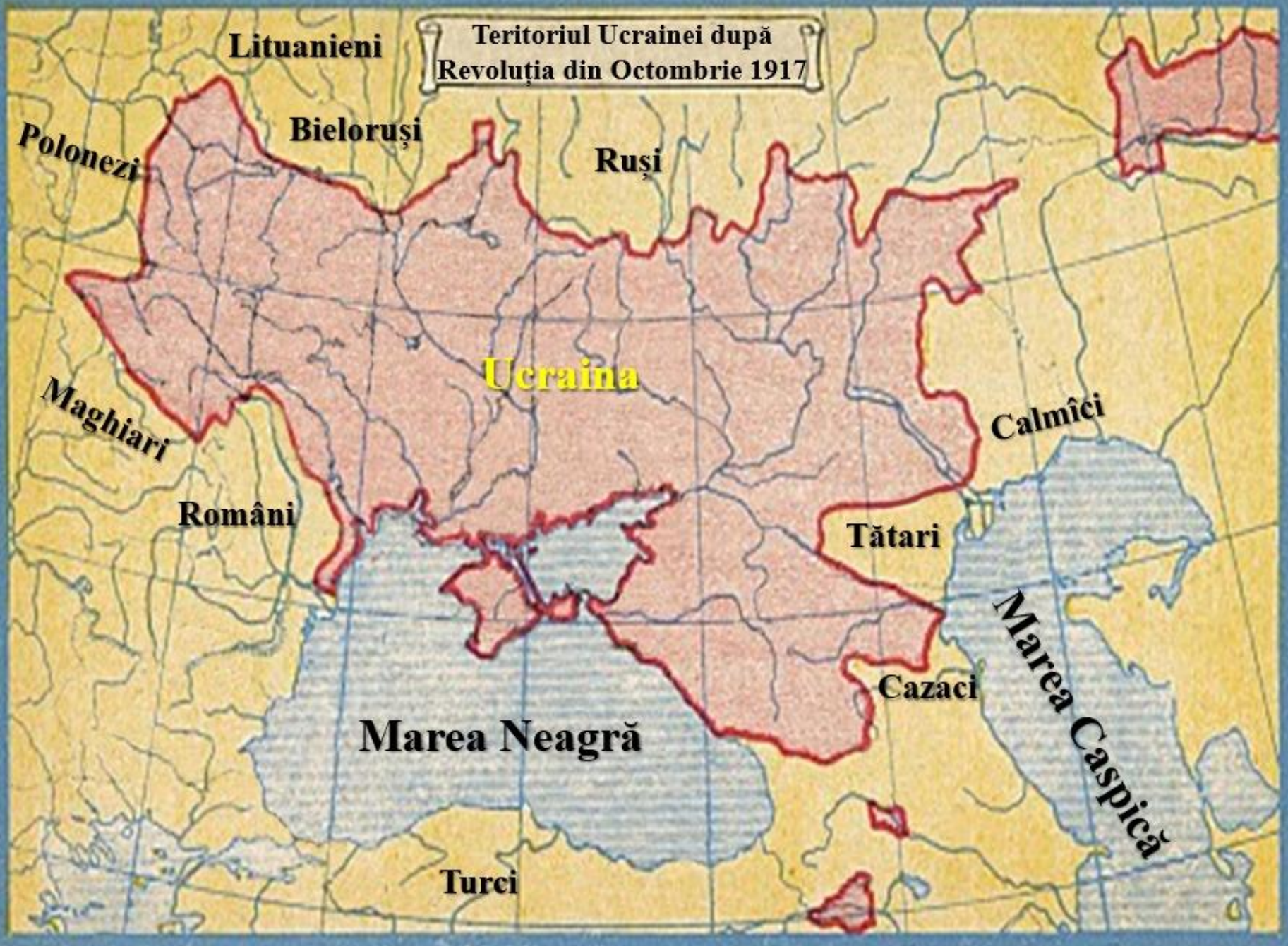
Teritoriul Ucrainei după Revoluția din Octombrie 1917