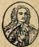
DIMITRIE CANTEMIR 1750-1711