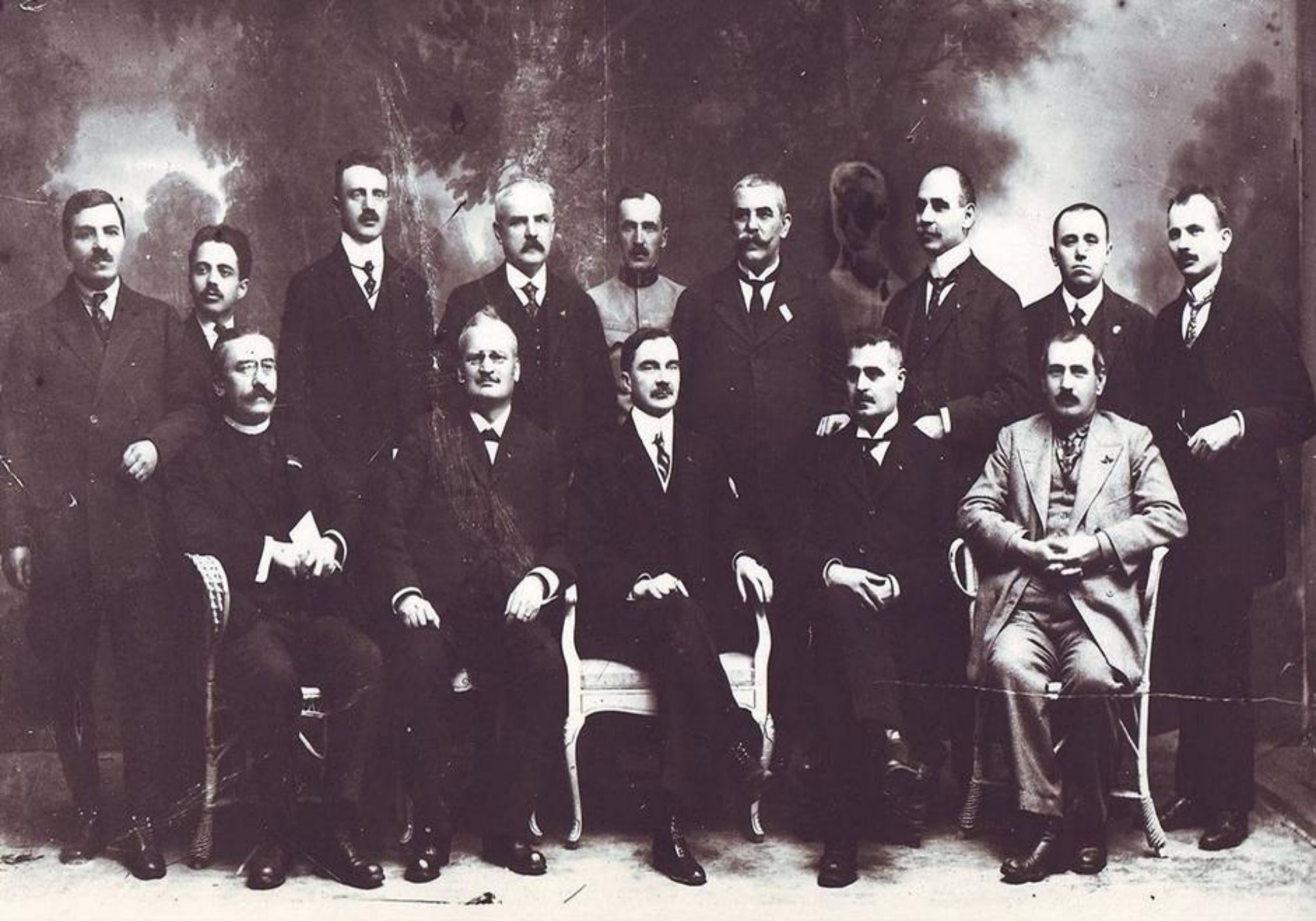
Membrii Consiliului Național Român Central (1918)