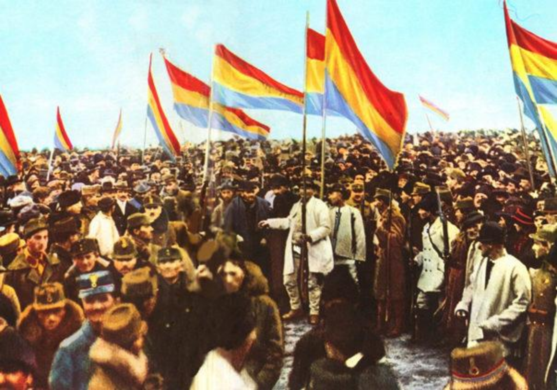
Marea Adunare Națională de la Alba Iulia (1918)