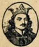
ȘTEFAN CEL MARE