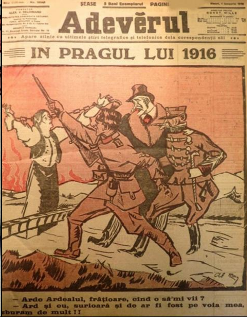
Caricaturi din perioada neutralităţii. În stânga: România este invitată să intre în război de partea Antantei sau Puterilor Centrale. În dreapta: Transilvania imploră România să o elibereze de sub dominaţia austro-ungară