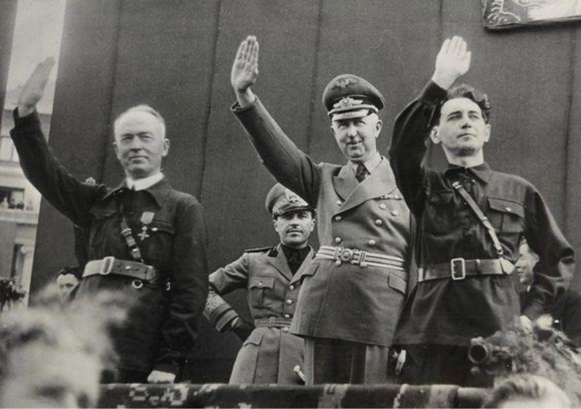
Proclamarea statului național-legionar (București, 14 septembrie 1940)