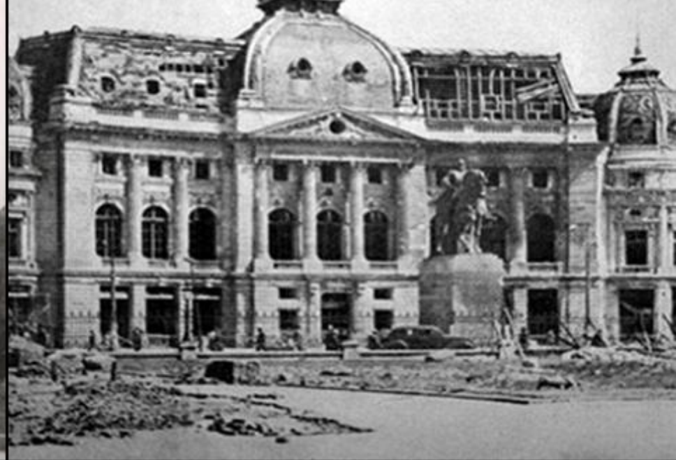
Bucureștiul devastat după bombardamentele Aliților (4 aprilie 1944)