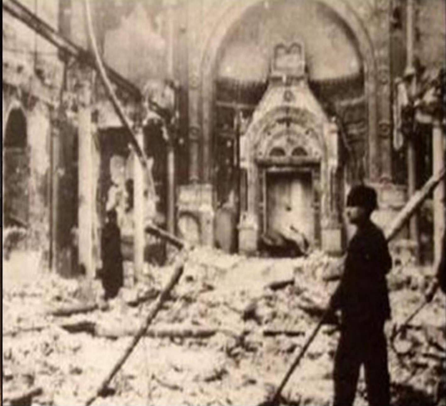
Sinagogă din București distrusă de legionari în timpul rebeliunii (23 ianuarie 1941)