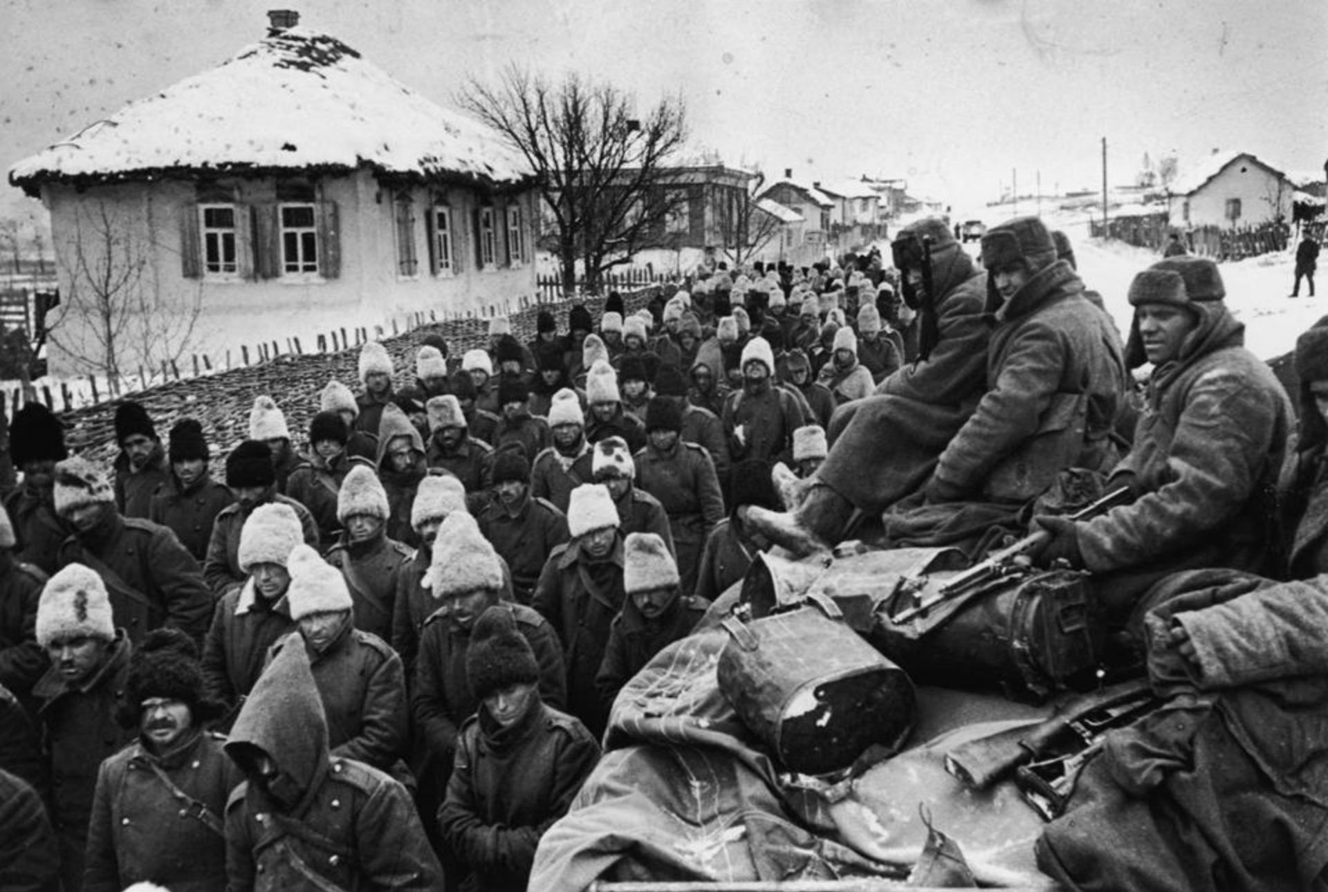
Prizonieri români escortați de forțele sovietice, după încheierea bătăliei pentru Stalingrad (U.R.S.S., februarie 1943)