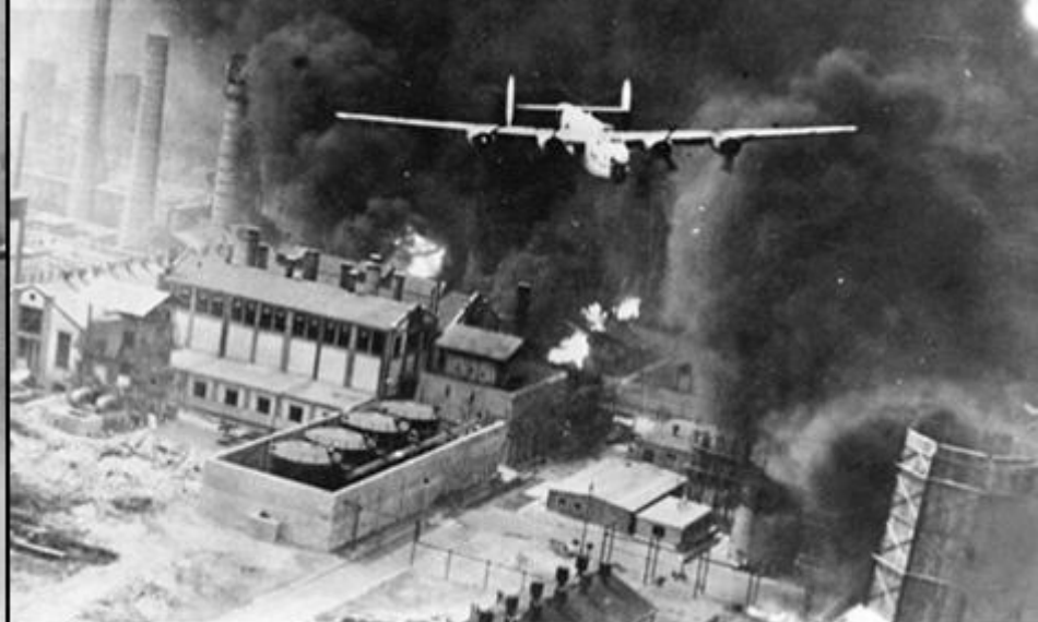
Bombardamentul unei rafinării din Ploiești

Operațiunea Tidal Wave : bombardiere americane B-24 Liberator deasupra rafinăriilor de la Ploiești (1 august 1943)