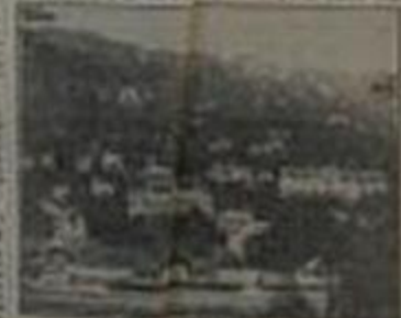
1938 ANUL 12711 - 1938

IMPRESIA DEZIȘOR ÎN CAPITALĂ După ce în ziua de ieri s-a comunicat că asasinul este un membru al „Gărzii de fier”, s-a spus că acesta este un tânăr de 25 de ani, care a fost arestat în ziua de ieri în apropierea casei sale din București. El este un membru al „Gărzii de fier” și a fost arestat în ziua de ieri în apropierea casei sale din București.