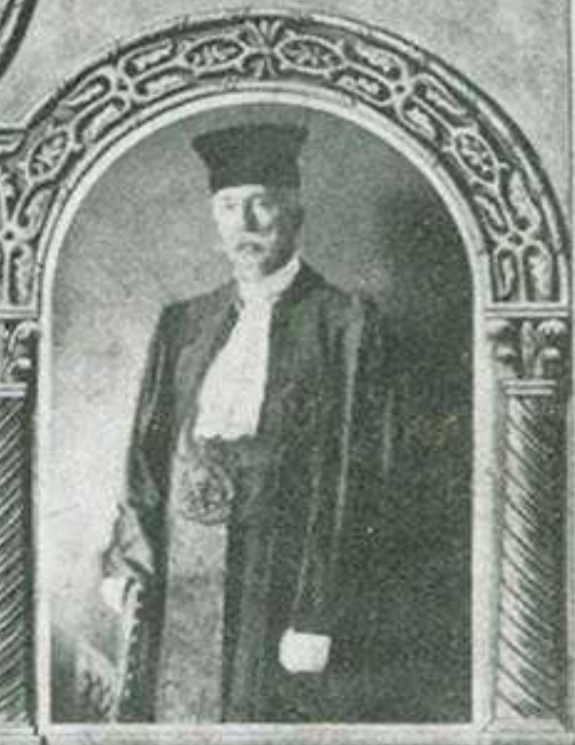
1895-1918 MIHAIL I REGELE ROMANIEI