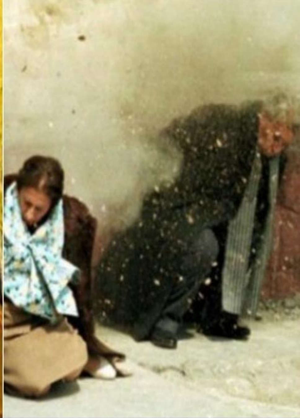
Procesul soților Ceaușescu și execuția acestora (25 decembrie 1989)