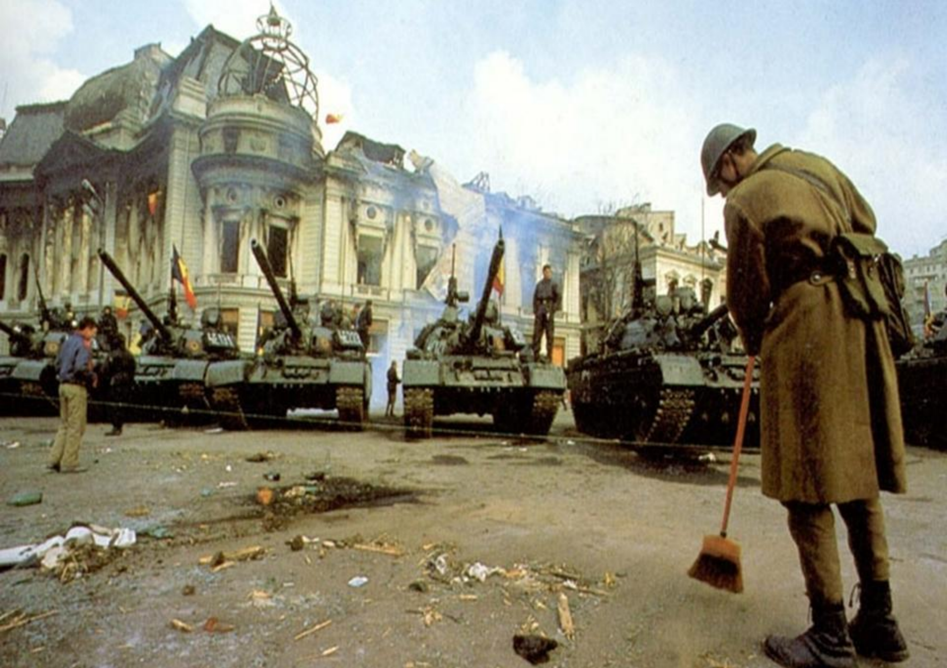
Forțele armate trec de partea revoluționarilor din București (22 decembrie 1989)