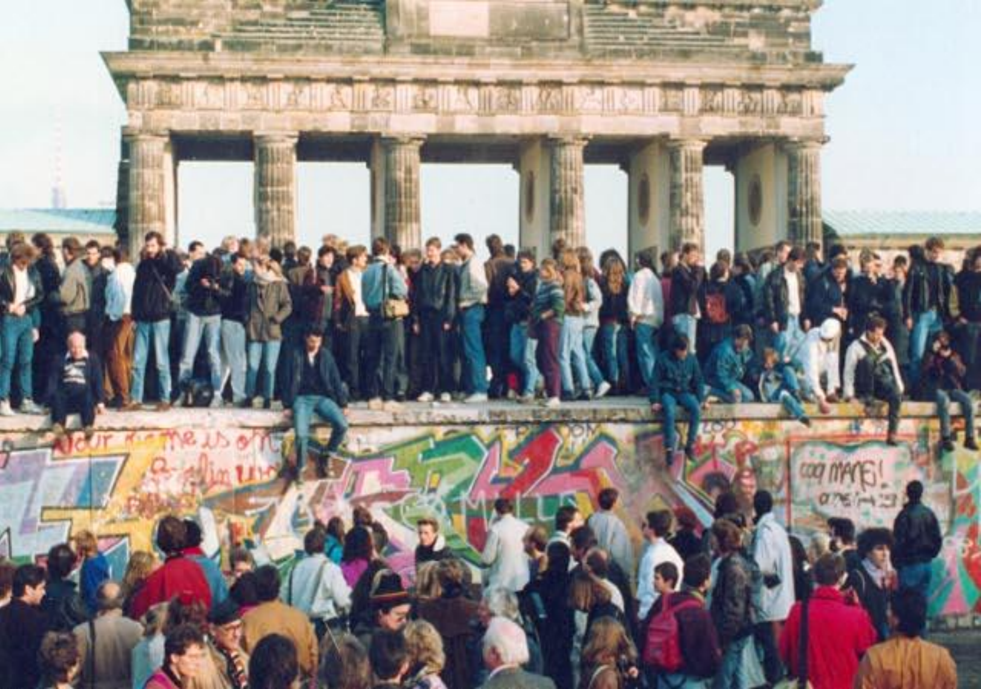
Căderea Zidului Berlinului, simbolul Războiului Rece (Germania, 1989)