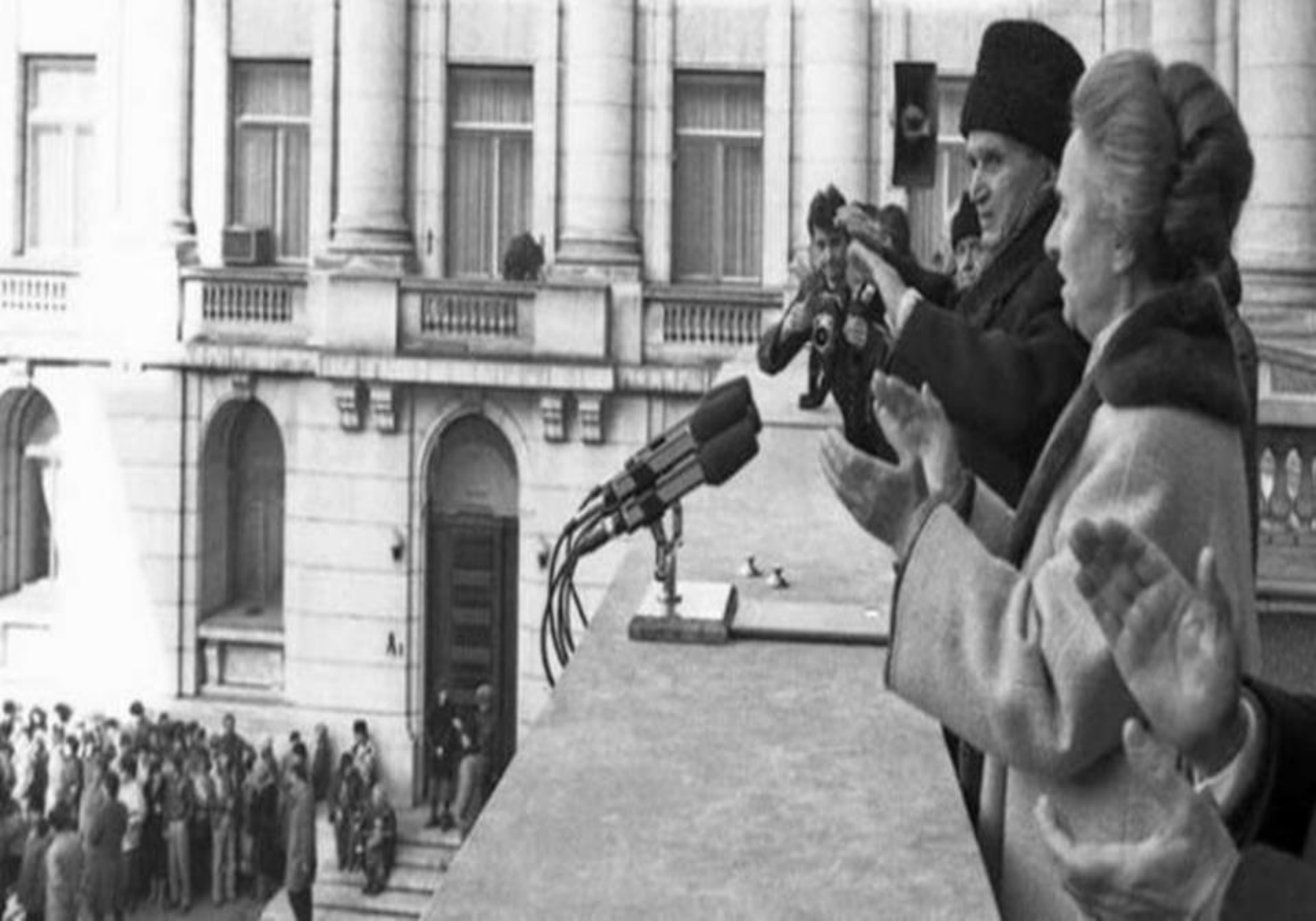
Nicolae Ceaușescu, ultimul discurs (București, 21 decembrie 1989)