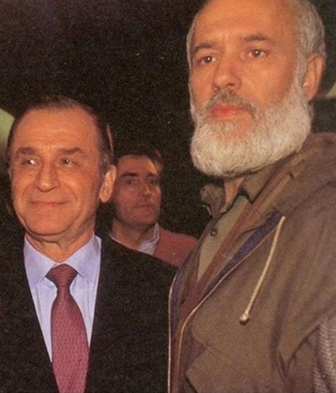
Ion Iliescu și Gelu Voican Voiculescu