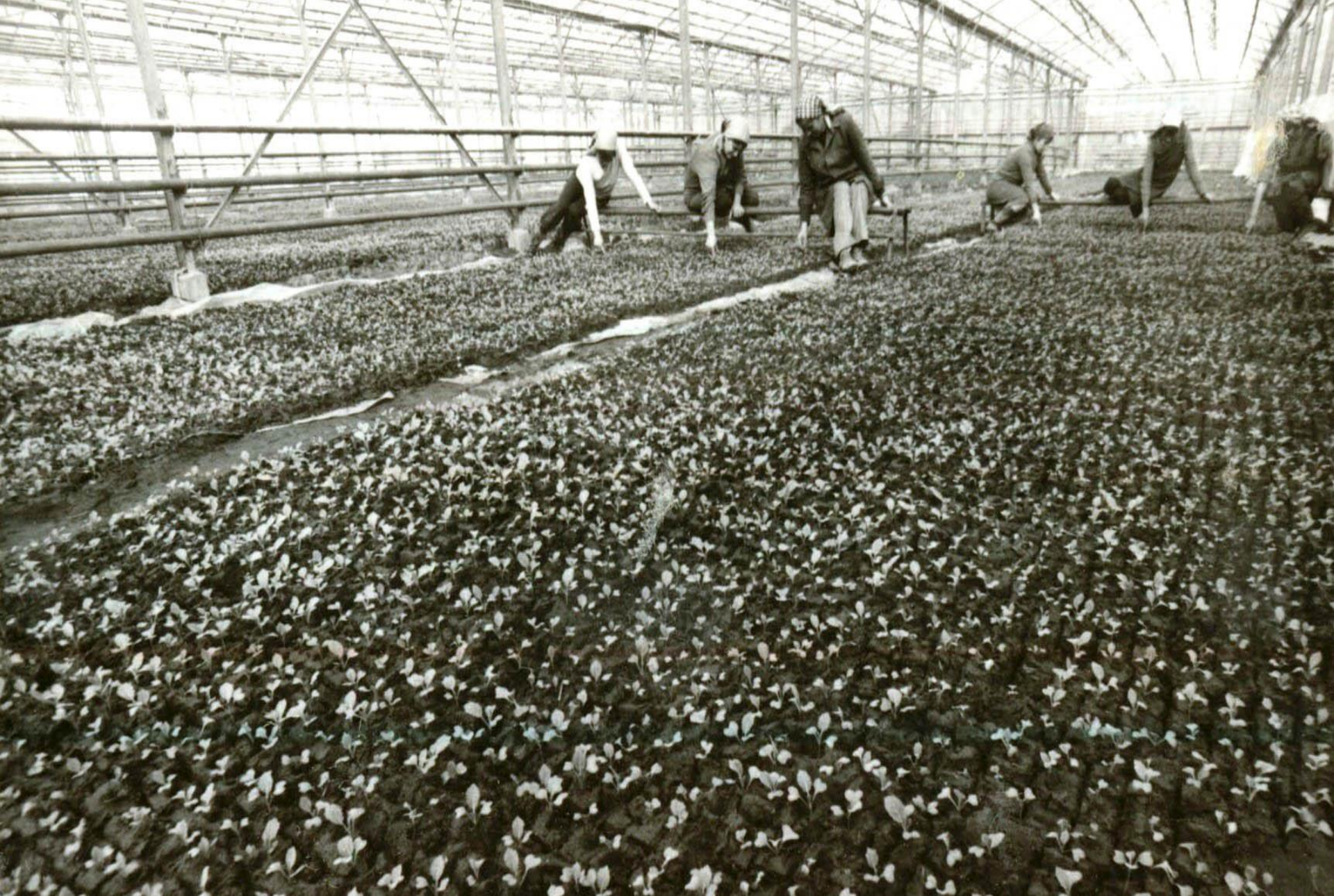
Muncă patriotică: muncitori din sectorul agricol strâng recolta dintr-o seră duminica (anii 1980)