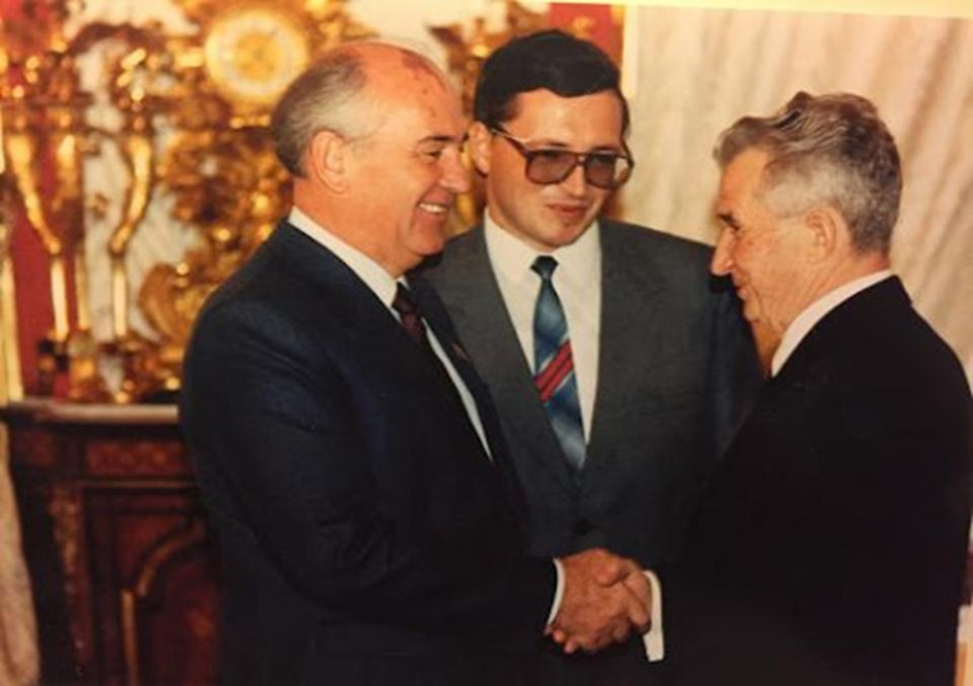
Ultima întâlnire dintre Mihail Gorbaciov și Nicolae Ceaușescu (U.R.S.S., 1989)