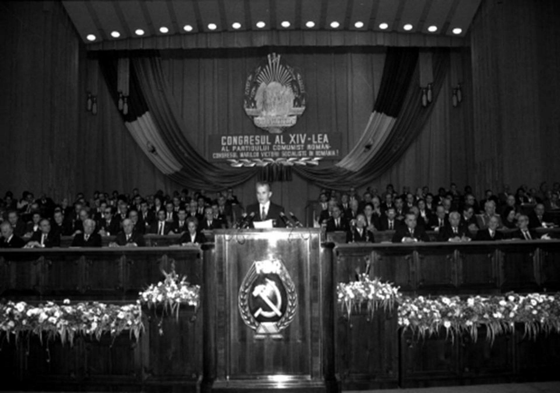
Nicolae Ceaușescu la Congresul al XIV-lea al P.C.R. (20 noiembrie 1989)