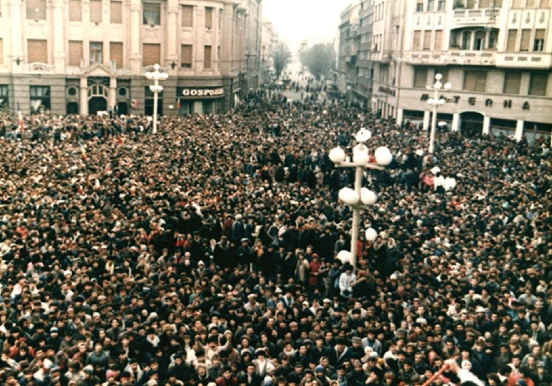
Începutul revoluției la Timișoara (16 decembrie 1989)