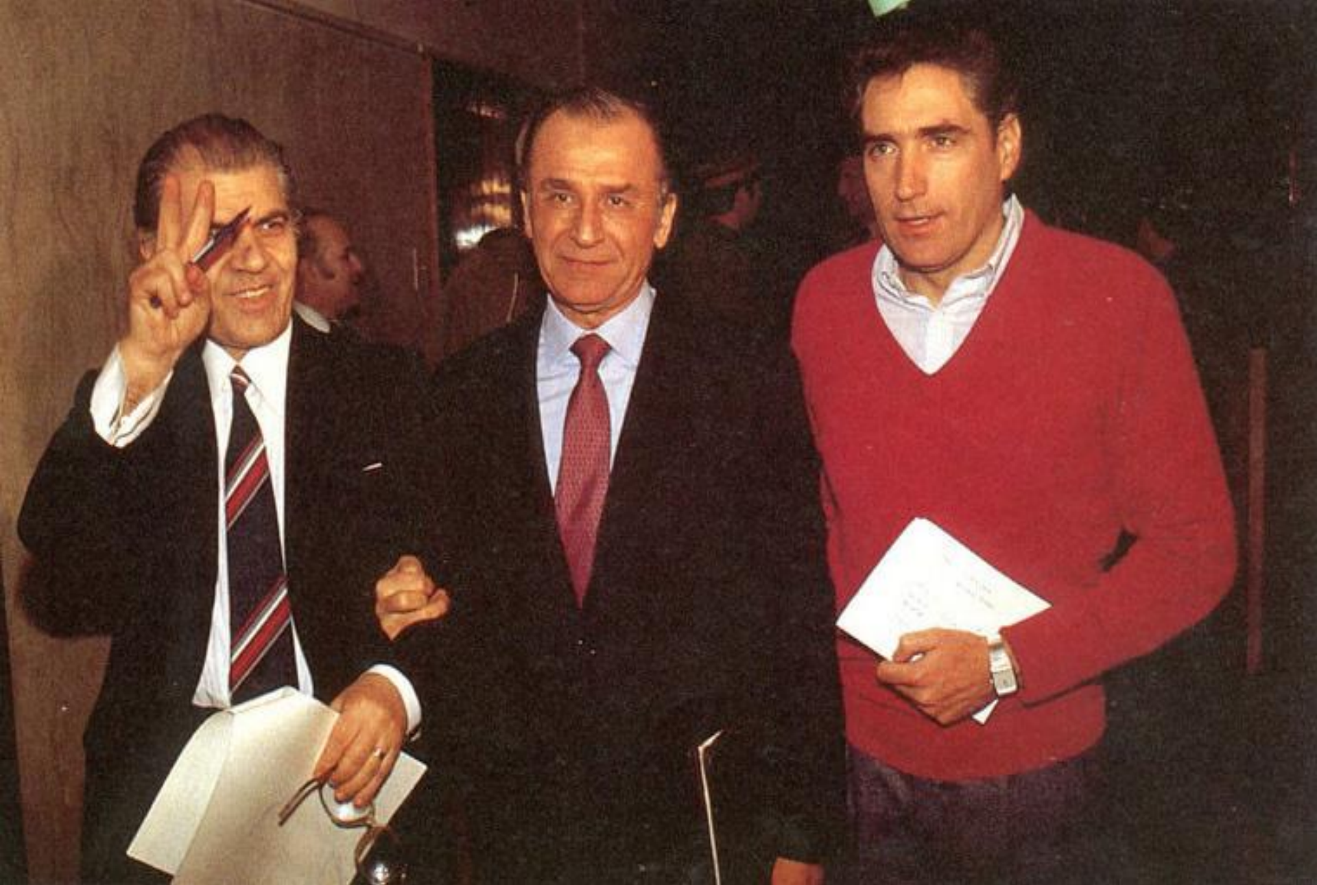
Liderii Consiliului Frontului Salvării Naționale (de la stânga la dreapta): Dumitru Mazilu, Ion Iliescu și Petre Roman (23 decembrie 1989)