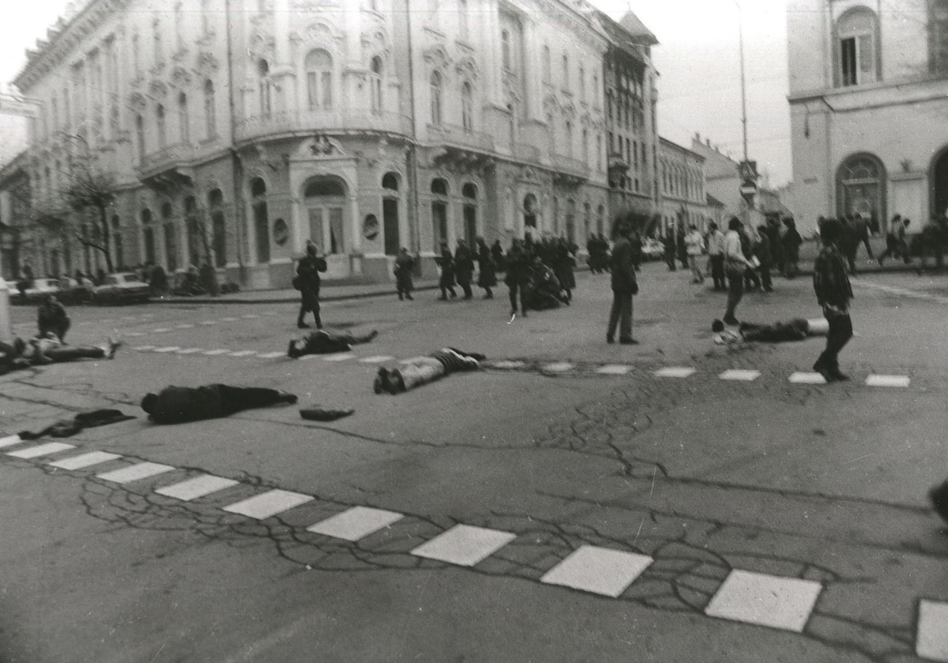
Victimele Revoluției din Cluj-Napoca (22 decembrie 1989)