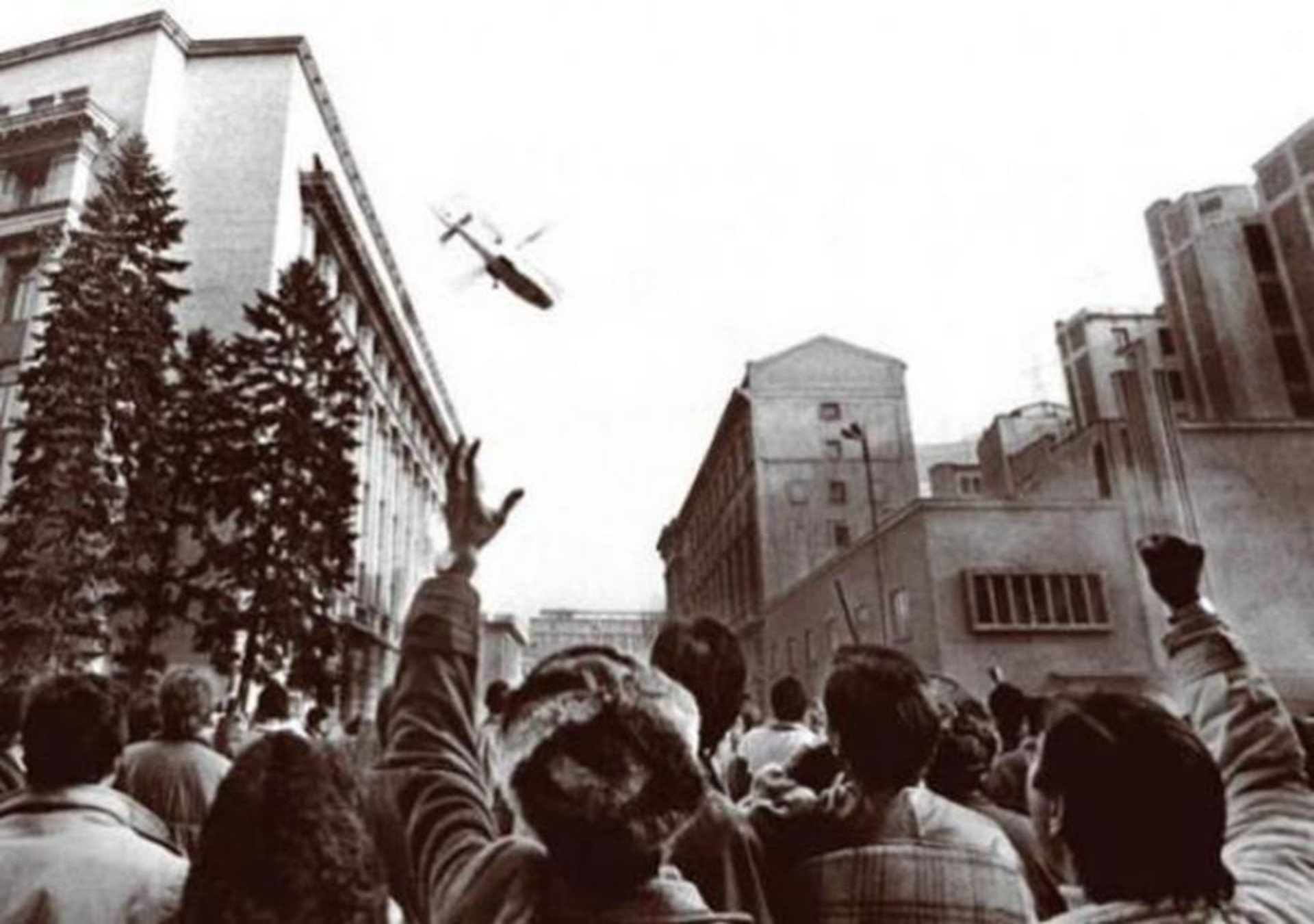
Fuga cuplului Ceaușescu cu elicopterul din București (22 decembrie 1989)