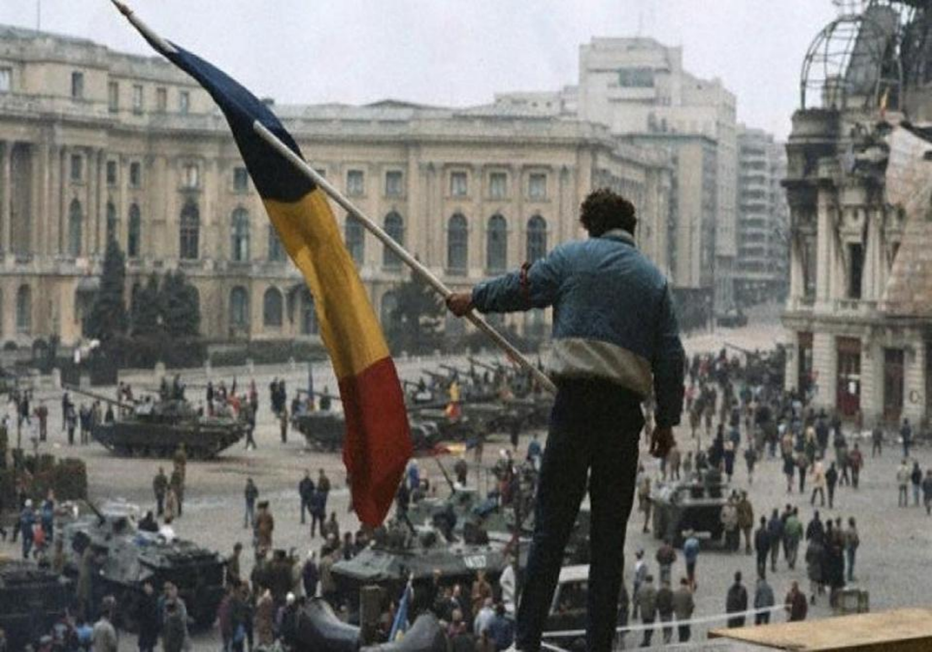
Sfârșitul revoluției din București (25 decembrie 1989)