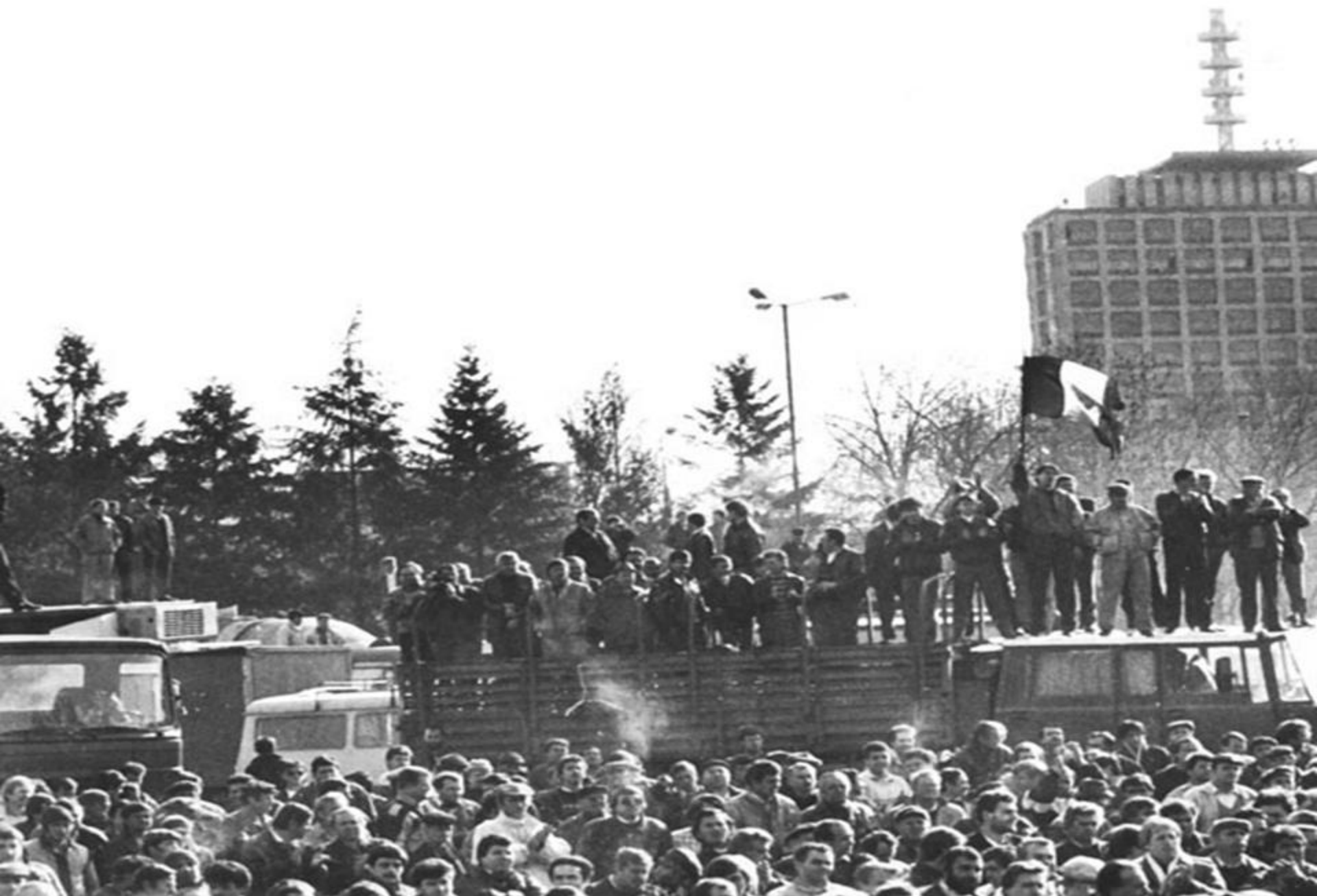
Revoluționari bucureșteni apără sediul Televiziunii Române (22 decembrie 1989)