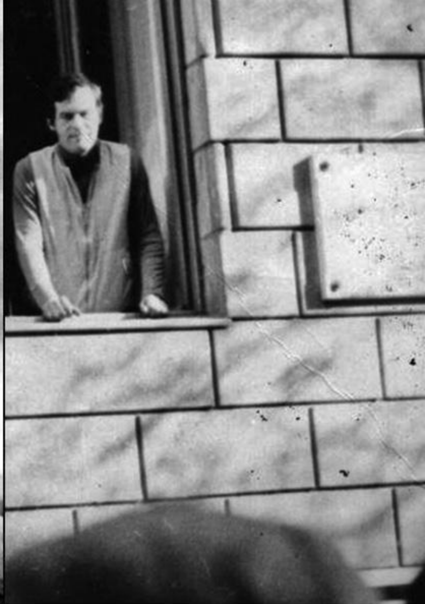
Laszlo Tokes la fereastra locuinței sale din Timișoara (16 decembrie 1989)