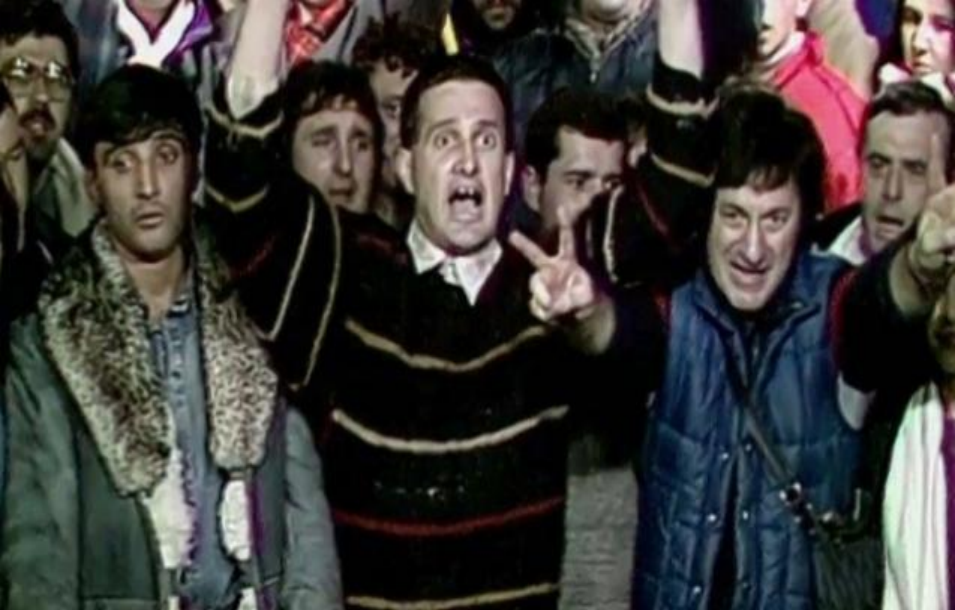
Mircea Dinescu (mijloc) și Ion Caramitru (dreapta), în mijlocul mai multor revoluționari, s-au adresat telespectatorilor, anunțând fuga dictatorului (22 decembrie 1989)