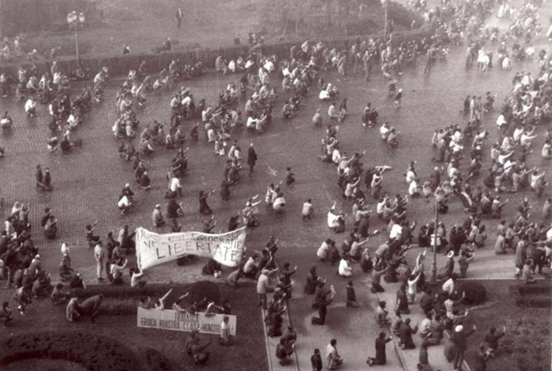
Revoluționarii din București protestează pașnic în fața armatei (21 decembrie 1989)