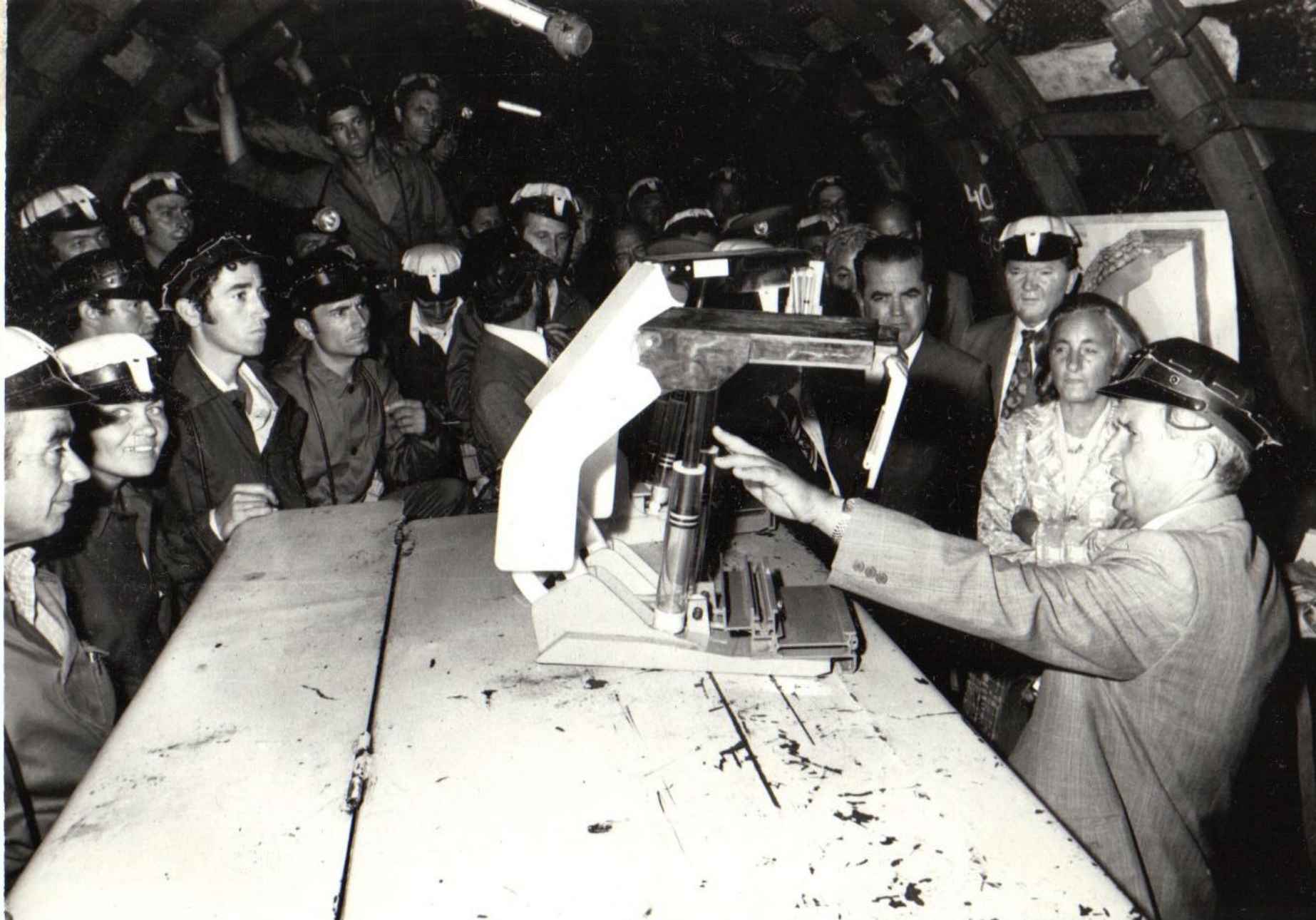
Ceaușescu, mereu prezent cu „ indicățiile ” sale date „ oamenilor muncii ” (anii 1980)