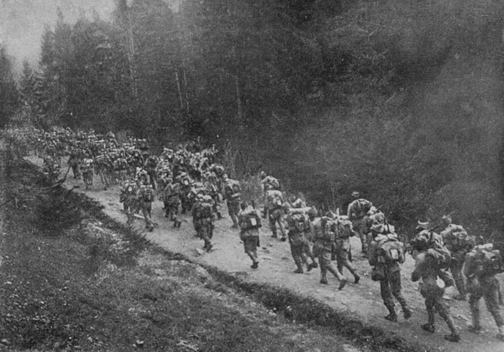
Trupele române trec Munții Carpați în Transilvania (august 1916)