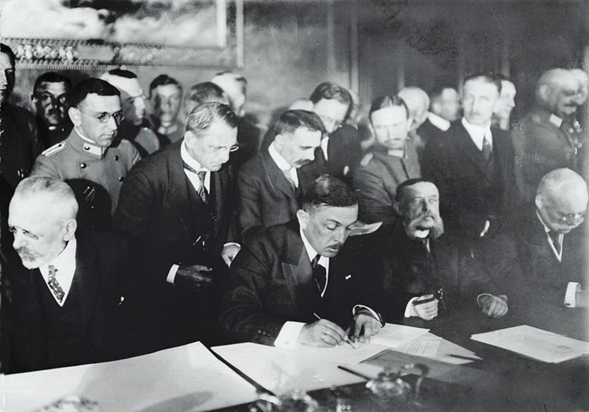
Conferința de Pace de la Paris (Franța, 1919-1920)