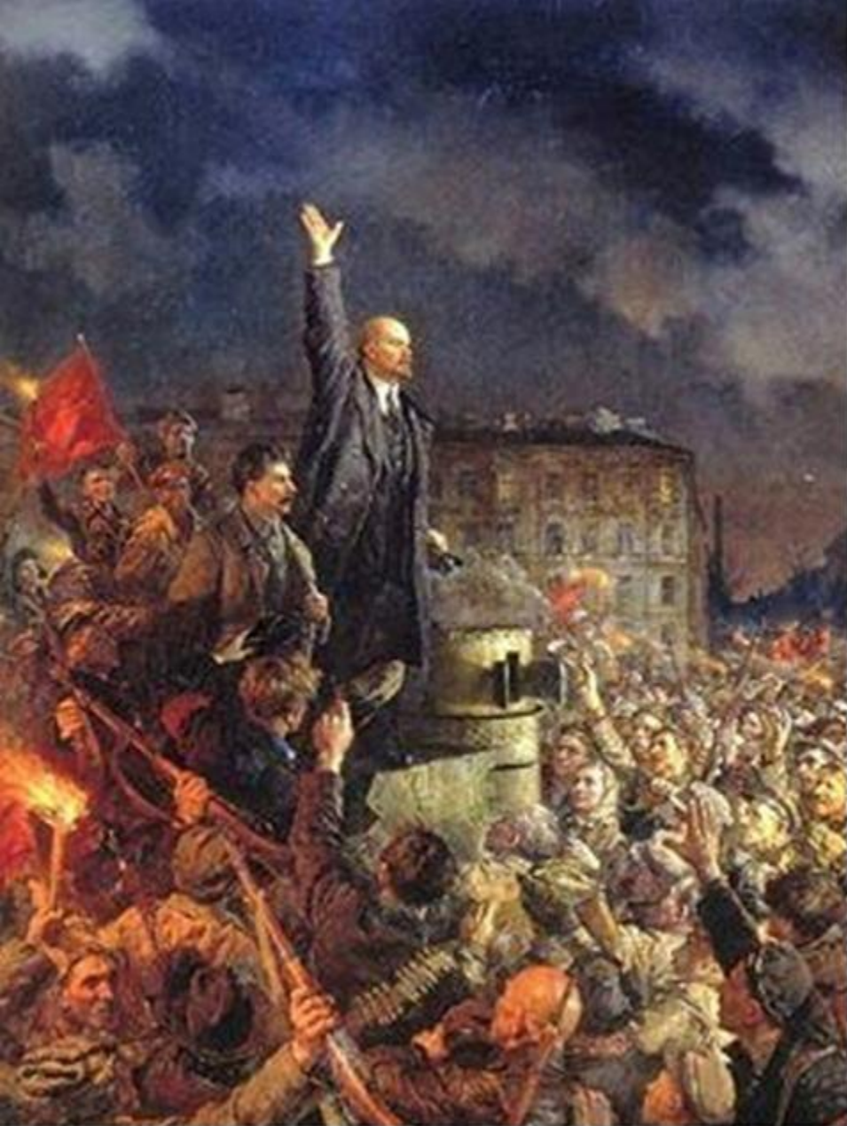
Revoluția rusă (bolșevică) din octombrie/noiembrie 1917 (Federația Rusă)