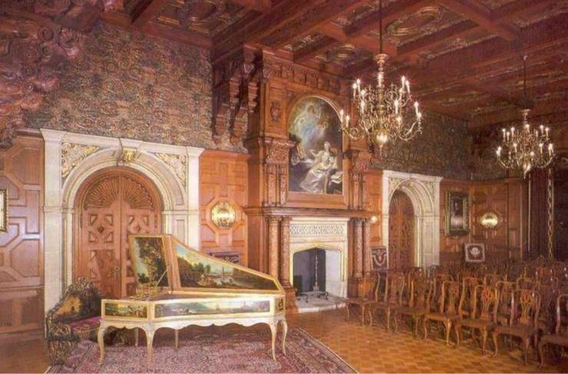
Palatul Peleş: sala în care a avut loc Consiliul de Coroană, în cadrul căruia s-a decis neutralitatea României (Sinaia, 3 august 1914)