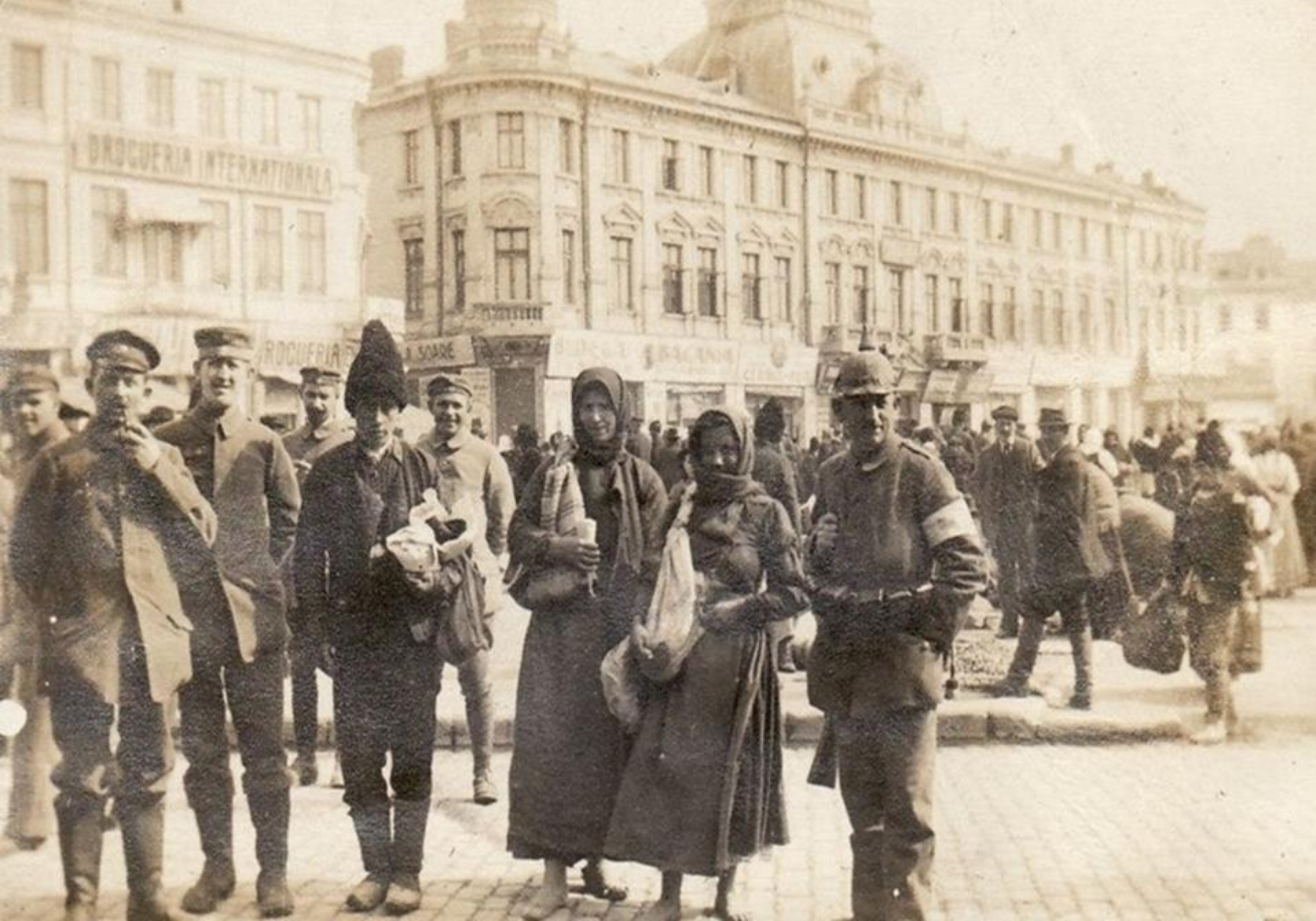
Bucureștiul în perioada ocupației Puterilor Centrale (1916-1918)