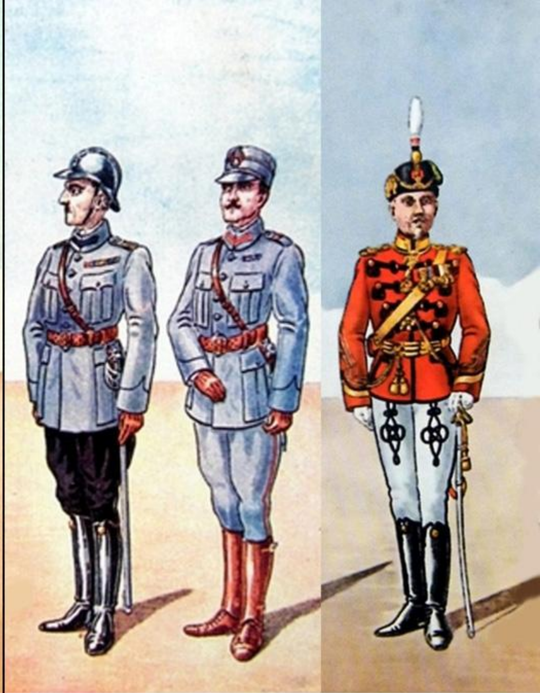
Uniforme ofițeri români