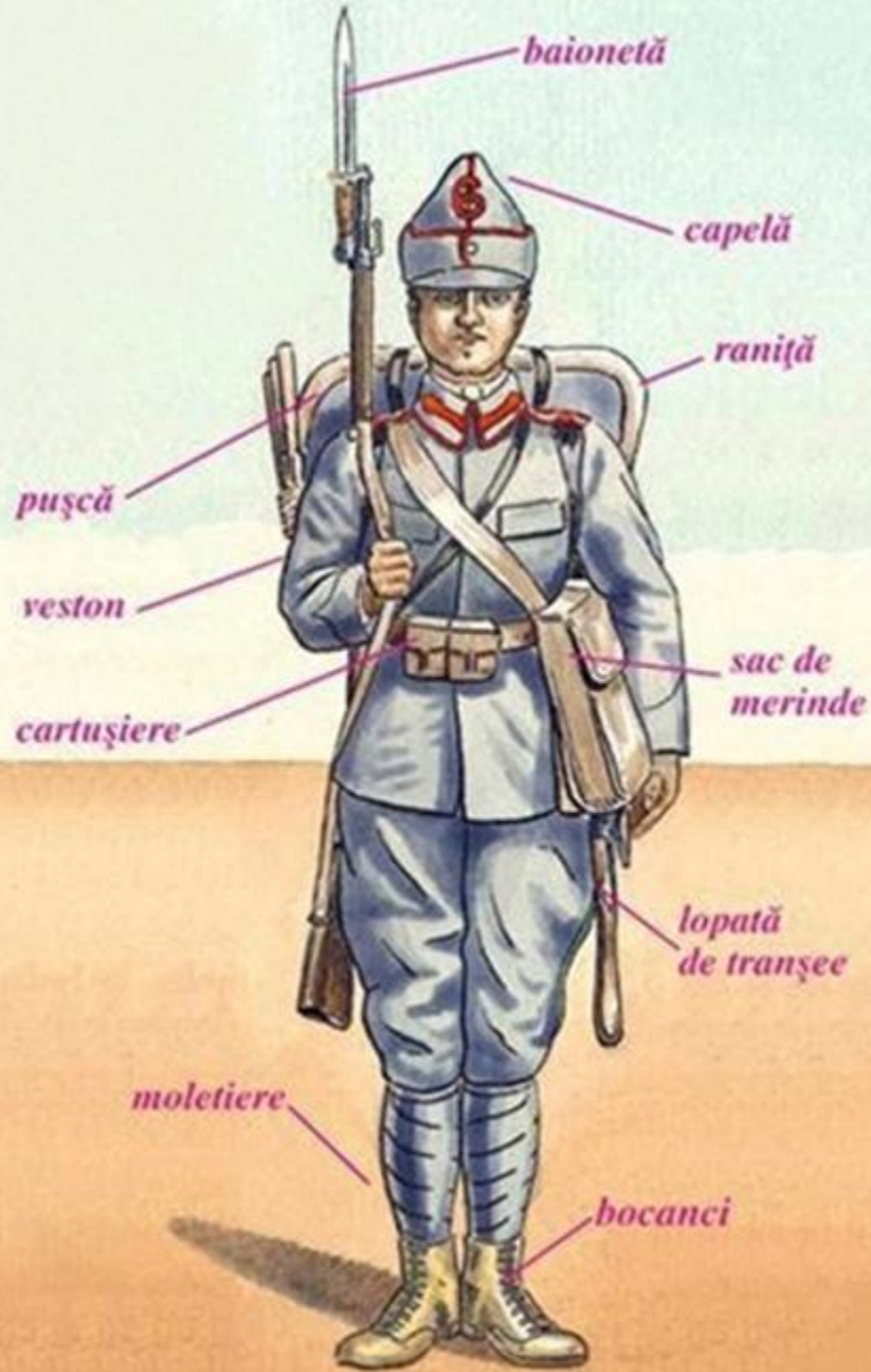
Uniformă soldat român