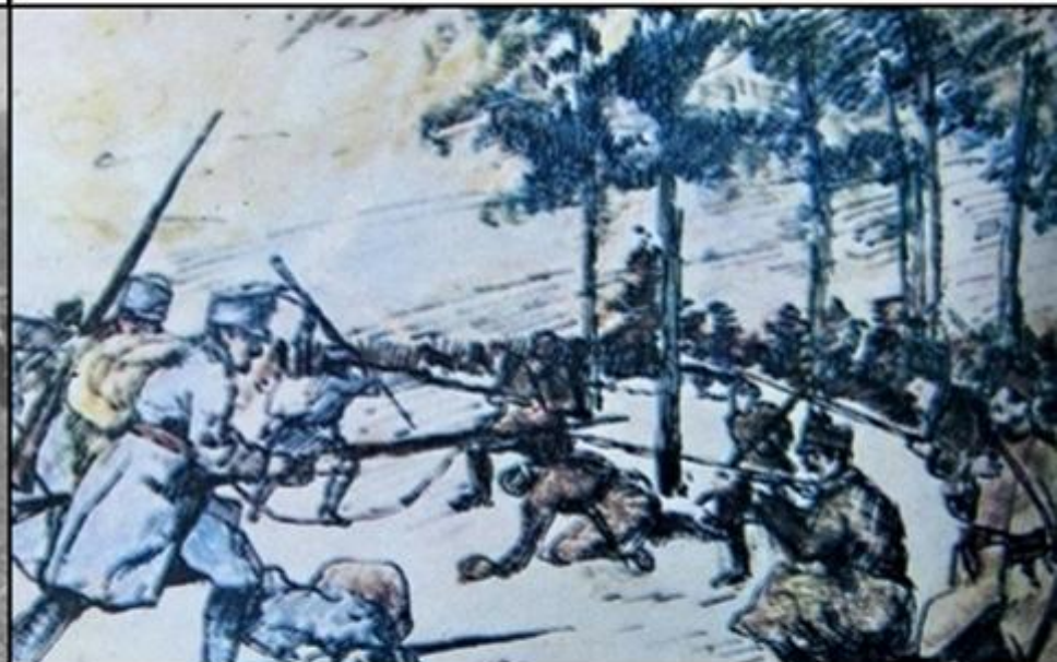
Bătălia de la Oituz (26 iulie/8 august-9/22 august 1917)