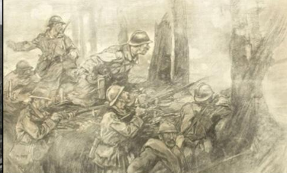
Bătălia de la Mărășești (24 iulie/6 august-6/19 august 1917)