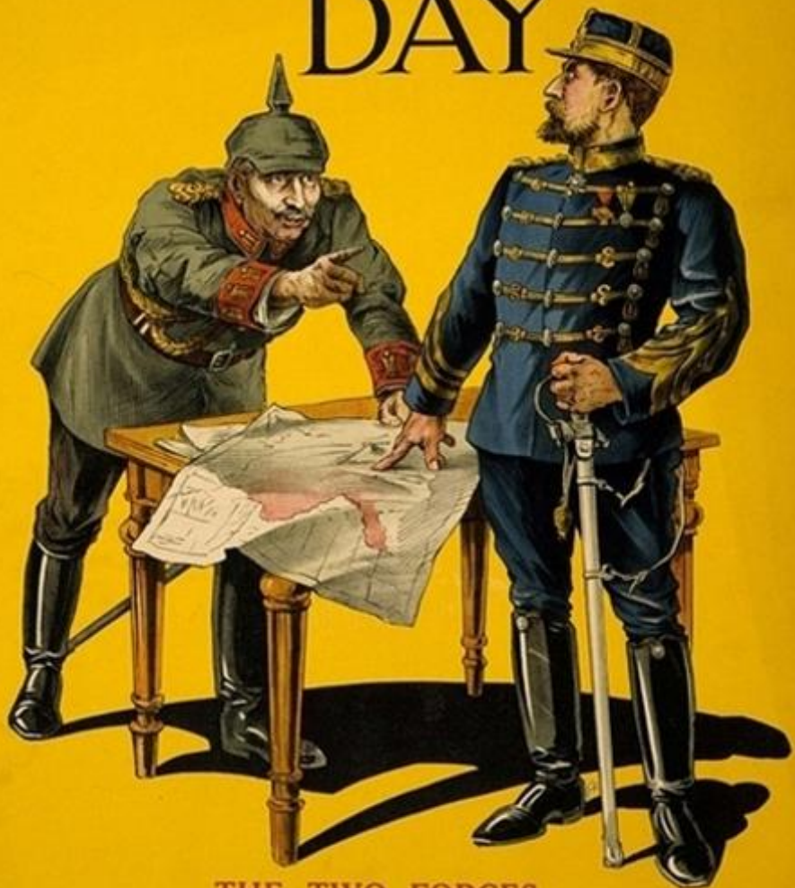
THE TWO FORCES

KAISER: "So you, too, are against me! Remember, Hindenburg fights on my side" KING OF ROUMANIA: "Yes, but freedom and justice fight on mine"