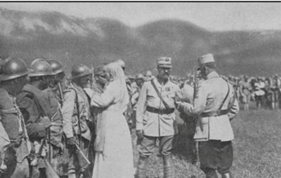
Decorarea trupelor după bătălia de la Mărășești (august 1917)