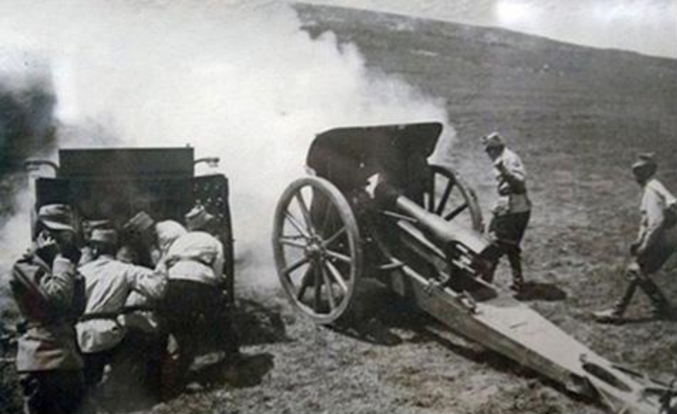
Bătălia de la Mărăști (11/24 iulie-19 iulie/1 august 1917)