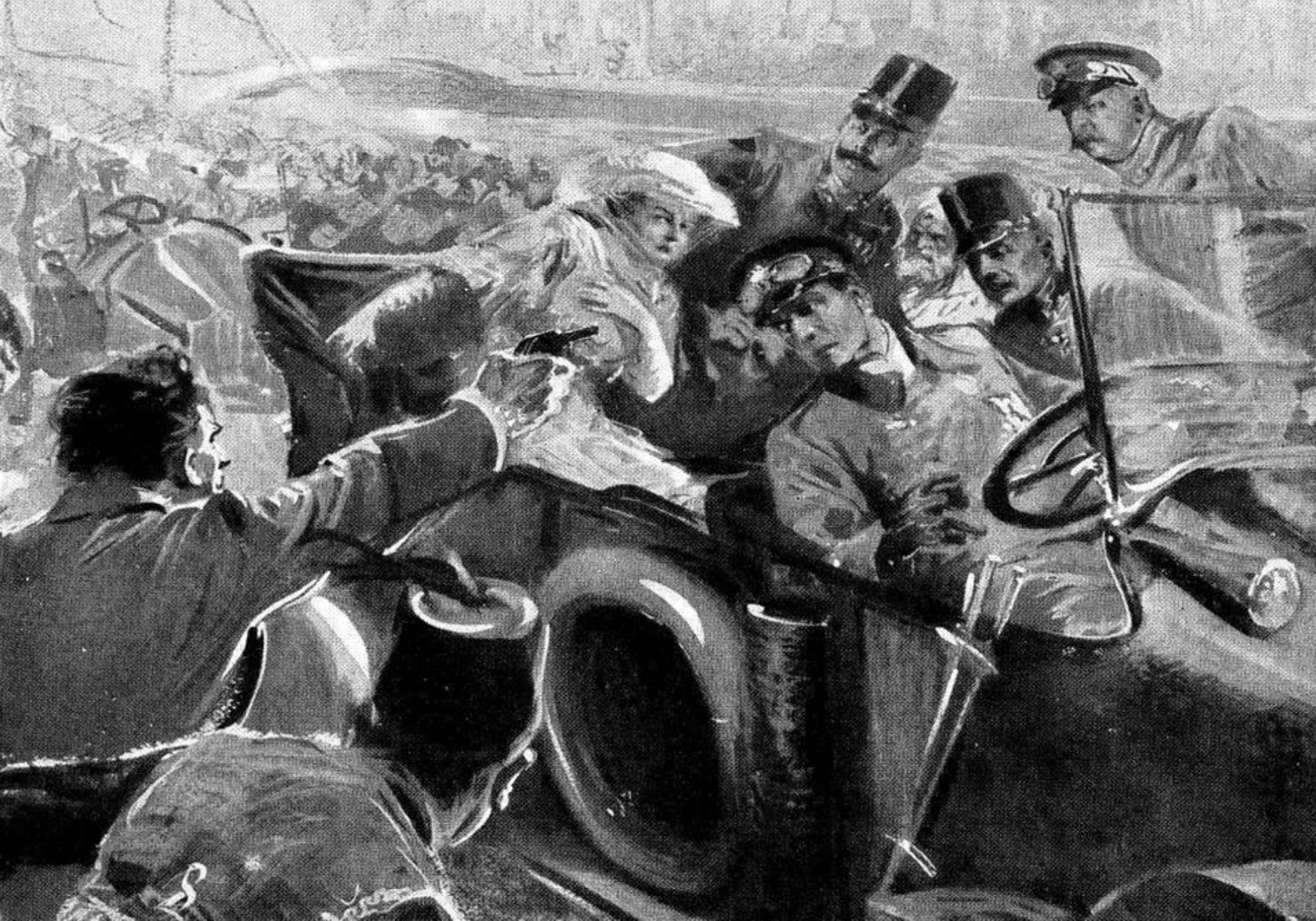
Atentatul de la Sarajevo (Bosnia-Herțegovina, 28 iunie 1914)