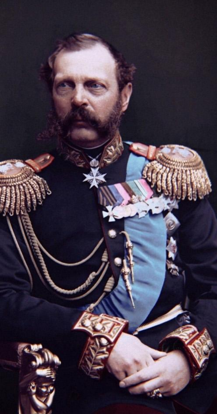
Alexandru al II-lea