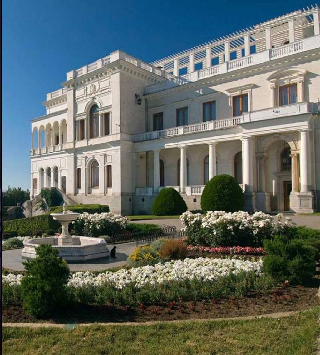
Palatul din Livadia (Federația Rusă, 2024)