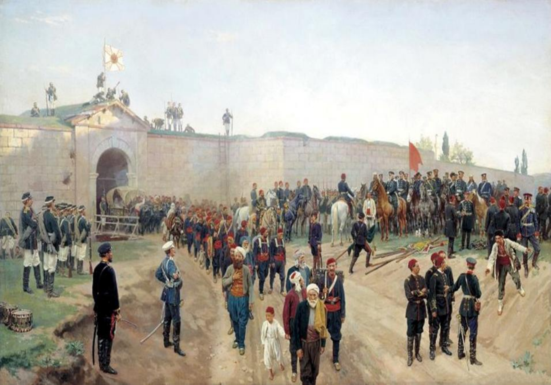
Capitularea forțelor otomane la Nicopole (Bulgaria, 1878)