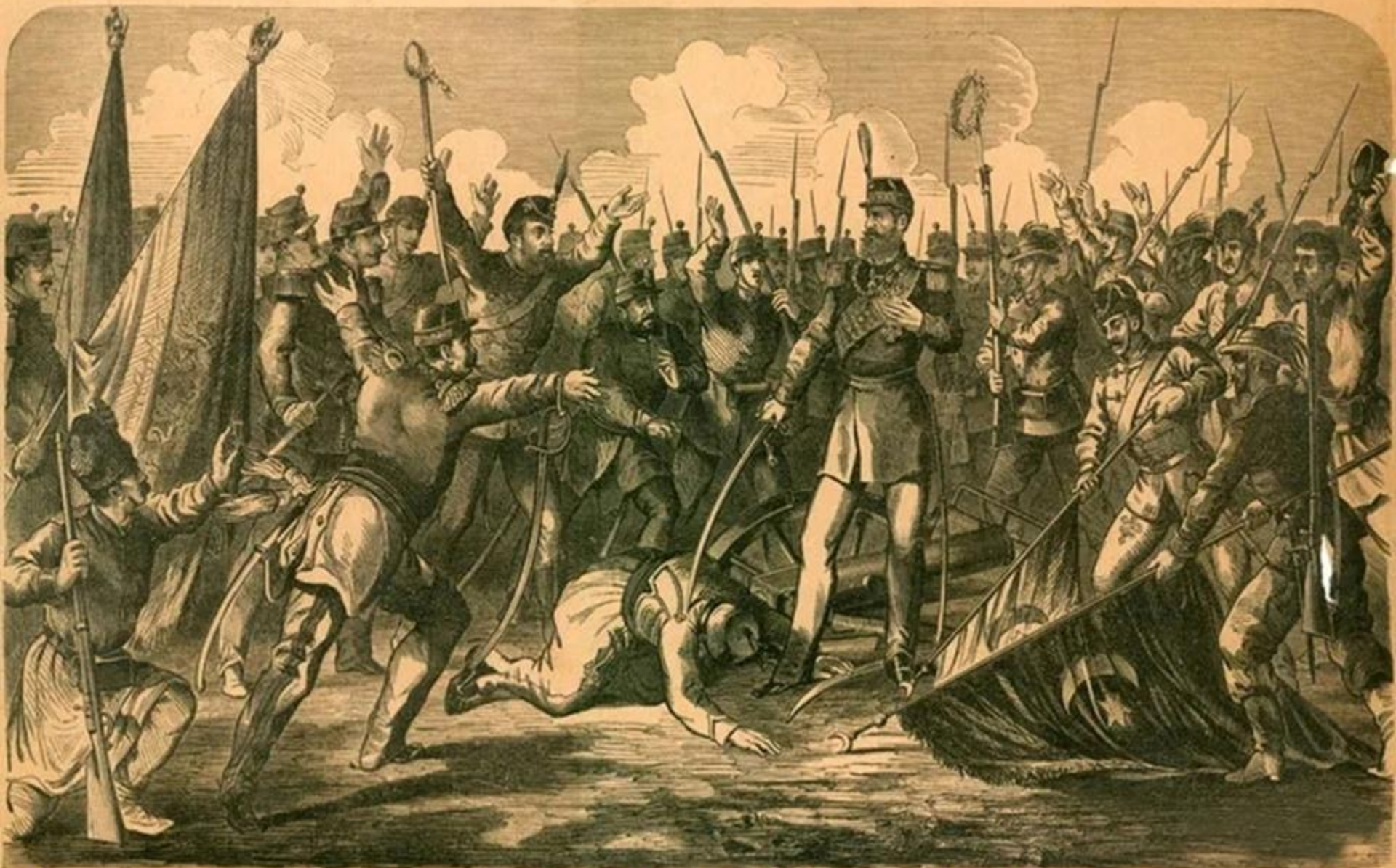
Capitularea trupelor otomane și sfârșitul conflictului pentru forțele românești conduse de Carol I