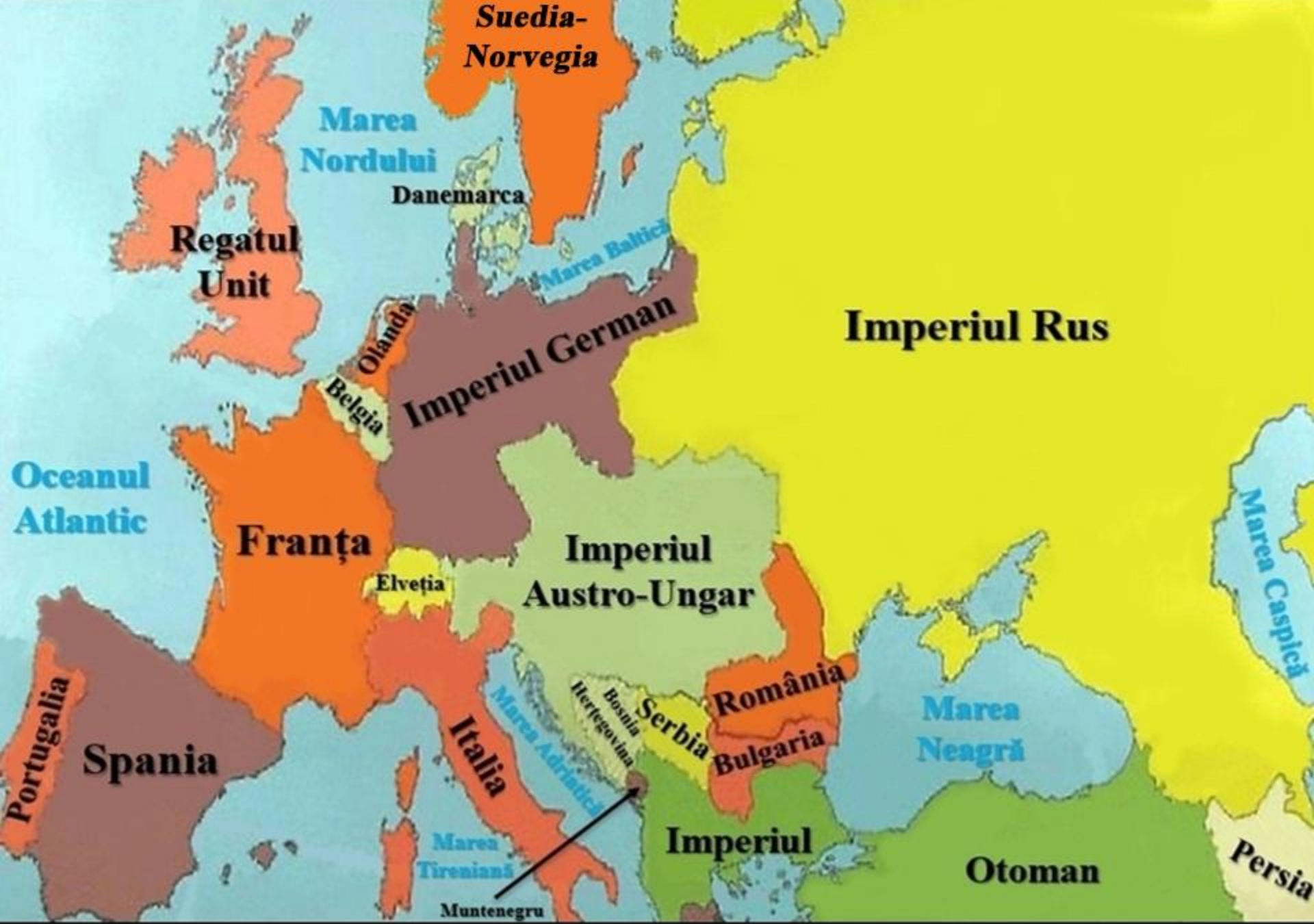
Europa după Congresul de pace de la Berlin (iunie-iulie 1878)