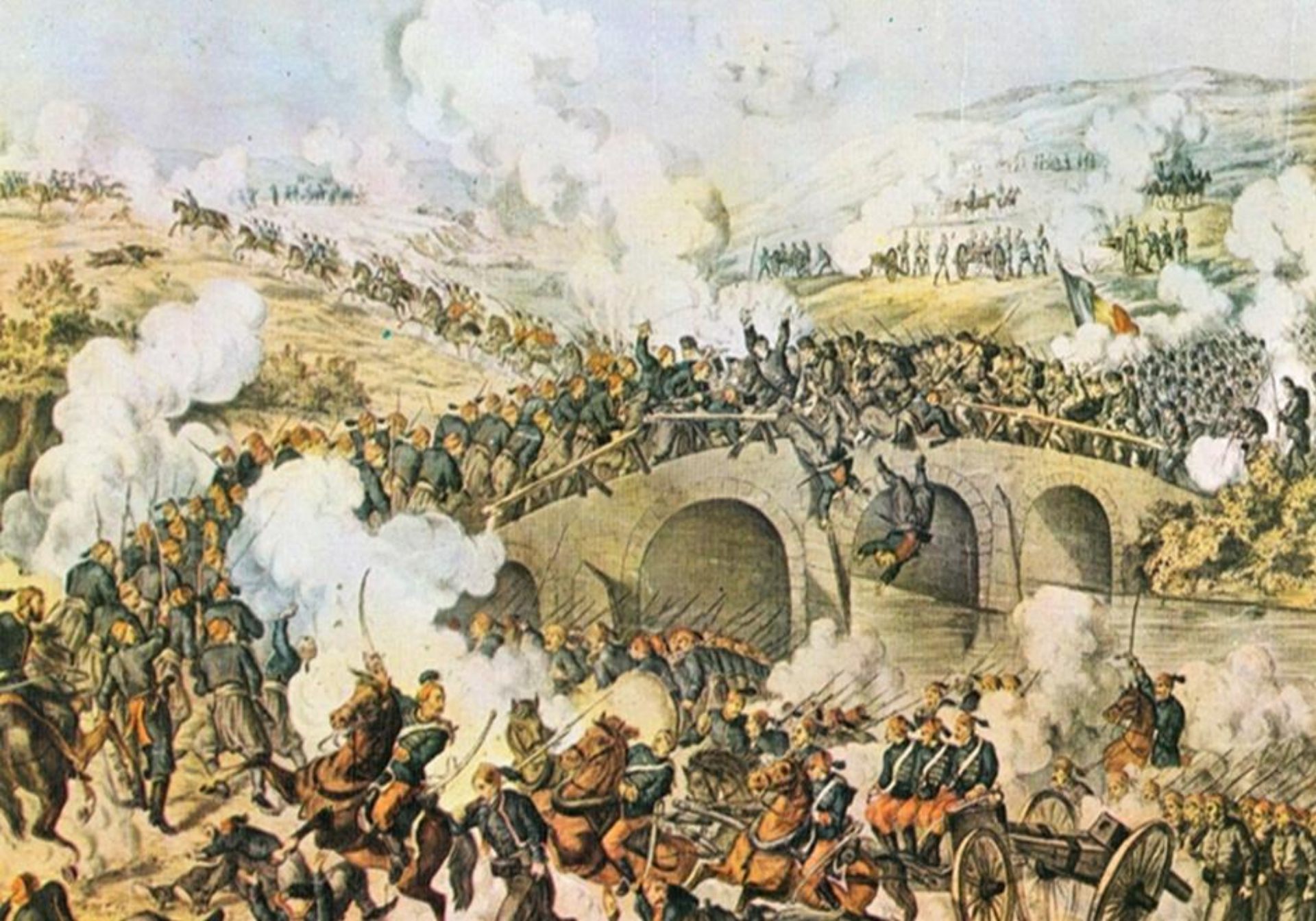
Bătălia pentru Rahova (Bulgaria, noiembrie 1877)