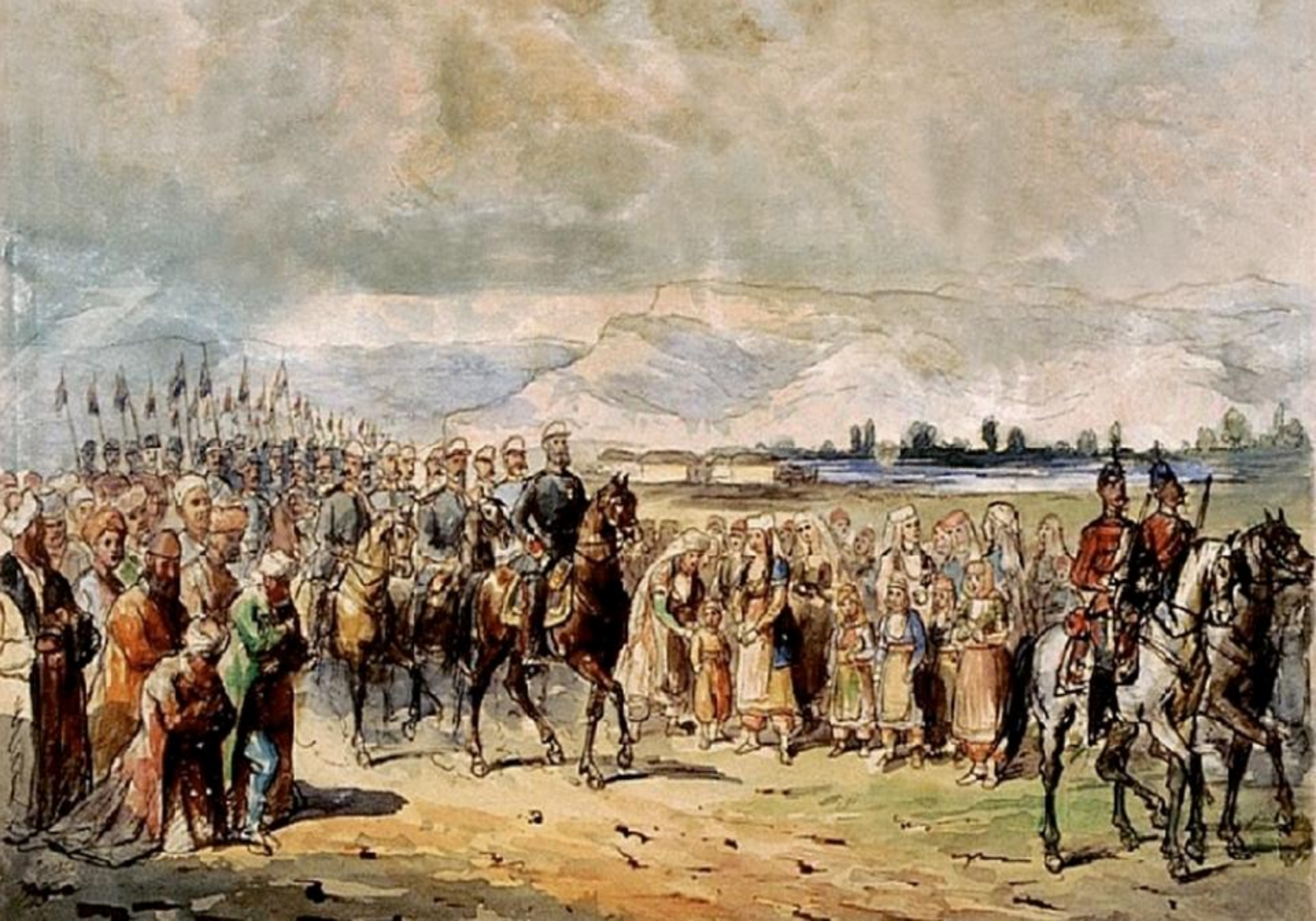
Primirea lui Carol I în Bulgaria (1877)