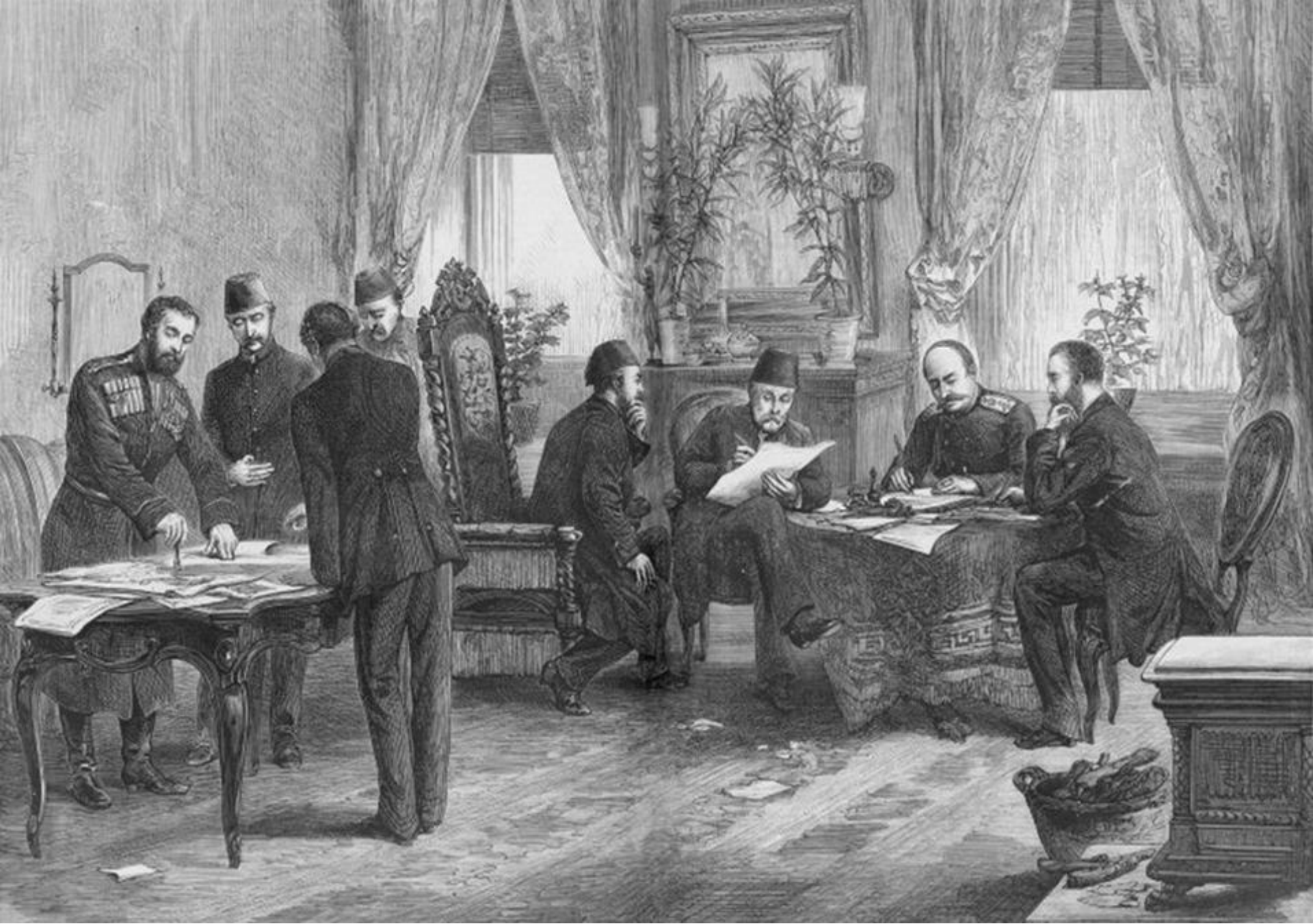
Semnarea Tratatului de pace de la San Stefano (Bulgaria, februarie 1878)