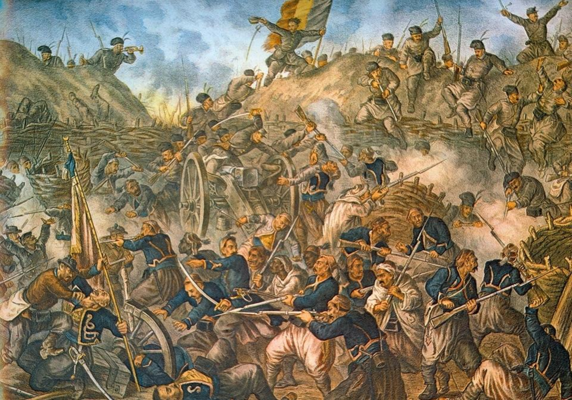
Bătălia pentru Plevna (Bulgaria, noiembrie 1877)