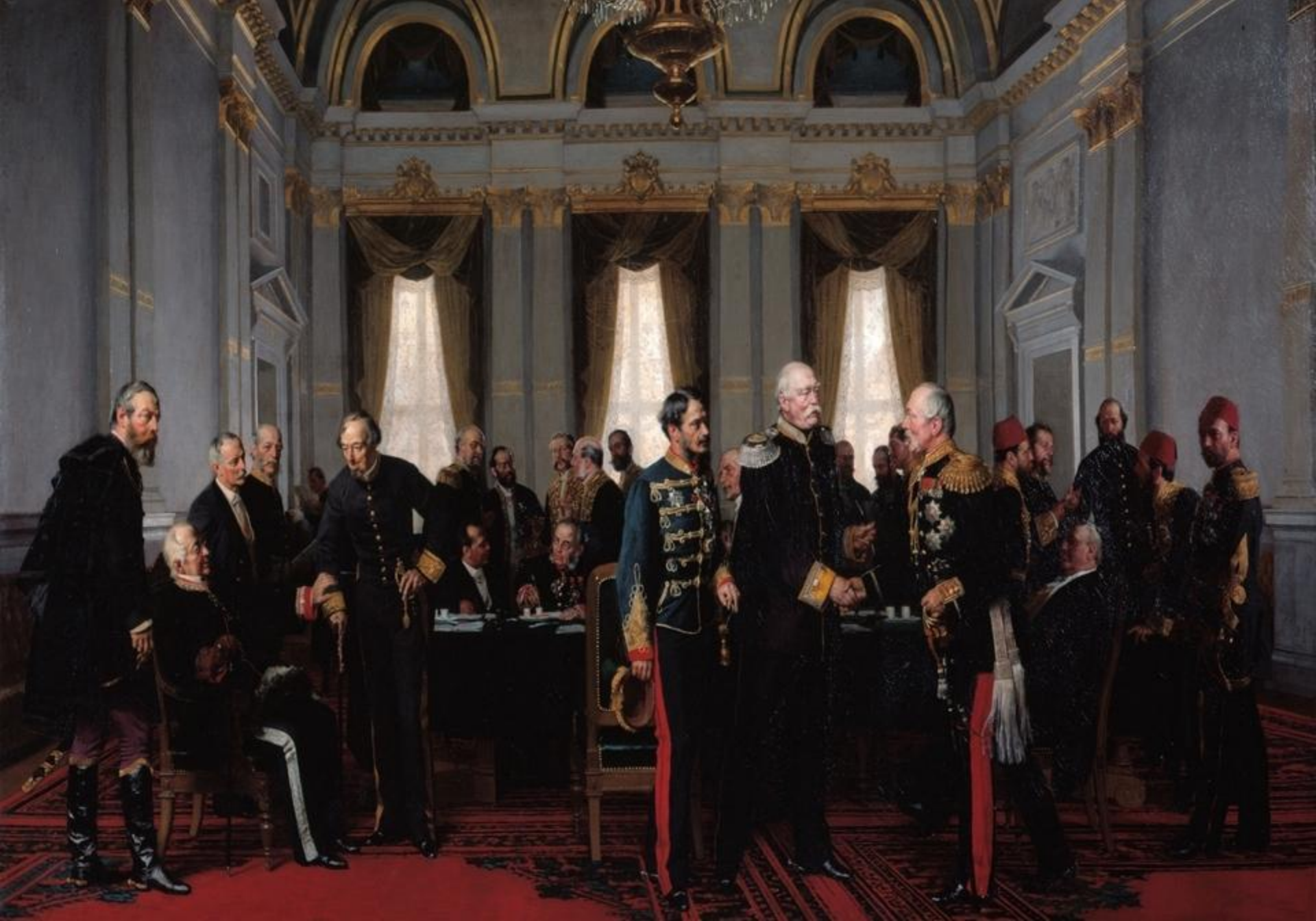
Congresul de Pace de la Berlin (iunie-iulie 1878 )