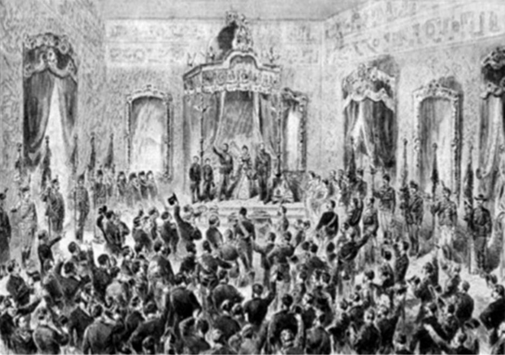
Ceremonia de încoronare a regelui Carol I (București, 10-14 mai 1881)