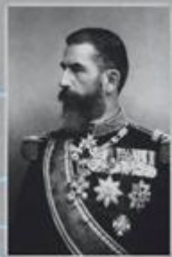
Carol I 1866-1914