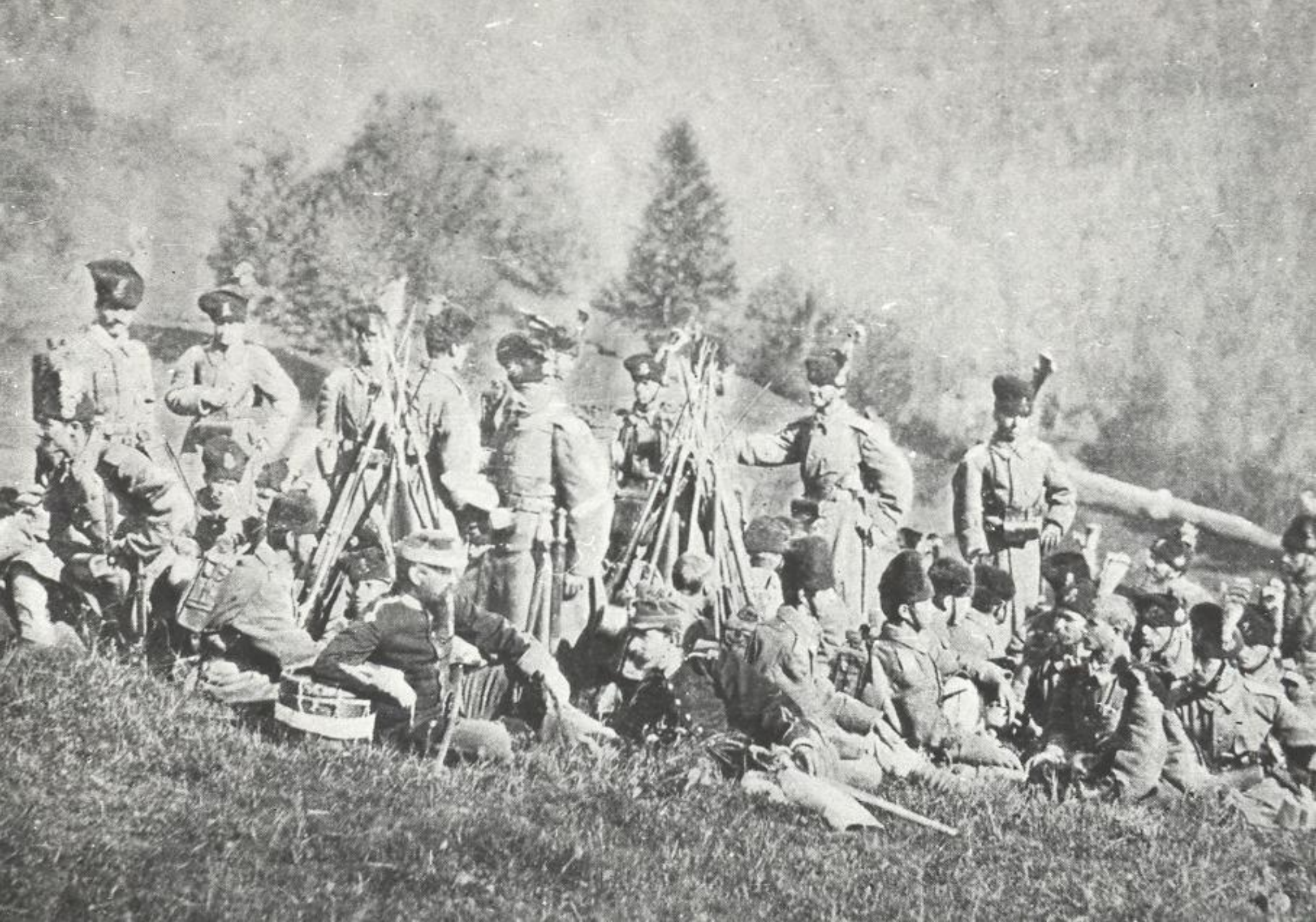
Soldați români participanți la războiul ruso-turc din 1877-1878