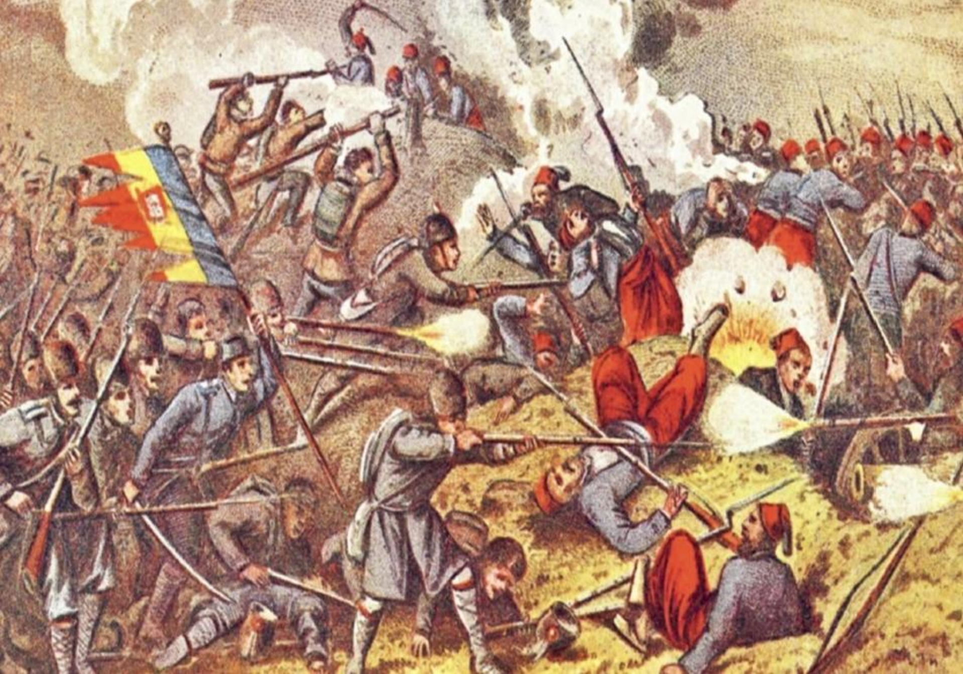
Bătălia pentru Vidin (Bulgaria, ianuarie 1878)