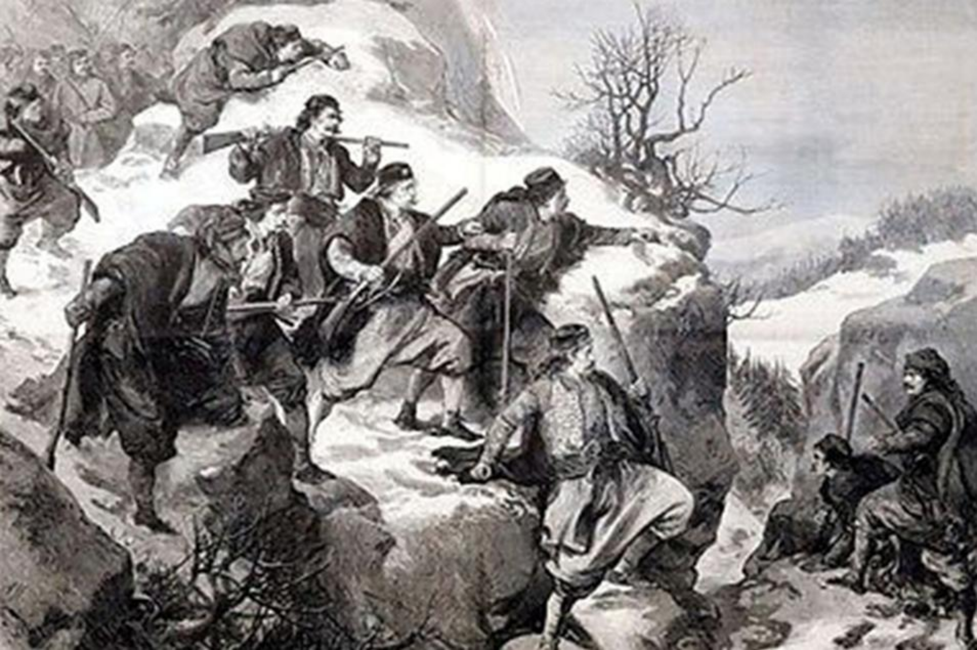
Ambuscadă bosniacă din perioada răscoalei antiotomane (Bosnia-Herțegovina, 1875)