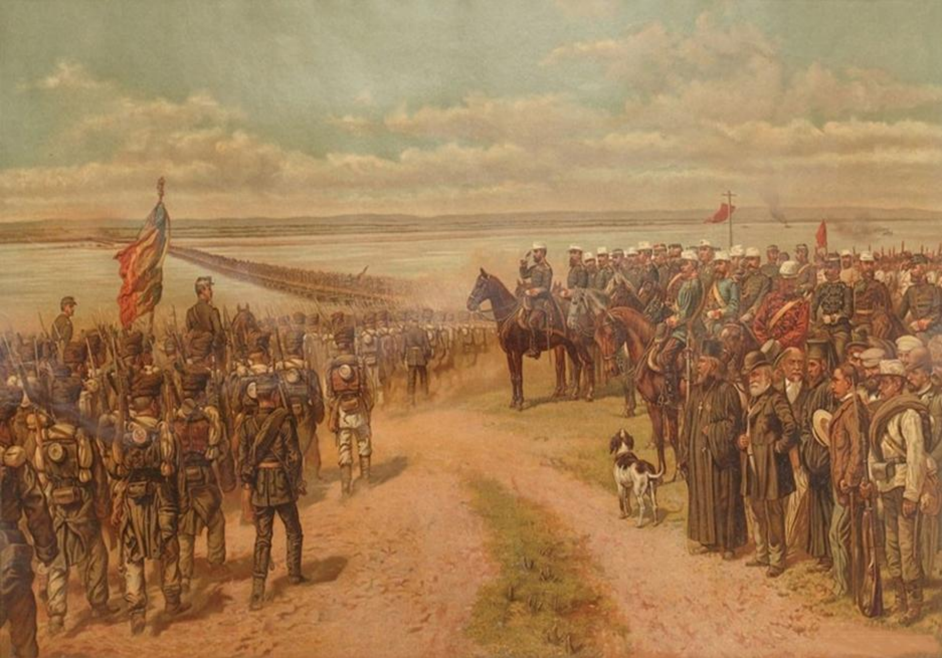
Trecerea armatei române la sud de Dunăre (20 august 1877)