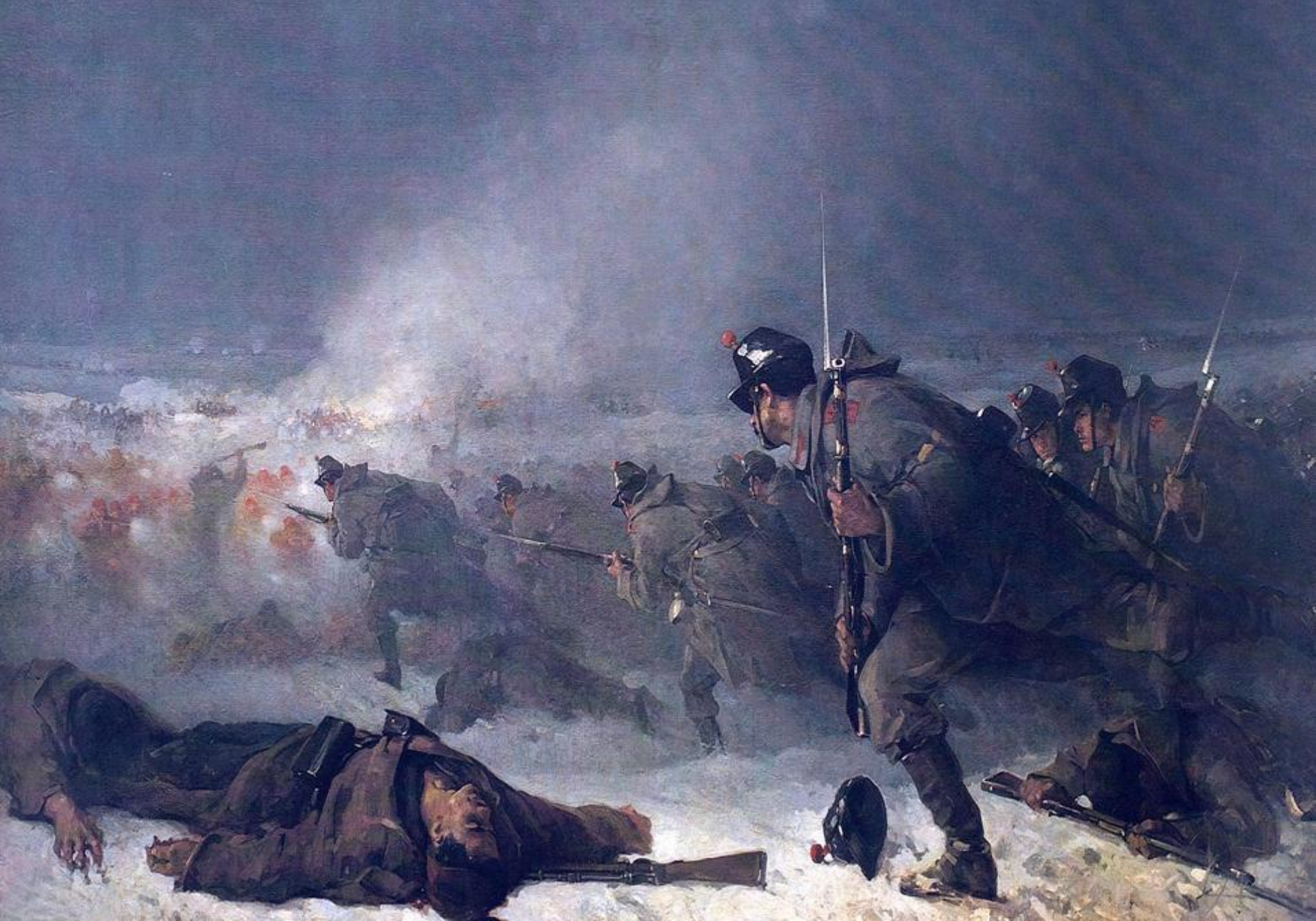
Nicolae Grigorescu - Atacul de la Smârdan (1878)