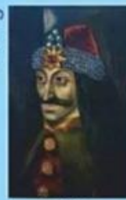
Vlad Teșes 1448; 1456-1462; 1478 Țara Românească