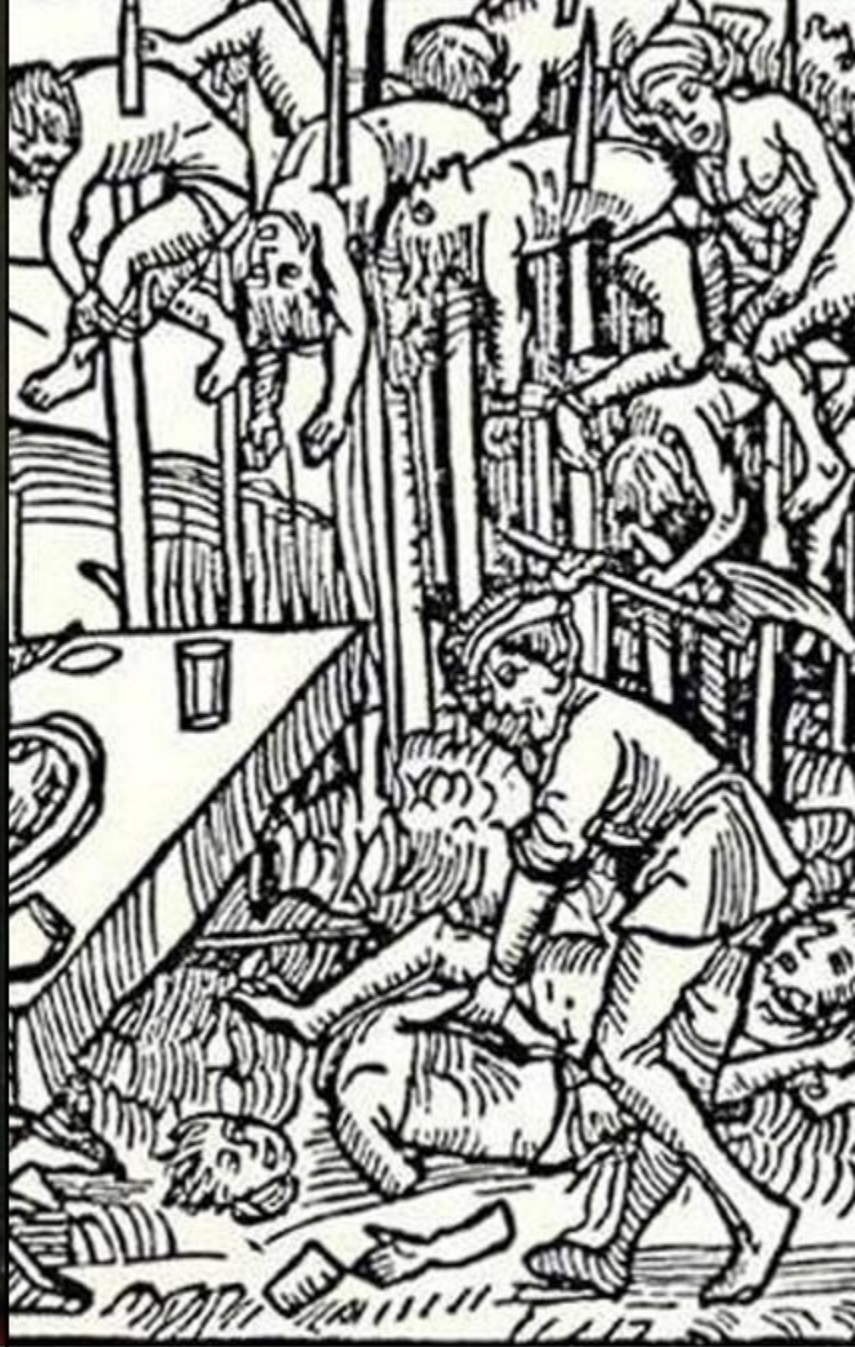
Execuție prin tragere în țeapă