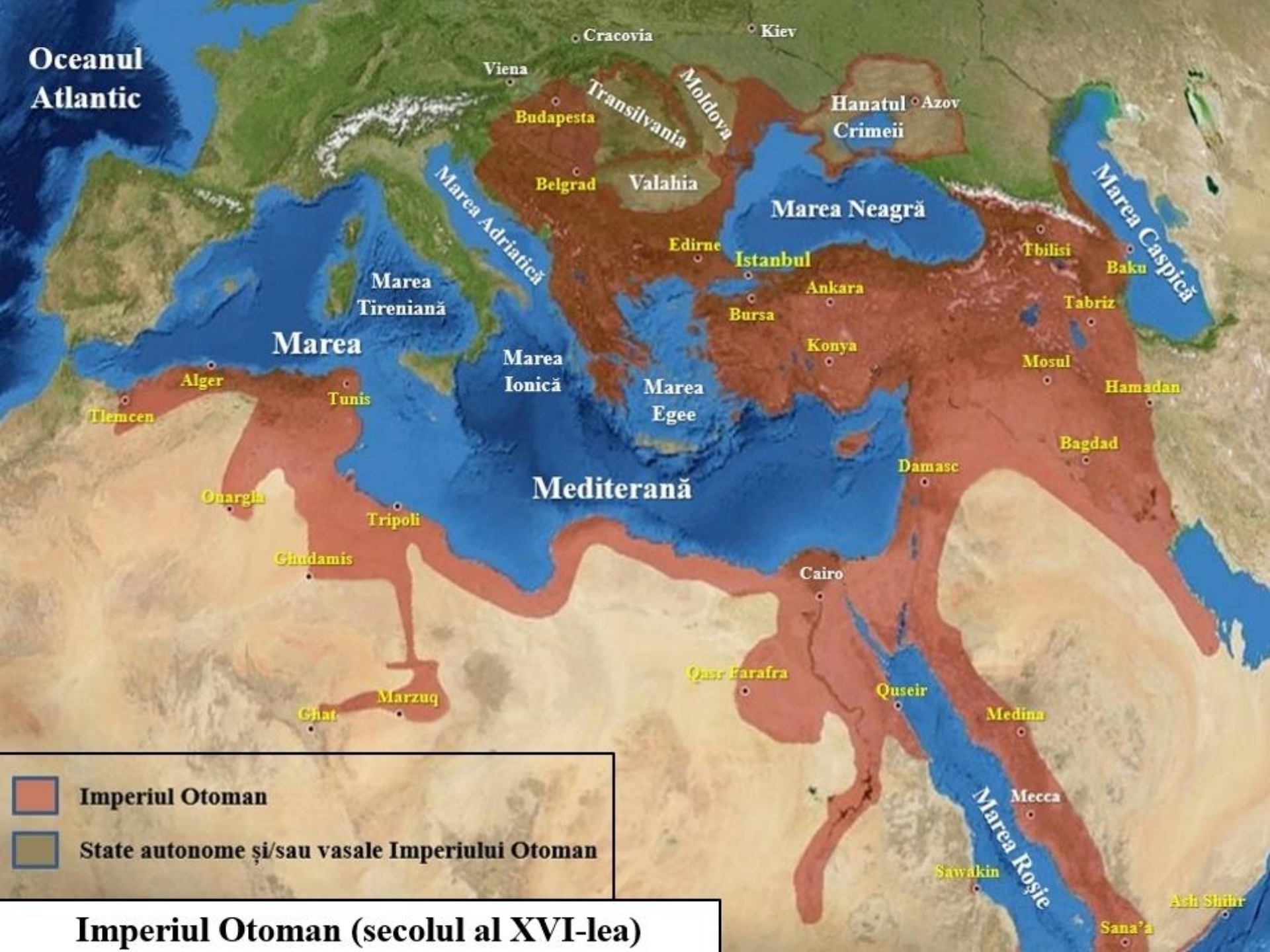
Imperiul Otoman (secolul al XVI-lea)