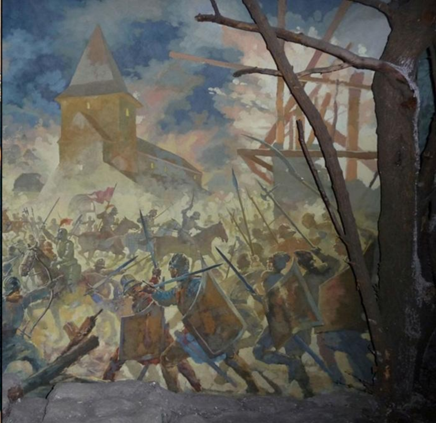
Bătălia de la Baia (14-15 decembrie 1467)