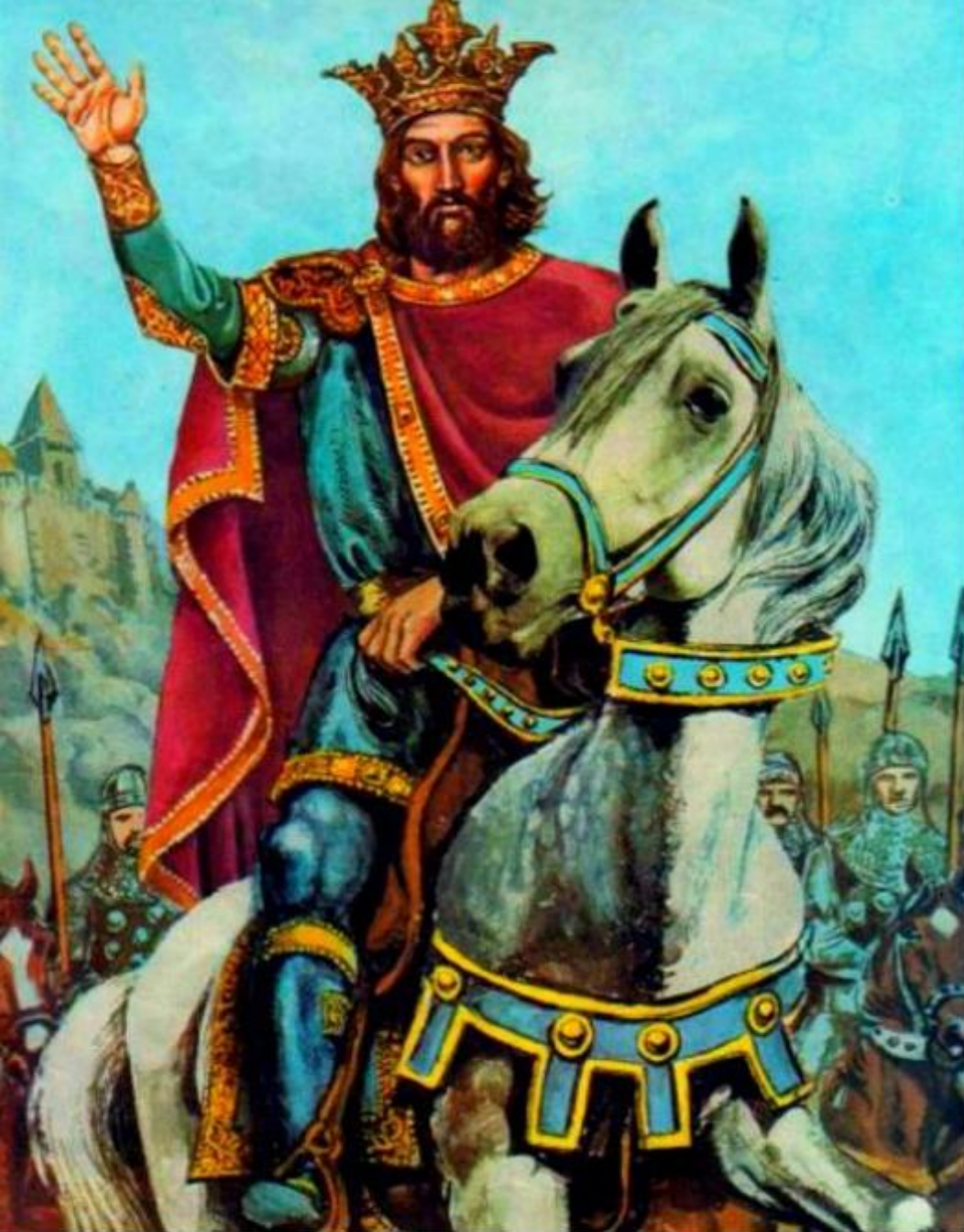
Mircea cel Bătrân

„Io, întru Hristos Dumnezeu binecredincios și binecinstitor și de Hristos iubitor și autocrat, Io Mircea mare voievod și domn din mila lui Dumnezeu și cu darul lui Dumnezeu, stăpânind și domnind peste toată Țara Ungrovlahiei și a părților de peste munți, încă și către părțile tătărești și Amlașului și Făgărașului herțeg și domnitor al Banatului Severinului și pe amândouă părțile pe toată Podunavia, încă până la marea cea mare și stăpânitor al cetății Dârstorului.”