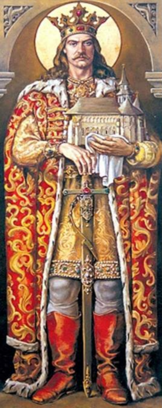
Ștefan al III-lea cel Mare