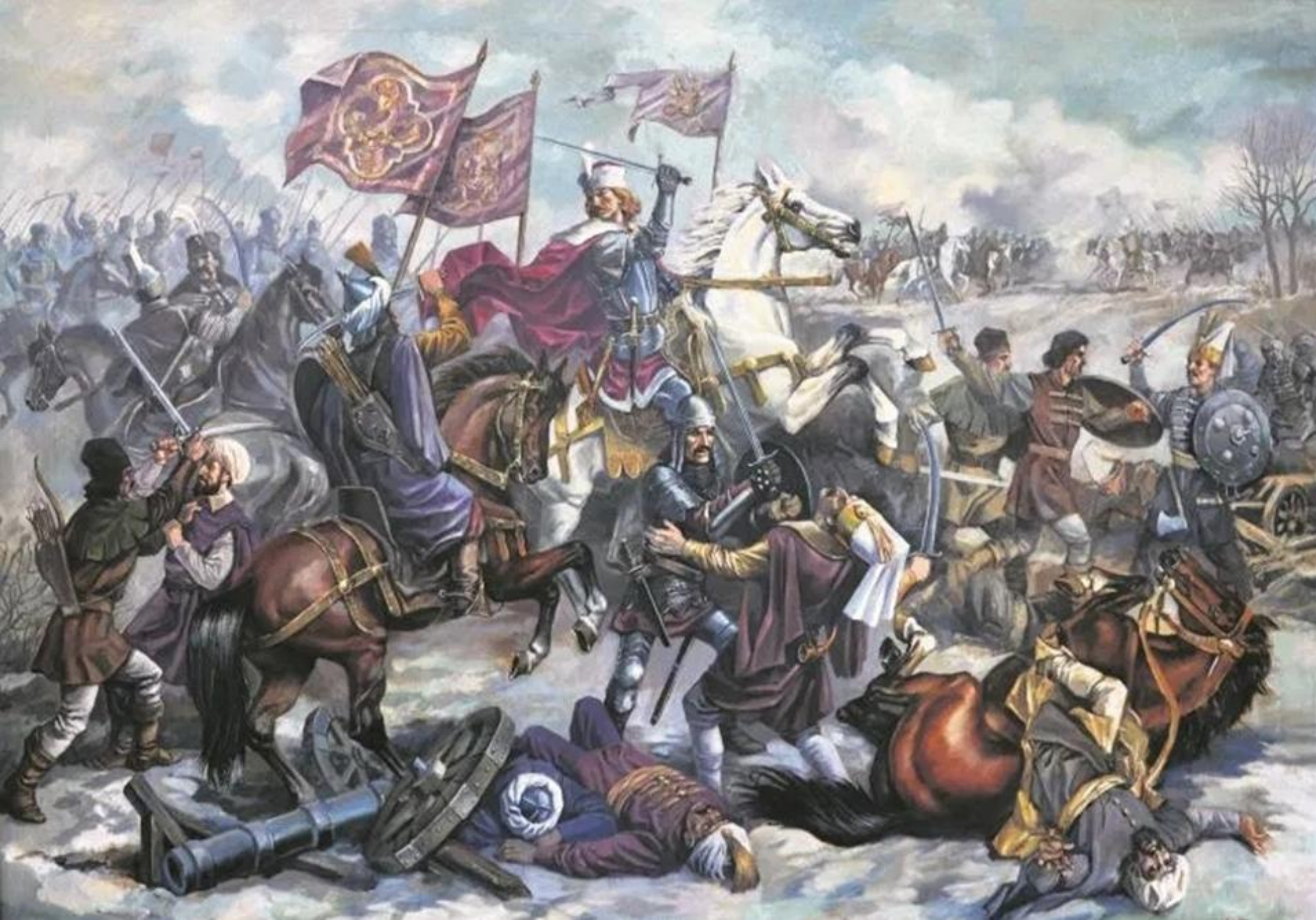
Bătălia de la Vaslui (Podul Înalt) - 10 ianuarie 1475