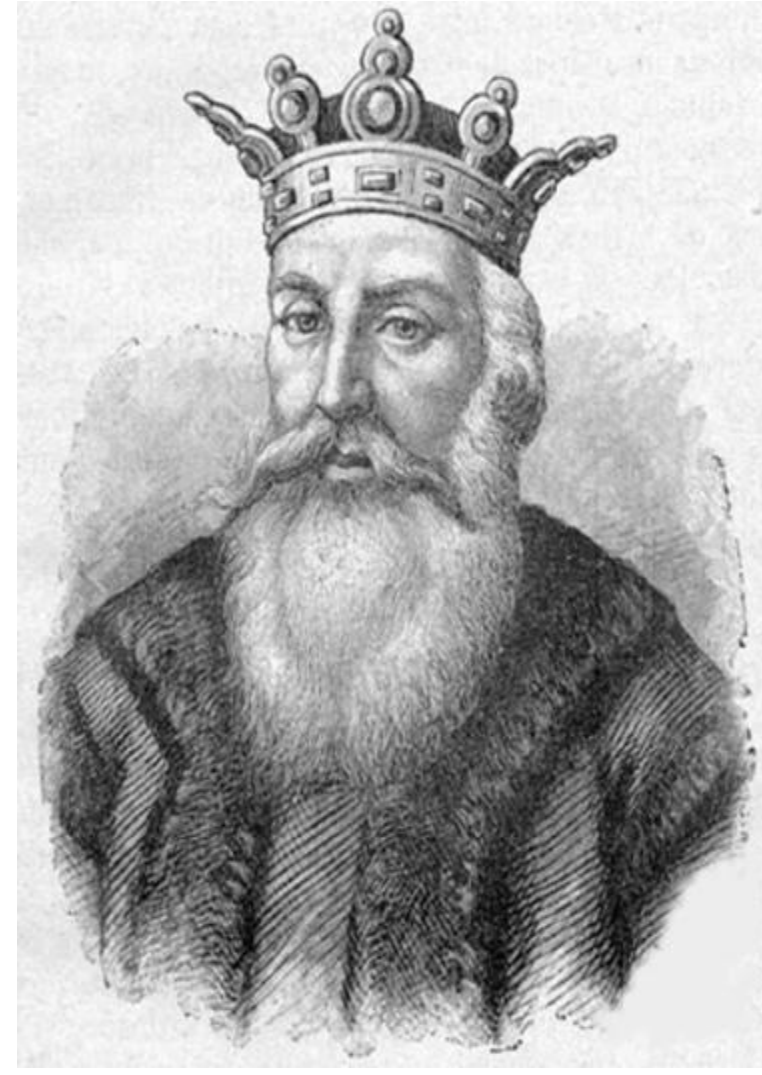
Alexandru cel Bun

27 septembrie 1422 - la Marienburg, forțele poloneze, alături de cele moldovene, s-au luptat cu forțele Cavalerilor Teutoni pentru controlul asupra zonei Mării Baltice.