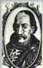
Iancu de Hunedoara 1438-1441 ban al Severinului 1441-1456 voievod al Transilvaniei