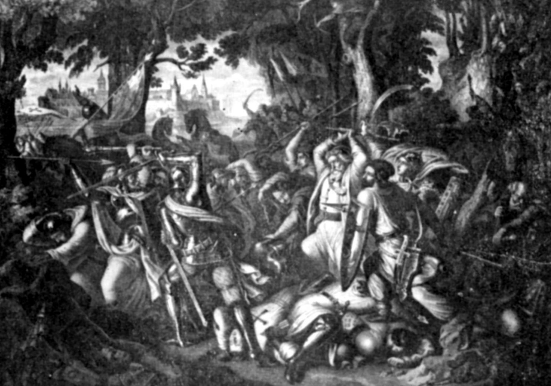
Asediul cetății Marienburg (Polonia, 1422)