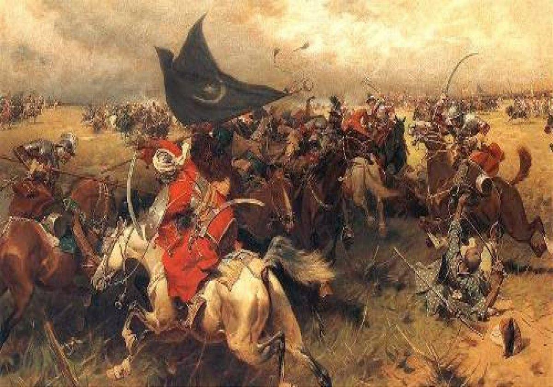
Bătălia de pe Ialomița (1442)