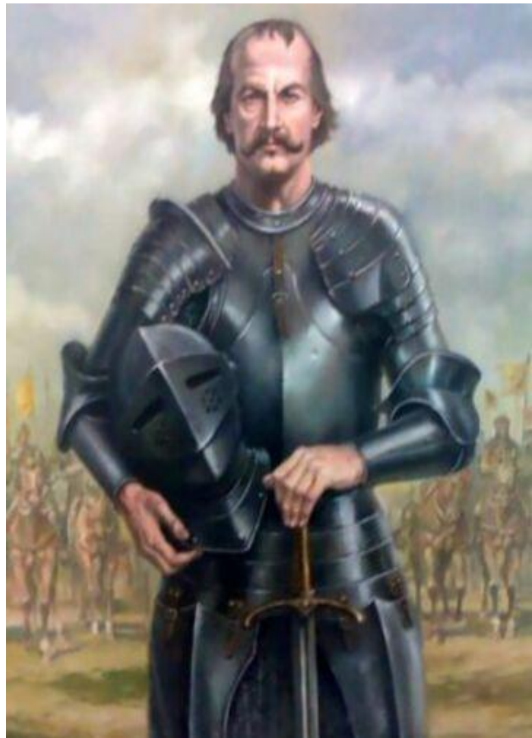
Iancu de Hunedoara

Iulie 1444 - la Seghedin, s-a semnat tratatul de pace, pe o perioadă de 10 ani, favorabil forțelor creștine.