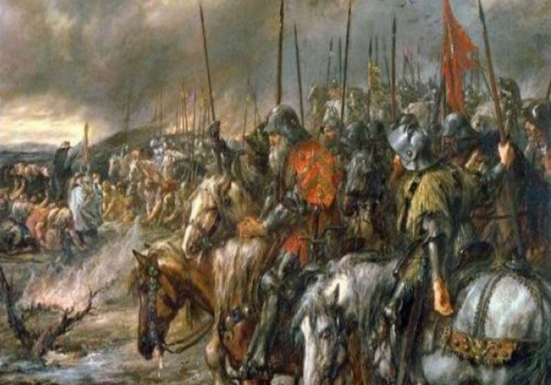
Bătălia de la Nicopole (Bulgaria, 25 septembrie 1396)