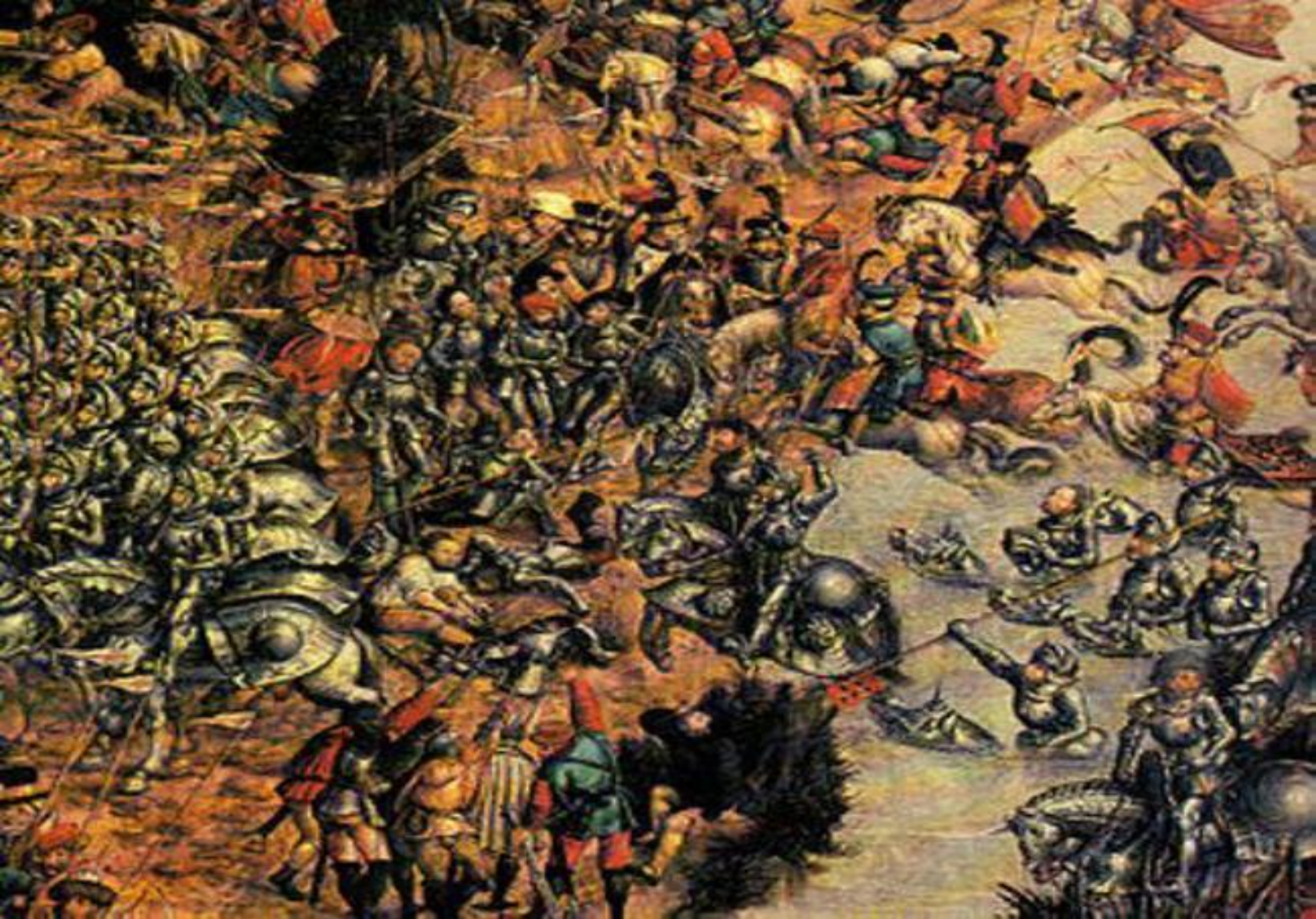
Bătălia de la Codrii Cosminului (26 octombrie 1497)