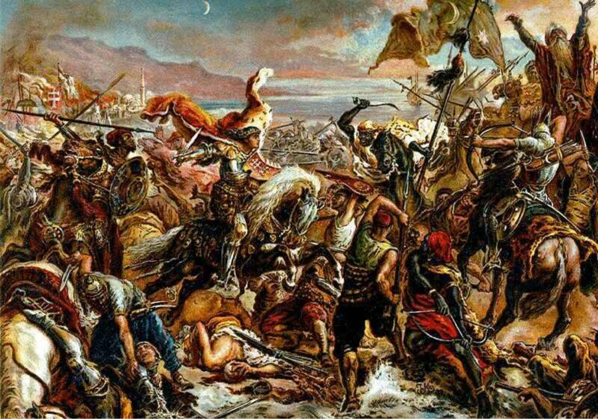
Bătălia de la Varna (Bulgaria, noiembrie 1444)