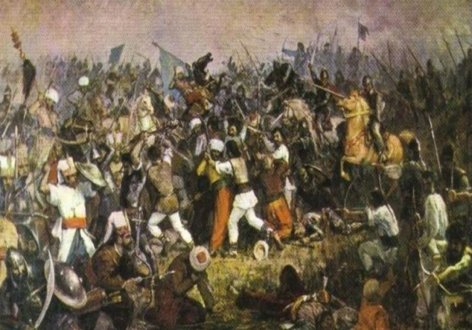
Bătălia de la Rovine (octombrie 1394/mai 1395)