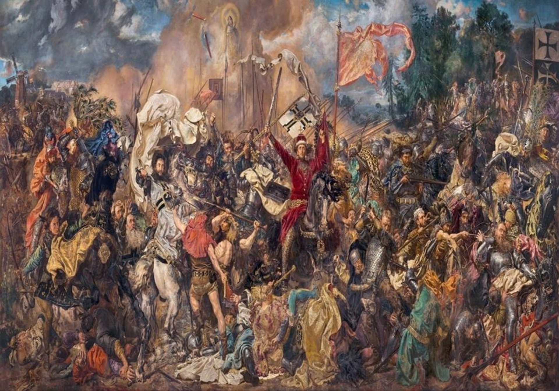
Bătălia de la Grunwald (Polonia, 1410)