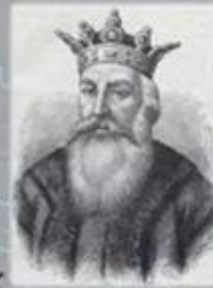
Alexandru cel Bun 1400-1431 Moldova