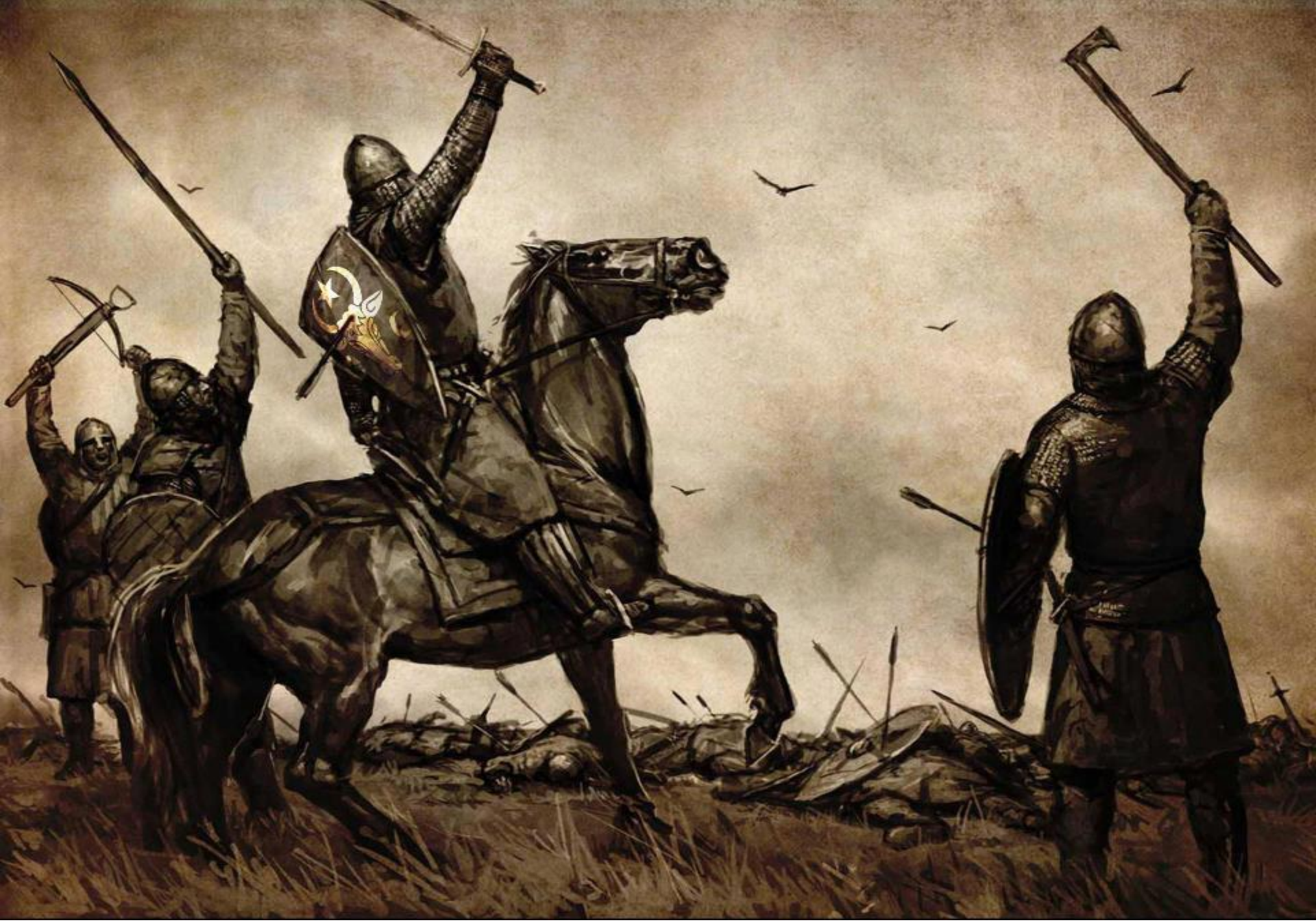
Bătălia de la Războieni (Valea Albă) - 25-26 iulie 1476