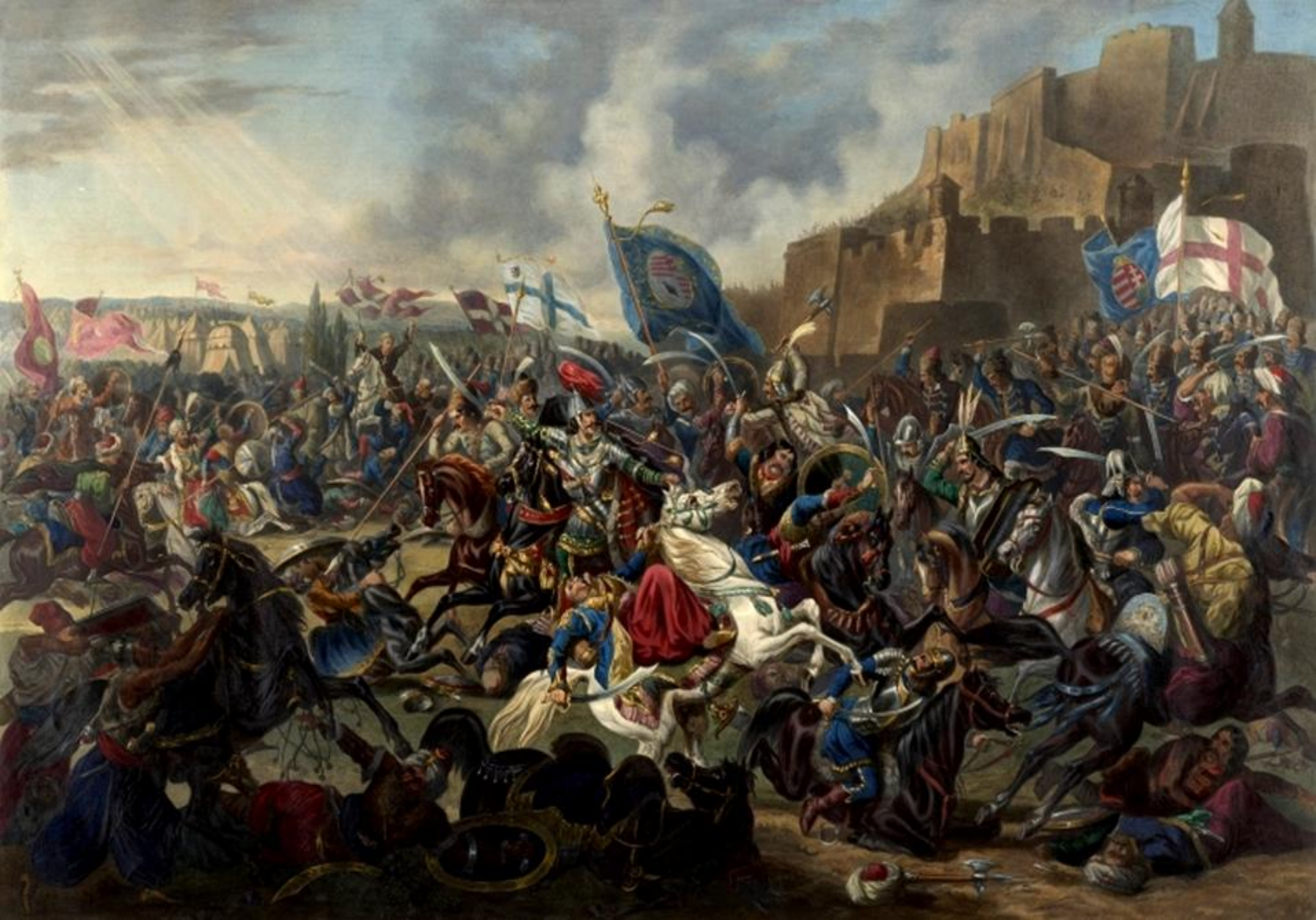
Bătălia pentru apărarea Belgradului (Serbia, iulie 1456)