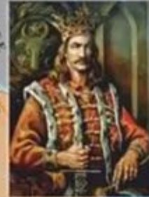
Ștefan cel Mare 1457-1504 1484 Moldova