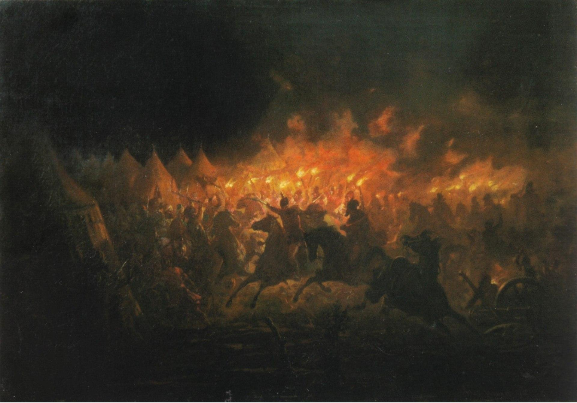
Theodor Aman - Bătălia cu facle (1891)