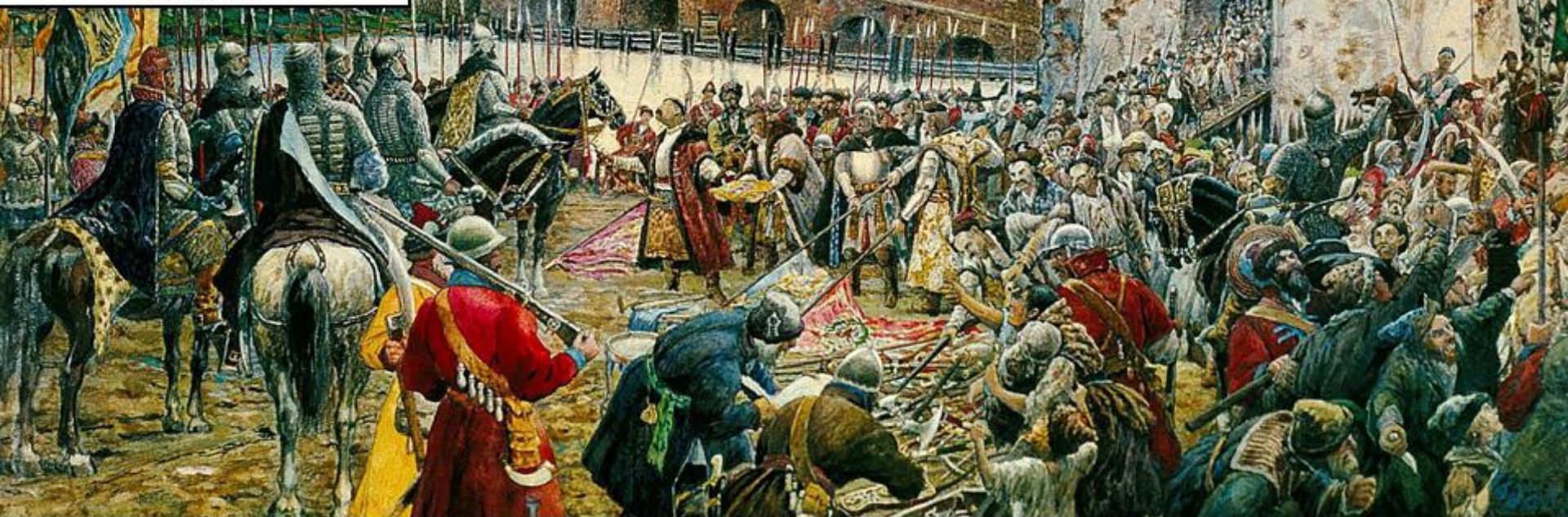
Sfârșitul Timpurilor Tulburi: garnizoana poloneză învinsă cedează rușilor fortăreața Moscovei (Federația Rusă, 1612)