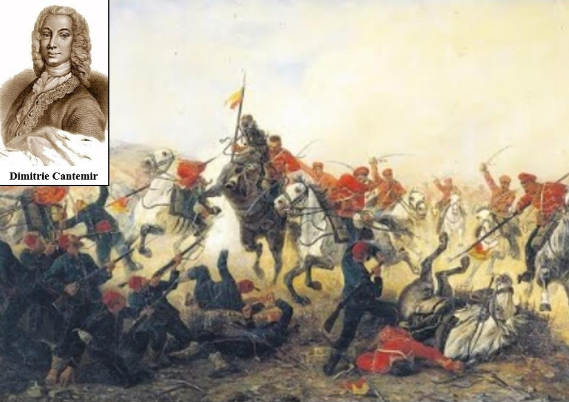
Bătălia de la Stănilești pe Prut (România, iulie 1711)