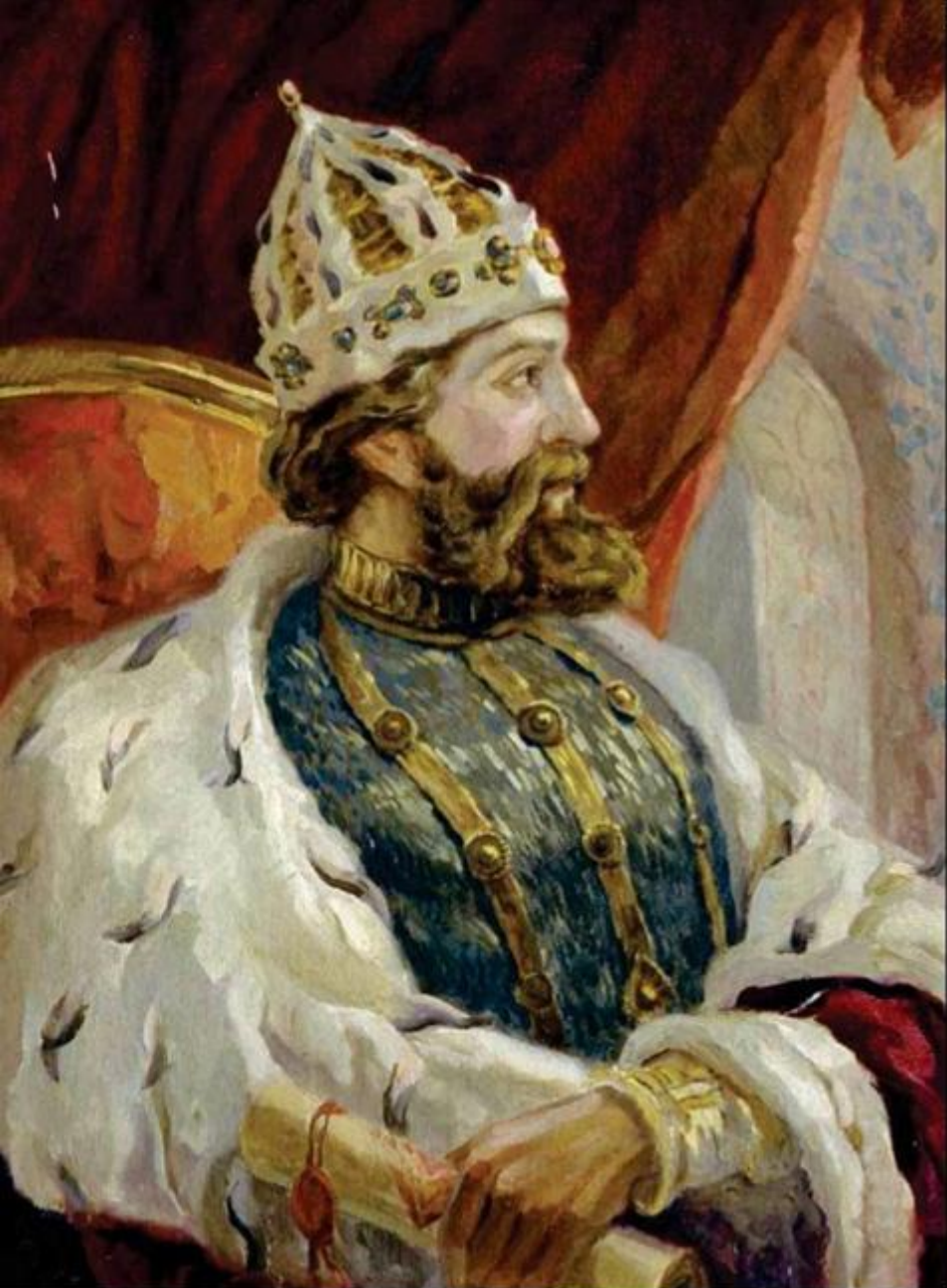
Ivan al III-lea cel Mare