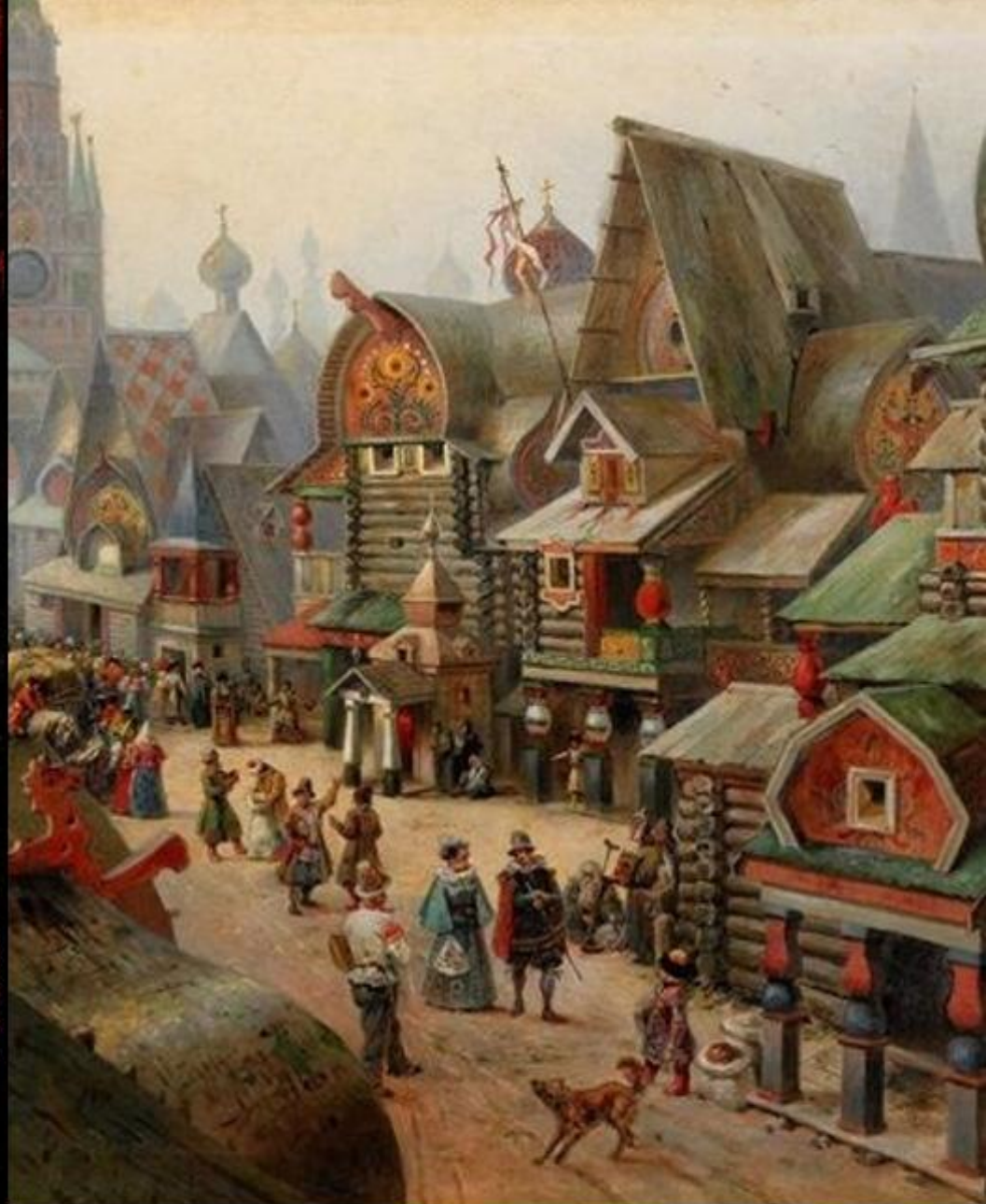
Stradă aglomerată din Moscova (Federația Rusă, secolul al XVII-lea)