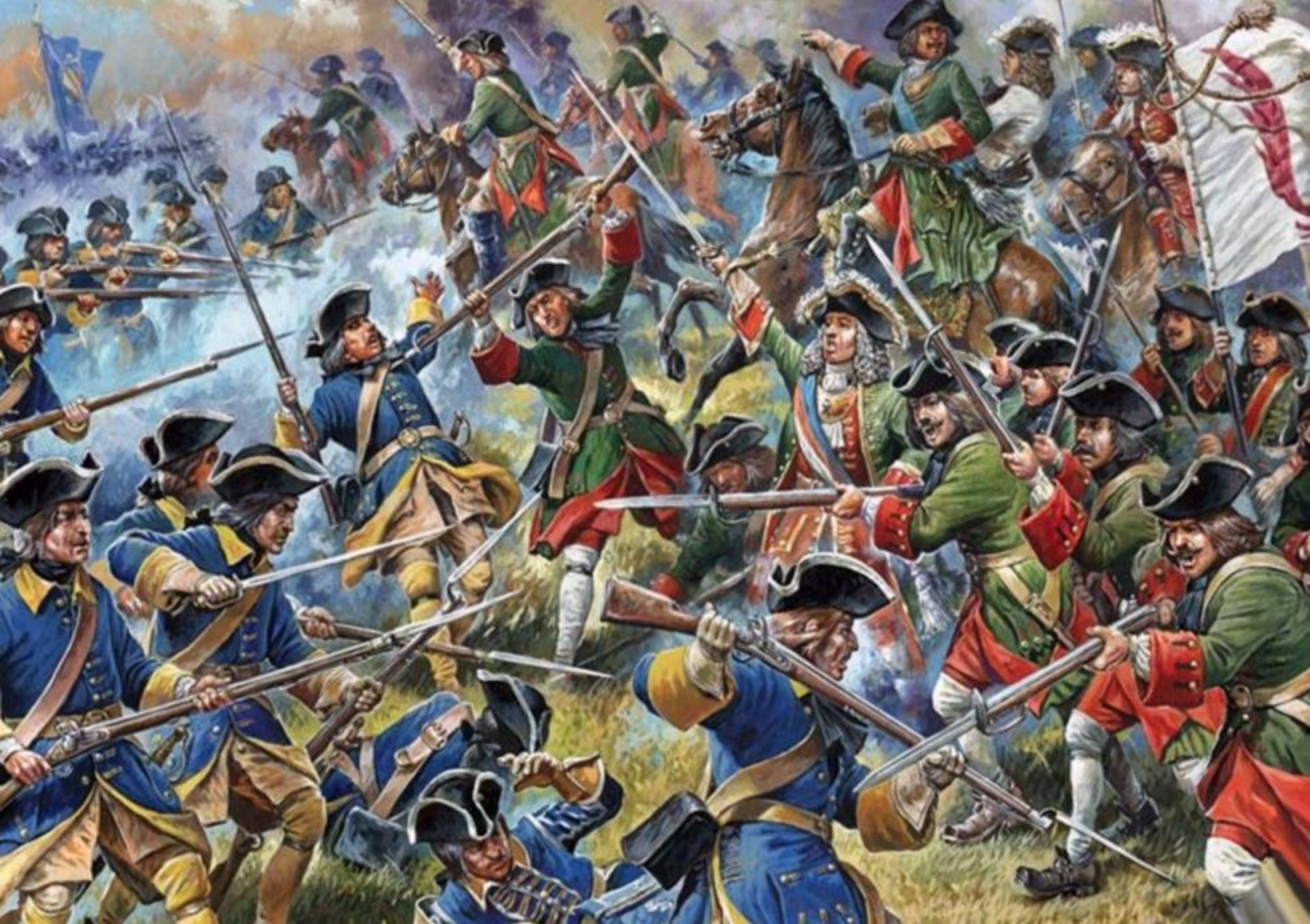
Bătălia de la Poltava (Ucraina, 8 iulie 1709)