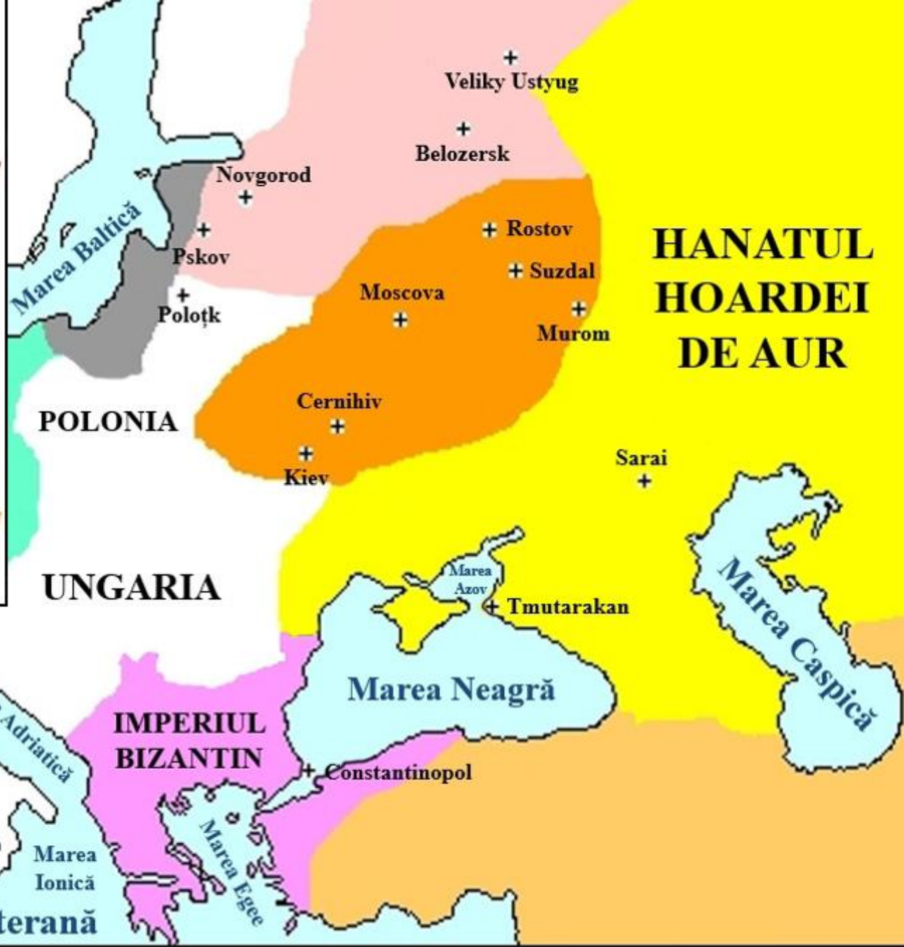
Europa și spațiul rusesc (cca. 1250)