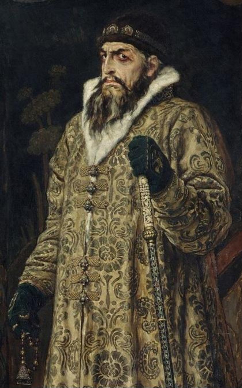
Ivan al IV-lea cel Groaznic