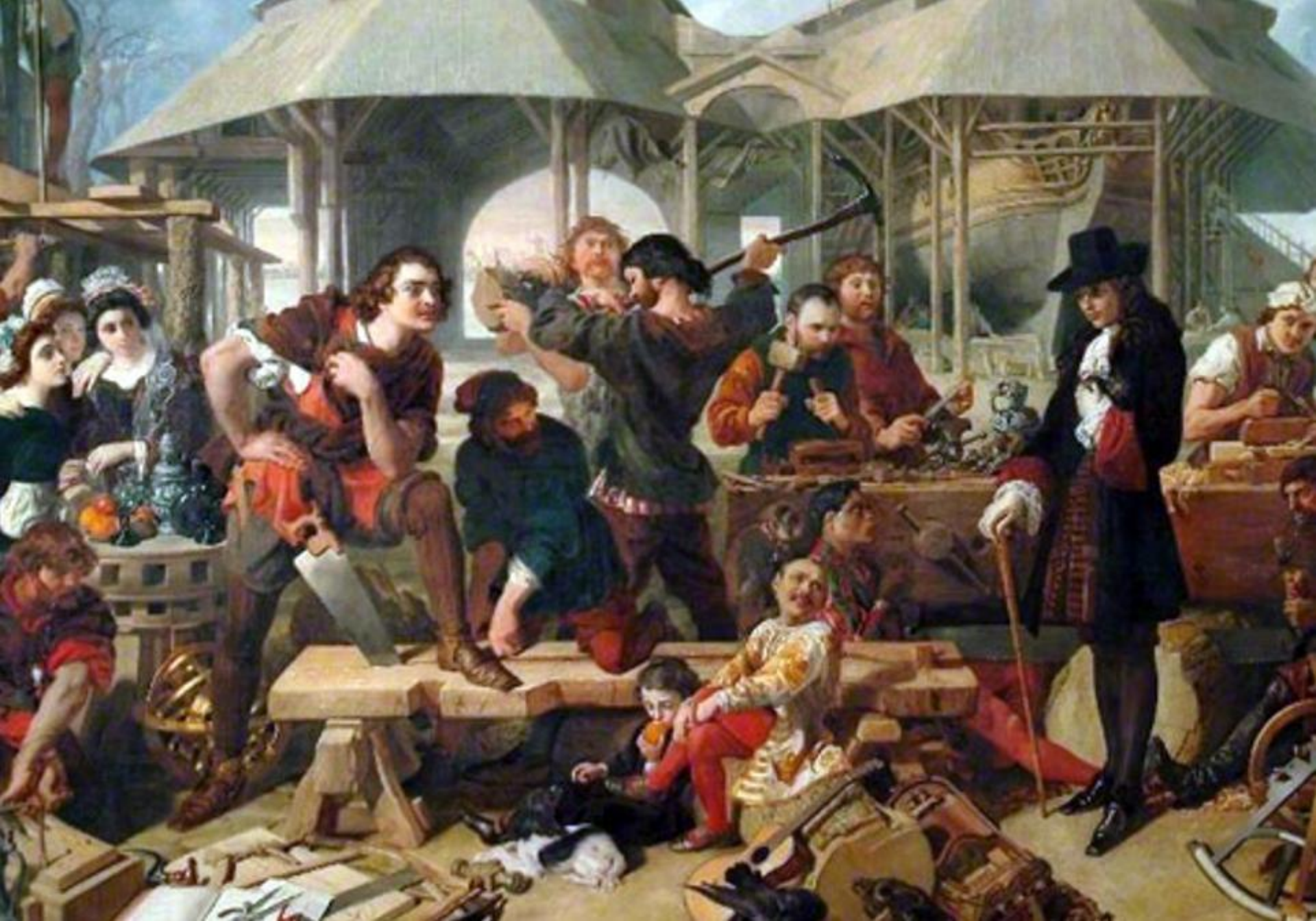
Marea Ambasadă: Petru I cel Mare în Olanda (1697)