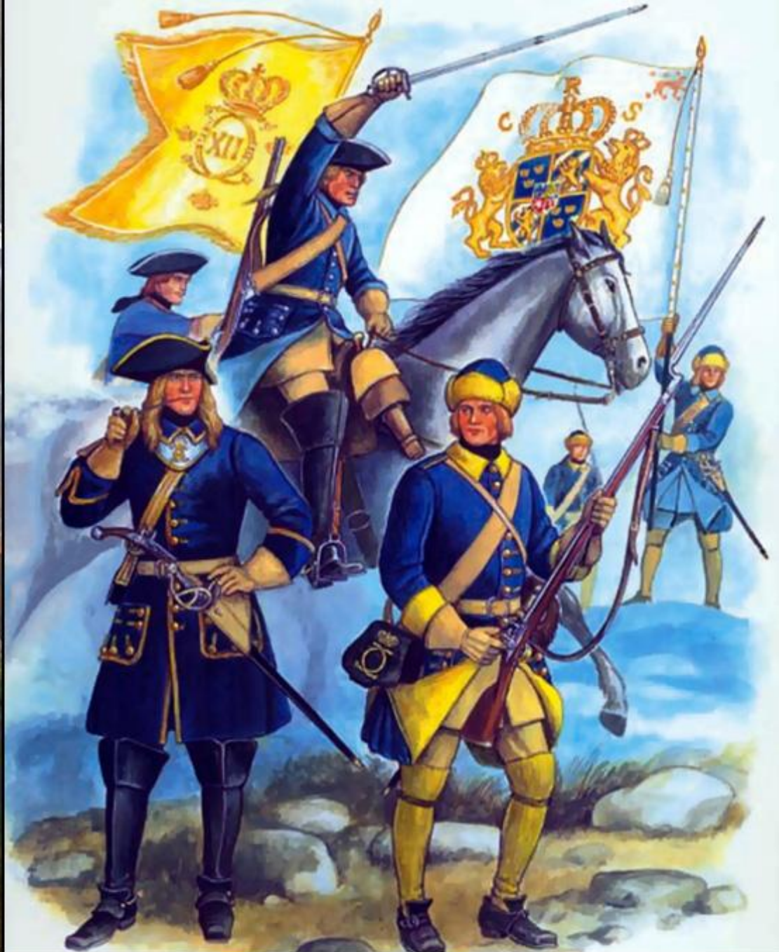
Soldați suedezi (secolul al XVIII-lea)