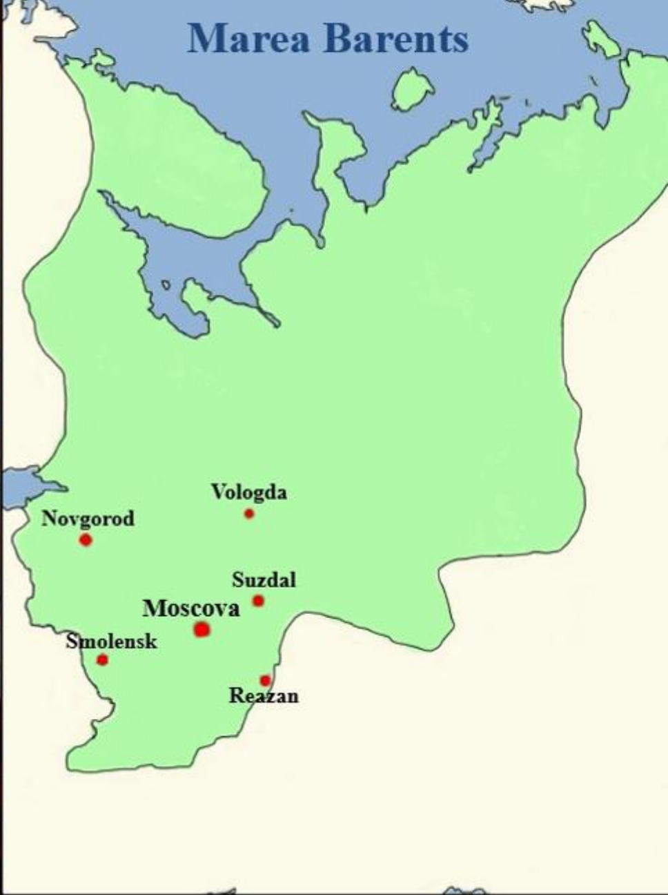
Rusia în perioada domniei lui Ivan al III-lea cel Mare (1505)