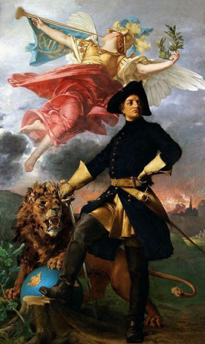
Carol al XII-lea