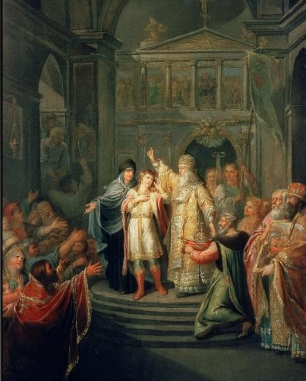
Grigoriy Ivanovici Ugryumov - Alegerea țarului Mihail Romanov pe 14 martie 1613 (1798-1800)