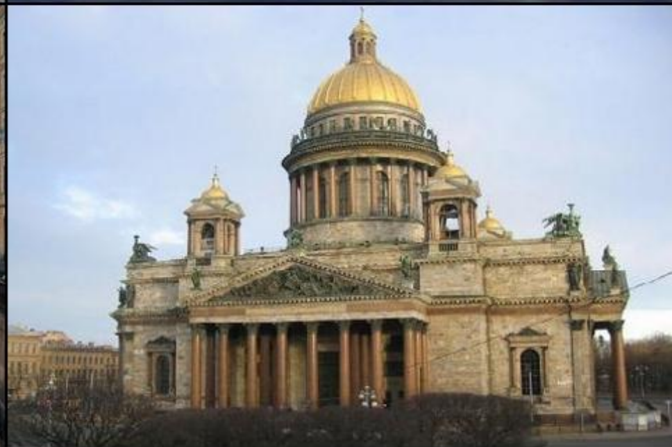
Sankt Petersburg (Federația Rusă) - colaj