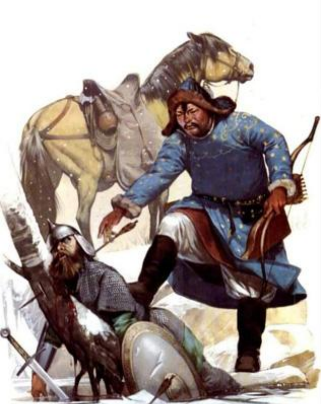
Luptător mongol (secolul al XIII-lea)