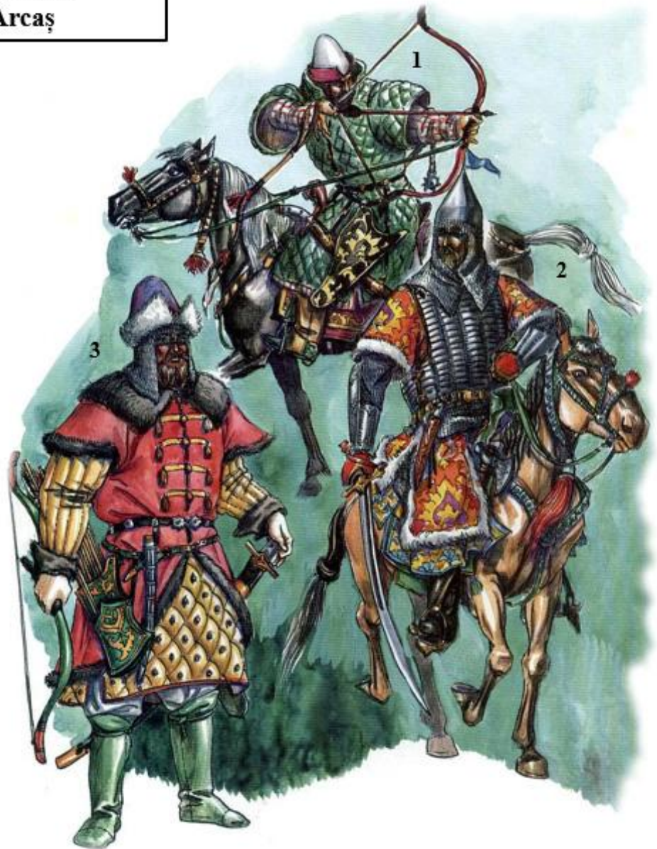
Războinici ruși (secolul al XVI-lea)