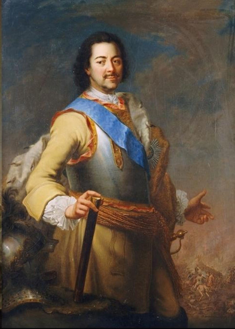
Petru I cel Mare