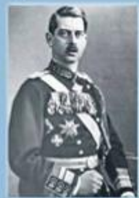
Carol al II-lea 1930-1940