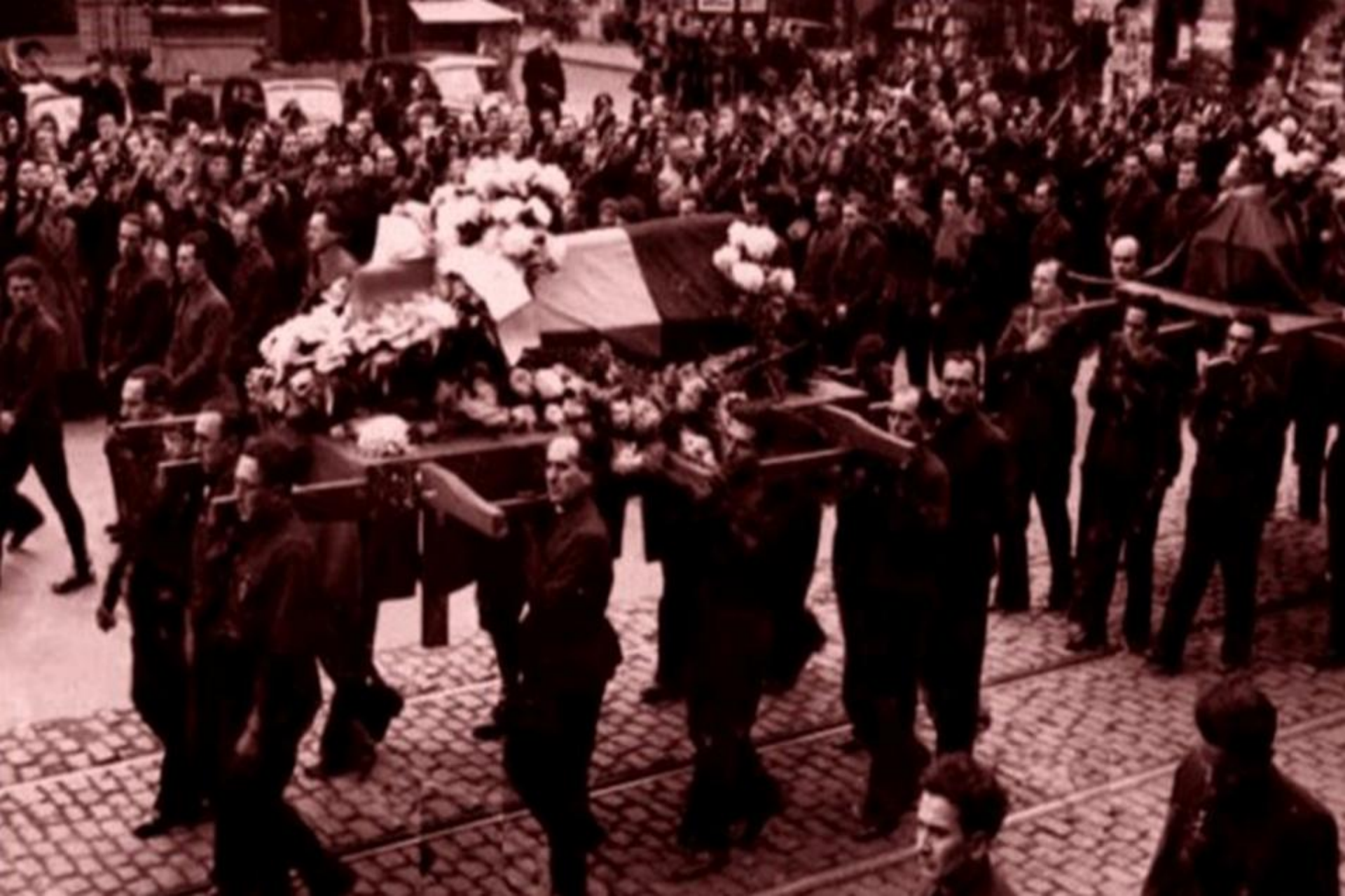
Înmormântarea liderului mișcării legionare, Căpitanul Corneliu Zelea Codreanu (30 noiembrie 1938)