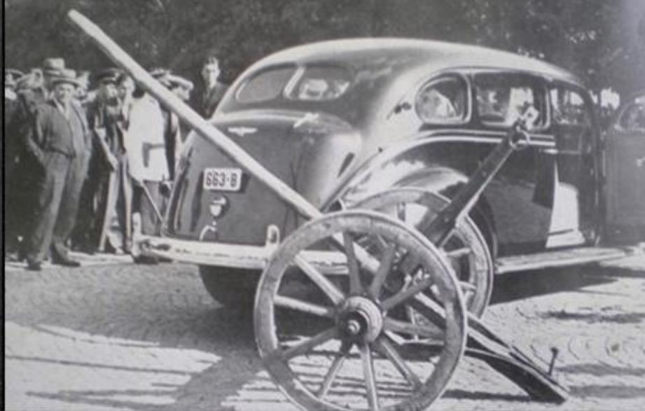
Mașina în care a fost asasinat Armand Călinescu (21 septembrie 1939)

ASASINII RAPOSATULUI PRIM MINISTRU Armand Călinescu împreună cu toți complicii lor au fost executați