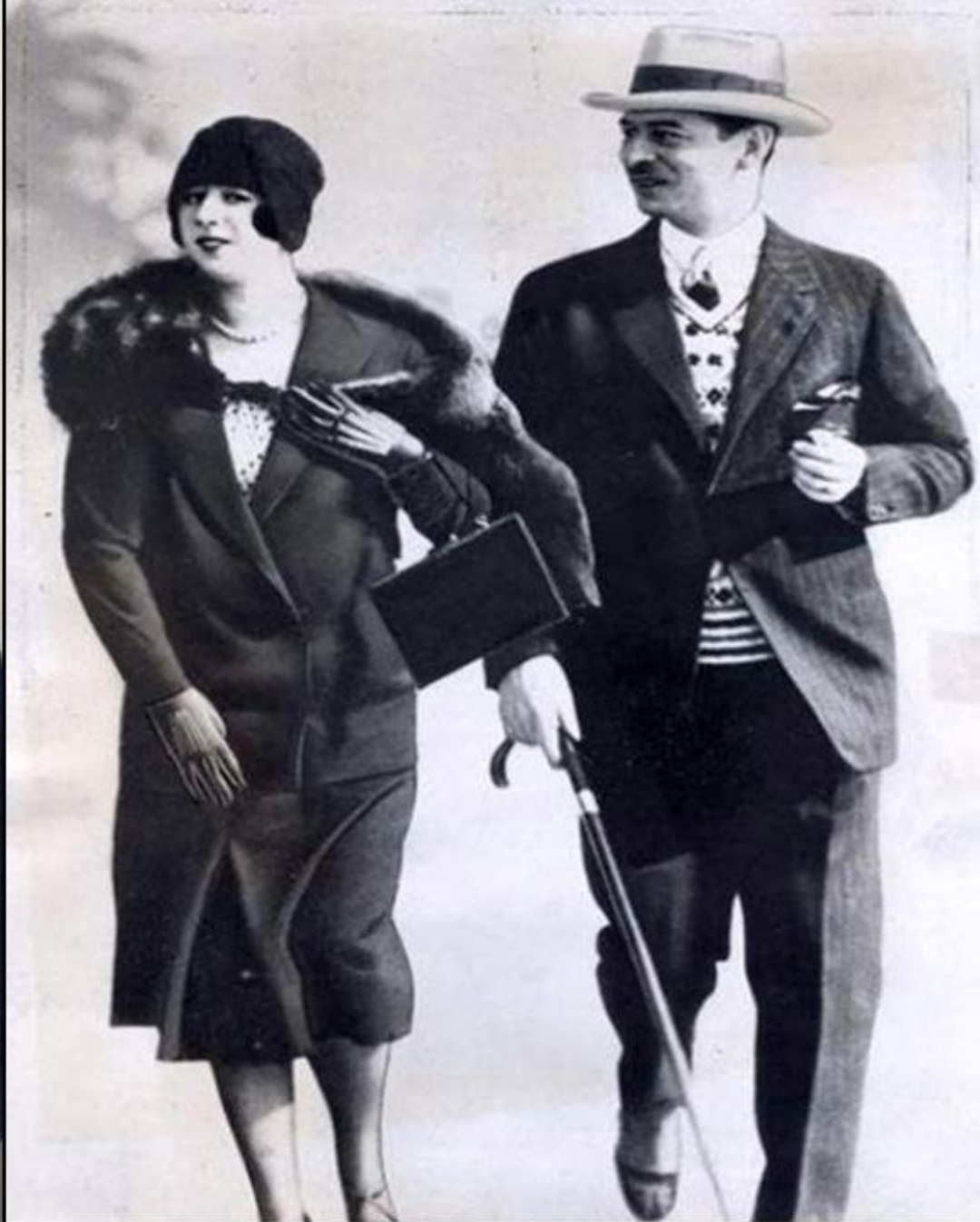
Carol al II-lea și Elena Lupescu