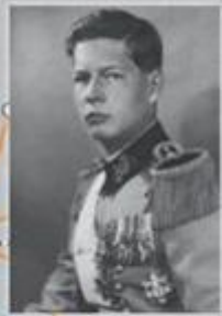
Mihai I 1927-1930