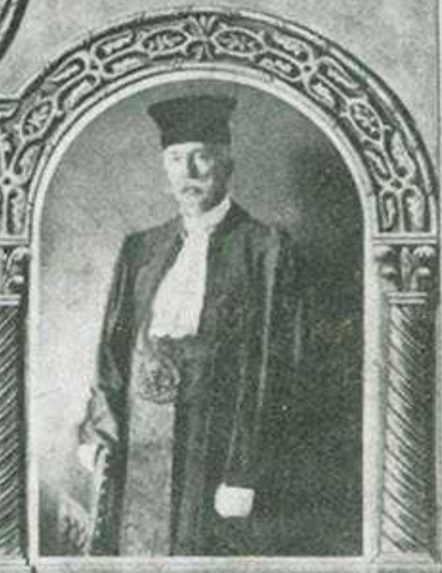
1895-1918 MIRON CRISTEA PONTIFICUL ROMANIEI