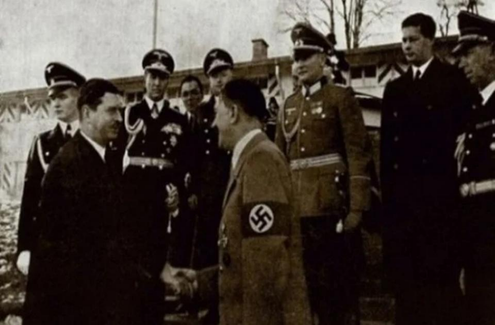
Carol al II-lea se întâlnește cu Adolf Hitler la Berchtesgaden (Germania, 24 noiembrie 1938)