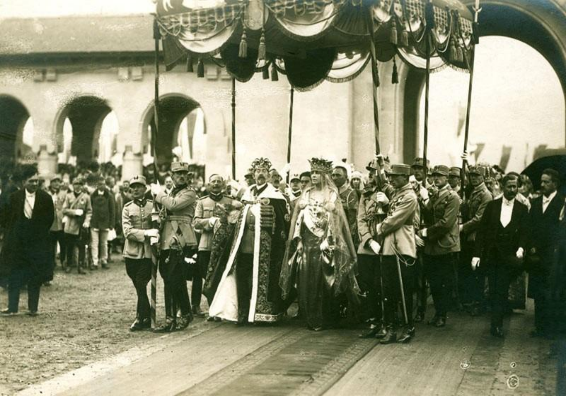
Încoronarea regelui Ferdinand I (Alba Iulia, 15 octombrie 1922)