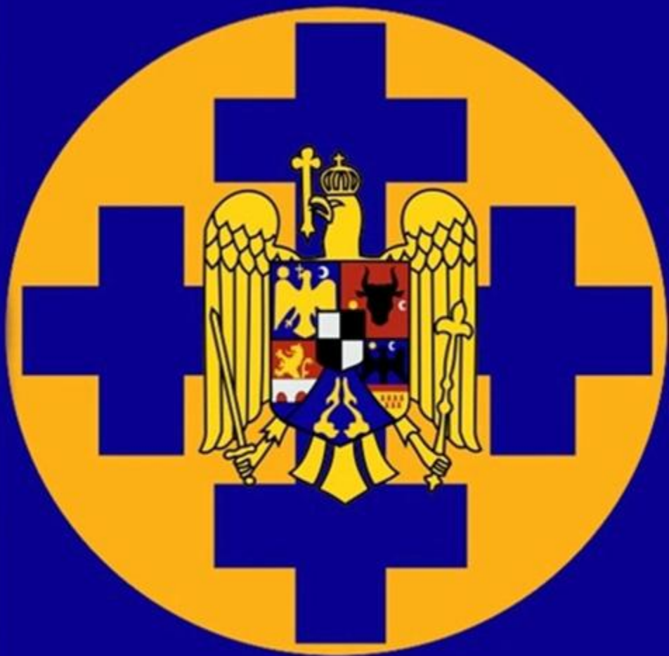
Constituția din 1938 (prima pagină)

FUNDAȚIA CULTURALĂ REGALĂ «PRINCIPELE CAROL» STRADA LATINĂ, 1 - BUCUREȘTI