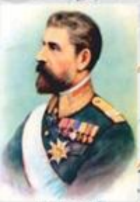
Ferdinand I 1914-1927