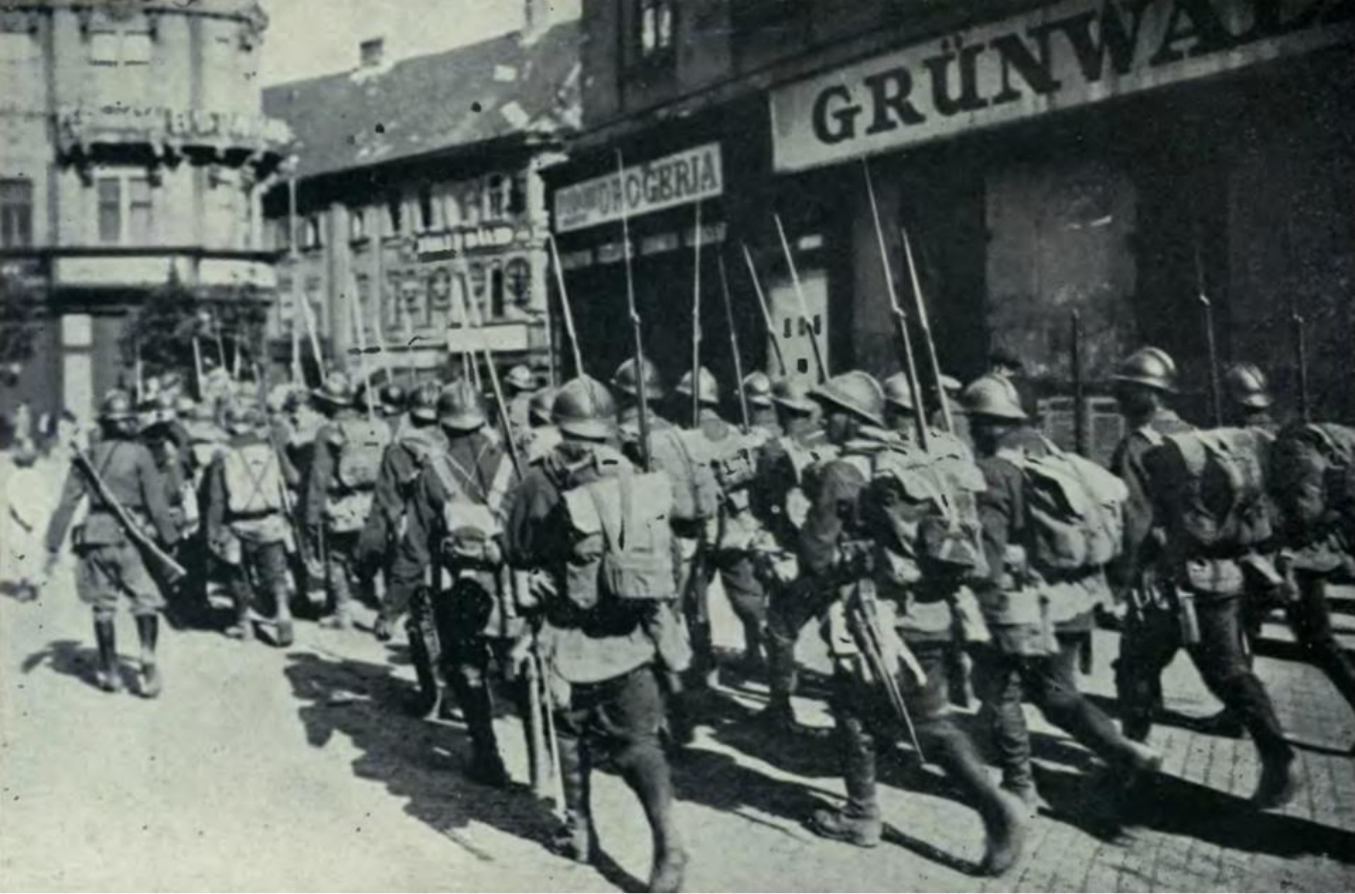
Trupele române ocupă Budapesta în perioada războiului româno-maghiar (Ungaria, august 1919)