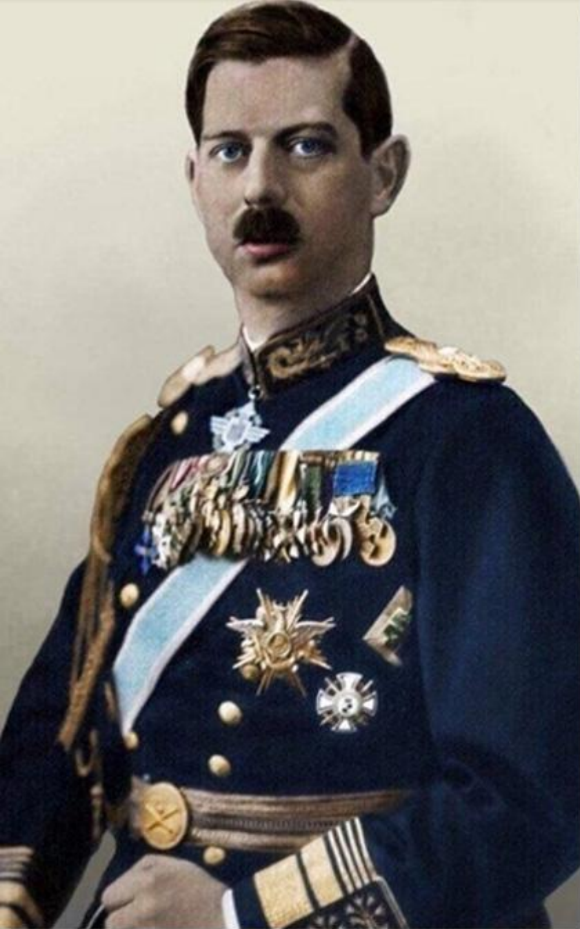
Carol al II-lea