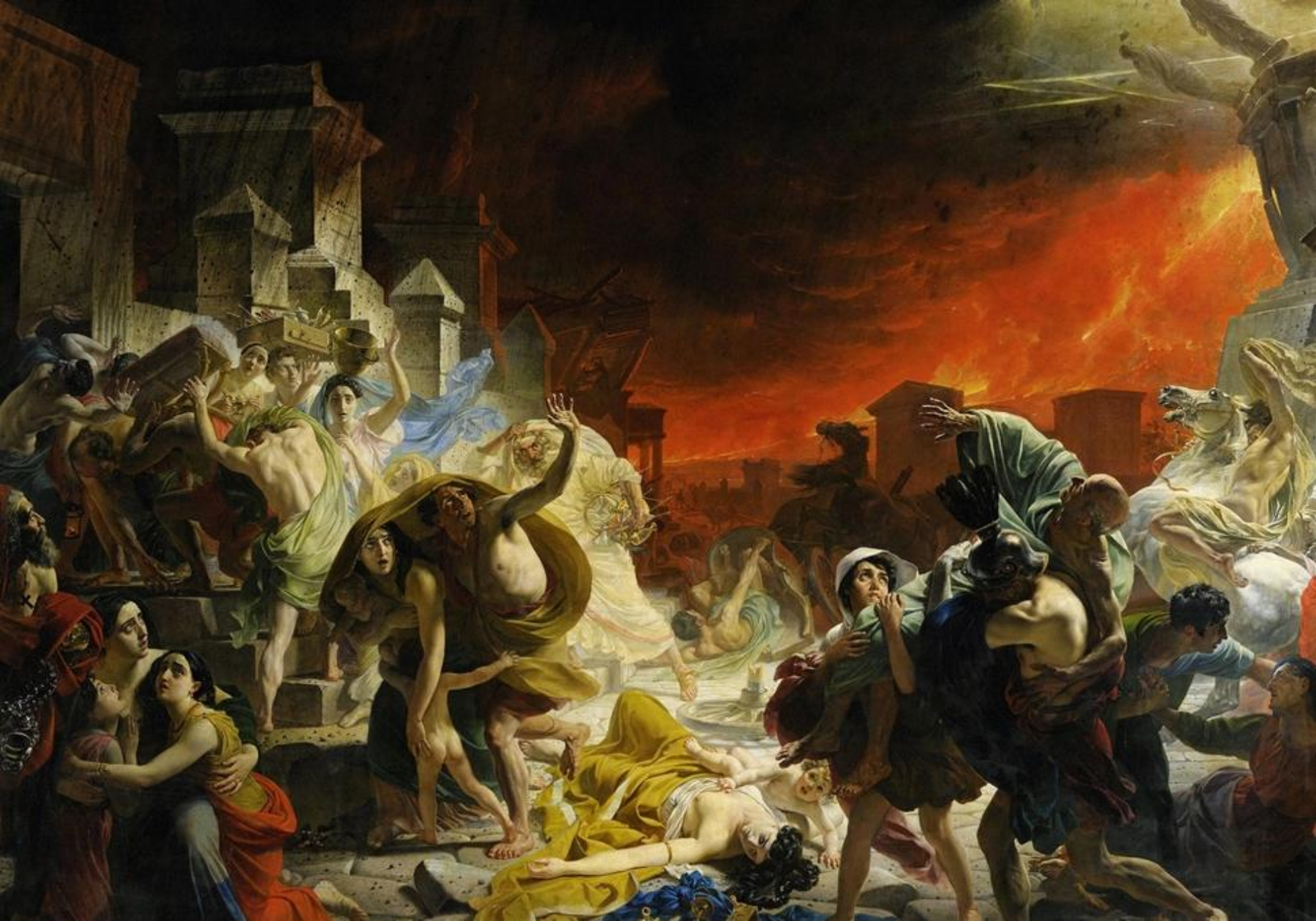
Karl Briullov - Ultima zi a oraşului Pompeii (1827-1833)