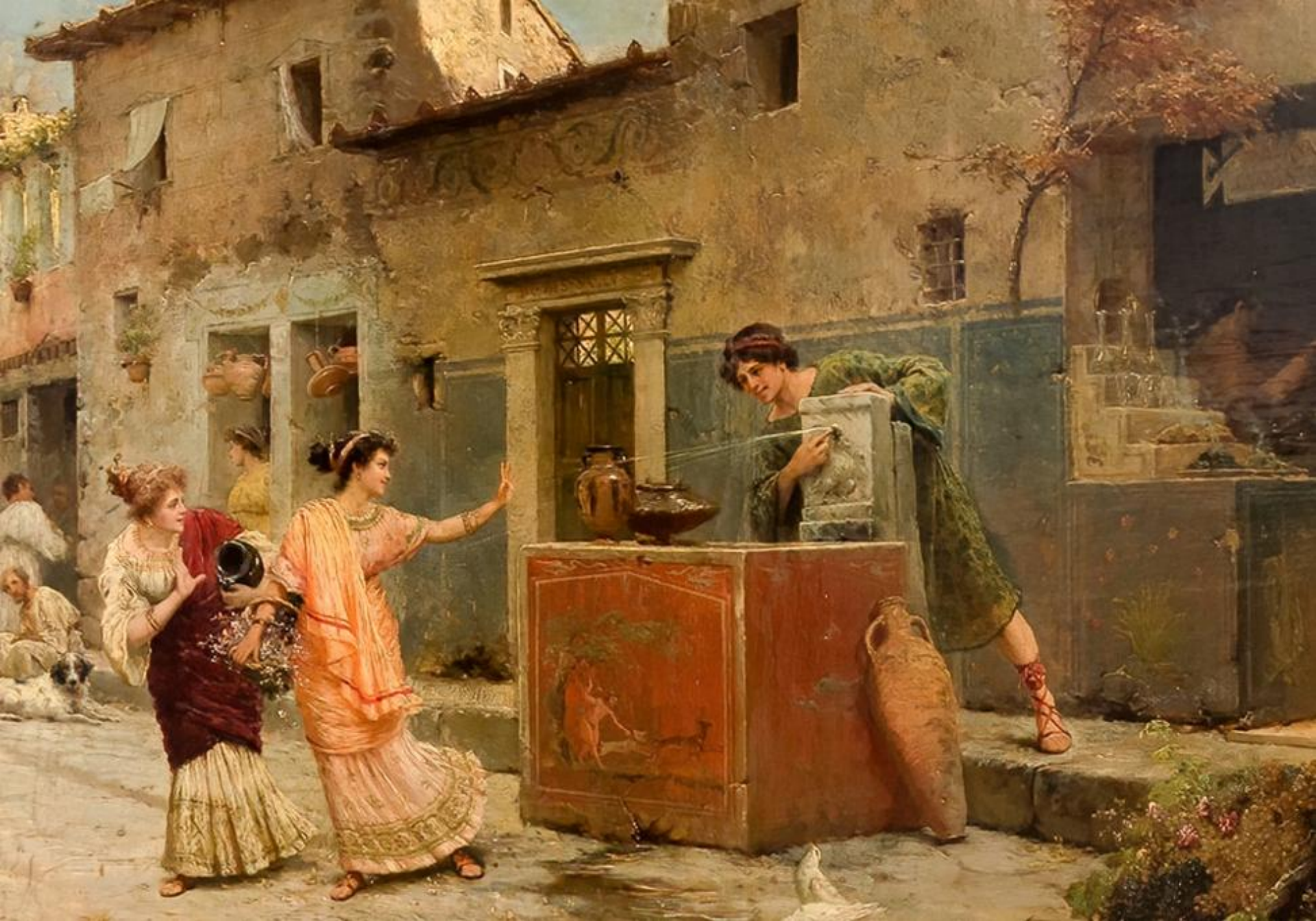
Stradă din Pompeii