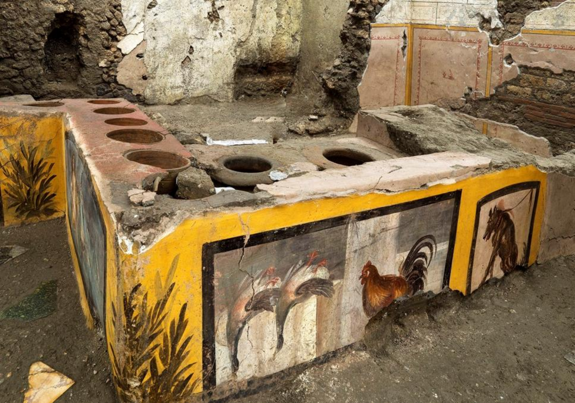
Stand de mâncare stradală descoperit în Pompeii (Italia, 2021)