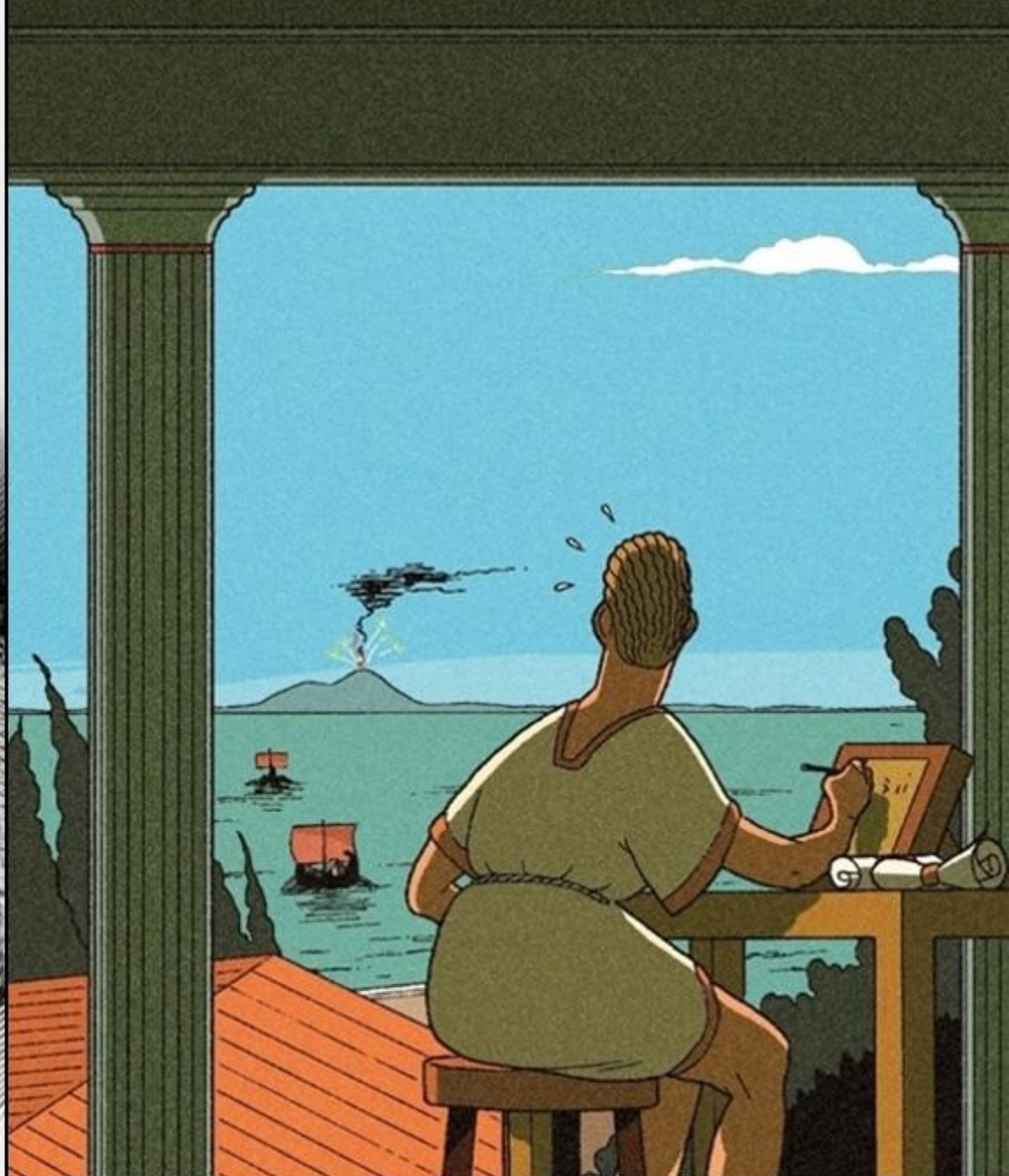
Plinius cel Tânăr, martor la erupția Vezuviului