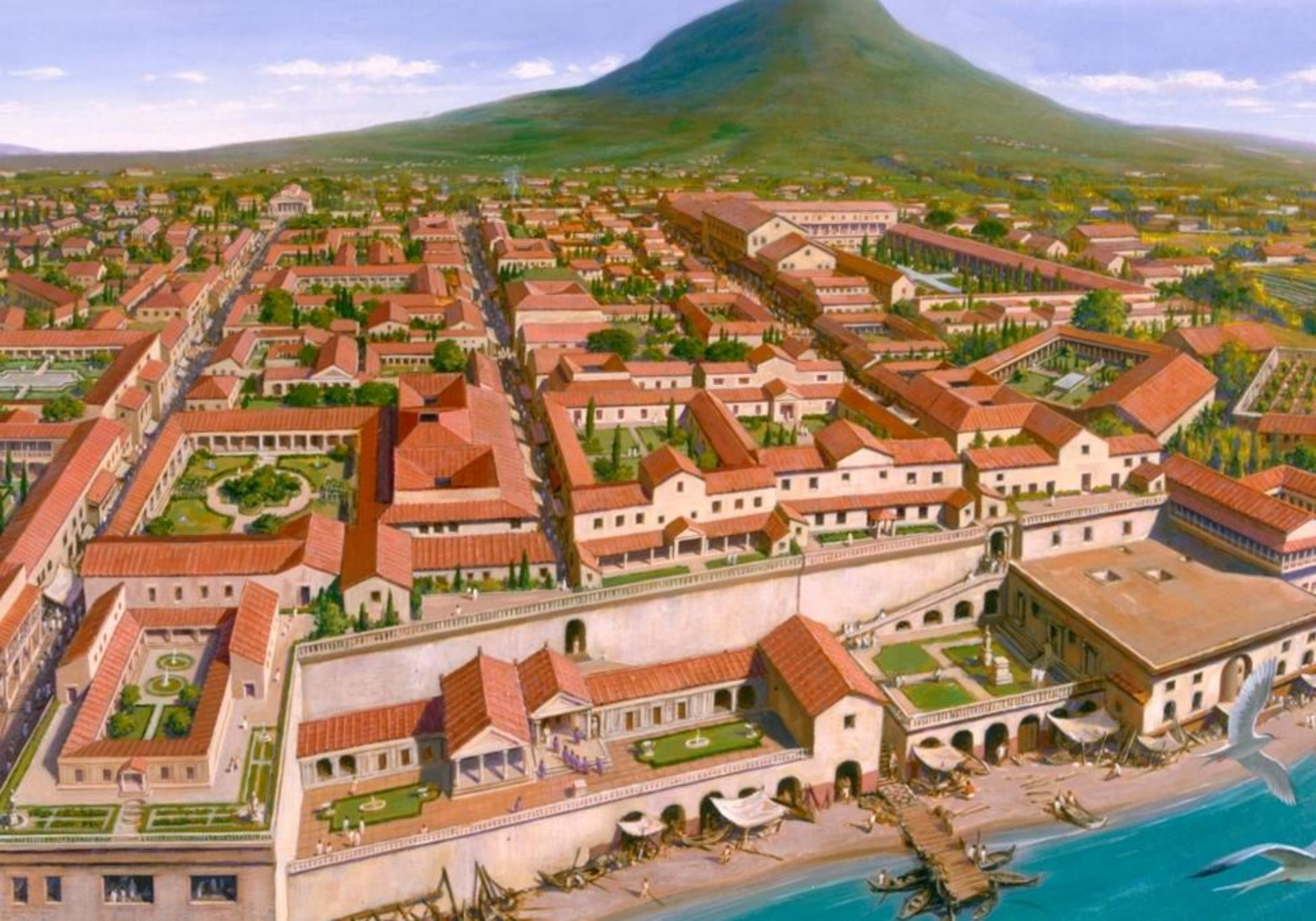
Oraşul Pompeii (Italia, secolul I d.Hr.) - reconstituire