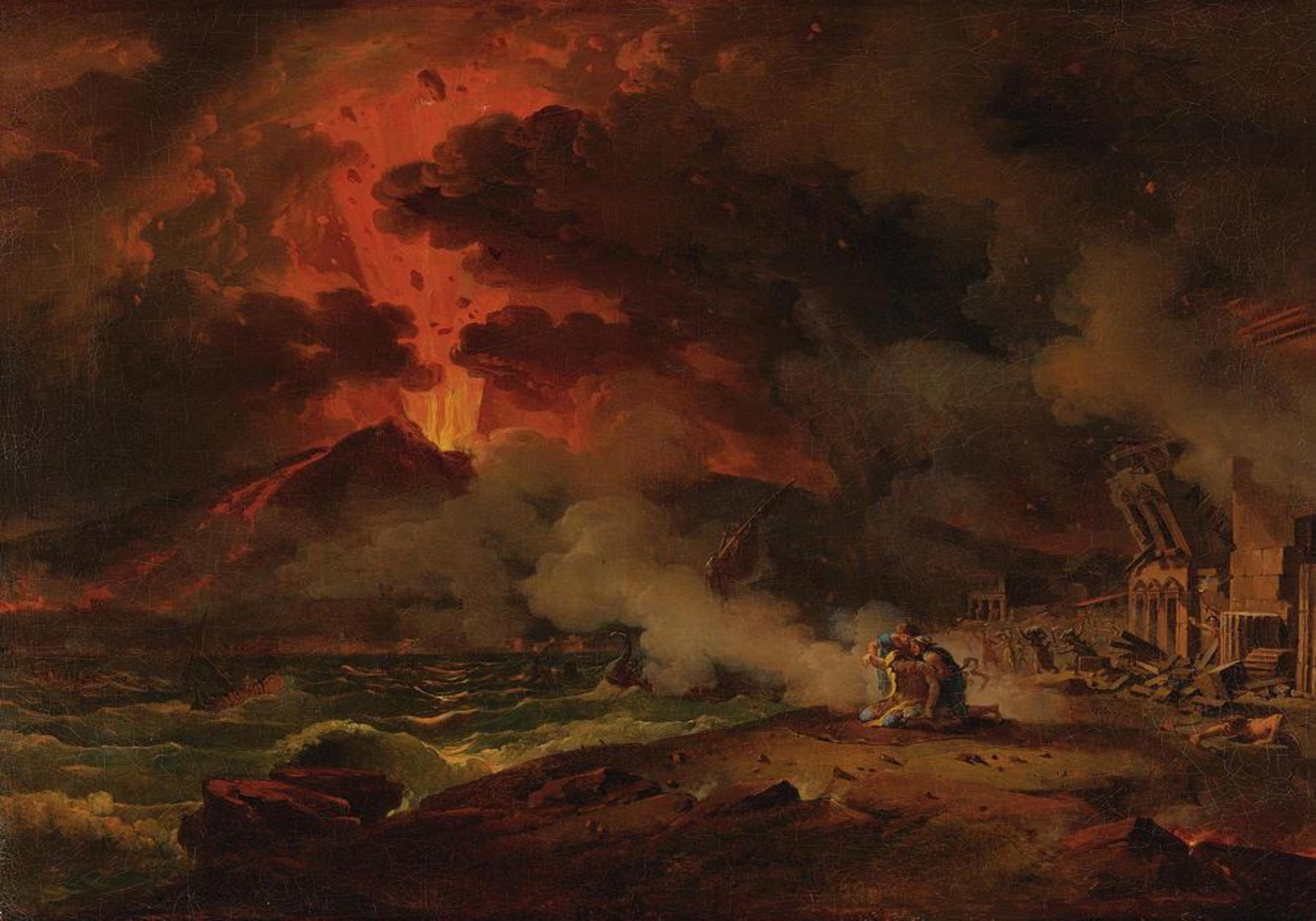
Pierre-Henri de Valenciennes - Erupția Vezuviului