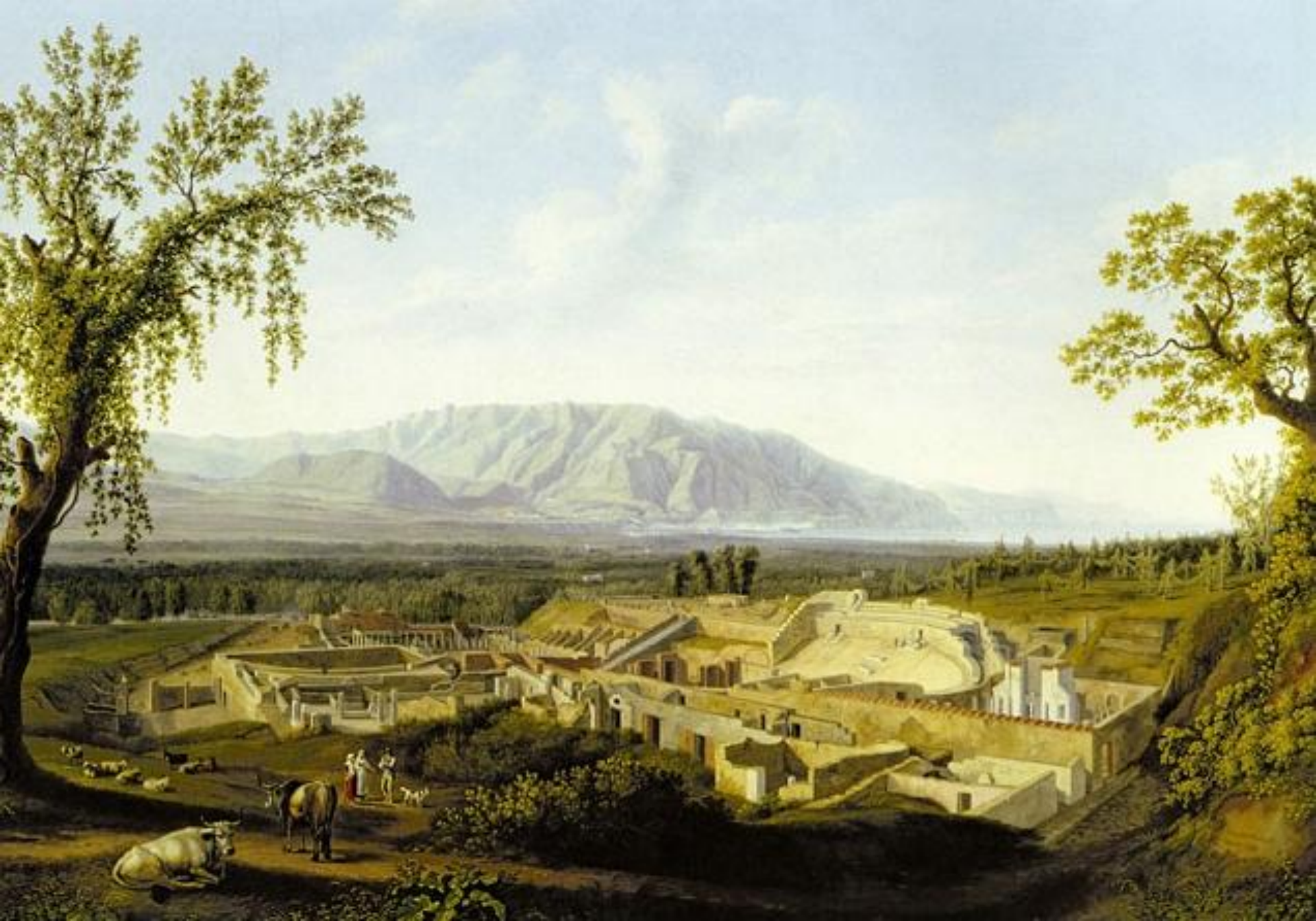
Situl arheologic Pompeii (Italia, secolul al XIX-lea)