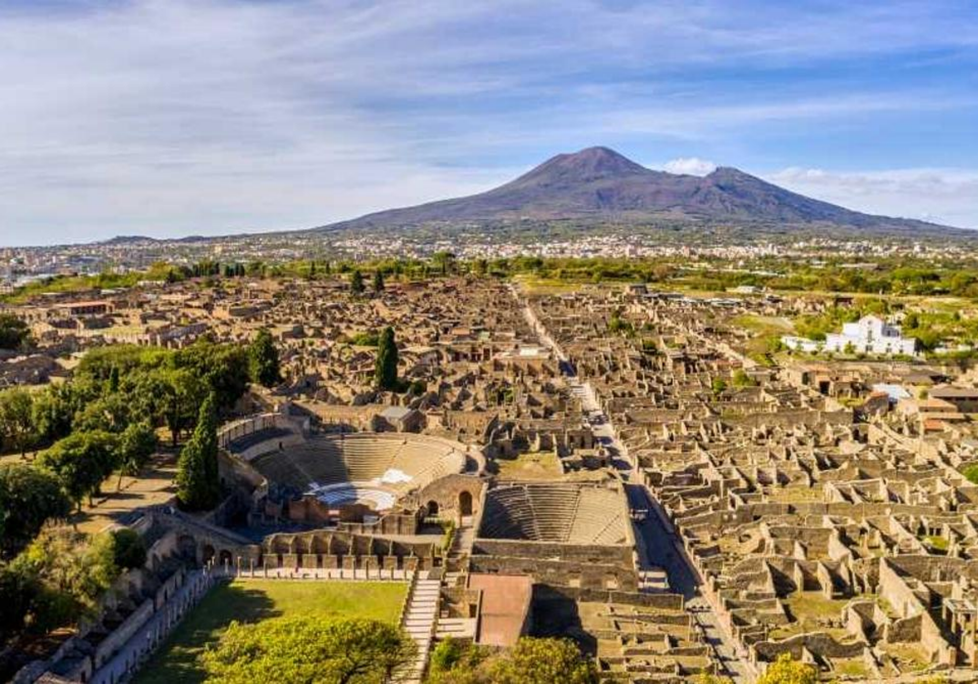
Şantierul arheologic Pompeii (Italia, 2022)