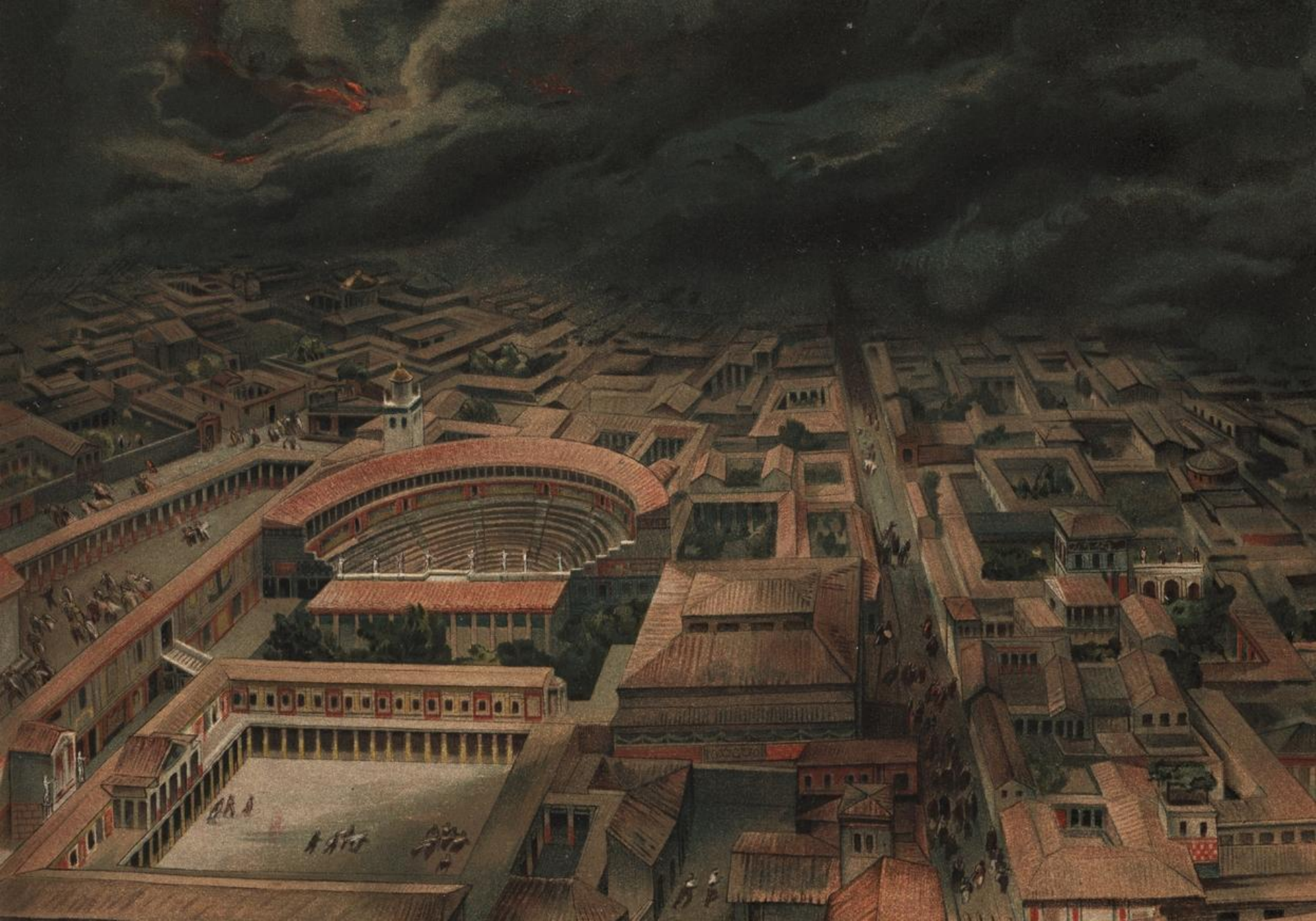
Norul de cenușă acoperă orașul Pompeii (reconstituire)