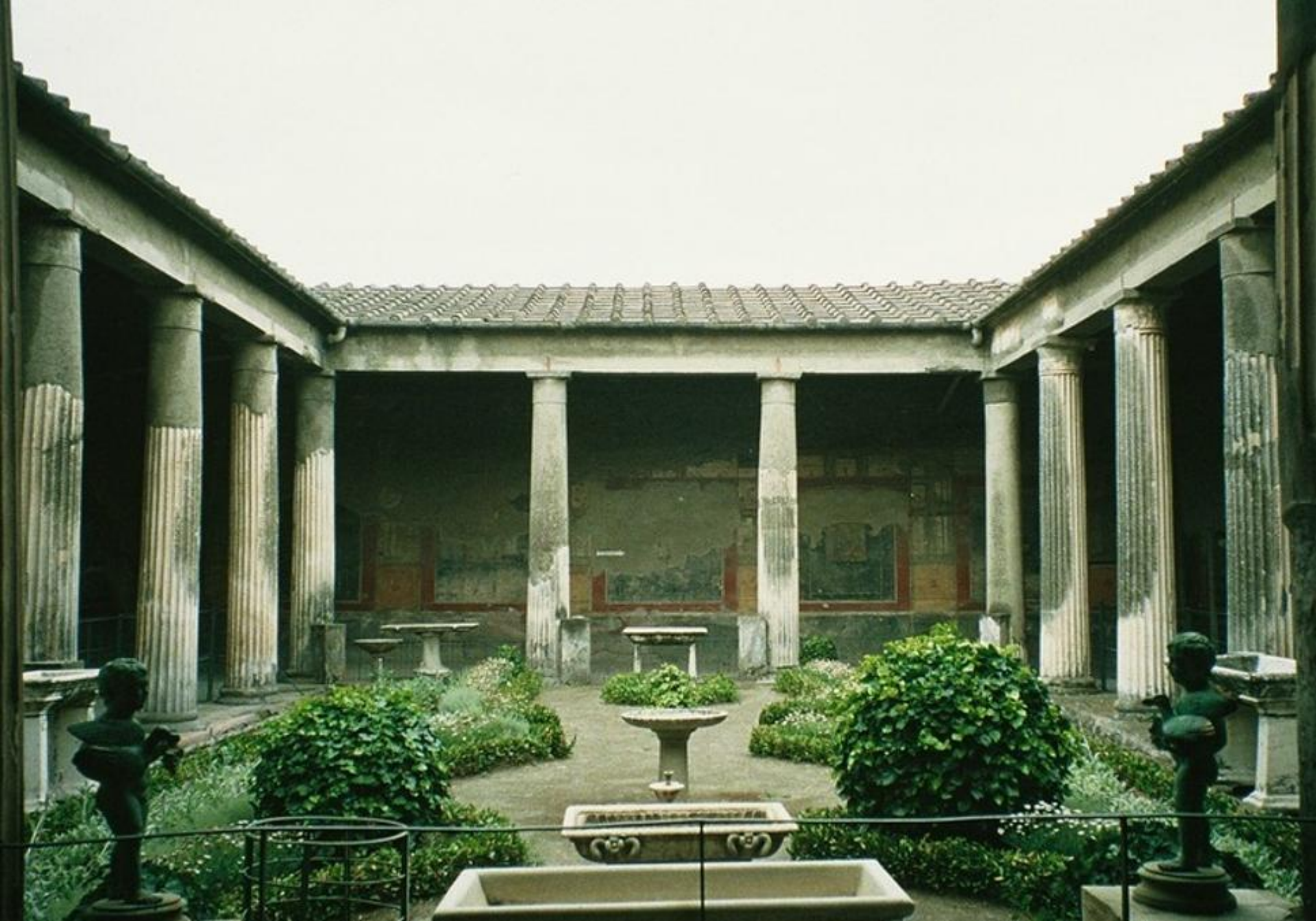
Casa Vettii, locuința unui aristocrat din Pompeii (Italia, 2021)