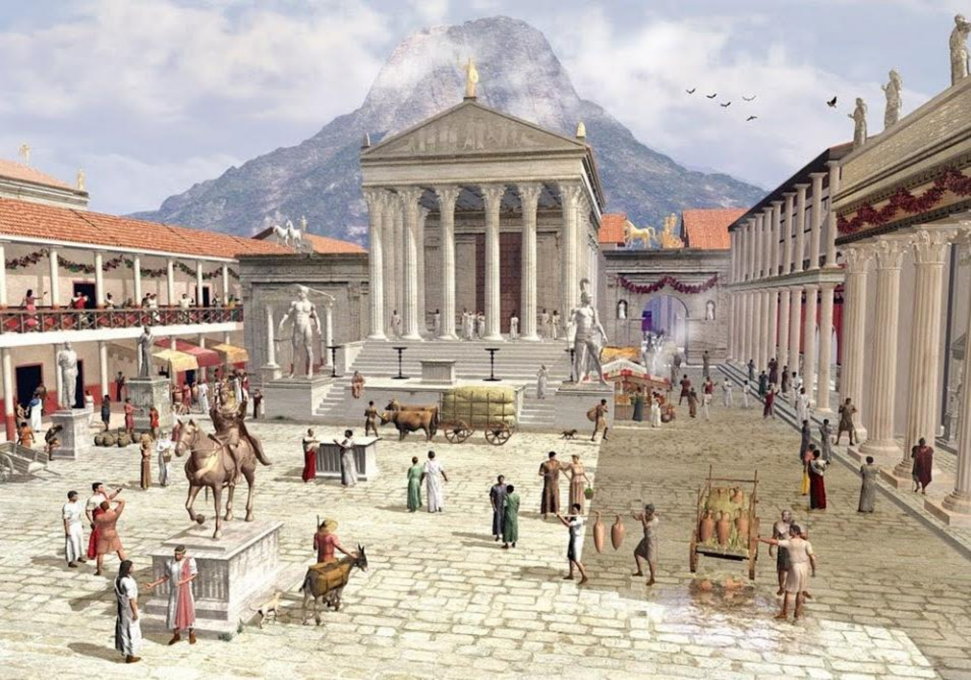
Forul din Pompeii (reconstituire)