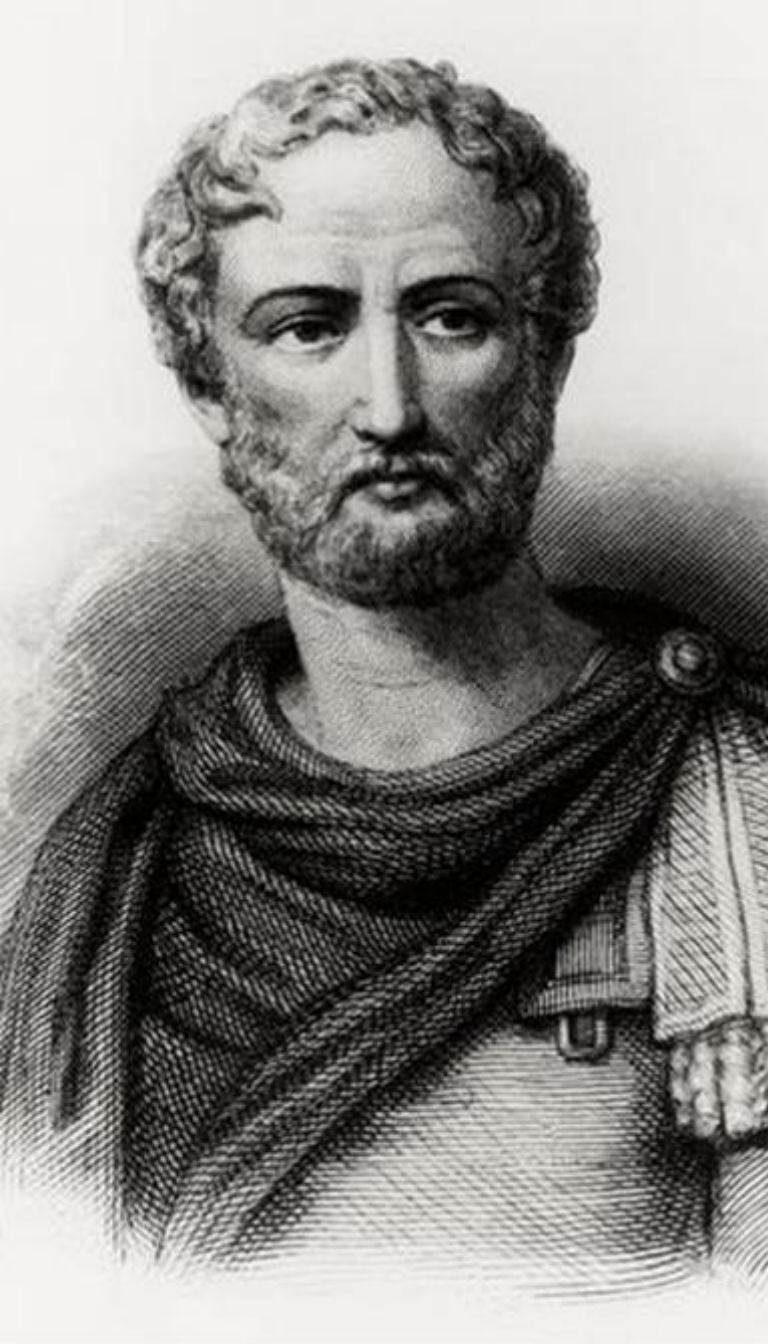
Plinius cel Tânăr