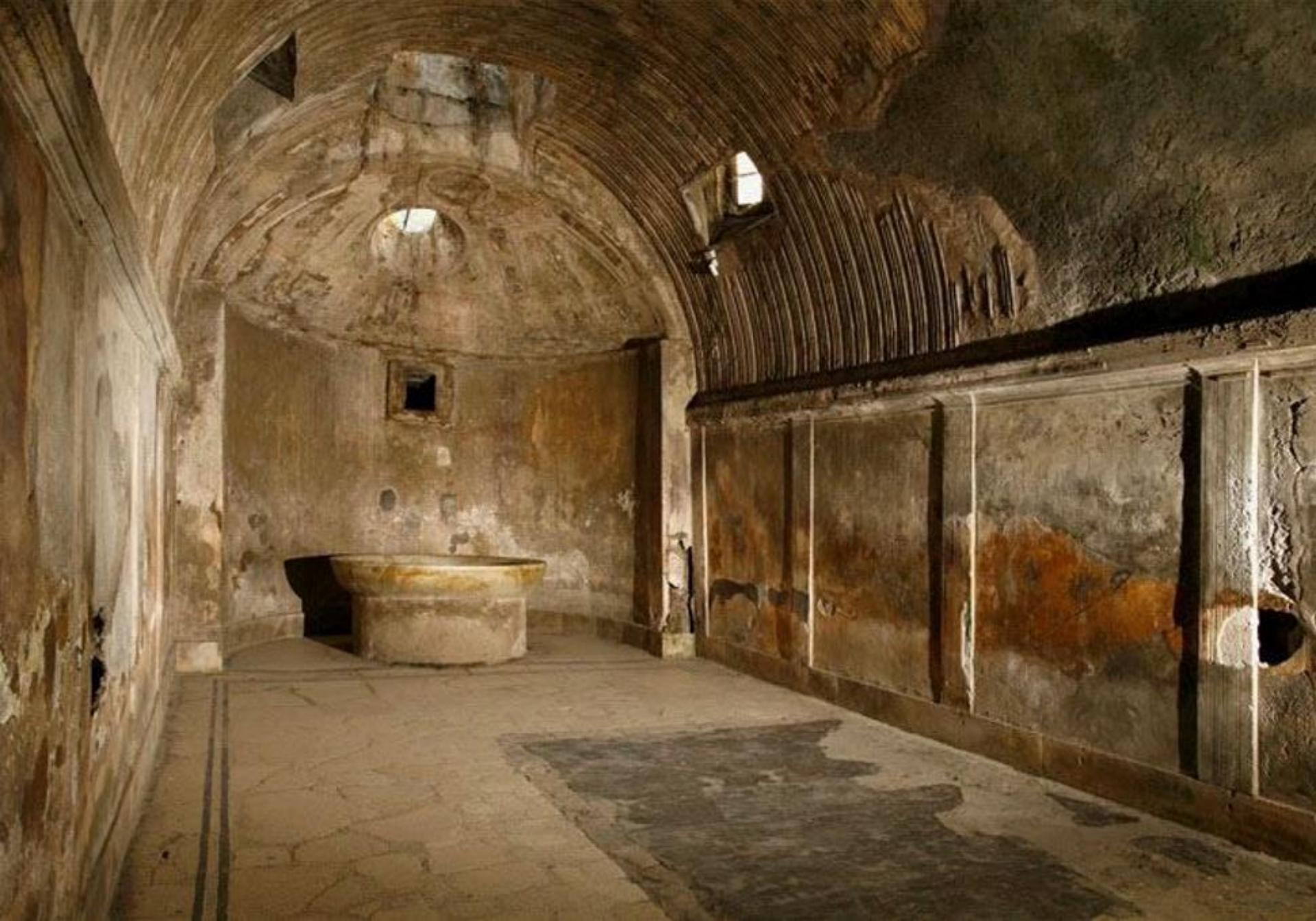
Clădirea termelor din Pompeii (Italia, 2021)