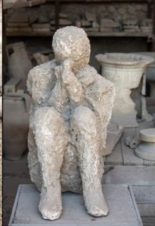
Locuitori din Pompeii surprinși de erupția Vezuviului