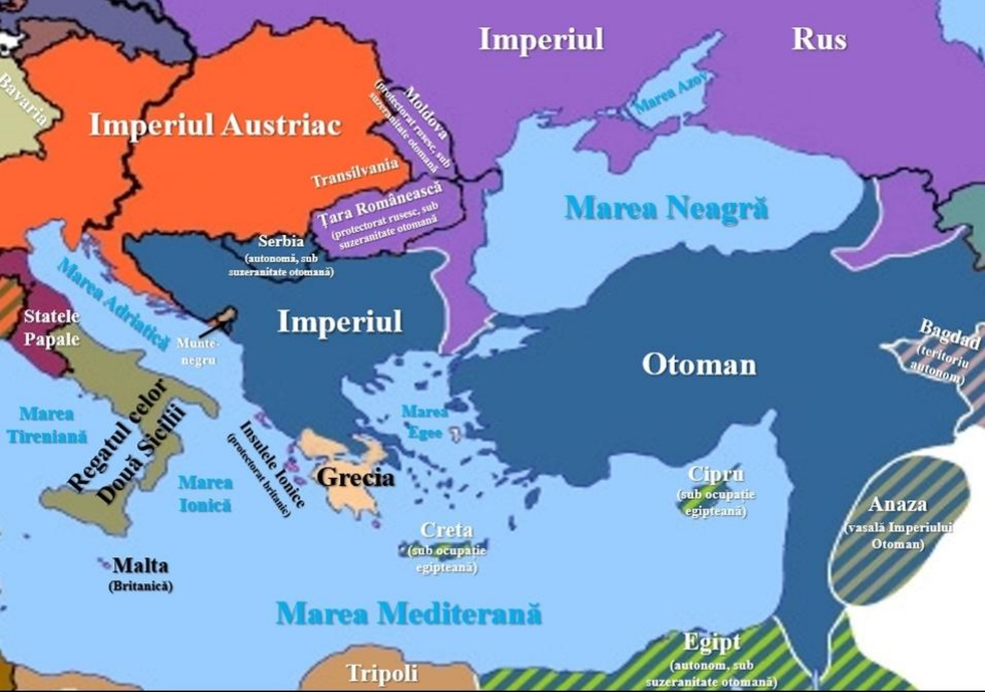
Imperiul Otoman (1829)