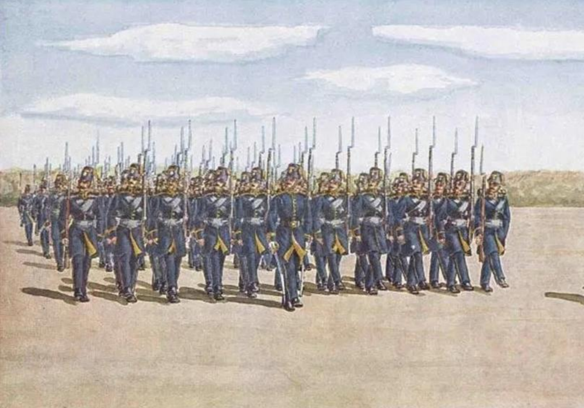
Regimentul 2 Infanterie (Țara Românească, 1831)