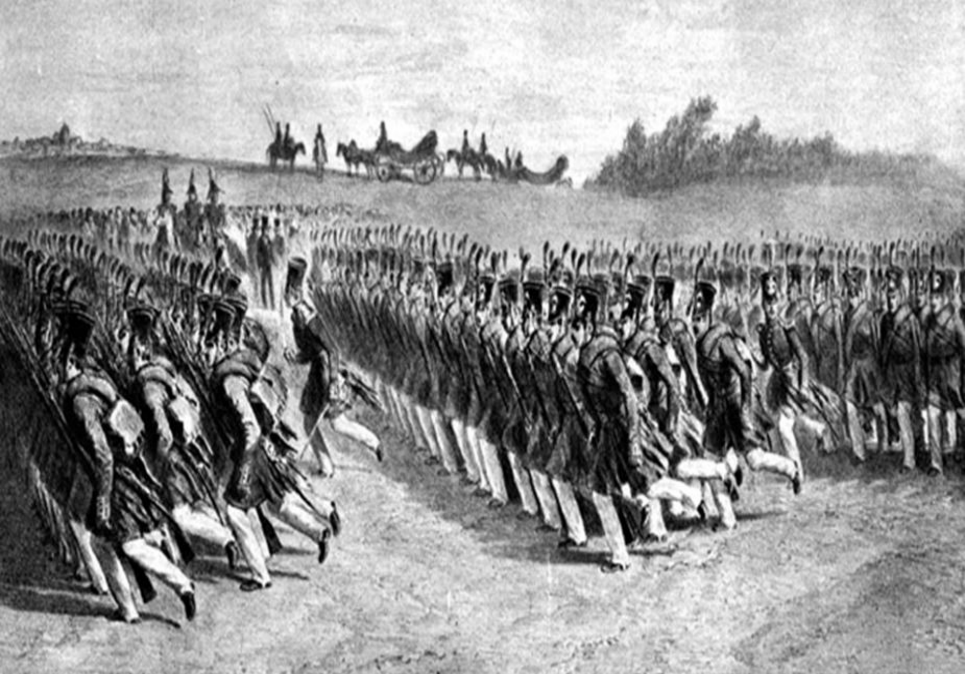
Milițiile pământene din Principatele Române