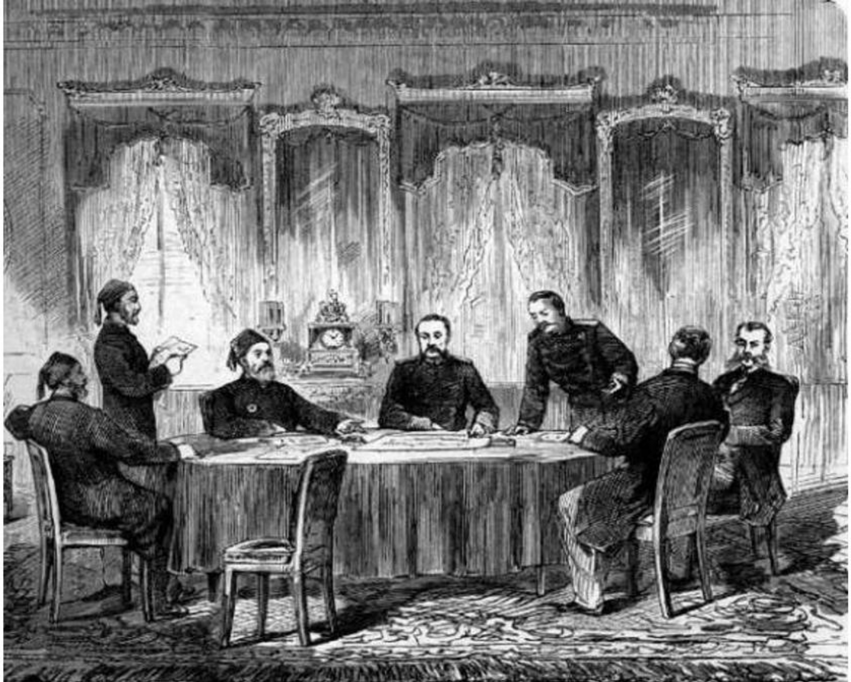
Semnarea Tratatului de pace de la Adrianopol (Turcia, 14 septembrie 1829)