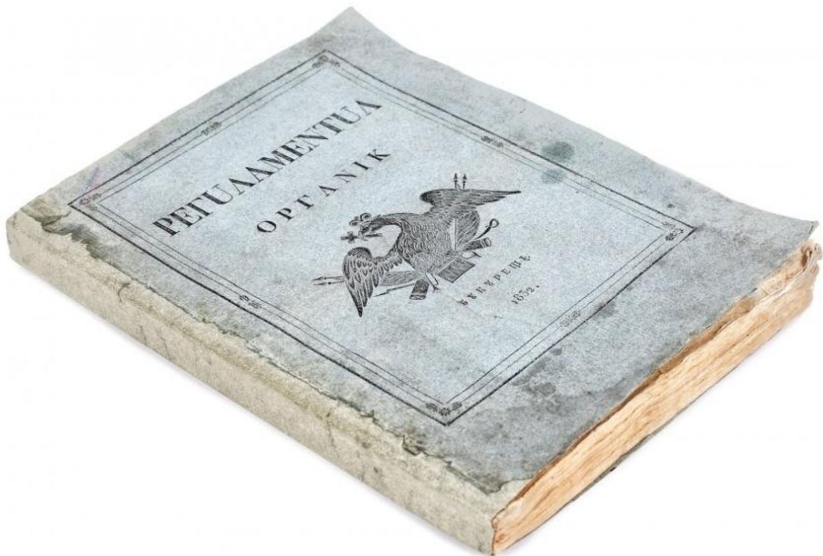
Exemplar din Regulamentele Organice (prima ediție, 1832)