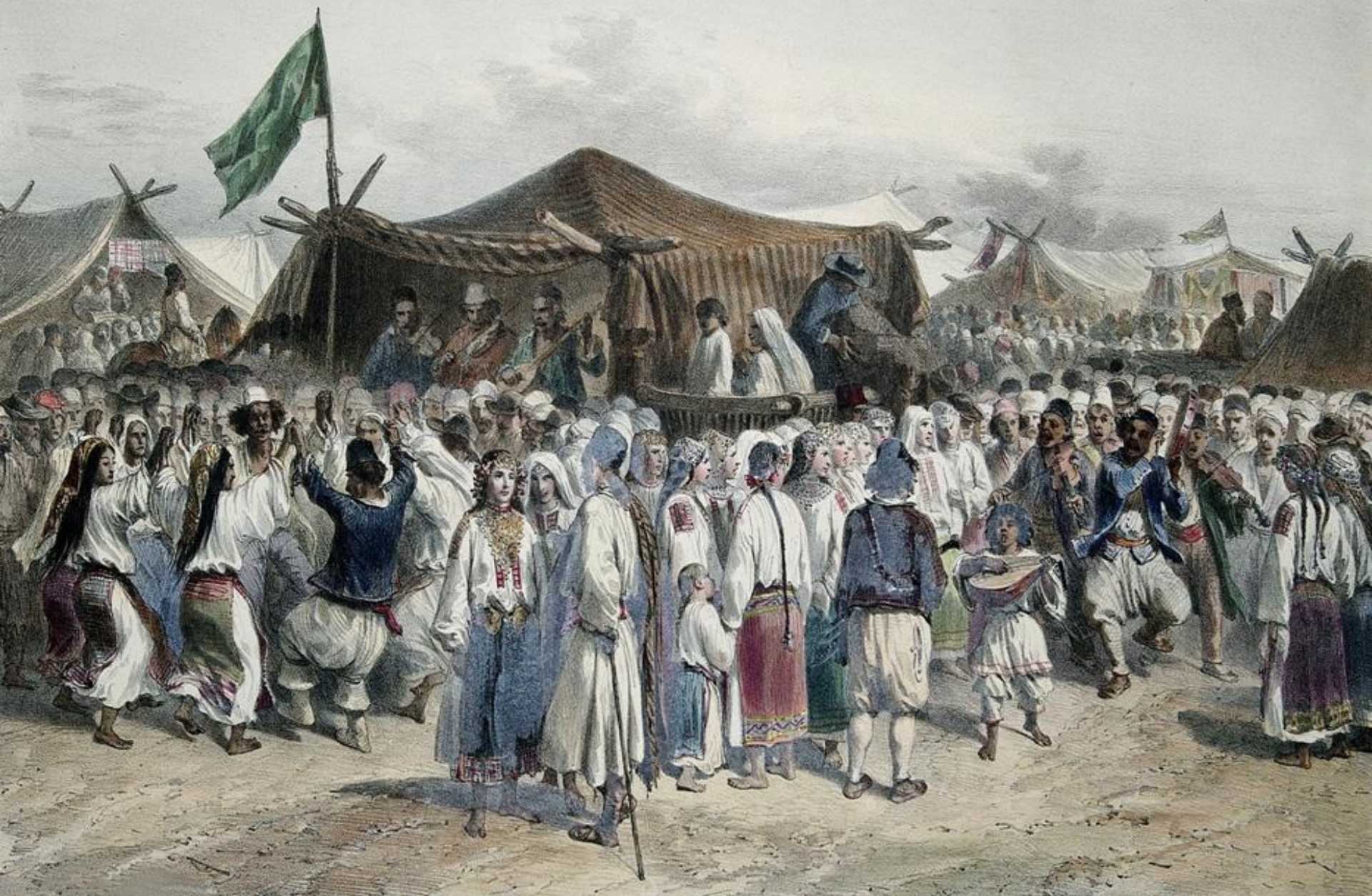
Târg țărănesc în Țara Românească (Giurgiu, 1837)