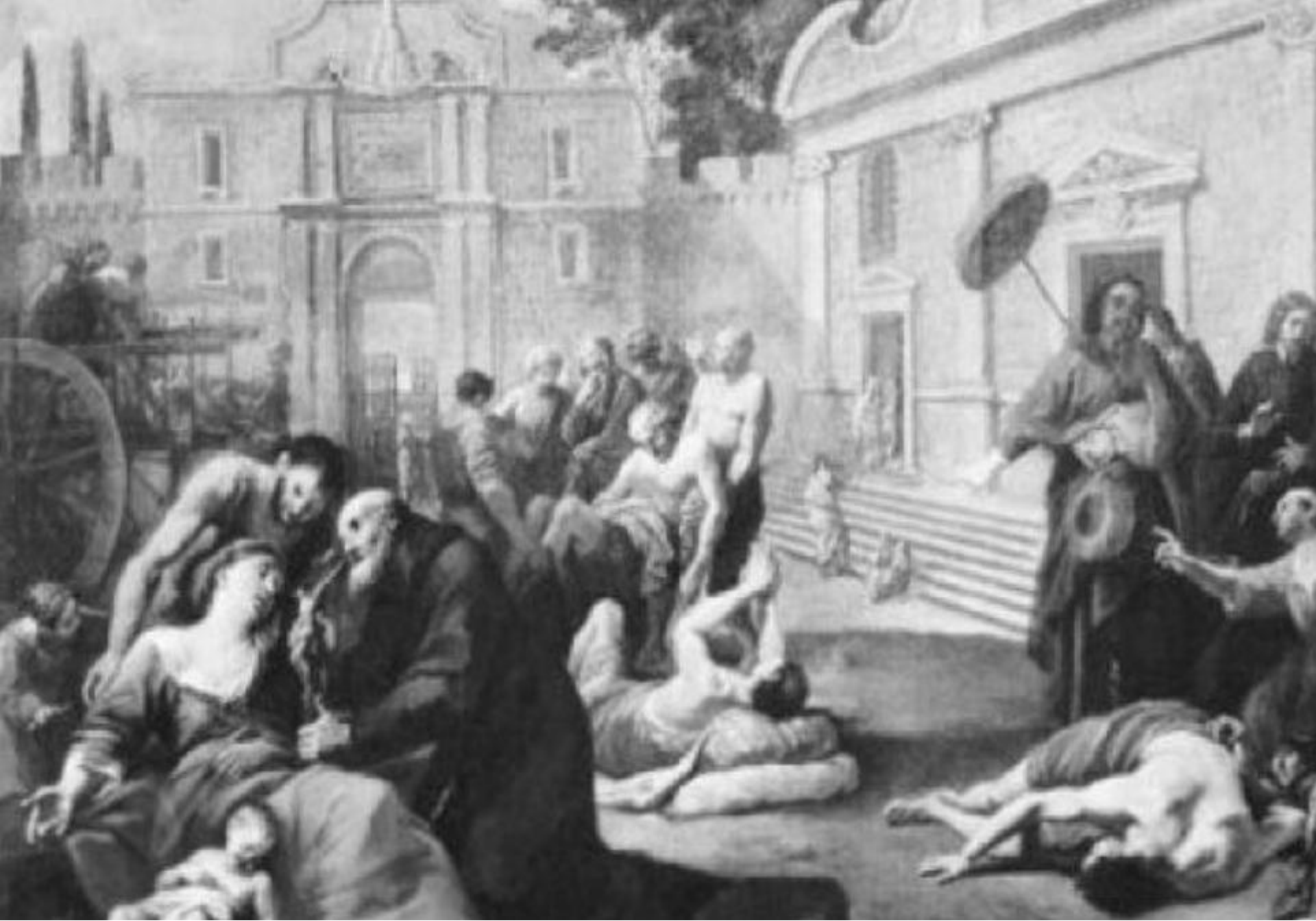
Holera în Principatele Române: peste 12.000 de victime (1829-1832)