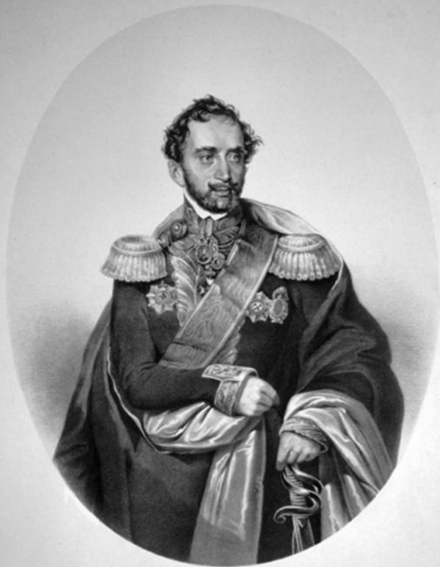
Alexandru al II-lea Ghica