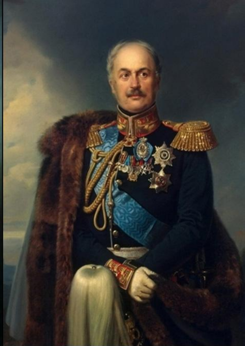
Pavel Dmitrievici Kiseleff