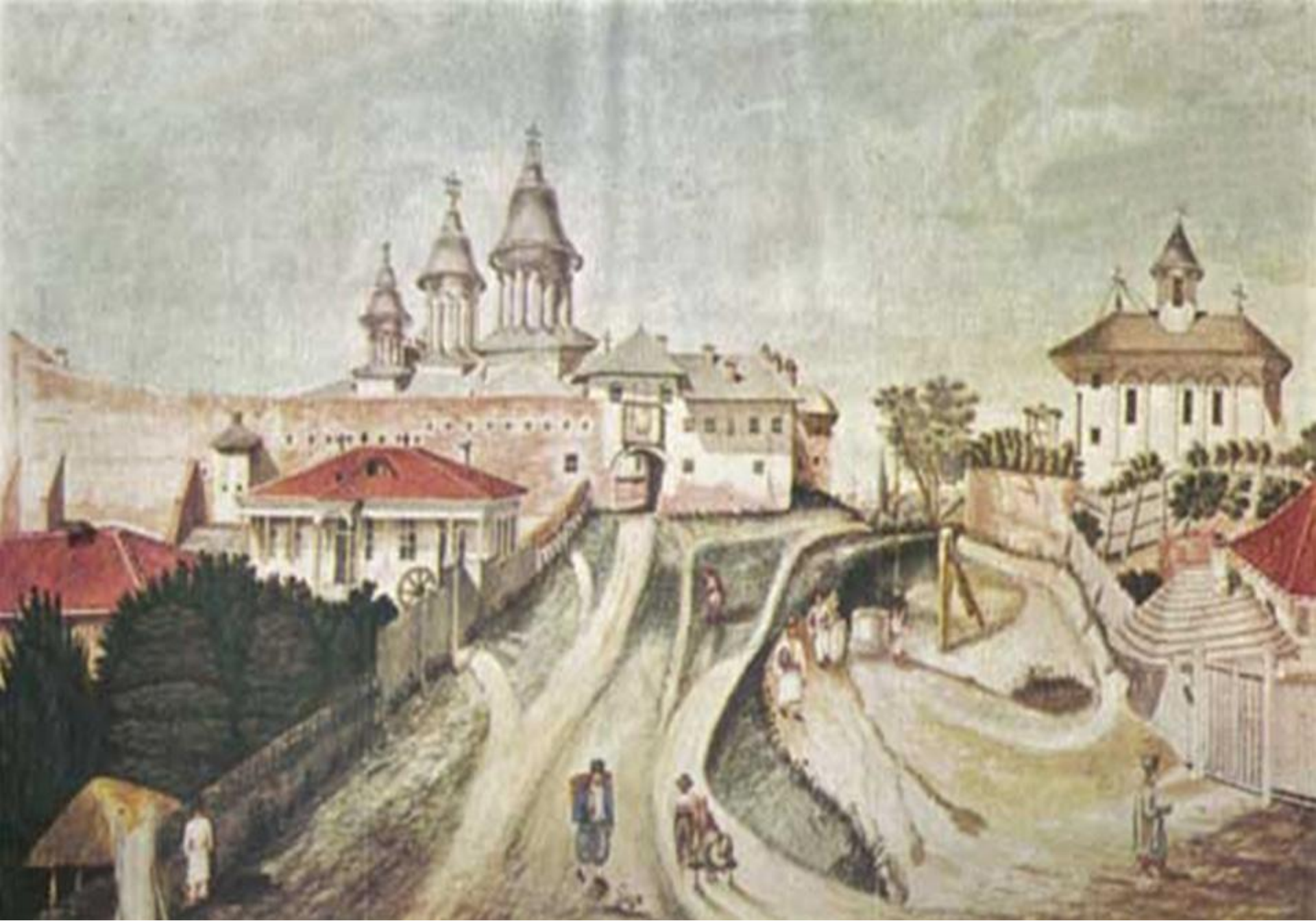
București, mahalaua Radu Vodă (1830)