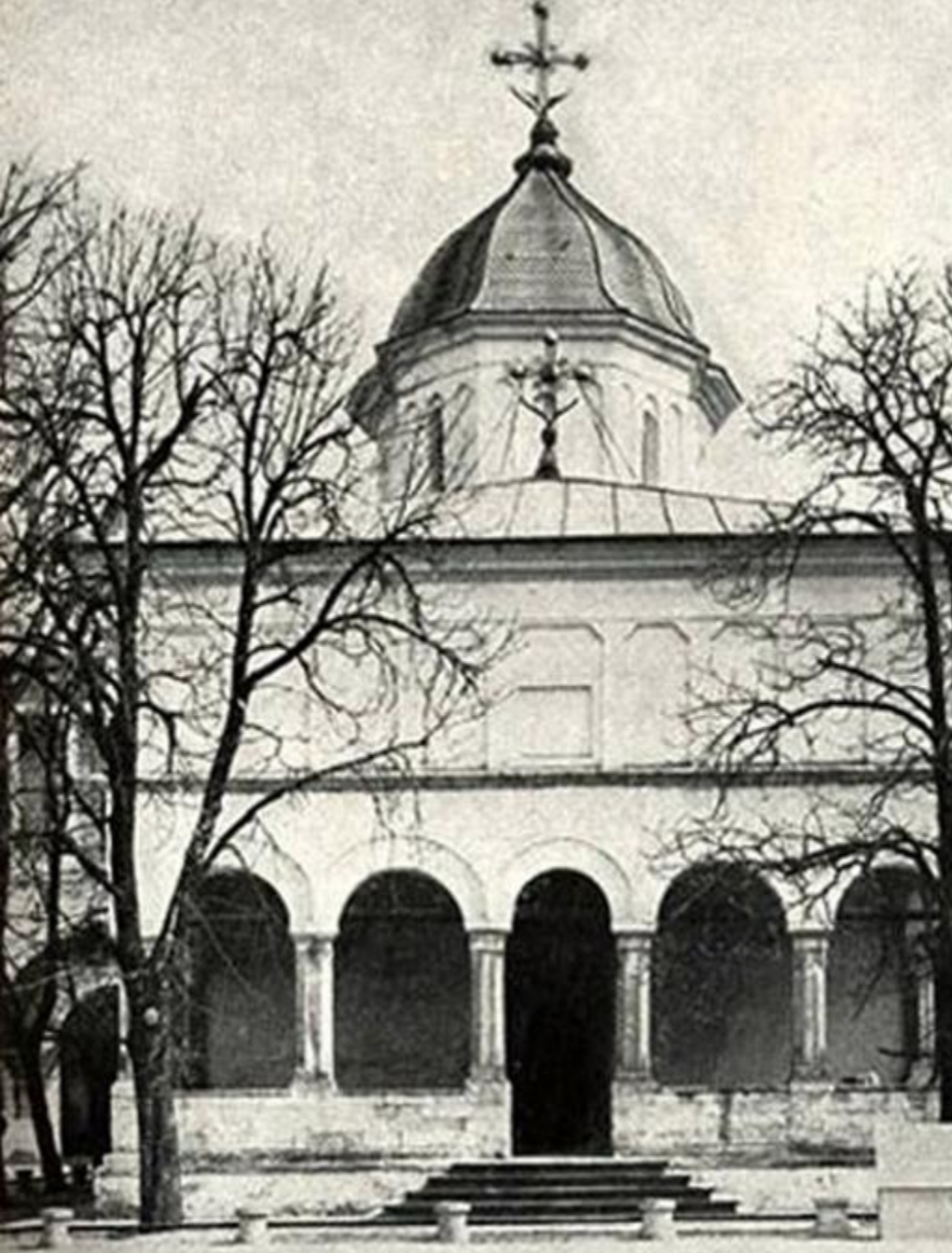
Mănăstirea Cotroceni (București)