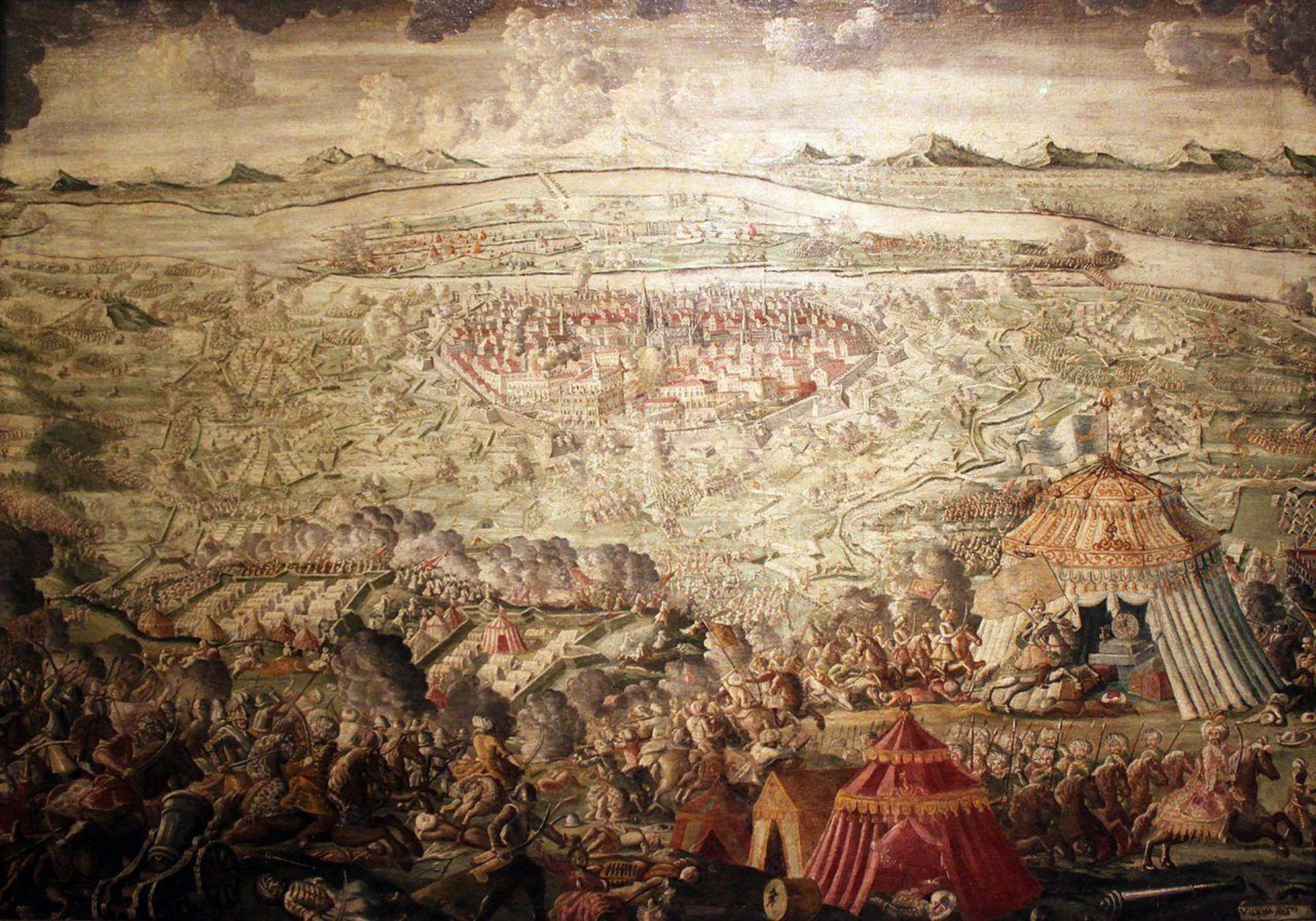
Al doilea asediu otoman al Vienei (Austria, 1683)