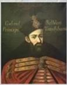
Gabriel Bethlen 1613-1629 Principe al Transilvaniei