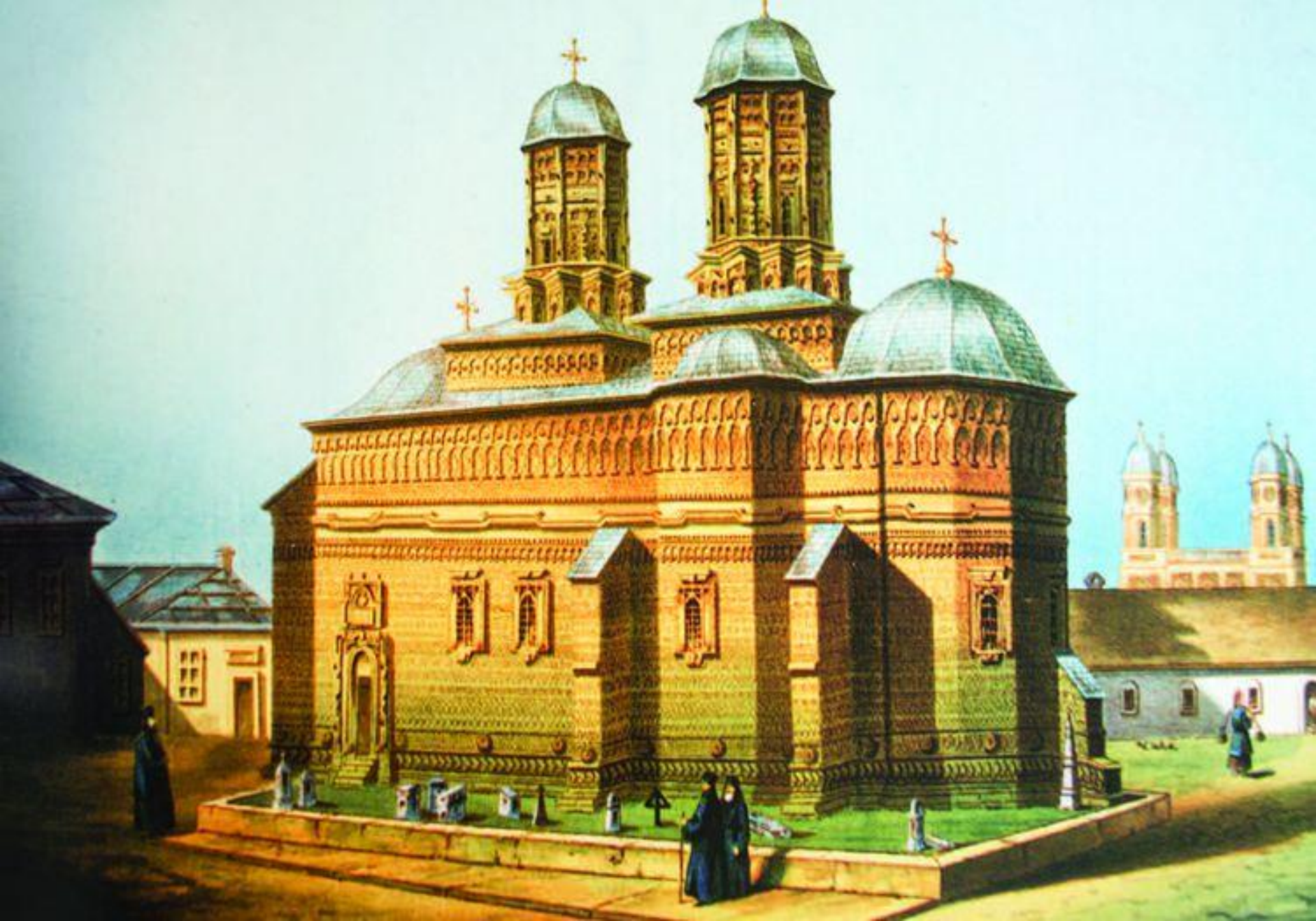
Mănăstirea „Sfinții Trei Ierarhi” (Iași)