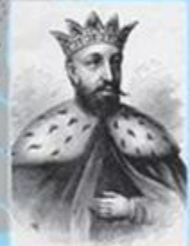
Șerban Cantacuzino 1678-1688 Țara Românească