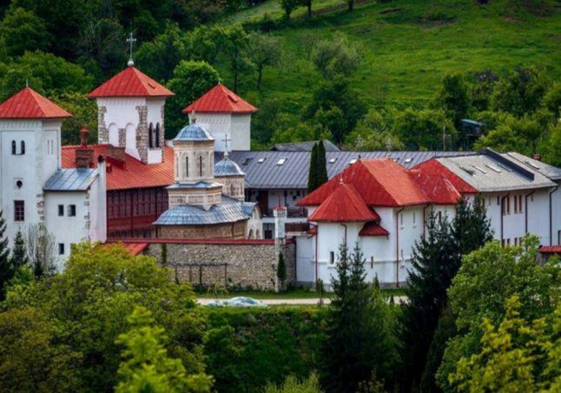
Mănăstirea Arnota (sat Bistrița, județul Vâlcea)