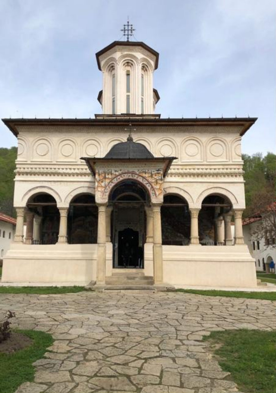
Mănăstirea Hurezi (Horezu, județul Vâlcea)