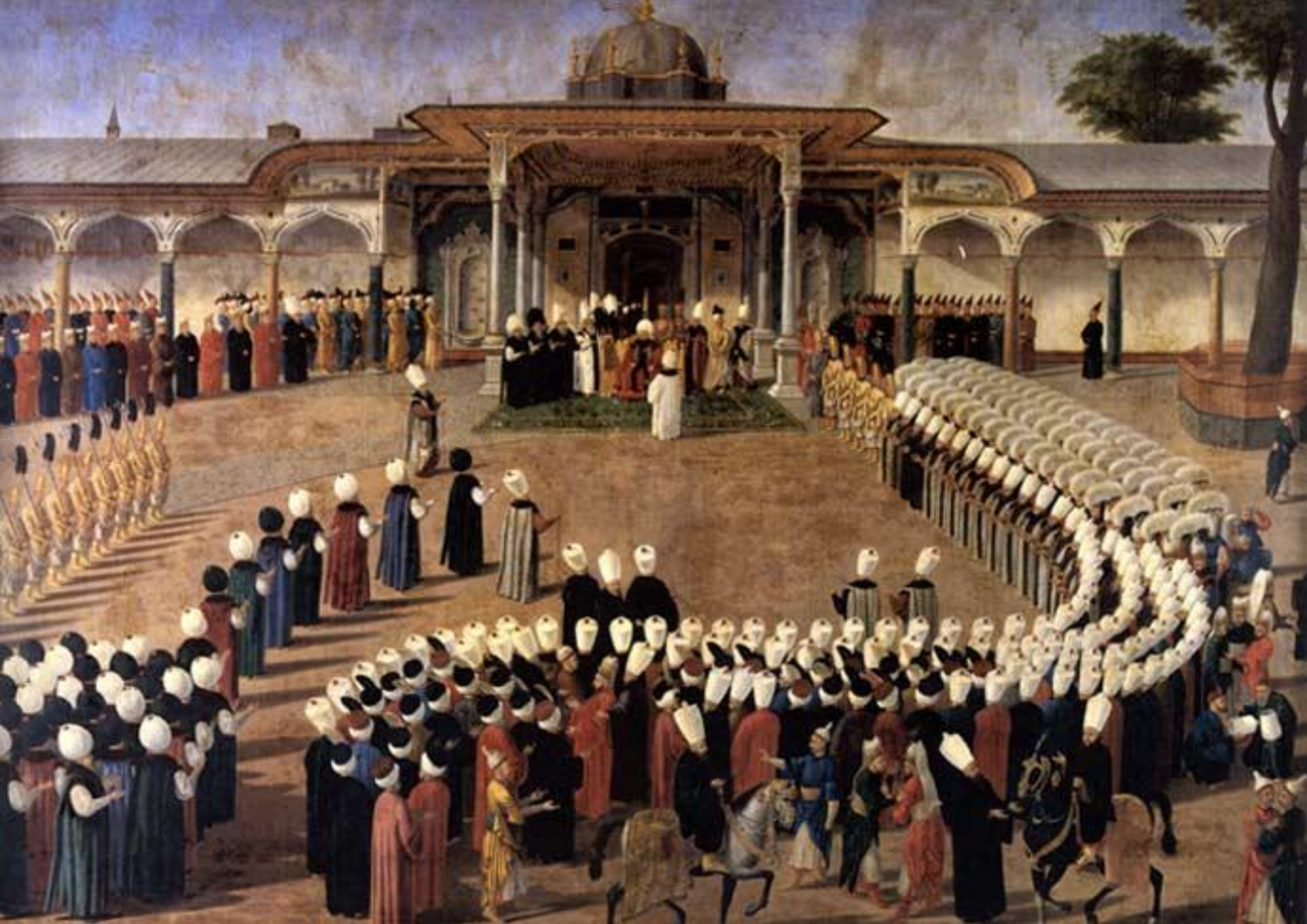
Plata tributului în perioada sultanului Selim al III-lea (Turcia, secolul al XVII-lea)