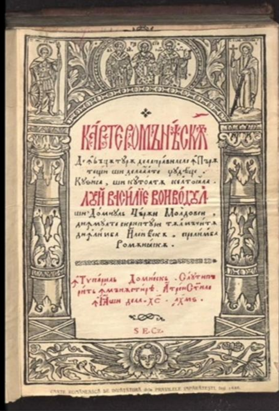
Carte românească de învățătură (1646)