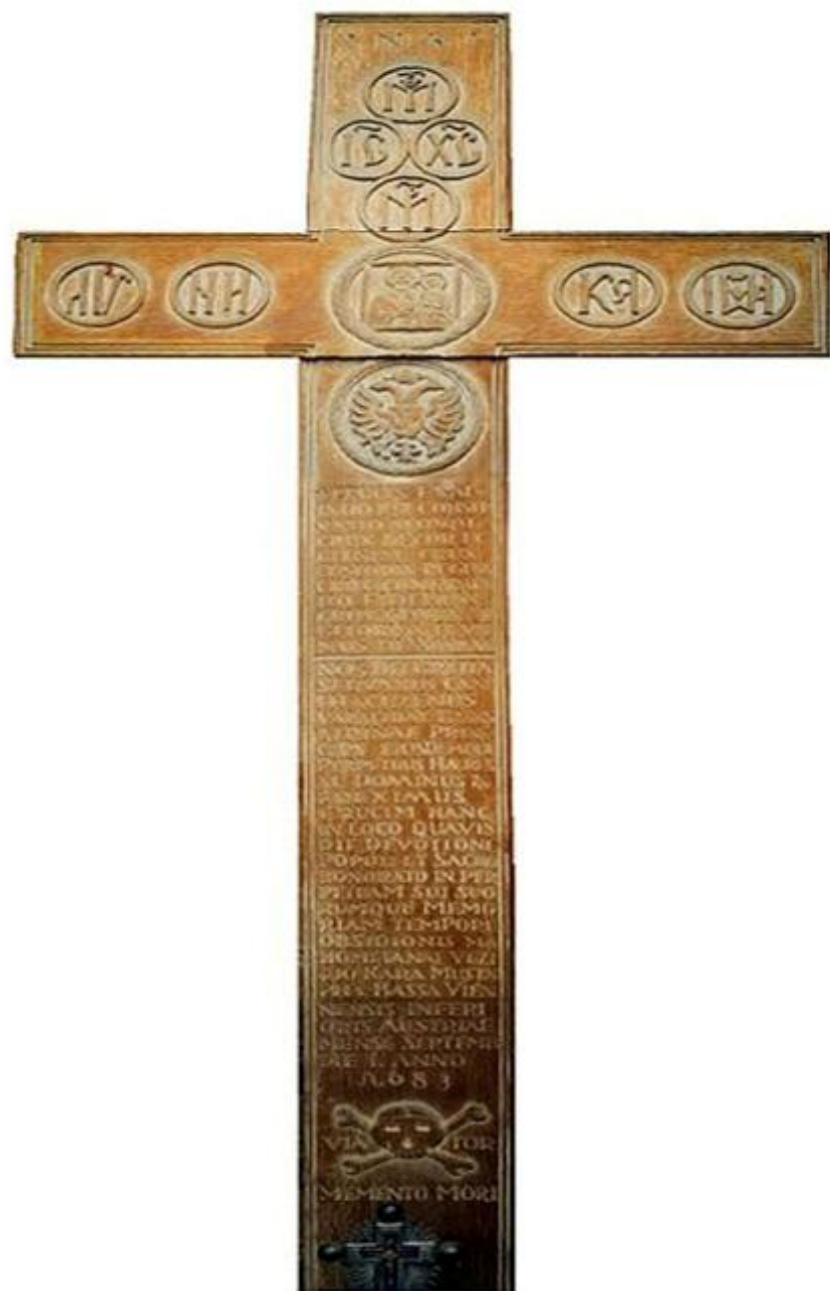
Replica crucii ridicată de Șerban Cantacuzino la Viena (1683)