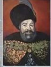
Vasile Lupu 1634-1653 Moldova