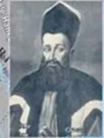
Constantin Cantemir 1685-1693 Moldova