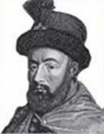
Gheorghe Rákóczi al II-lea 1648-1657, 1659-1660 Principe al Transilvaniei