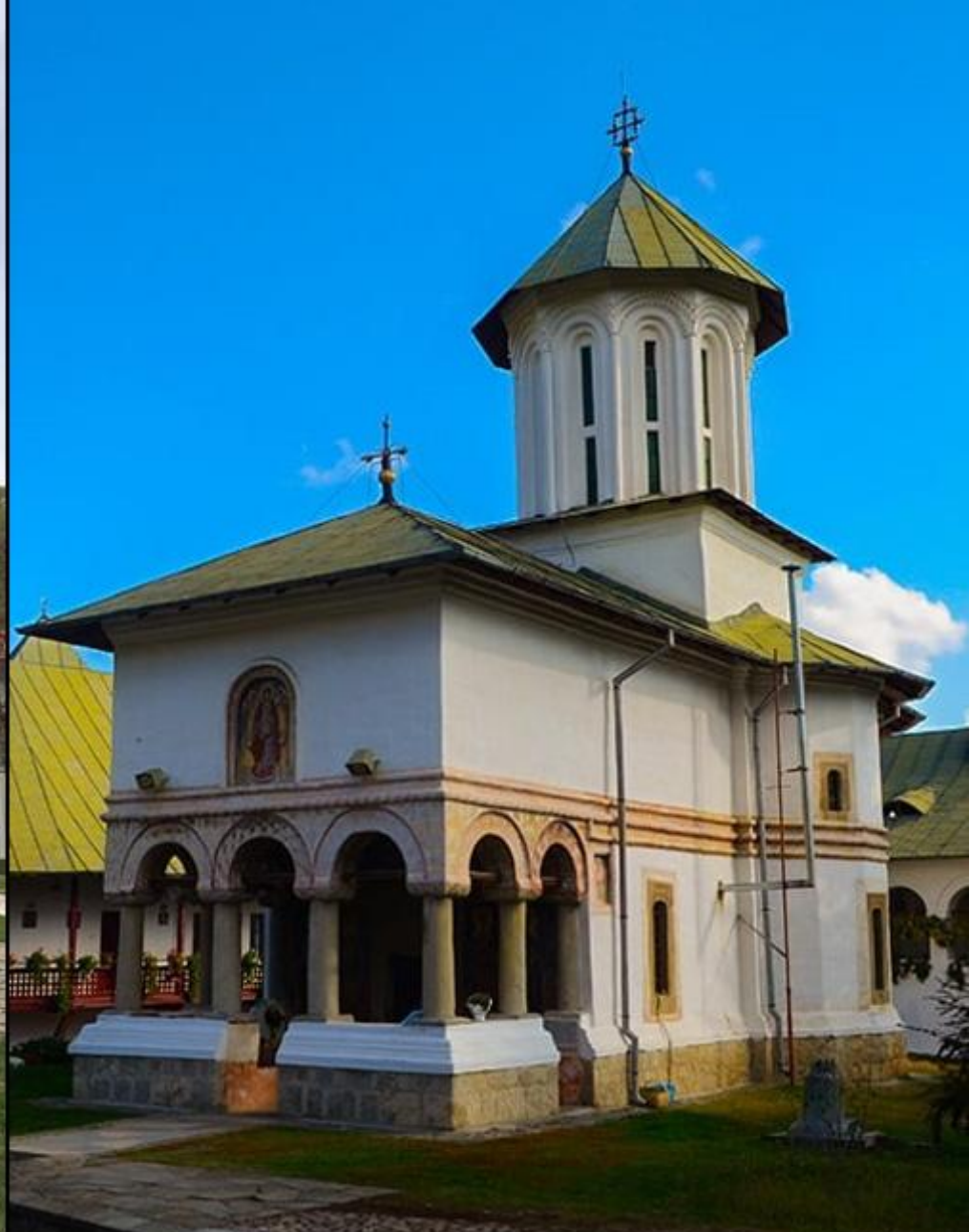
Mănăstirea Govora (comuna Mihăești, județul Vâlcea)