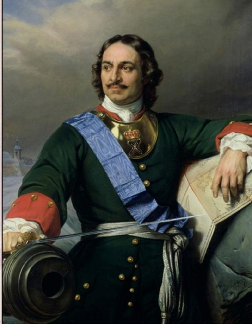
Petru I cel Mare