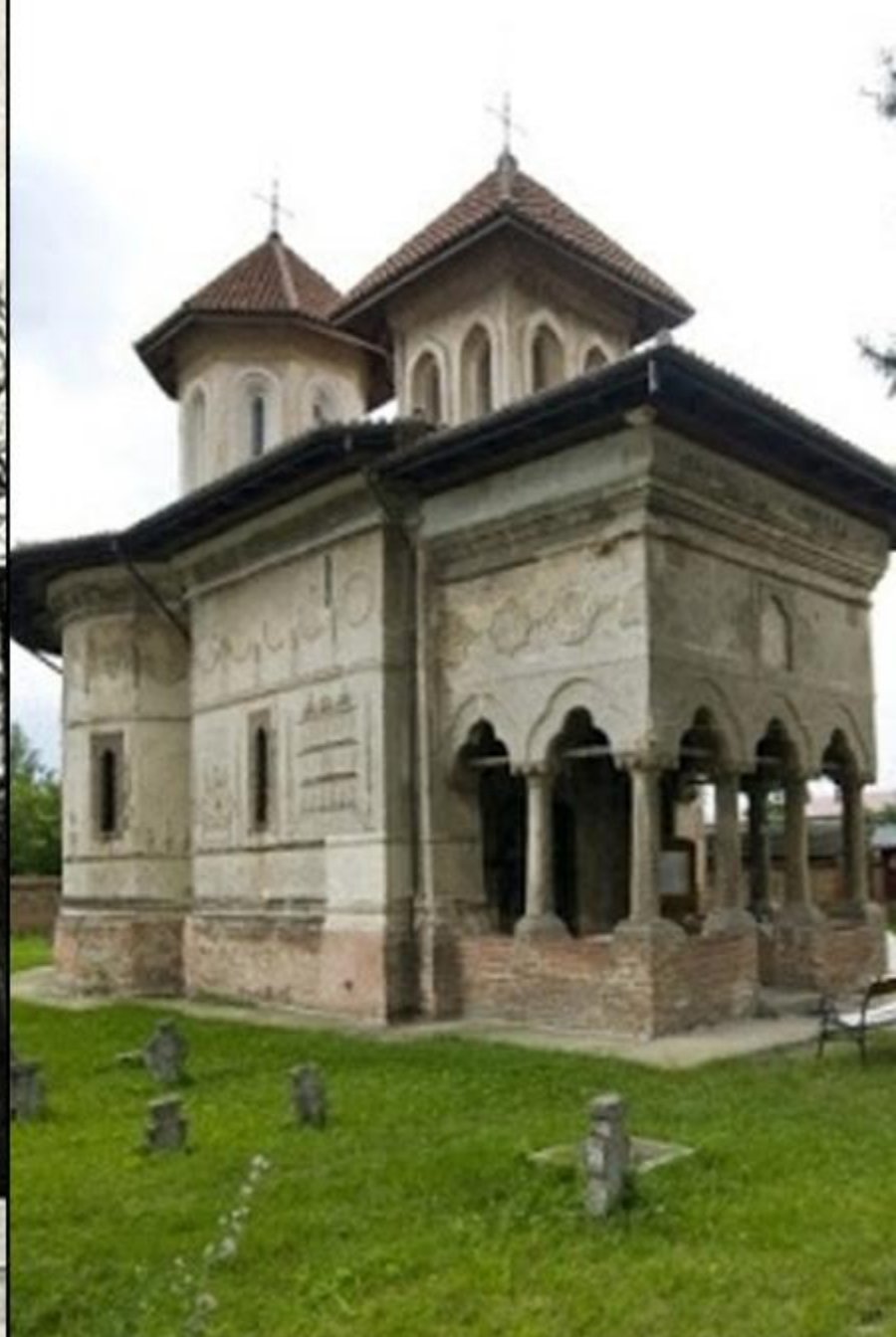
Biserica Fundenii Doamnei (Fundeni)