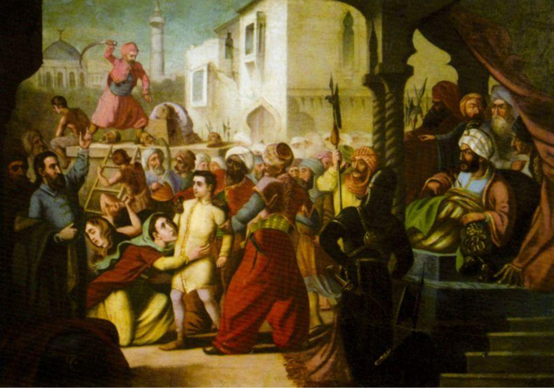
Constantin Lecca - Uciderea Brâncovenilor