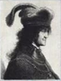
Gheorghe Rákóczi I 1630-1648 Principe al Transilvaniei