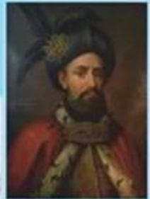
Constantin Brâncoveanu 1688-1714 Țara Românească