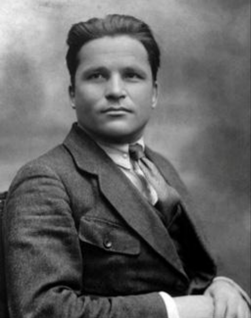
Serghei Mironovici Kirov