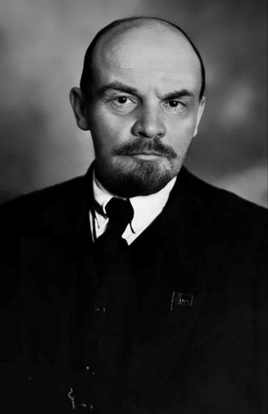
Vladimir Ilici Lenin