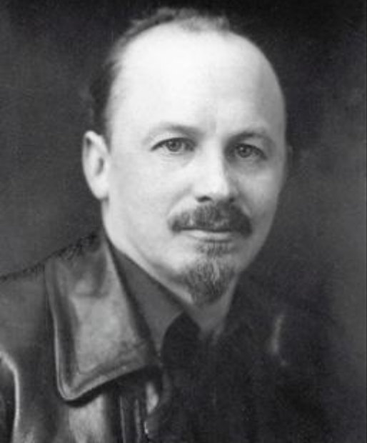
Nikolai Ivanovici Buharin