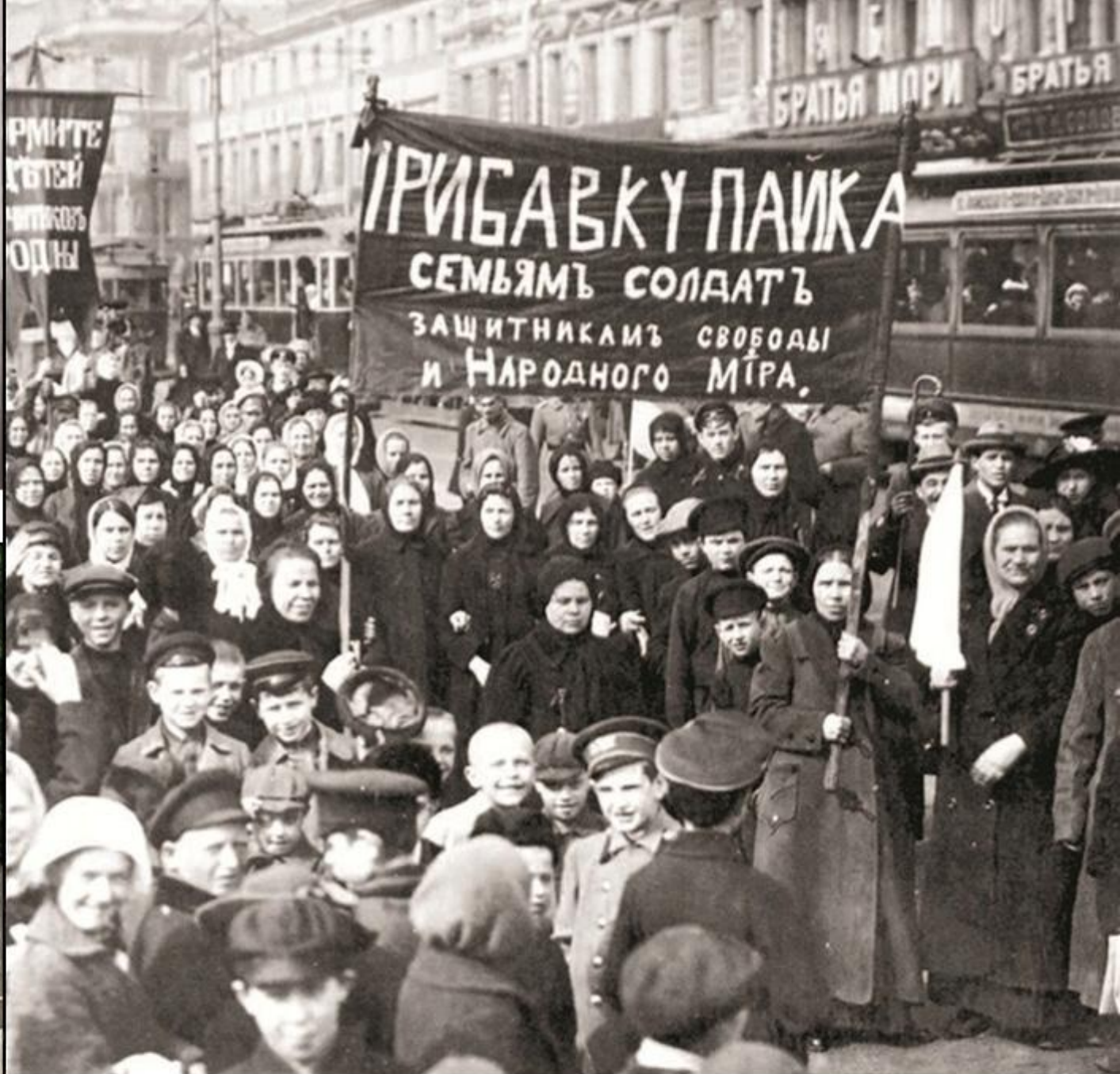
Revoluția din Petrograd (Federația Rusă, februarie 1917)