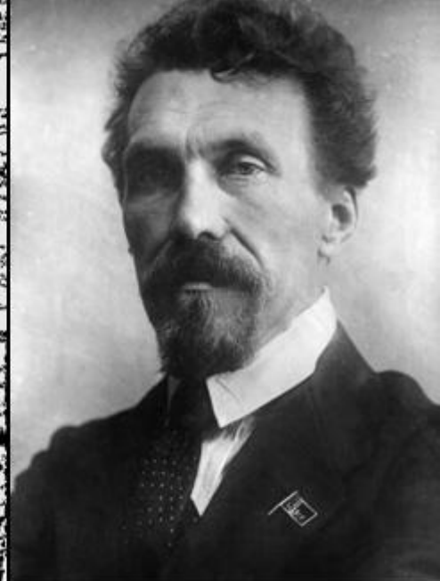
Alexei Ivanovici Rîkov