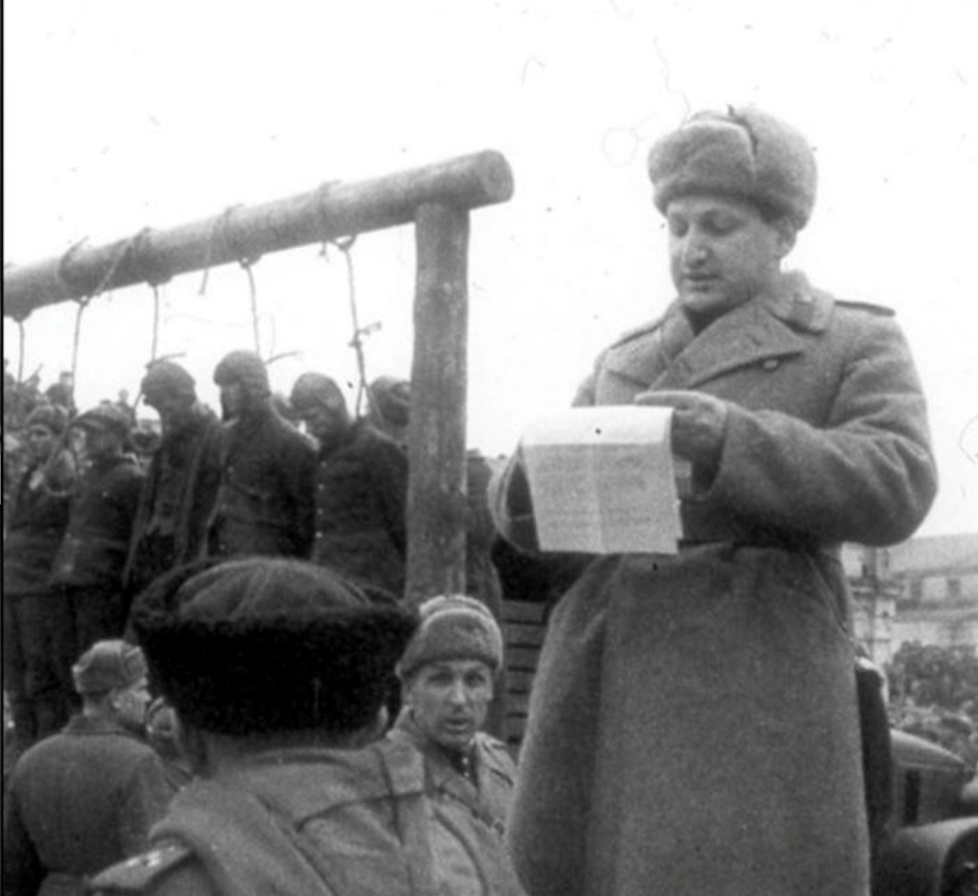
Execuția unor ofițeri din Armata Roșie acuzați de trădare (Federația Rusă, 1937)