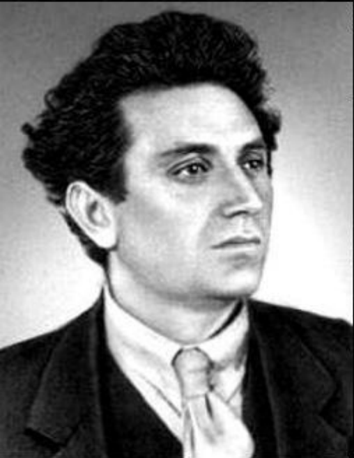
Grigori Evseevici Zinoviev