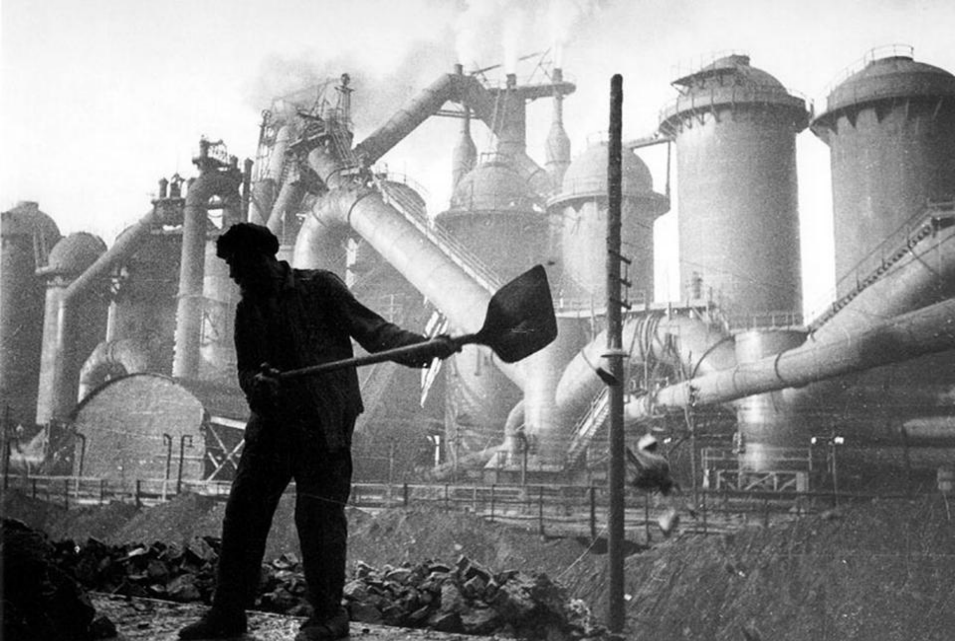
Construcția orașului minier și industrial Magnitogorsk, din regiunea Munților Ural (Federația Rusă, 1930)