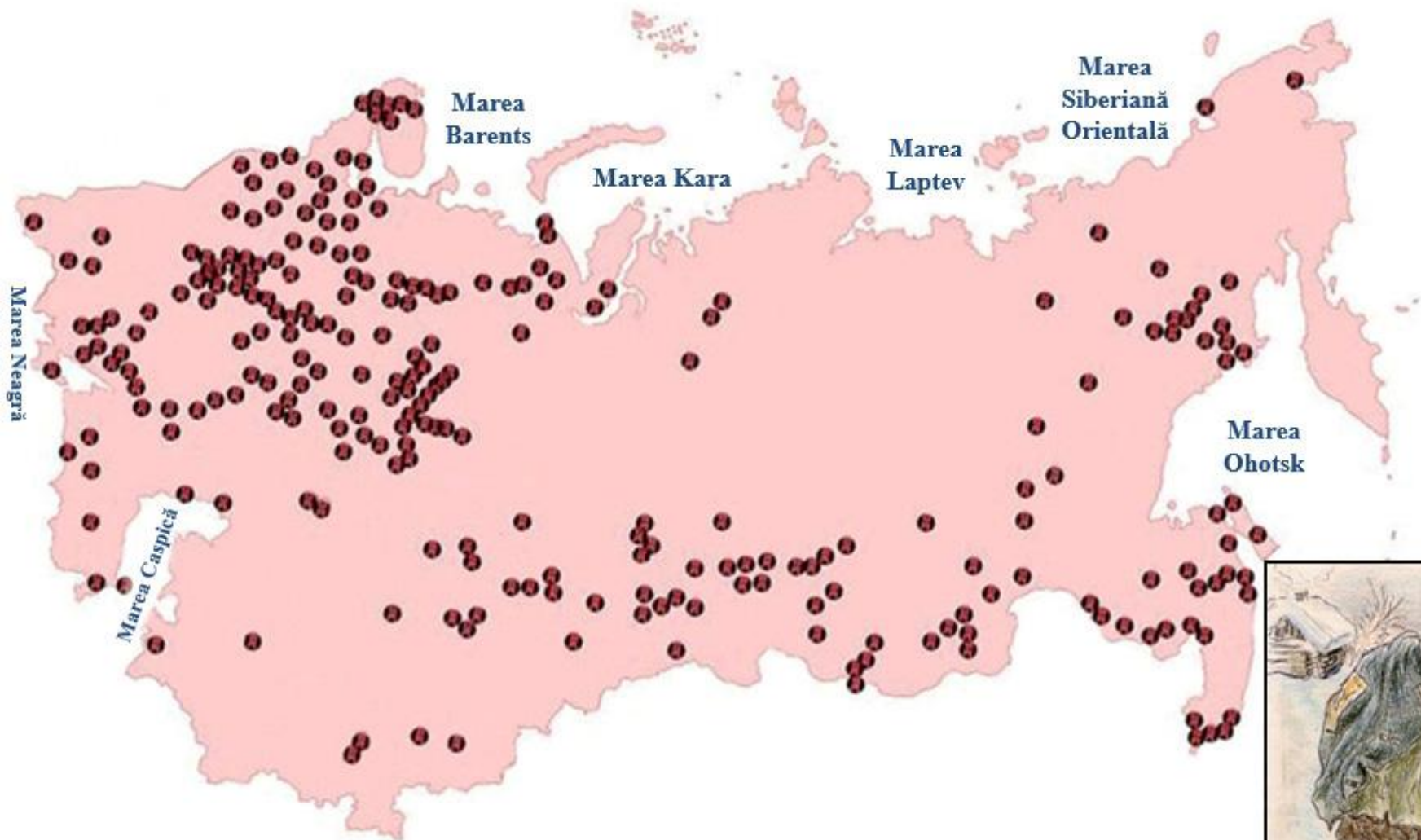
Gulag: rețeaua de lagăre și colonii de muncă forțată din cadrul U.R.S.S. (1938)