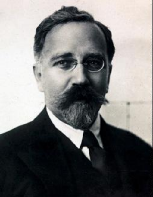
Lev Borisovici Kamenev