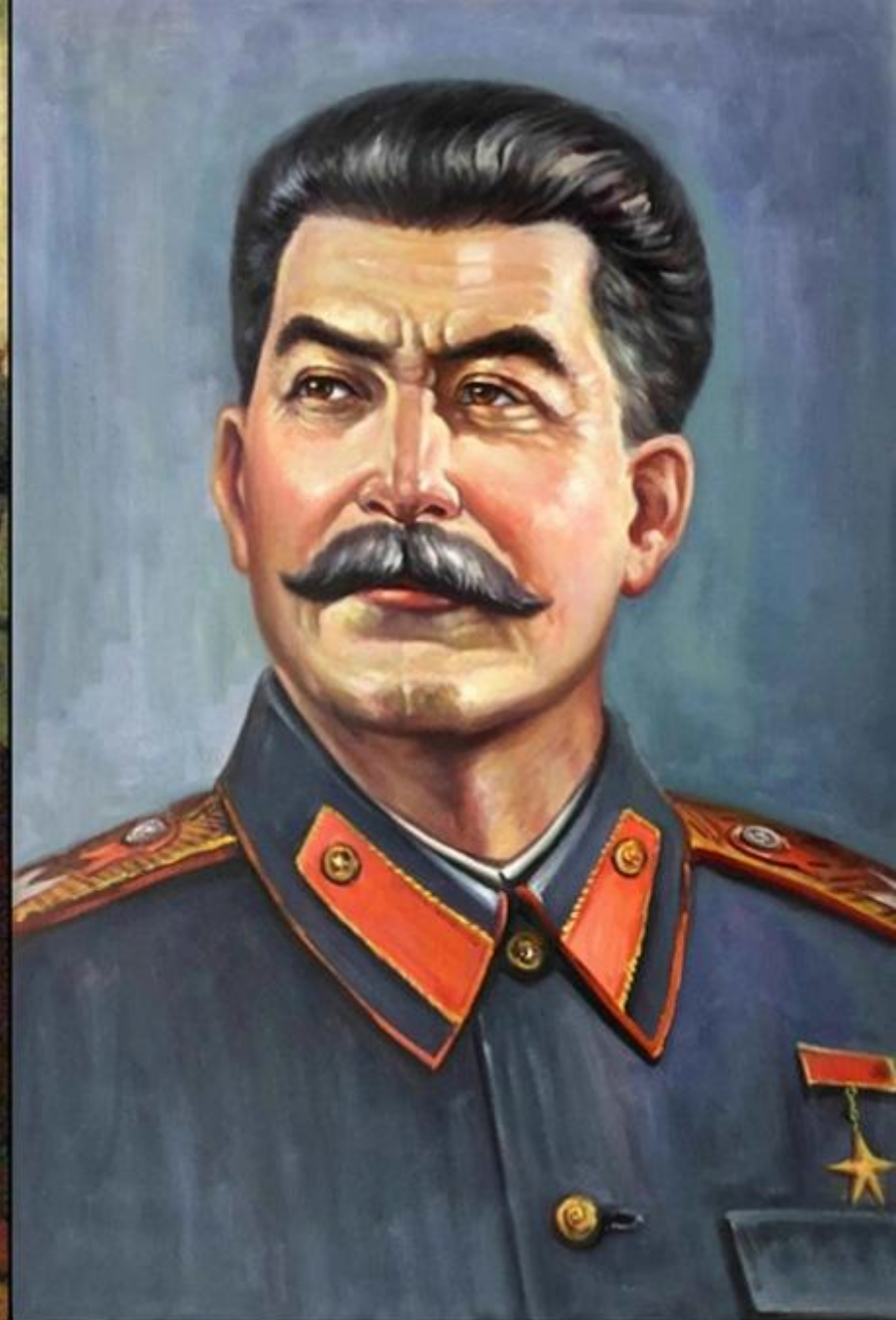
Iosif Vissarionovici Stalin