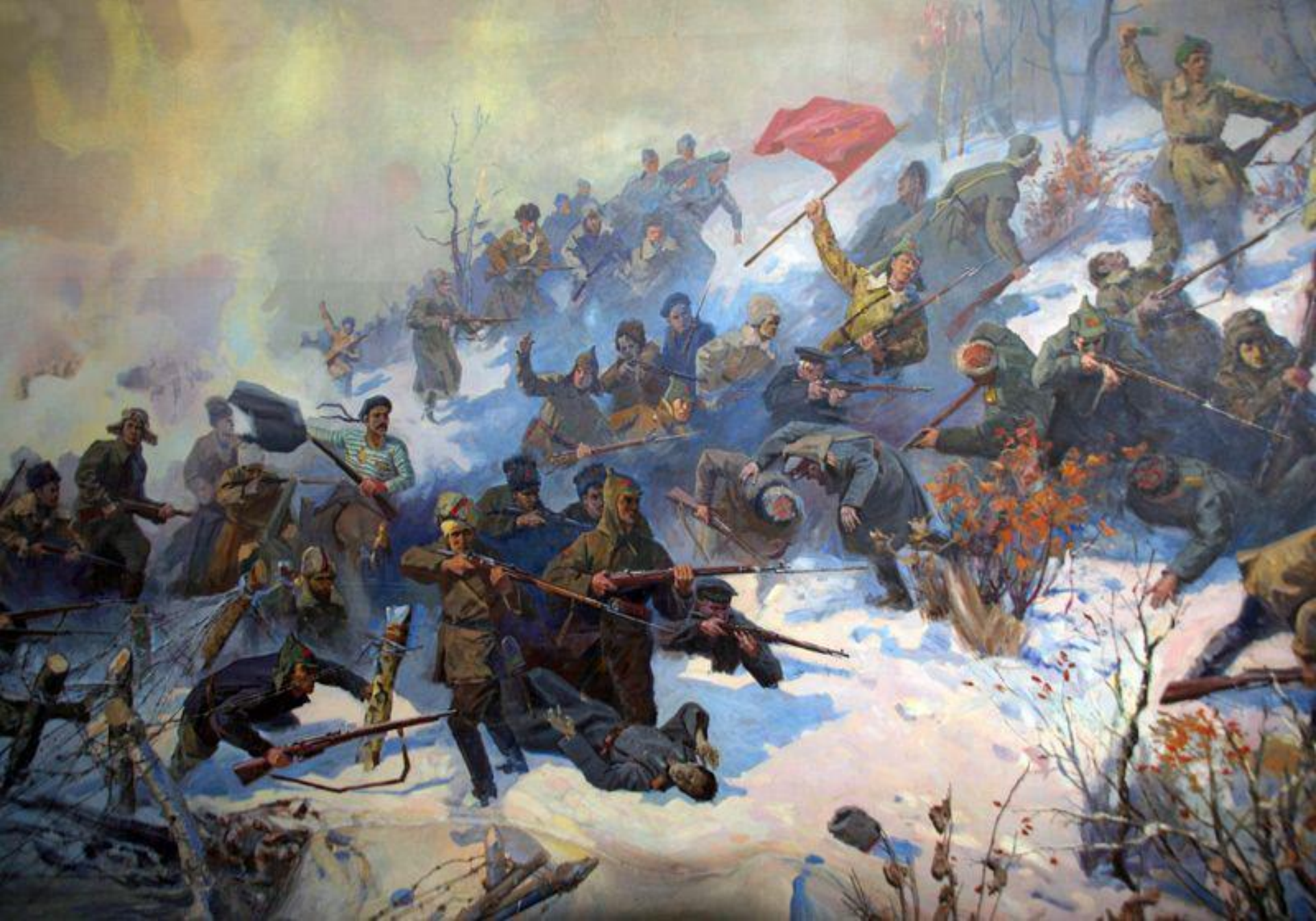
Luptă din perioada războiului civil rus (Federația Rusă, 1919)