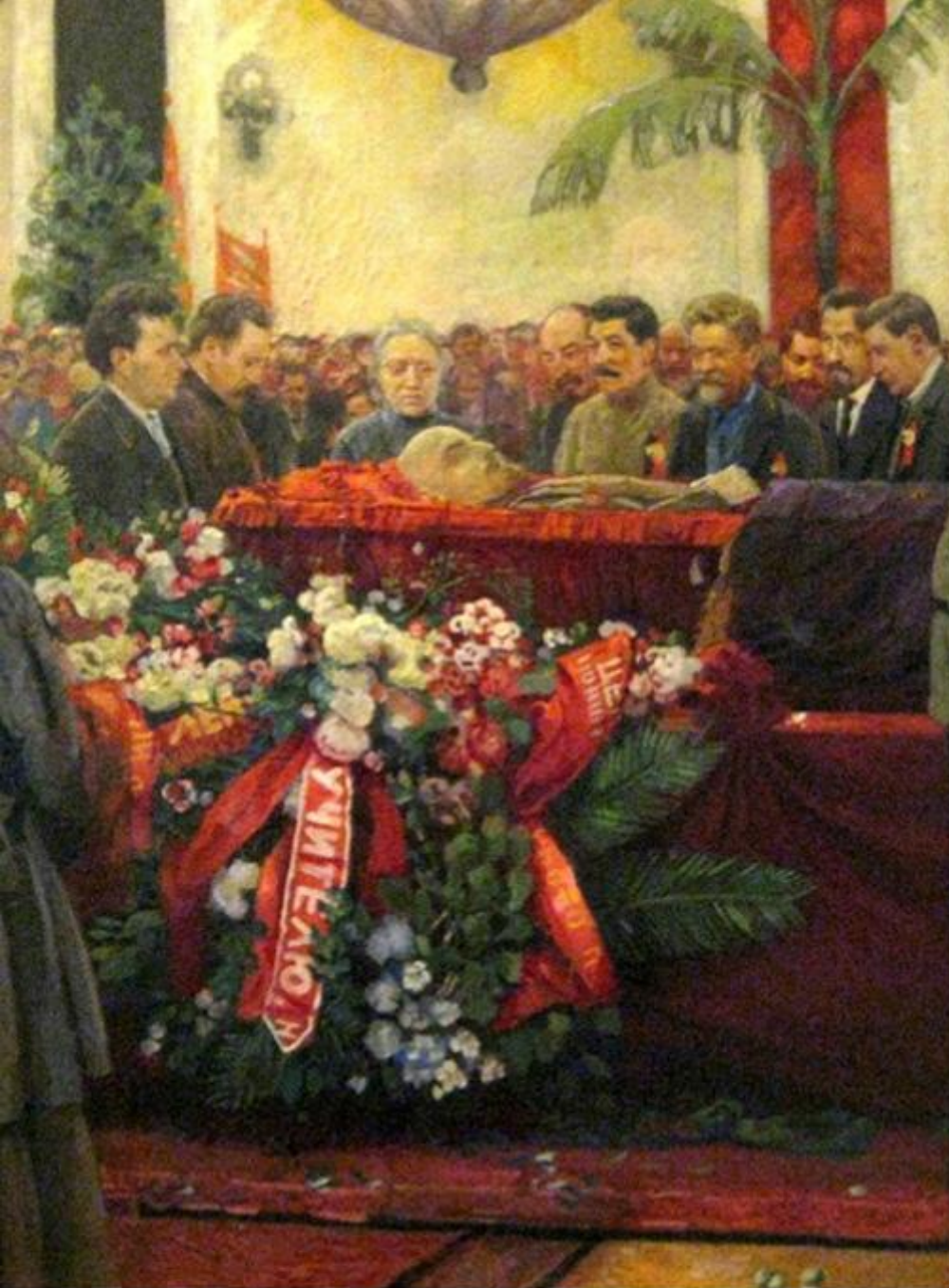
Funeraliile lui Lenin (Federația Rusă, 1924)