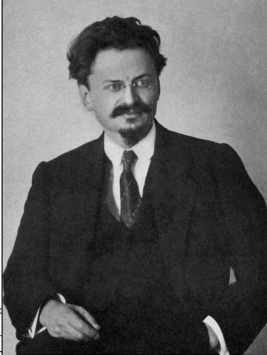
Lev Davidovici Troțki

..... Granița occidentală a Rusiei (1921)