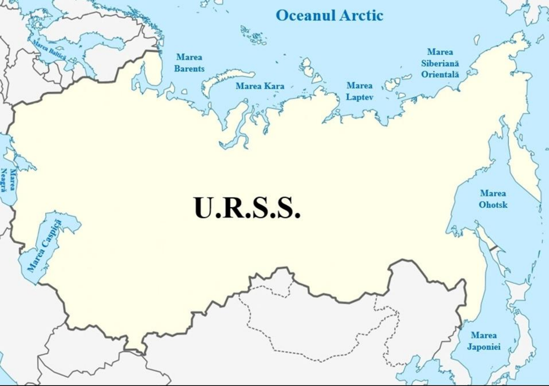
Uniunea Republicilor Sovietice Socialiste (1924)