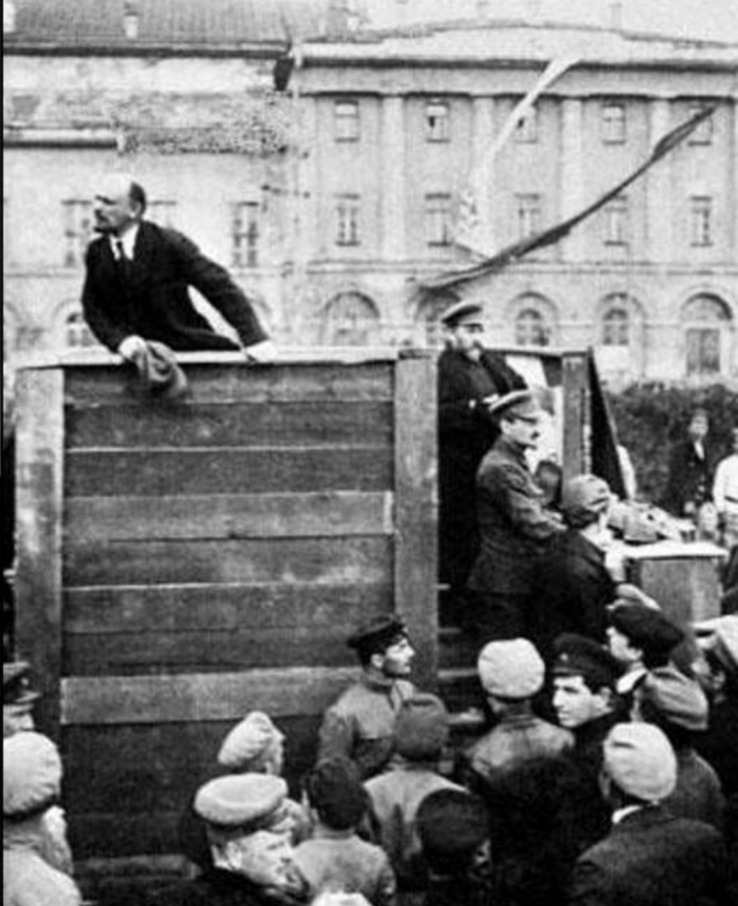
Lenin prezintă populației „tezele din aprilie” (Federația Rusă, 1917)