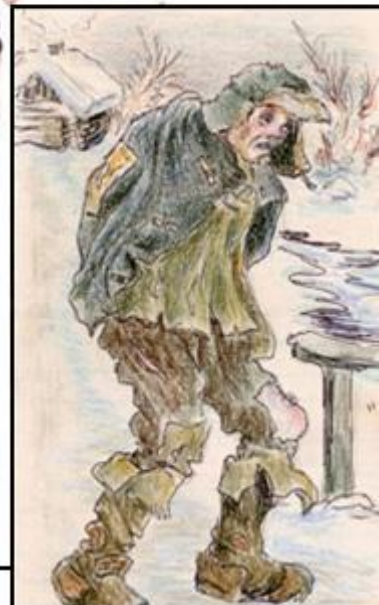
Prizonier dintr-un lagăr sovietic