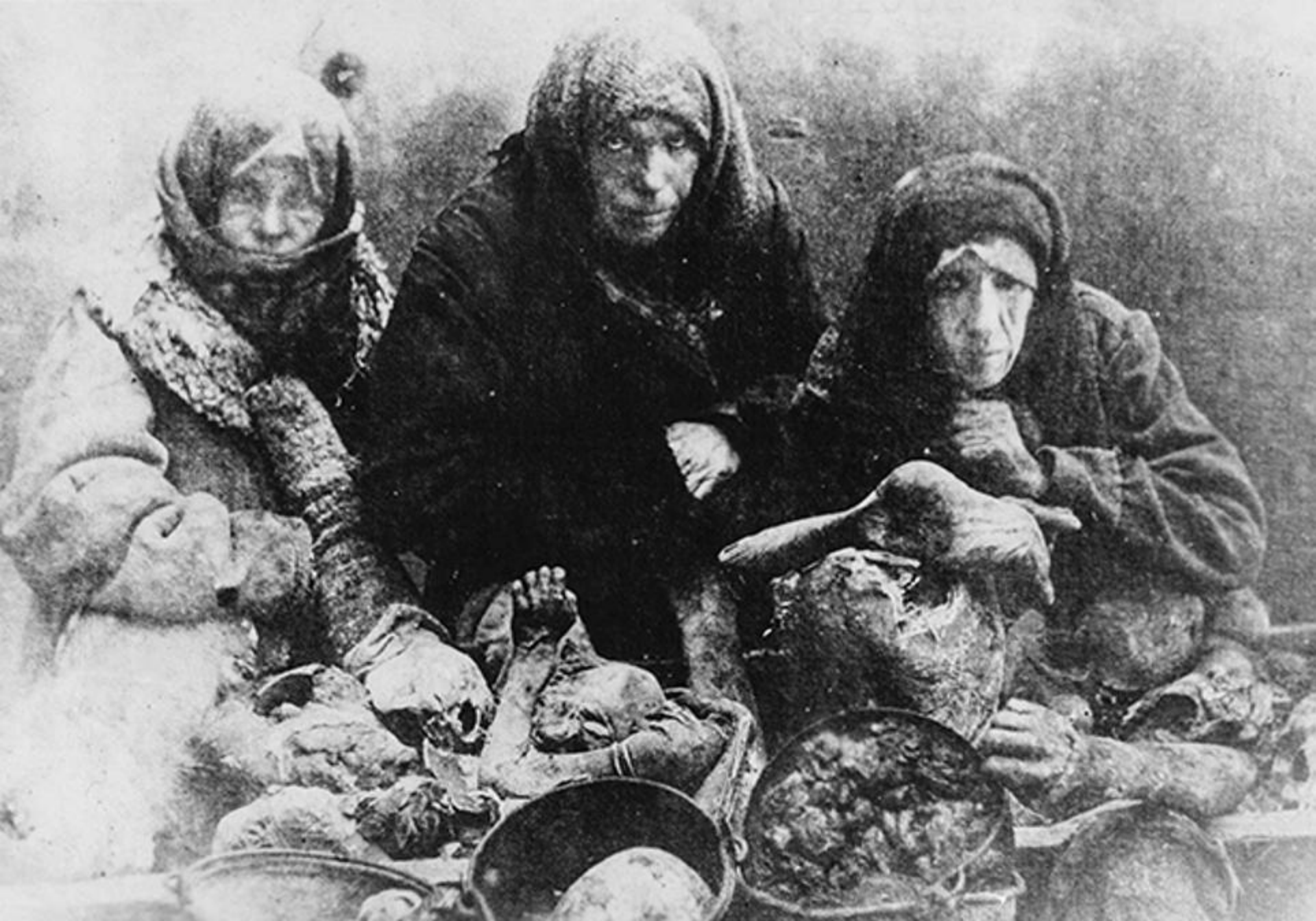
Culaci înfomețați ce au recurs la canibalism (Ucraina, 1932)