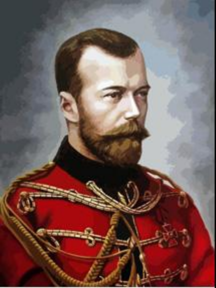
Nicolae al II-lea