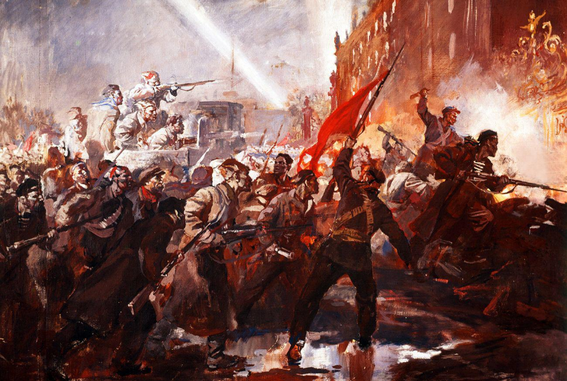
Bolșevicii preiau controlul asupra instituțiilor-cheie din Petrograd (Federația Rusă, 1917)