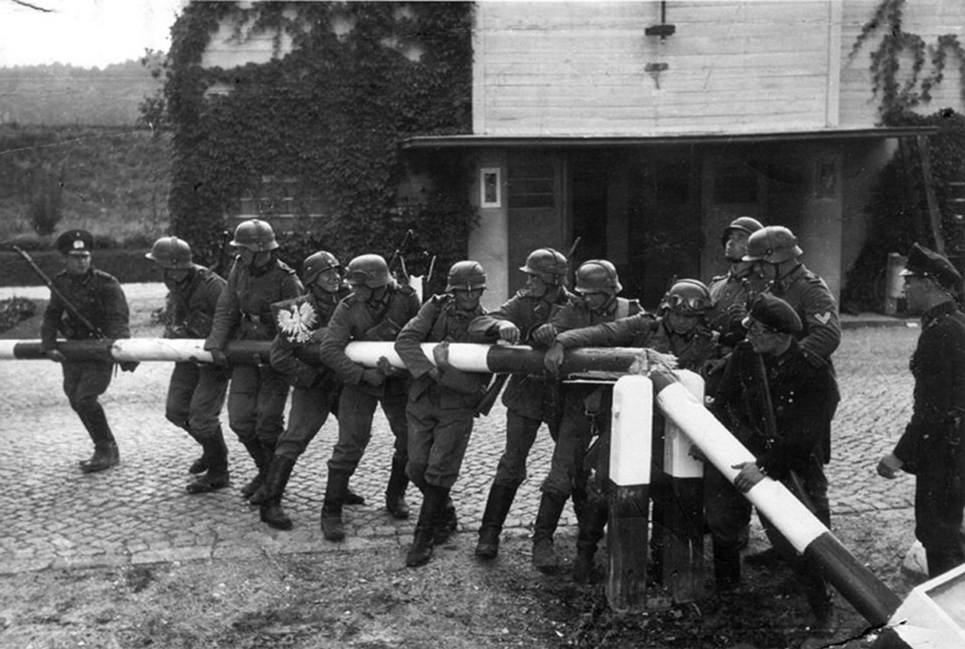
Soldați germani înlătură bariera de la granița dintre Polonia și Germania (septembrie 1939)