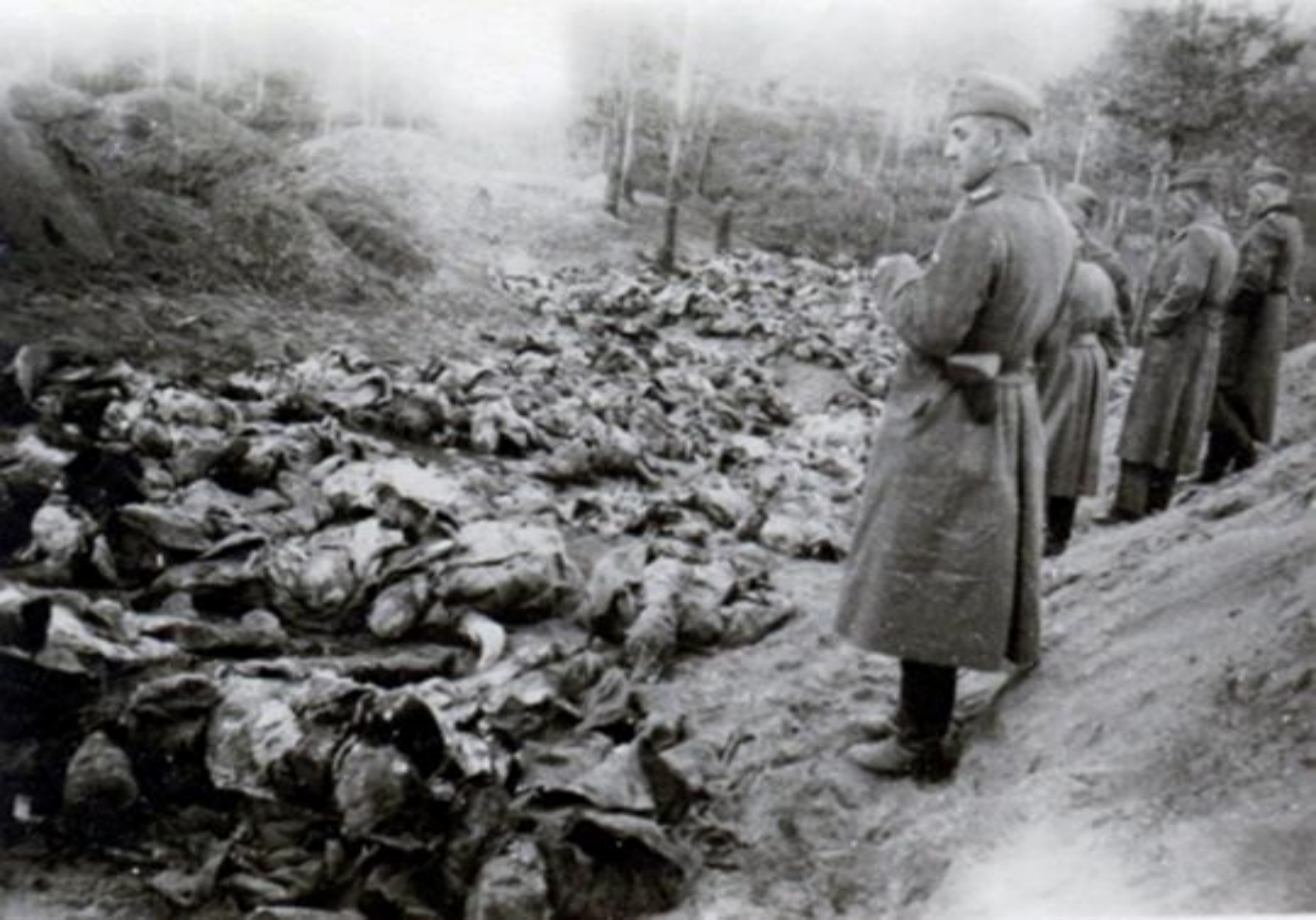
Etnici români masacrați de trupele maghiare în Transilvania (1941)