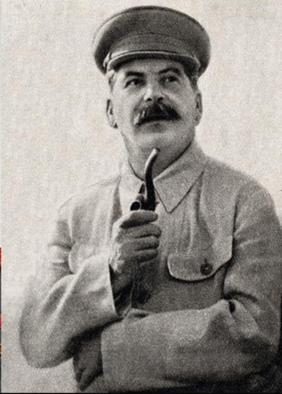
Iosif Vissarionovici Stalin