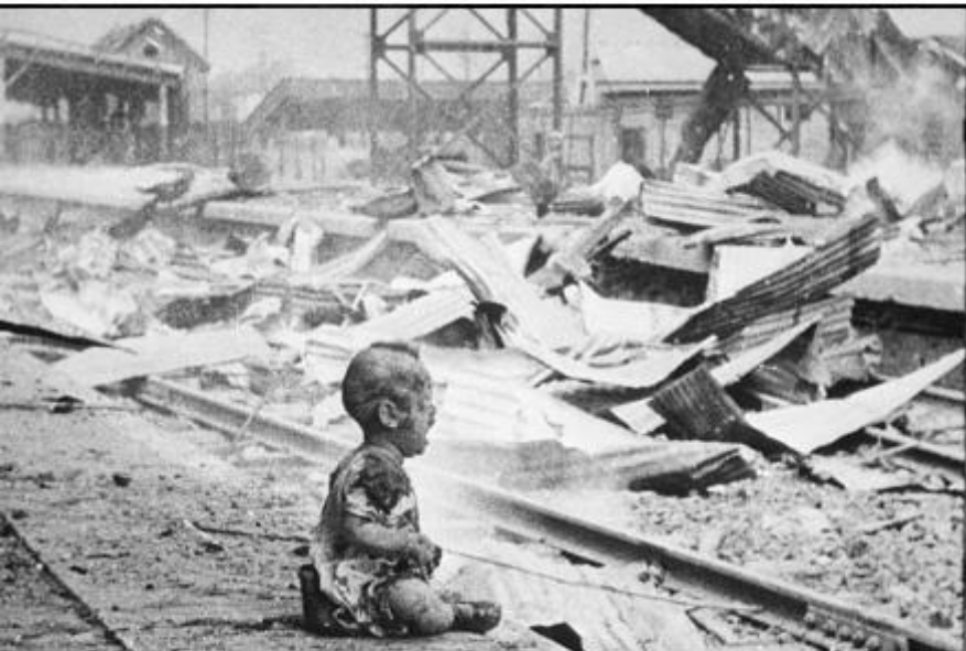
Un copil plânge printre ruinele gării din Shanghai (China, 1937)