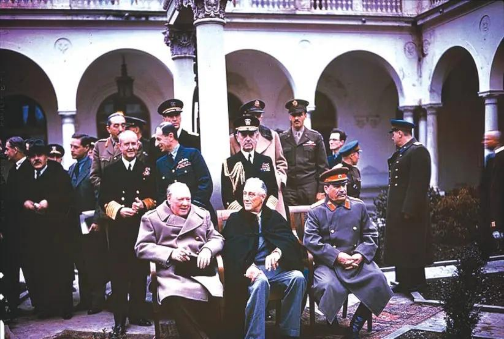
„Cei trei mari” la Ialta (de la stânga la dreapta): Churchill, Roosevelt și Stalin (Federația Rusă, 1945)