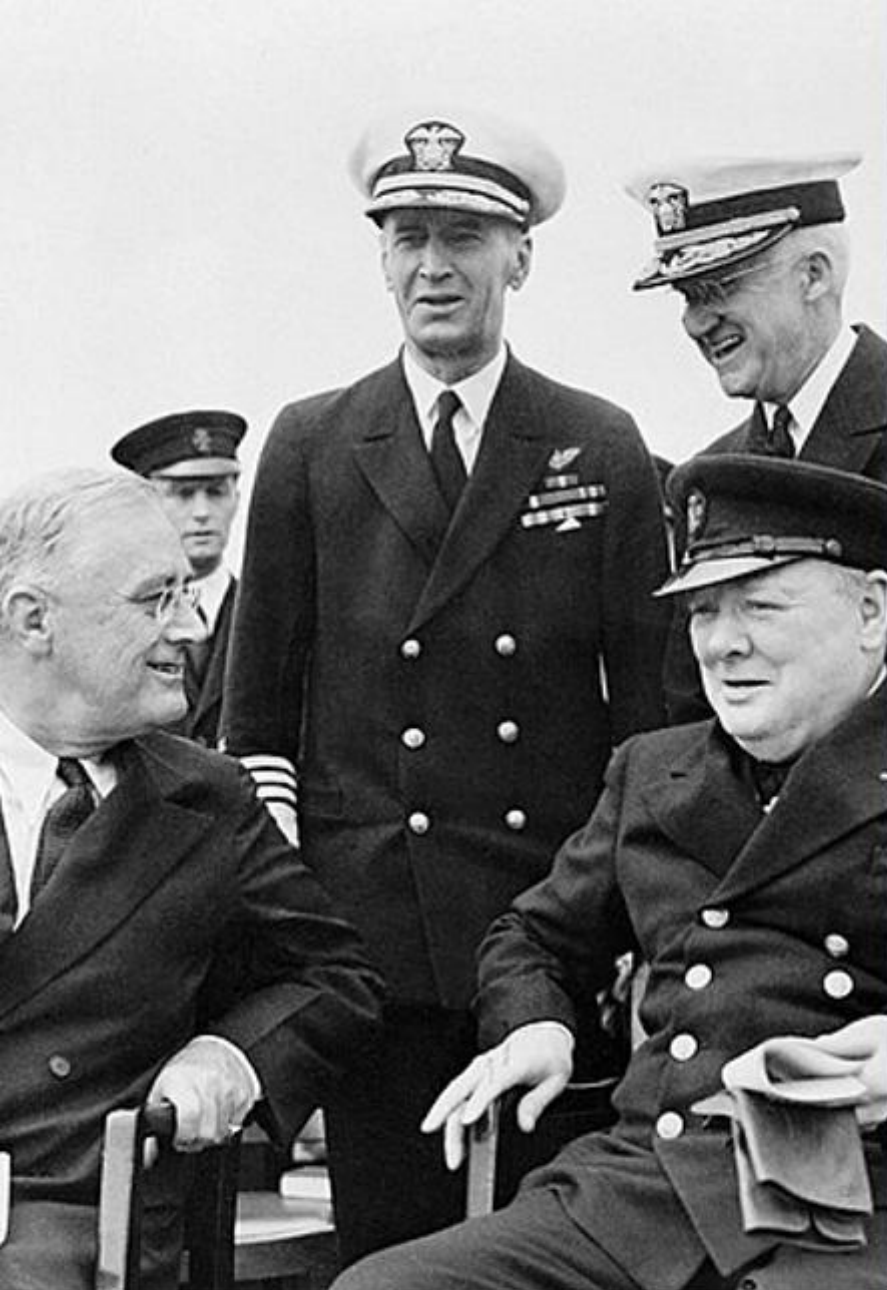
Franklin D. Roosevelt și Winston Churchill (10 august 1941)