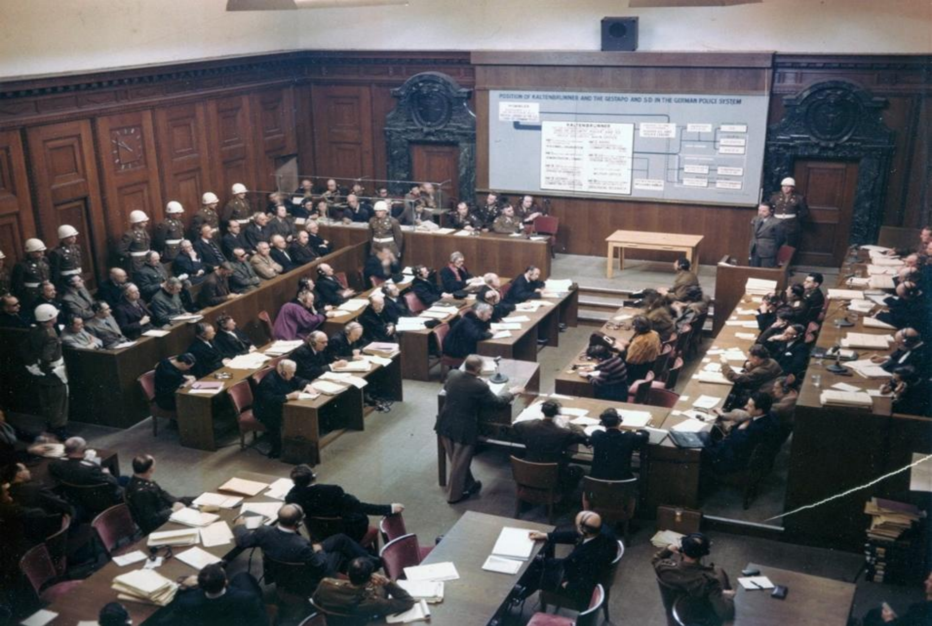
O ședință de tribunal din perioada Proceselor de la Nurnberg (Germania, 1945-1946)