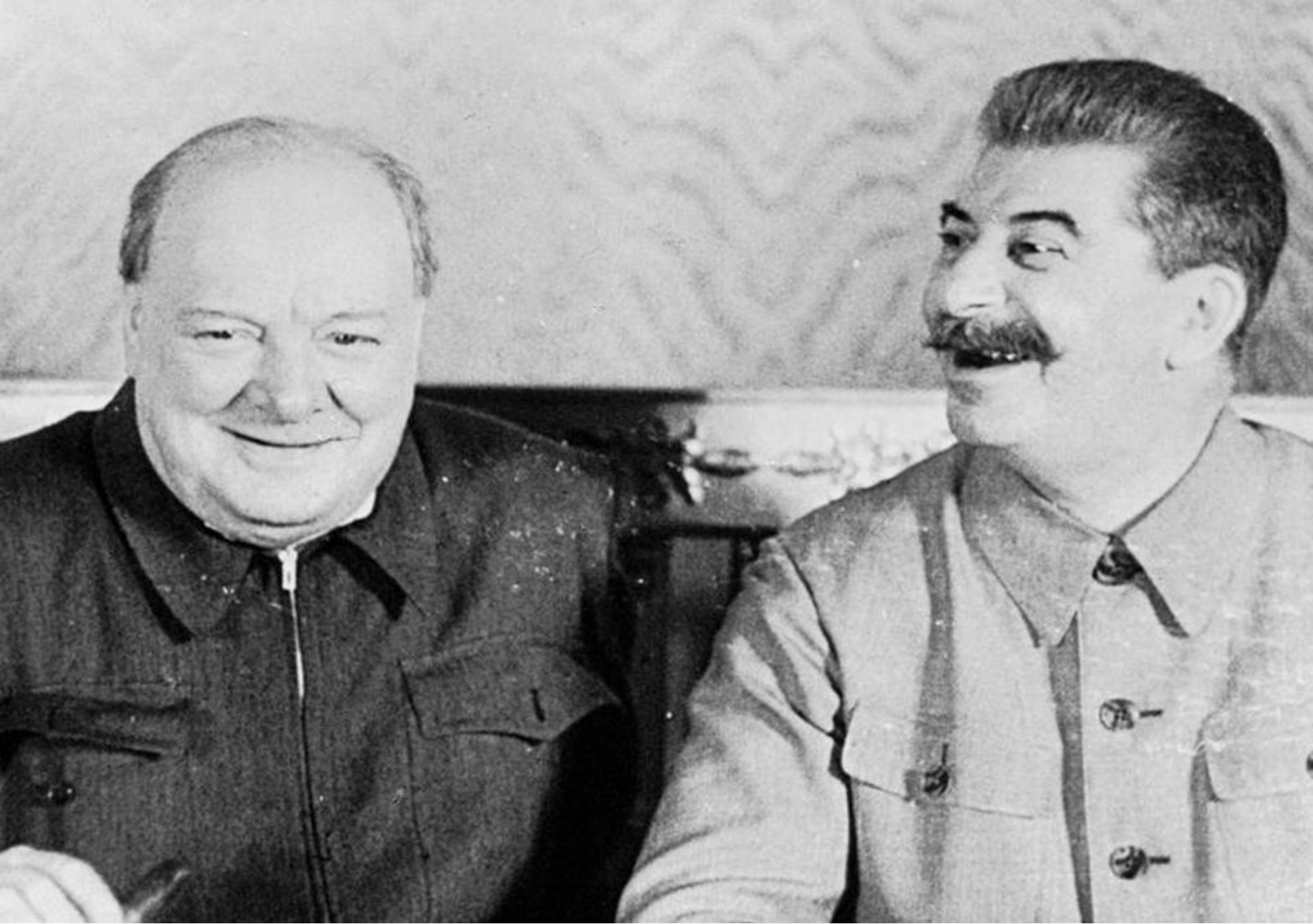
Winston Churchill și Iosif V. Stalin la Moscova (Federația Rusă, 1944)