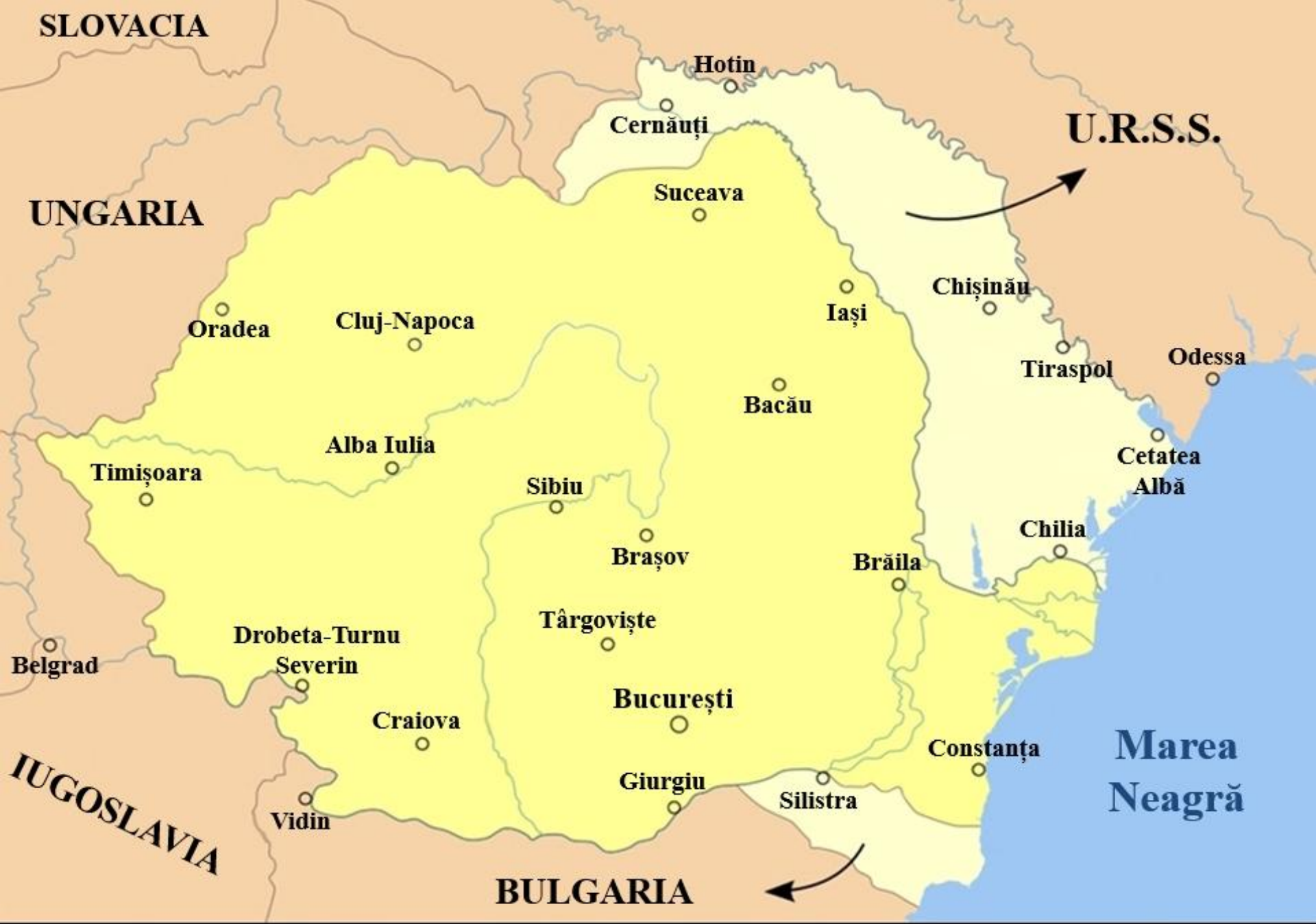
Granițele României după Conferința de Pace de la Paris (1947)