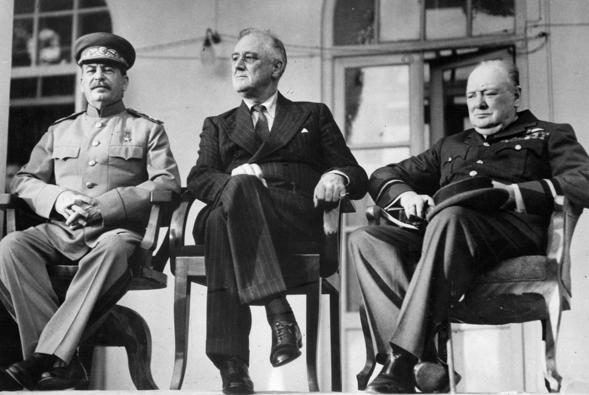
„Cei trei mari” la Teheran (de la stânga la dreapta): Iosif V. Stalin, Franklin D. Roosevelt și Winston Churchill (Iran, 1943)