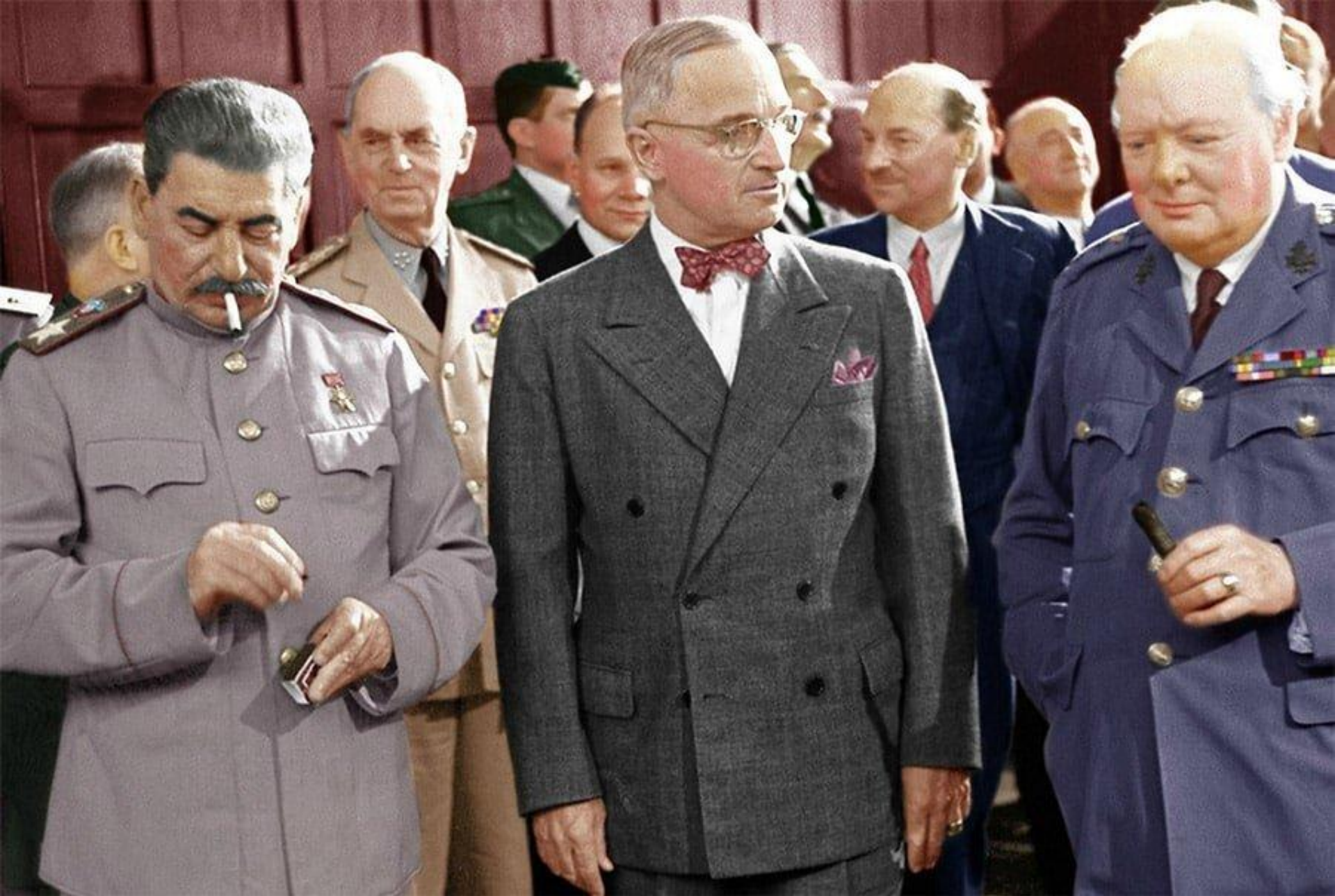
„Cei trei mari” la Potsdam (de la stânga la dreapta): Stalin, Harry S. Truman și Churchill (Germania, 1945)