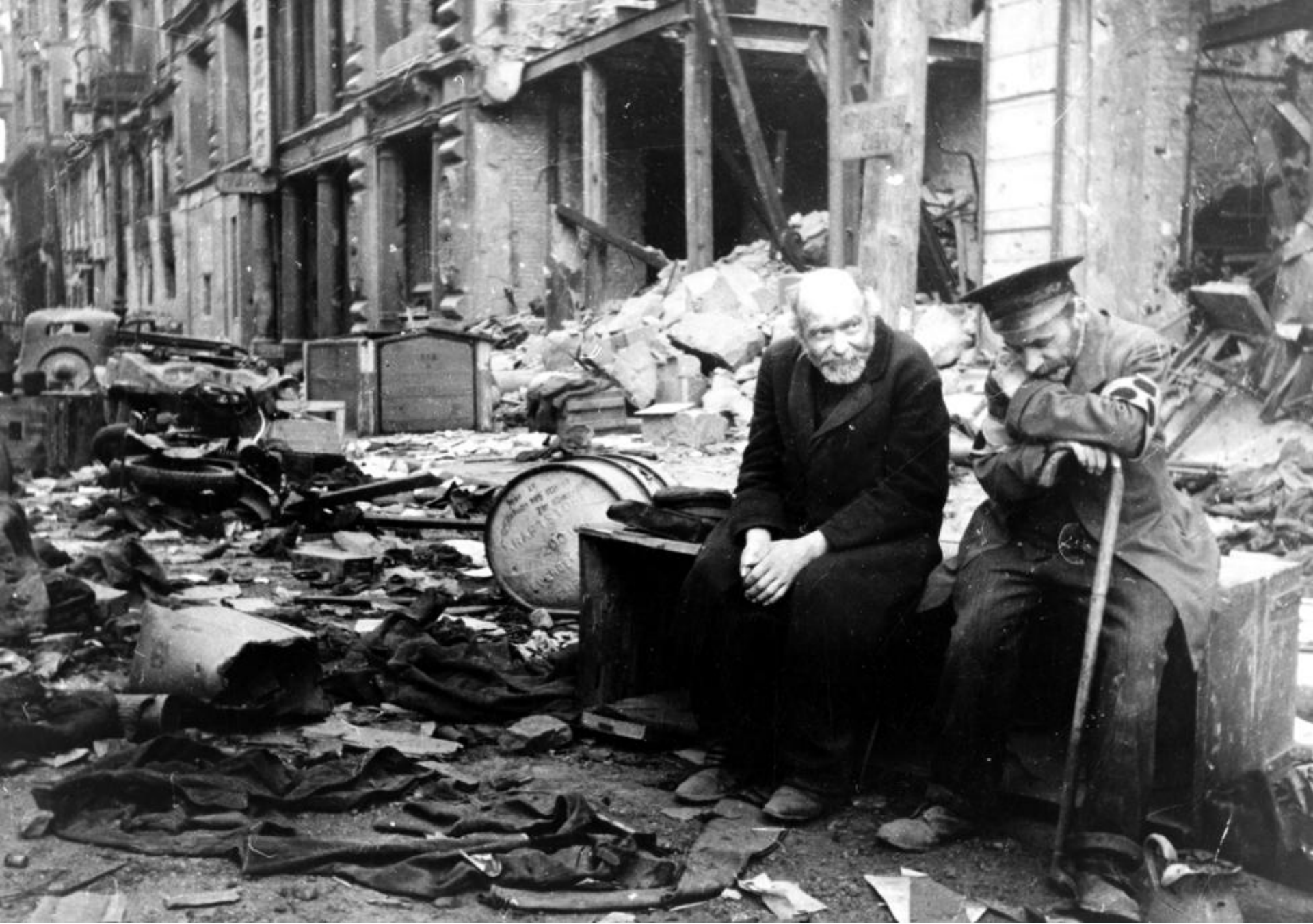
Doi bărbați se odihnesc printre ruinele orașului Berlin (Germania, 1945)