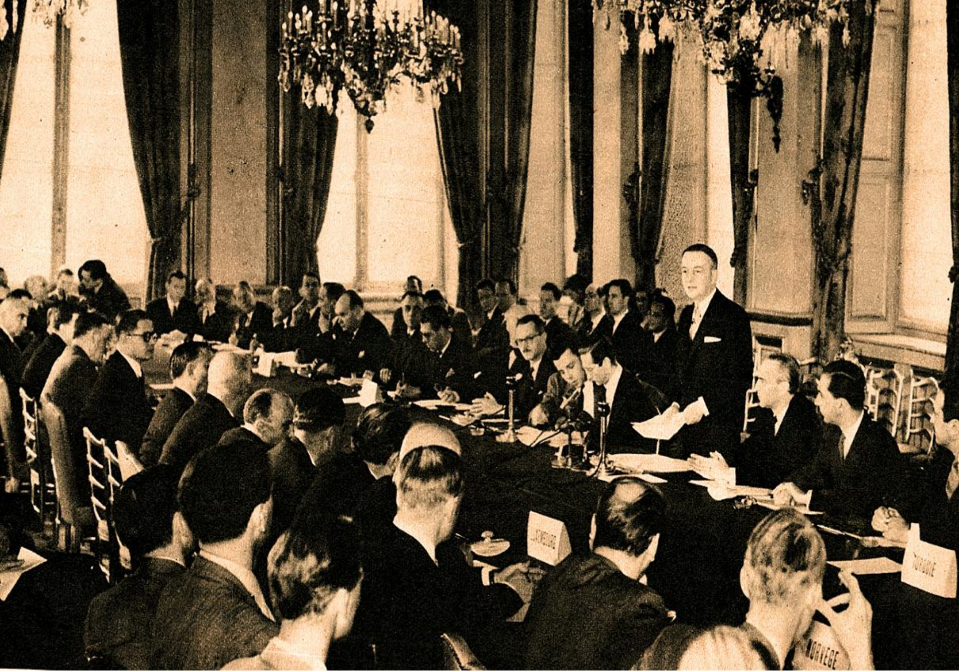
Una dintre ședințele Conferinței de Pace de la Paris (1946-1947)