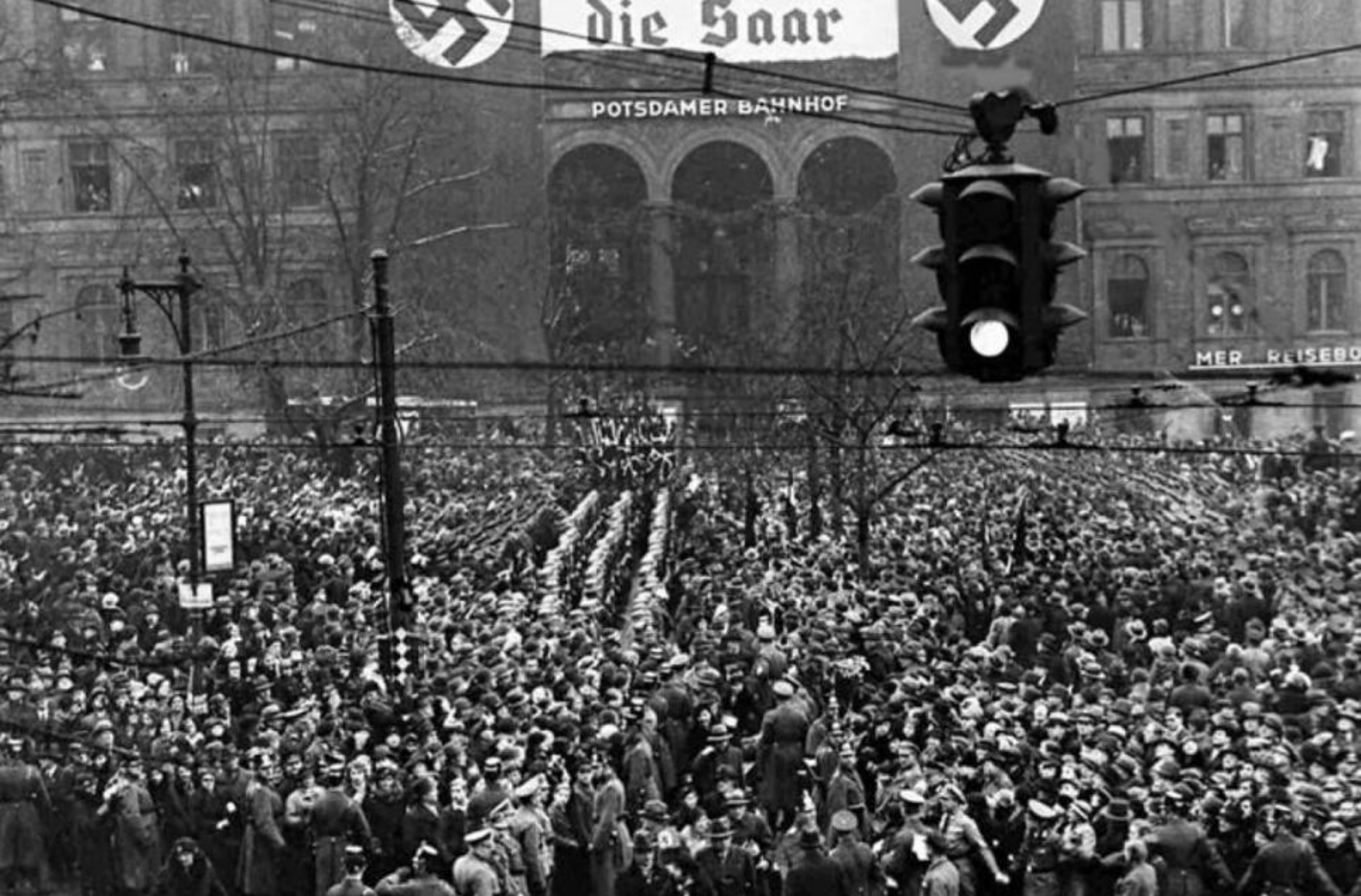
Mii de berlinezi aplaudă votul cetățenilor germani din regiunea Saar de a se uni cu patria mamă (Germania, 1935)