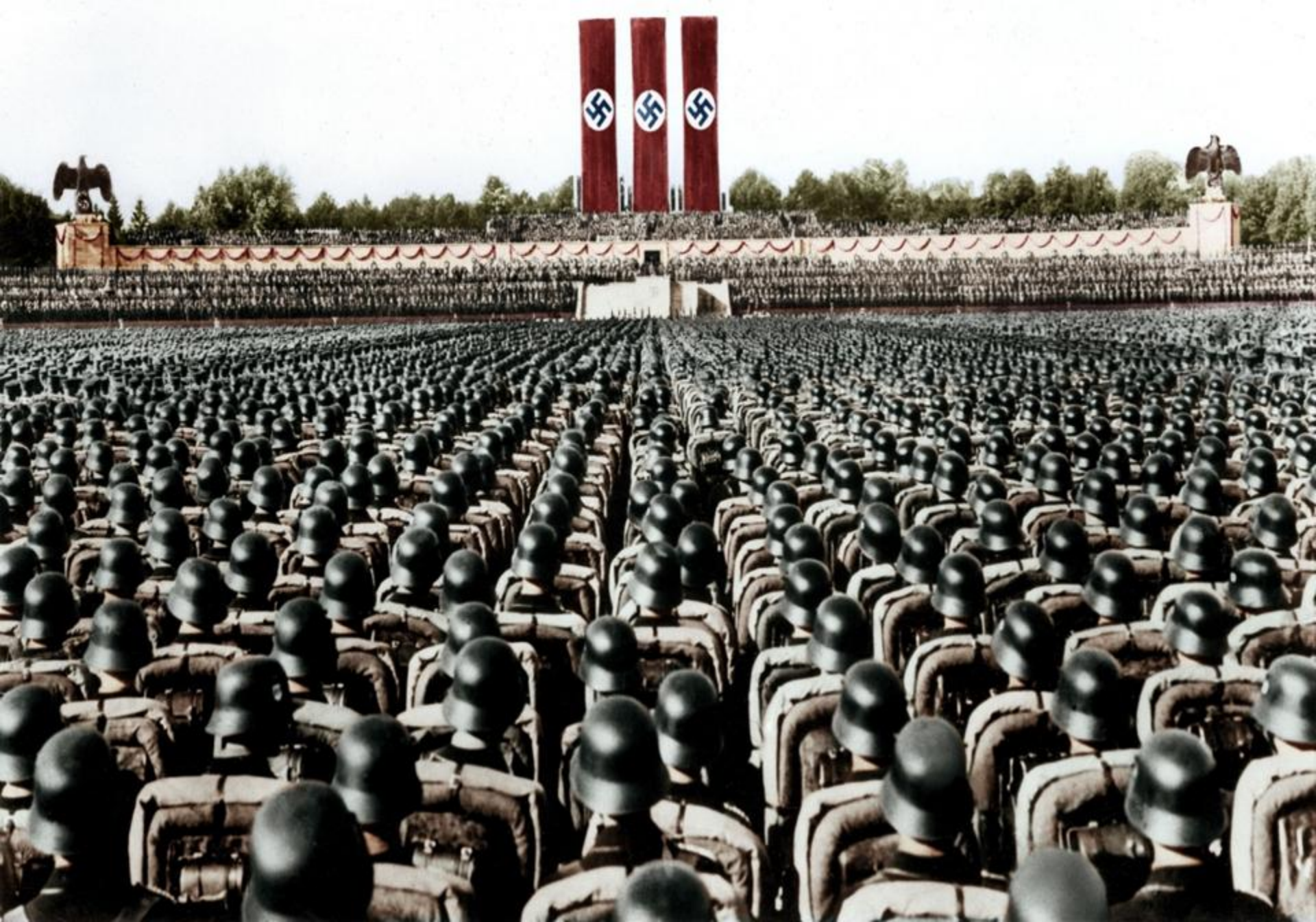
Paradă militară organizată la Nurnberg (Germania, 1936)