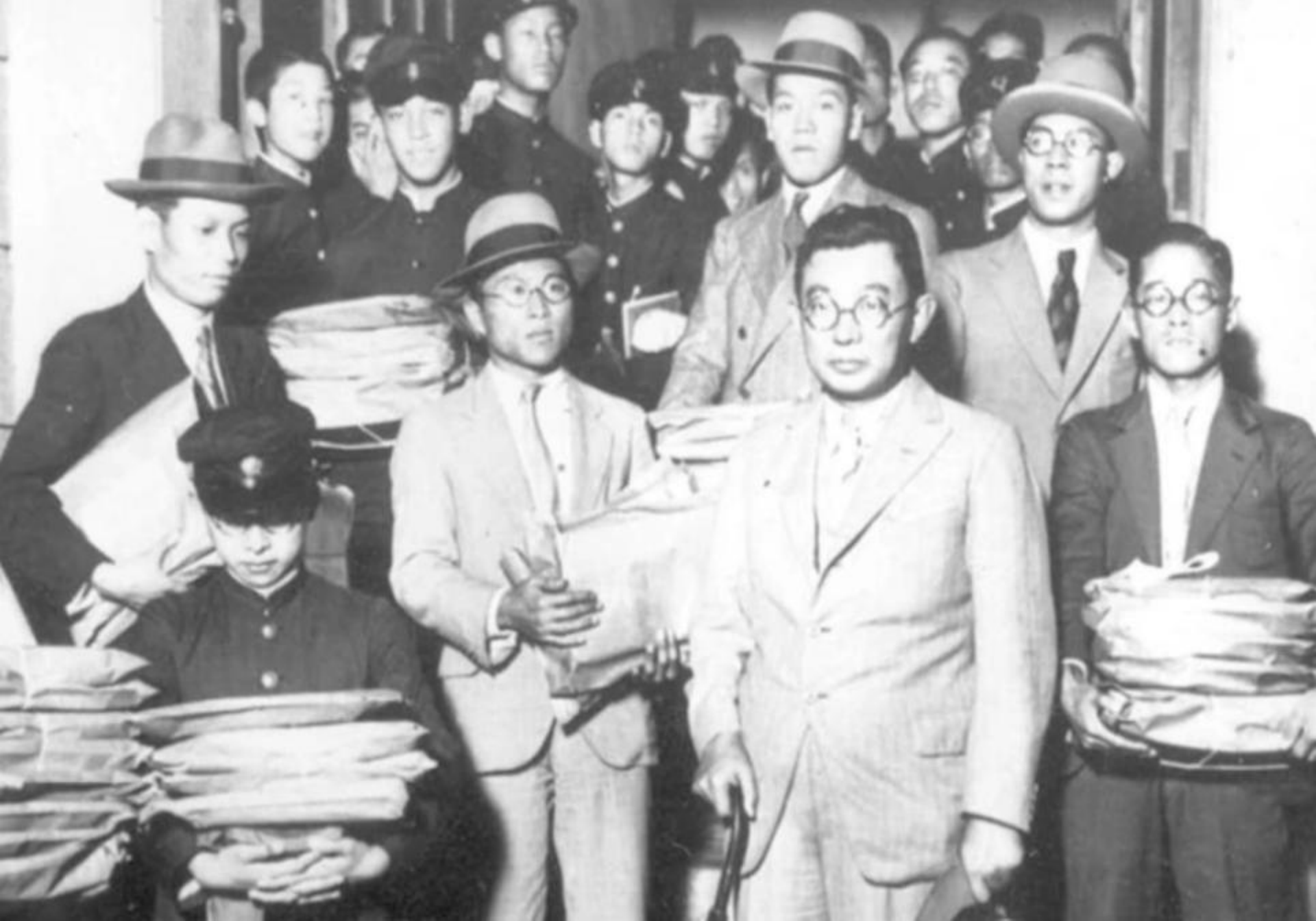
Delegația Japoniei se retrage din Liga Națiunilor (Elveția, 1933)