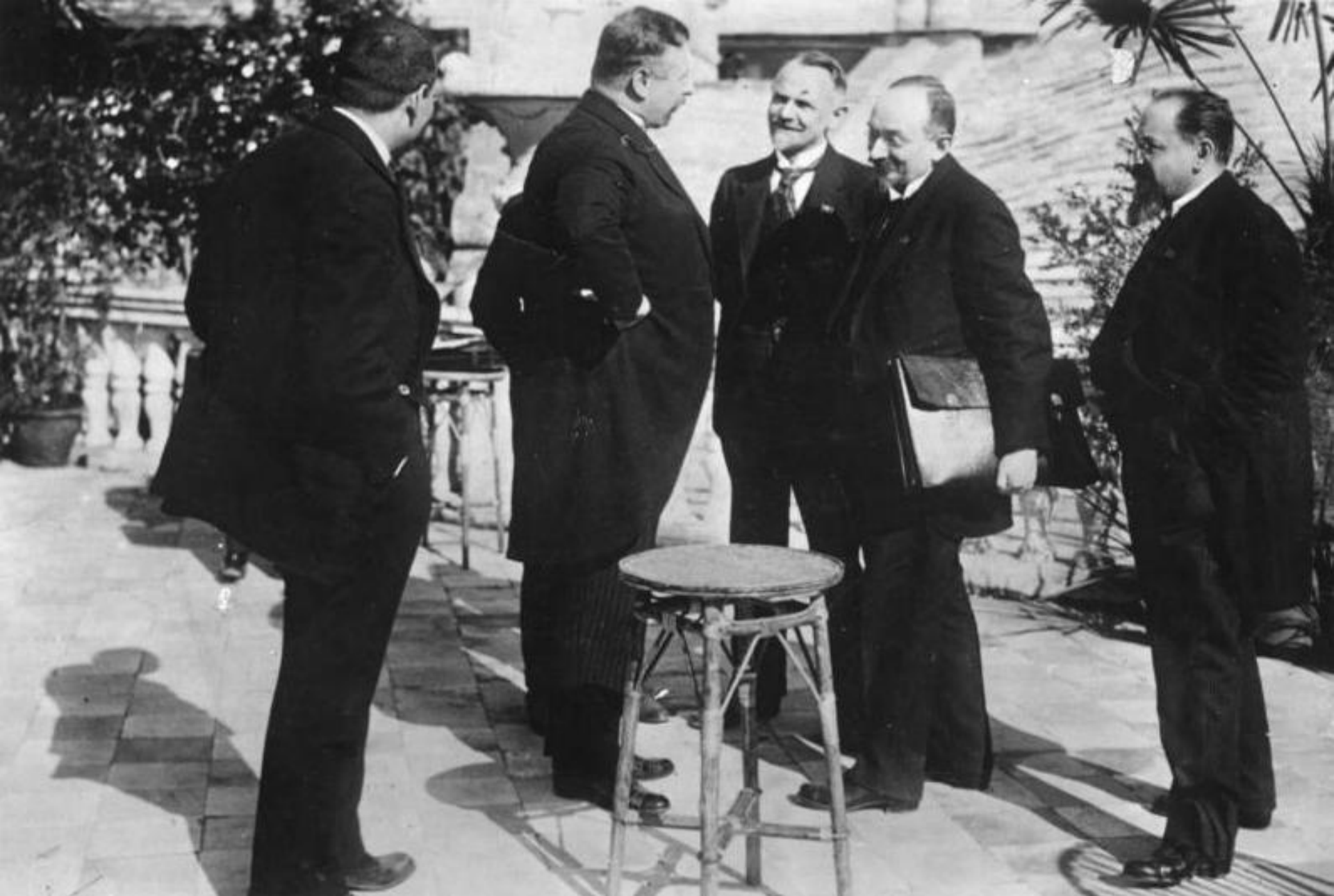
Delegația germană discută cu cea rusească după semnarea tratatului de la Rapallo (Italia, 1922)