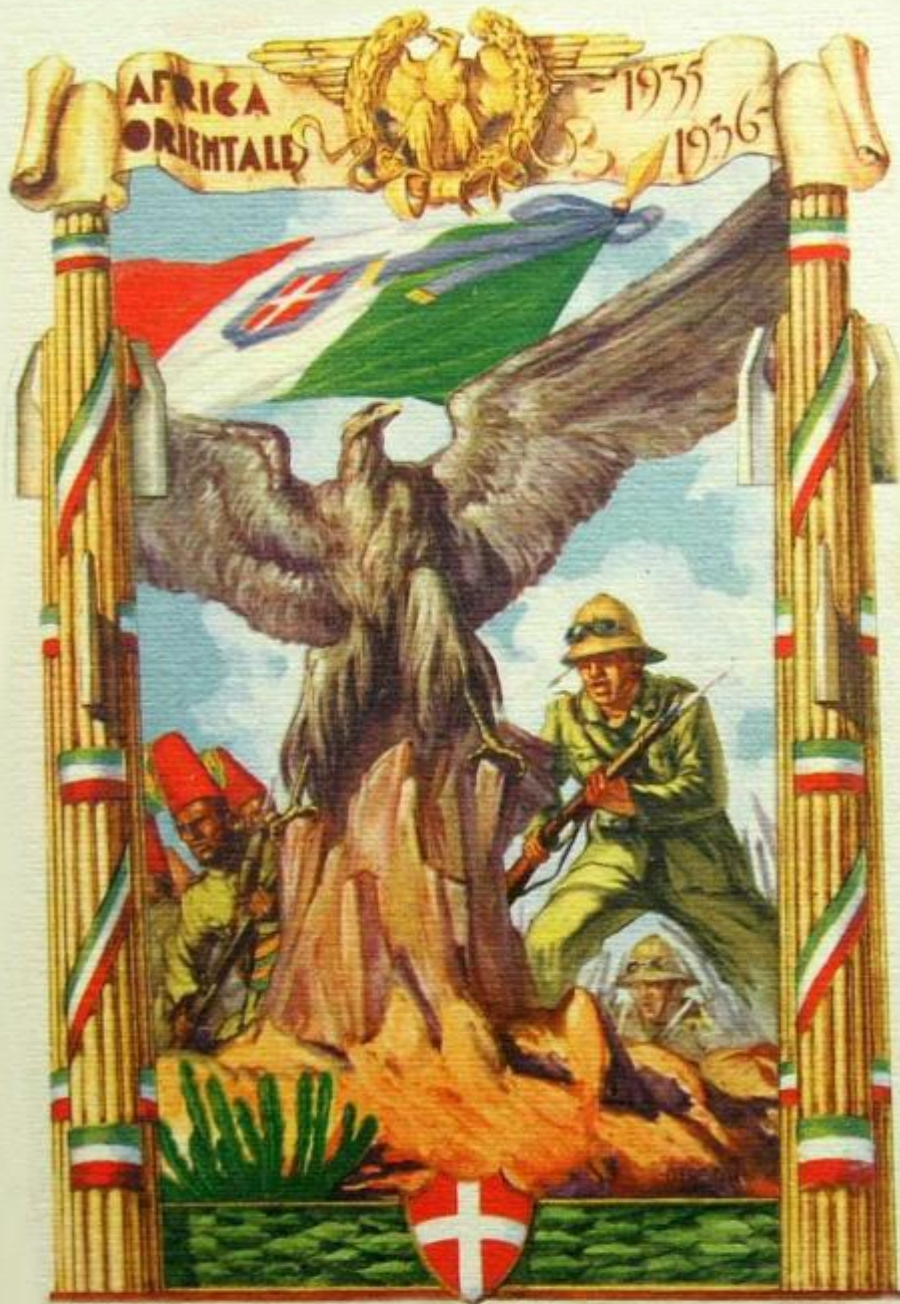
Africa Orientală Italiană (1936)