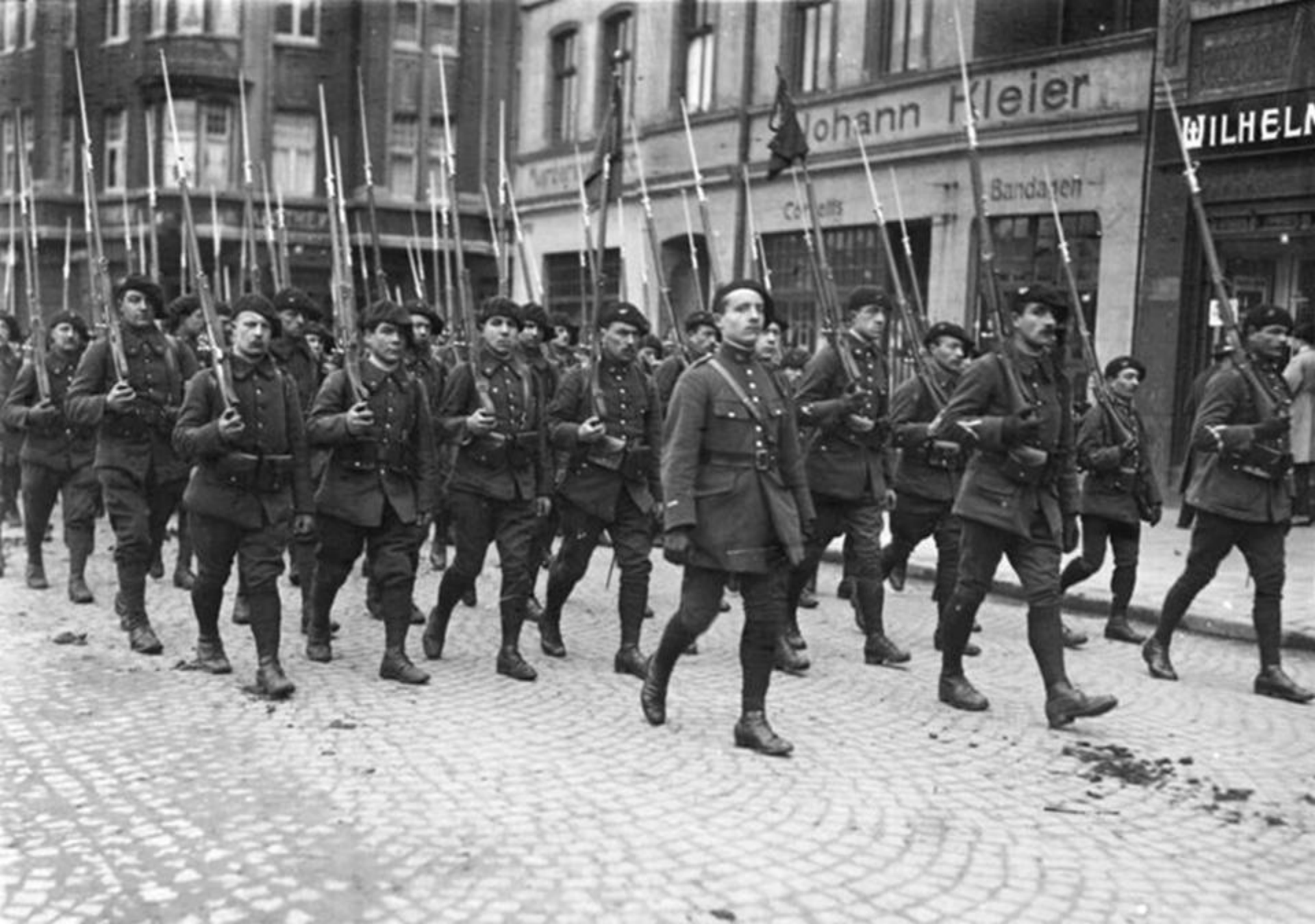
Ocuparea Zonei Ruhr de către trupele franco-belgiene (Germania, 1923)