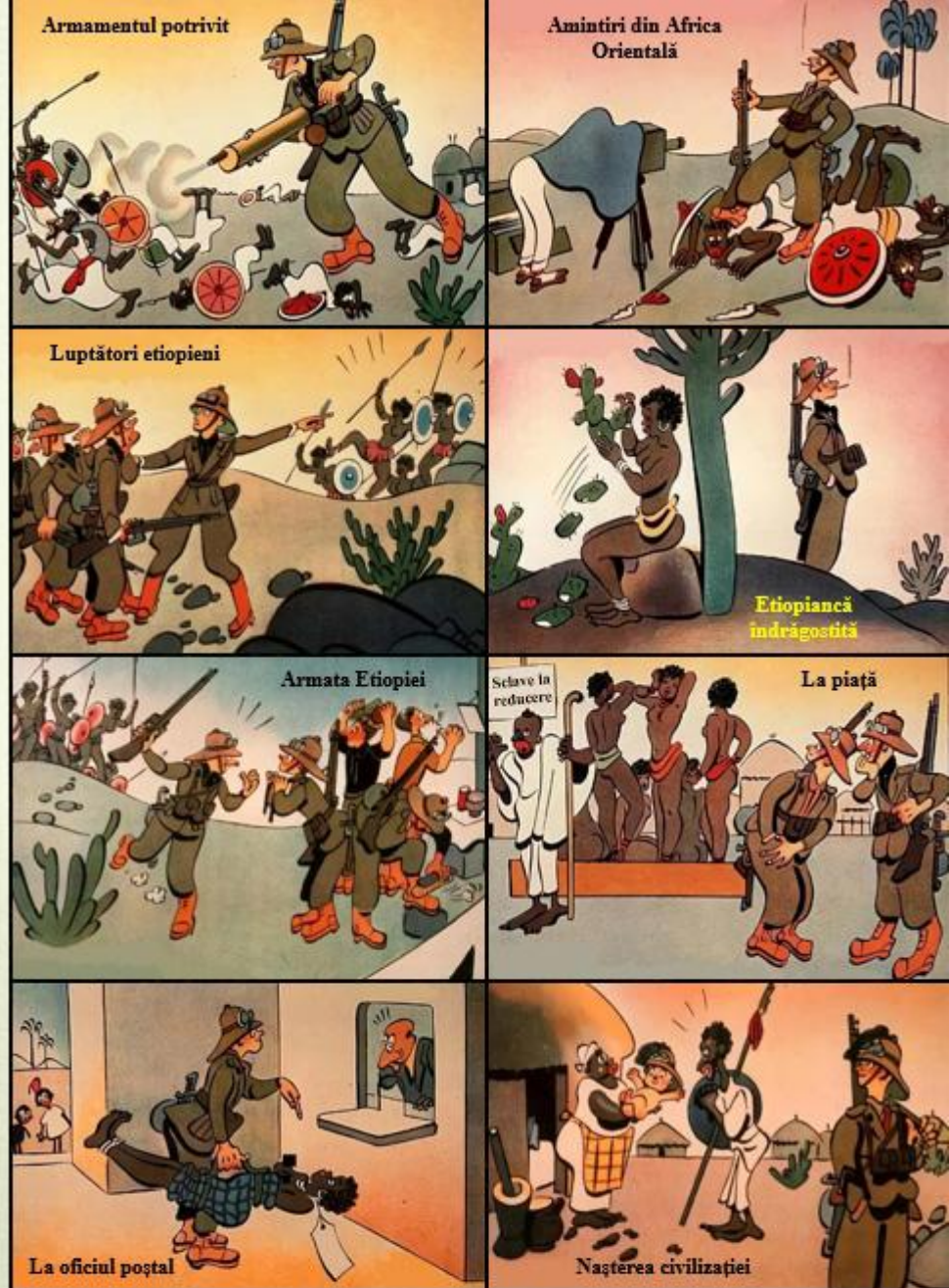
Caricaturi italiene în care sunt ridiculați etiopienii (1935-1936)