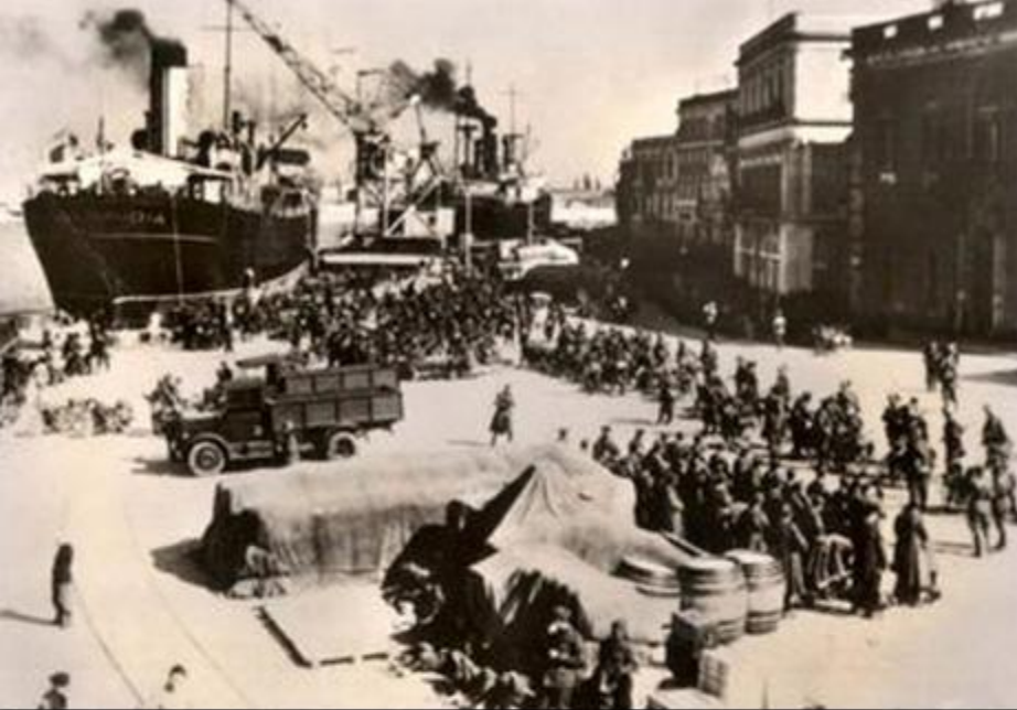
Invazia italiană a Albaniei (1939)