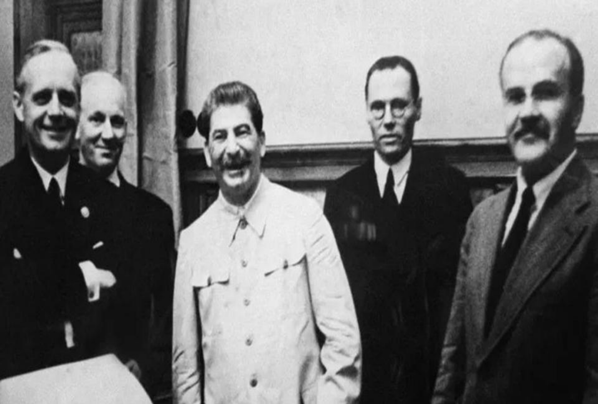
Pactul Ribbentrop-Molotov. De la stânga la dreapta: Joachim von Ribbentrop, Iosif Vissarionovici Stalin și Veaceslav Mihailovici Molotov (Federația Rusă, 1939)