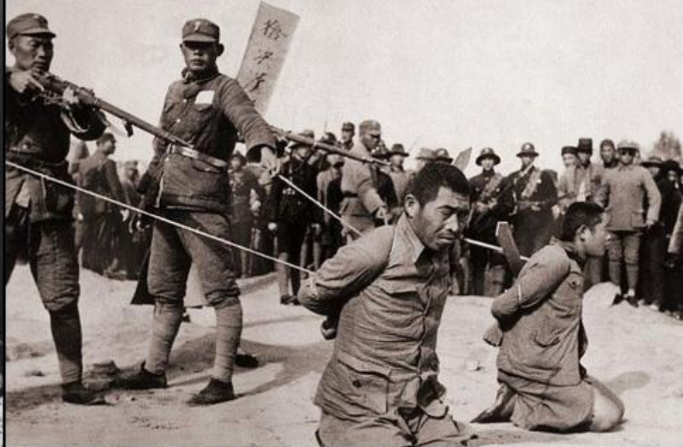
Doi chinezi îngenunchează înainte de a fi executați de soldații japonezi (China, 1937)