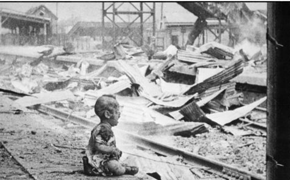
Un copil plânge printre ruinele gării din Shanghai (China, 1937)