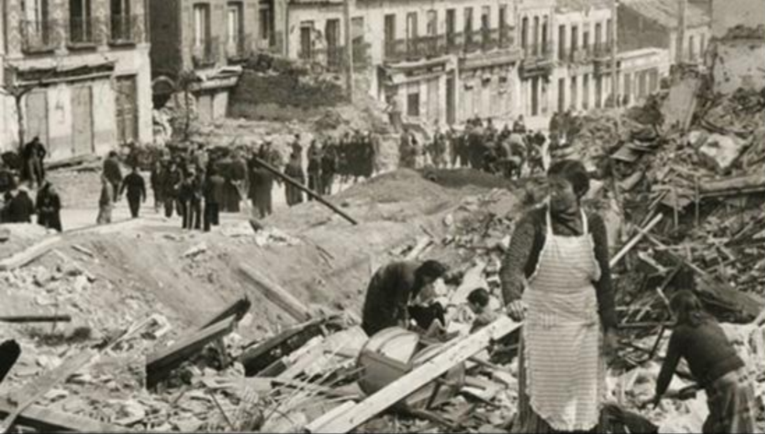
Scene din războiul civil spaniol (1936-1939)