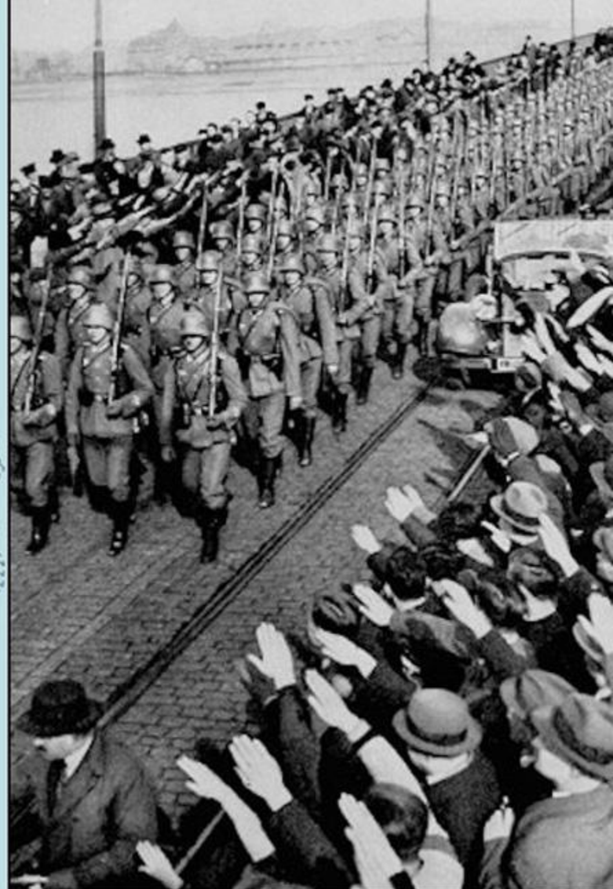
Intrarea trupelor germane în zona Renaniei (Germania, 1936)