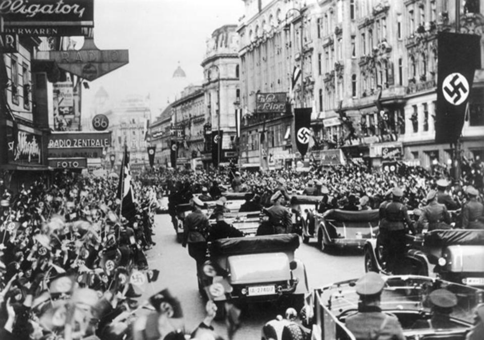
Austriecii aplaudă intrarea armatei germane în Viena (Austria, 1938)