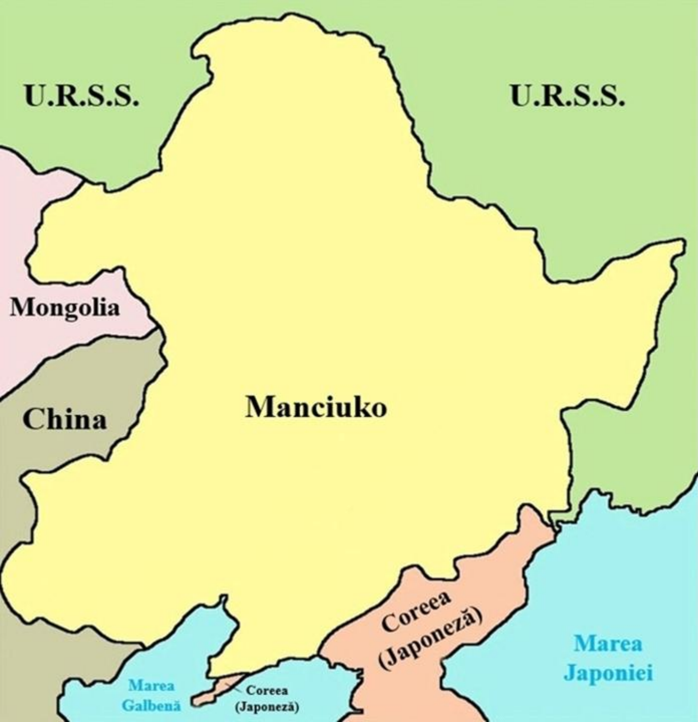
Harta statului-marionetă creat de japonezi în nordul Chinei, Manciuko (1932)