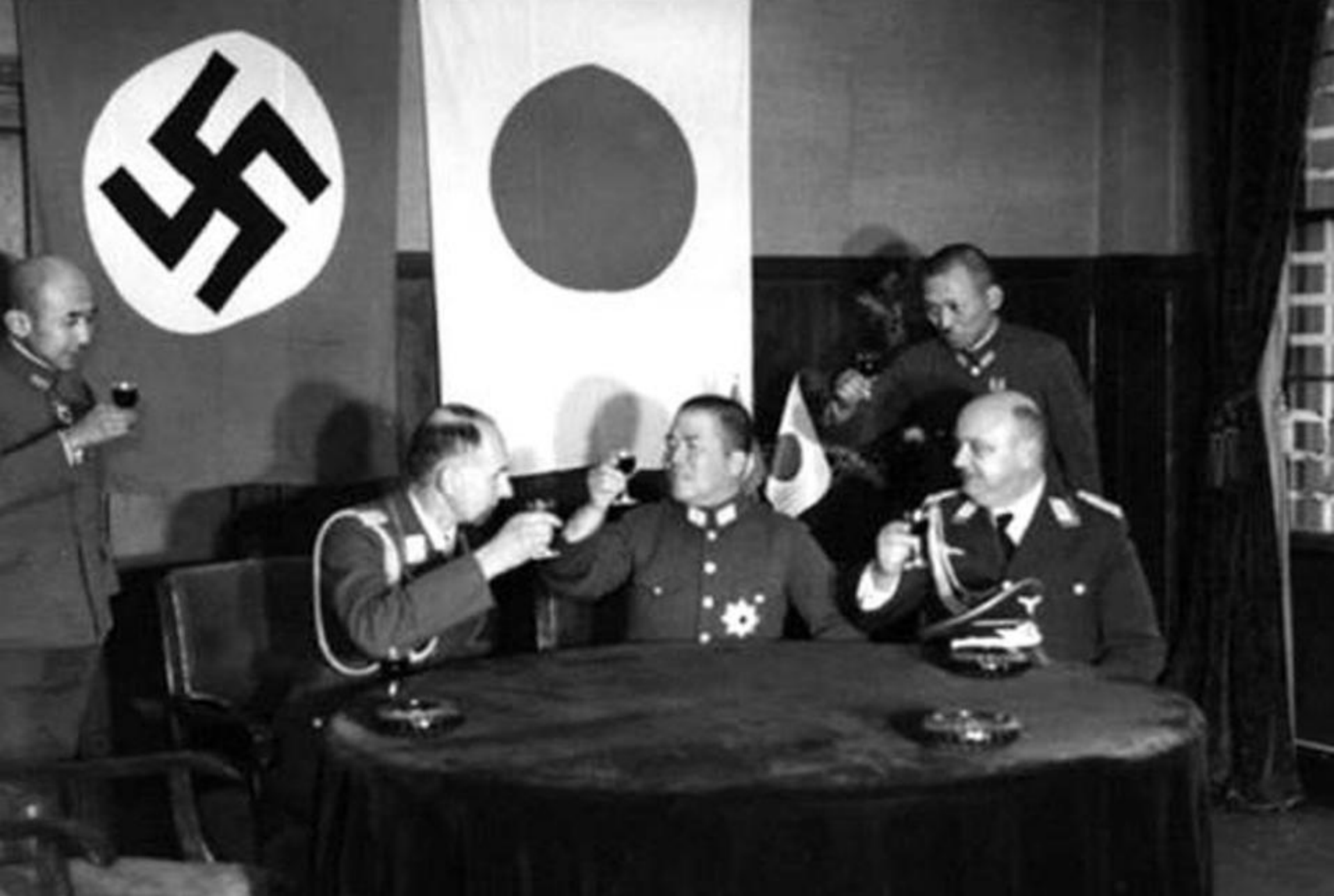
Delegațiile Germaniei și Japoniei după semnarea Pactului AntiComintern (Germania, 1936)