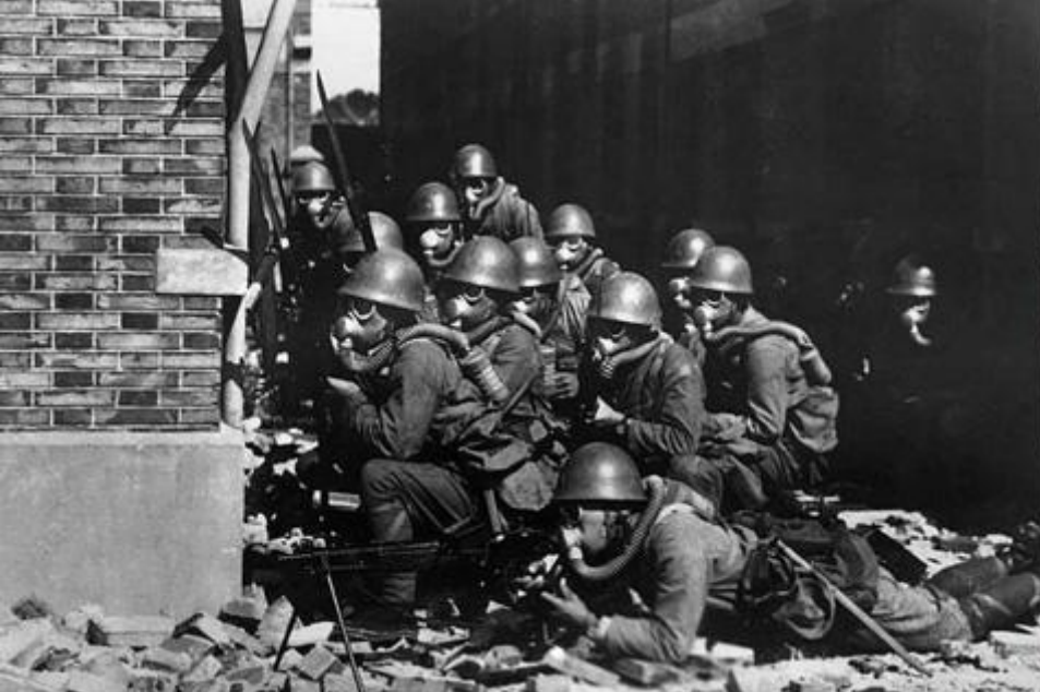
Soldați japonezi din cadrul Forțelor Speciale Navale printre ruinele orașului Shanghai (China, 1937)