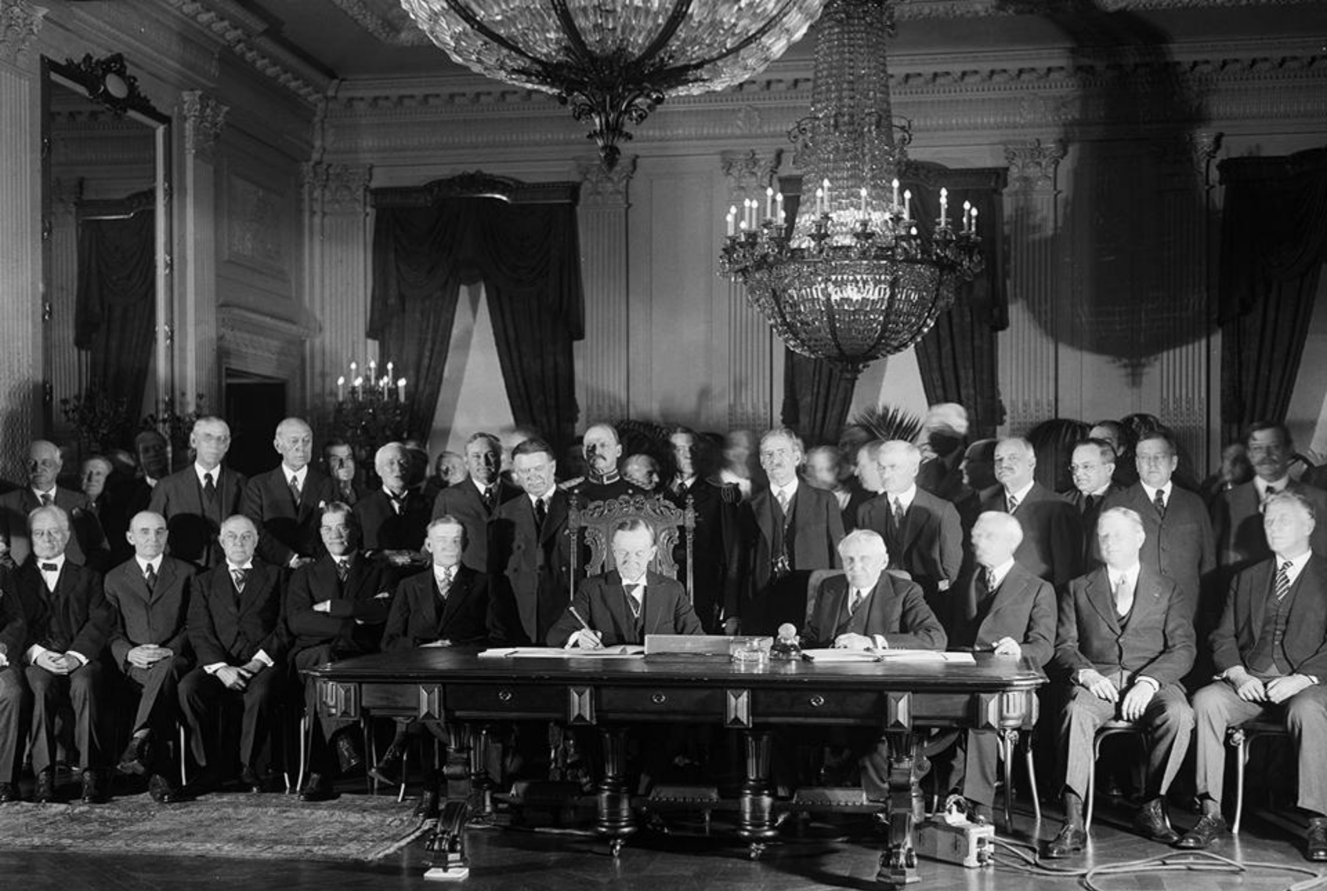
Președintele american John Calvin Coolidge Jr. semnează Pactul Briand-Kellogg (S.U.A., 1929)