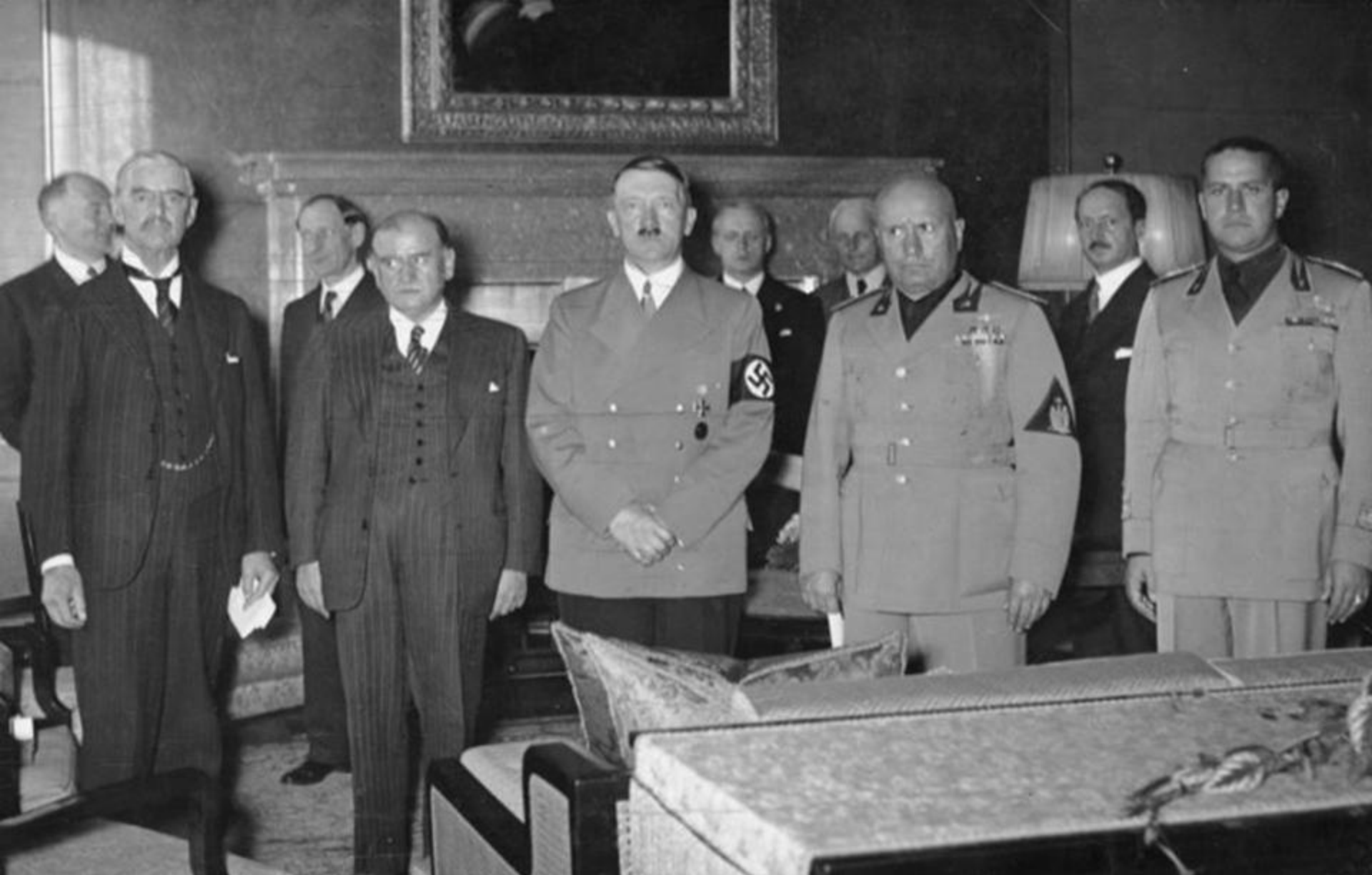
Conferința de la Munchen. De la stânga la dreapta: Arthur Neville Chamberlain (Regatul Unit), Edouard Daladier (Franța), Adolf Hitler (Germania), Benito Mussolini și Galeazzo Ciano (Italia) - Germania, 1938