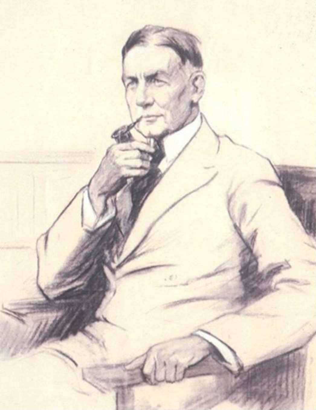
Charles Gates Dawes