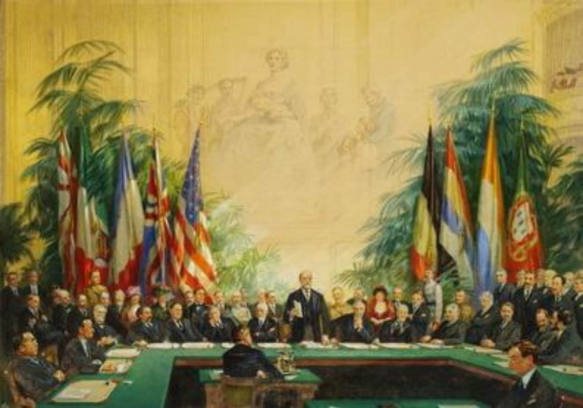
Conferința de la Washington (S.U.A., 1921-1922)