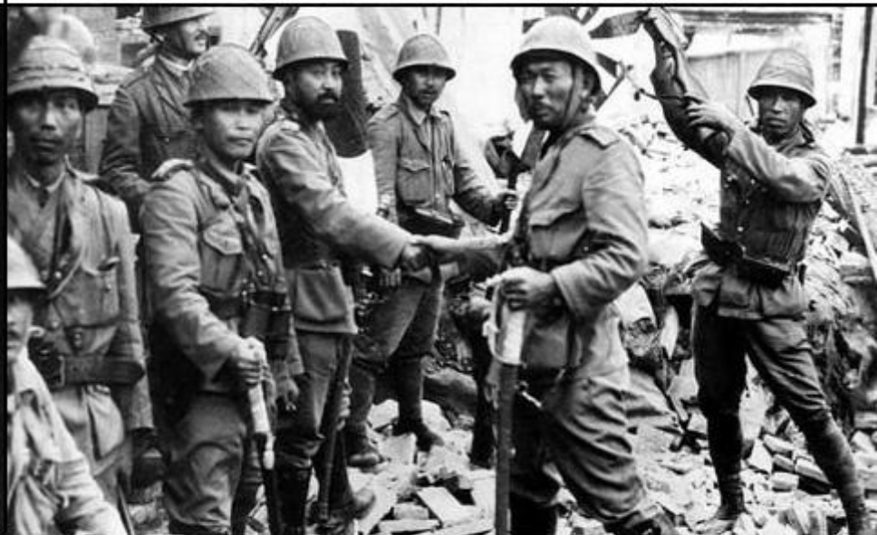
Soldati japonezi printre ruinele orașului Shanghai (China, 1937)