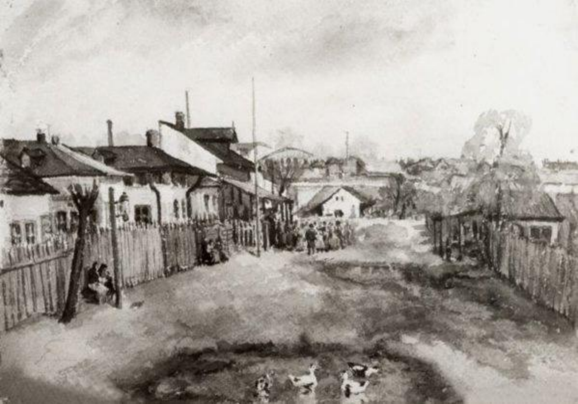
Mahala bucureșteană din perioada interbelică