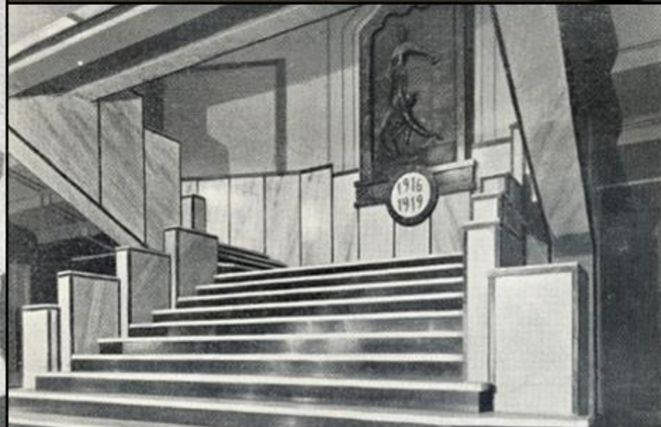
Clădirea ARCUB (Palatul Societății Funcționarilor Comunali): interior