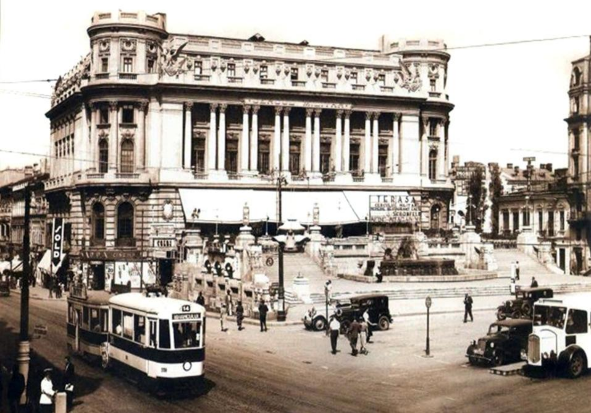
Un tramvai electric din perioada interbelică (București, anii 1930)