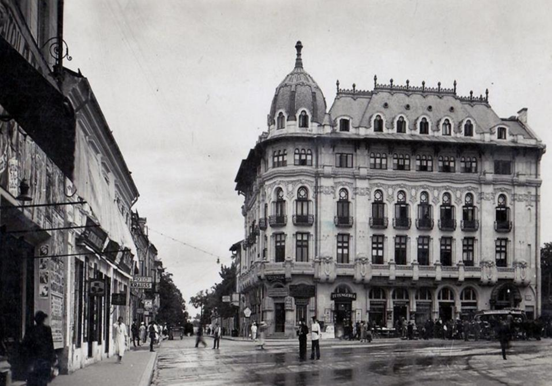
Centrul oraşului Craiova