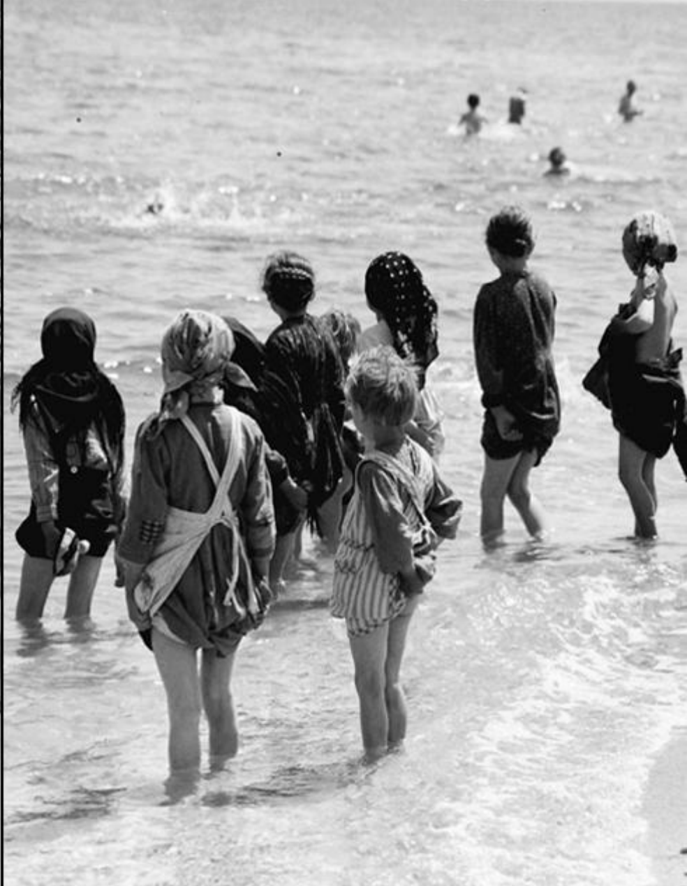
Copii la plajă (Constanța, anii 1930)