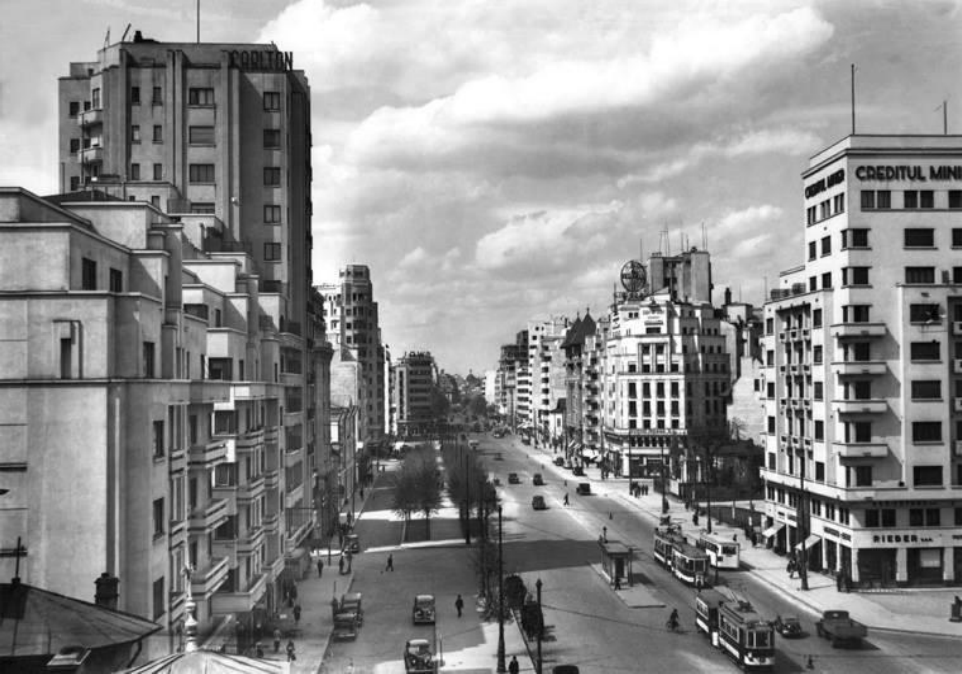
Arhitectura „Micului Paris”: bulevardul I. C. Brătianu (anii 1930)