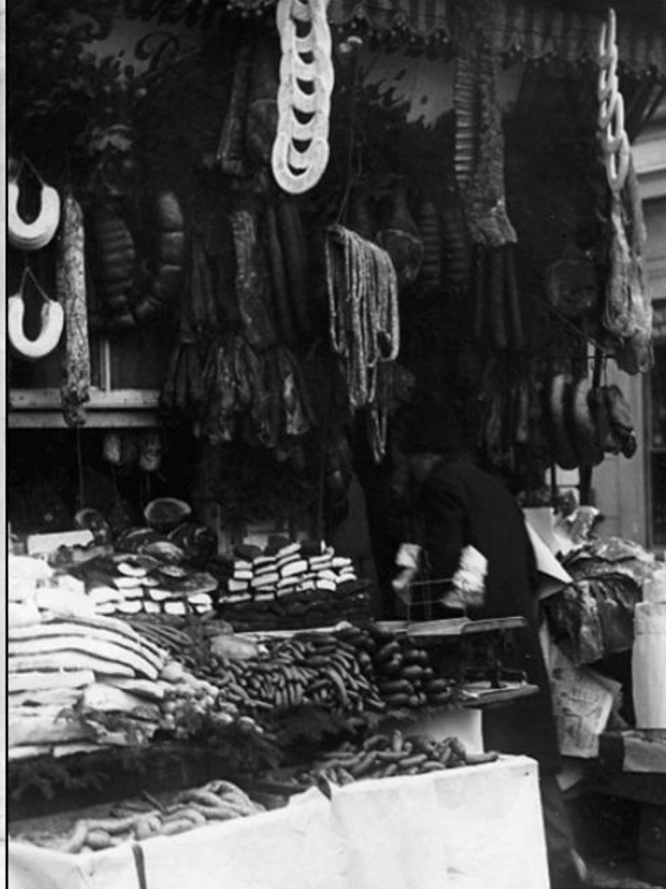
Prăvălie cu vânzare de cârnați (București, 1929)