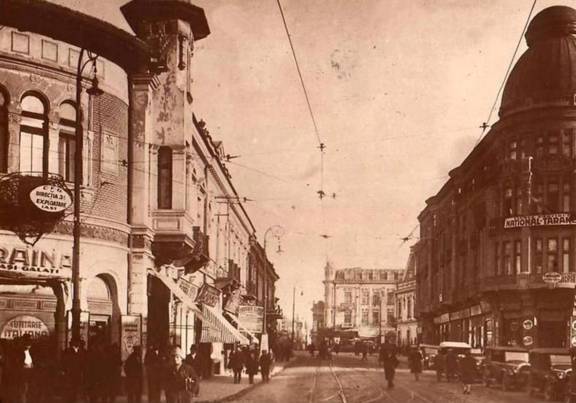
Iași: centrul aglomerat al orașului