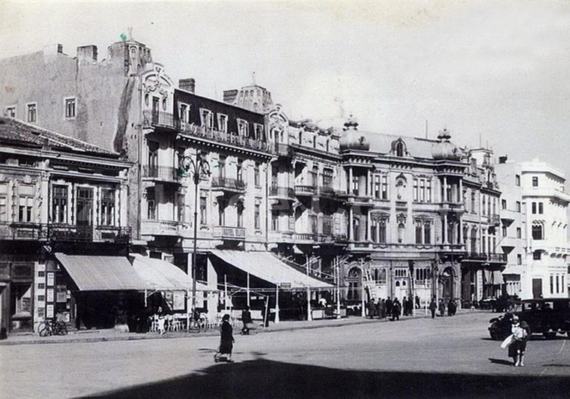
Centrul Constanței (în prezent zona istorică - Centrul Vechi)