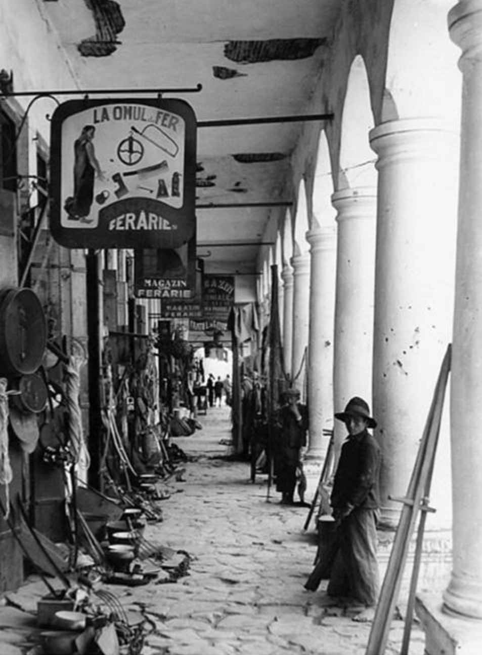
Bazarul de pe Calea Griviței (București, 1927)