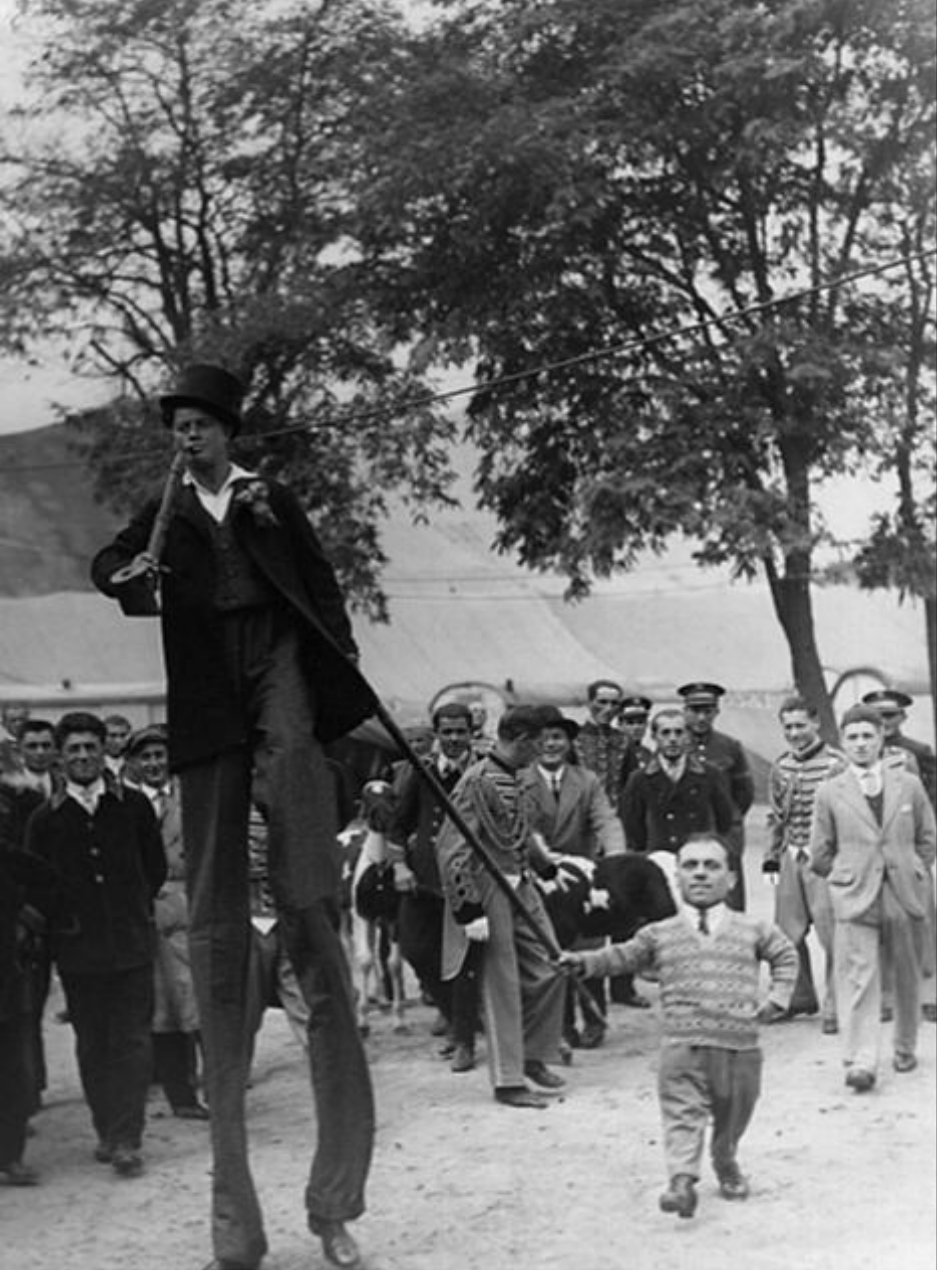
Târgul Moșilor, marea paradă (București, 1929)