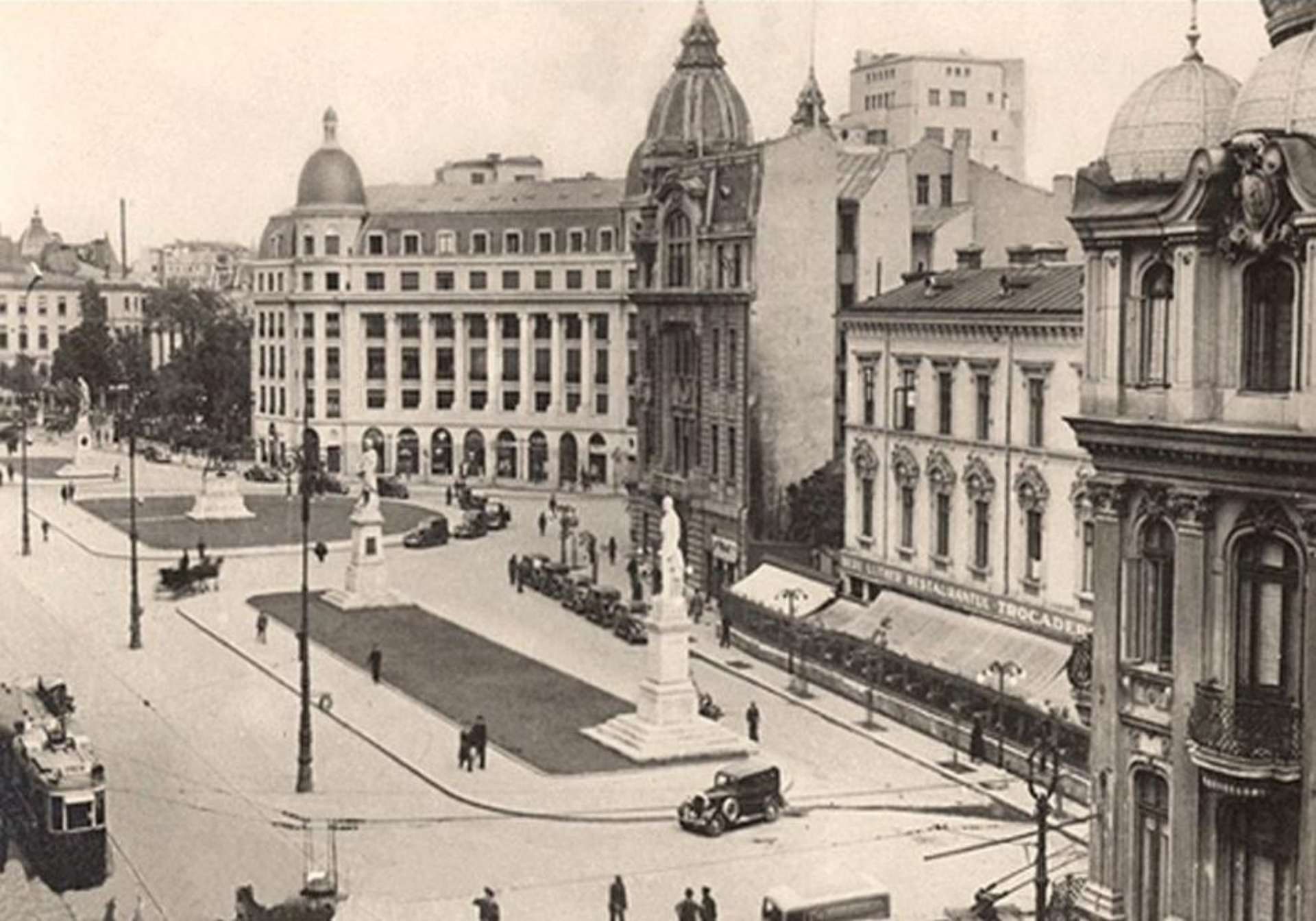
Arhitectura „Micului Paris” (București, anii 1930)