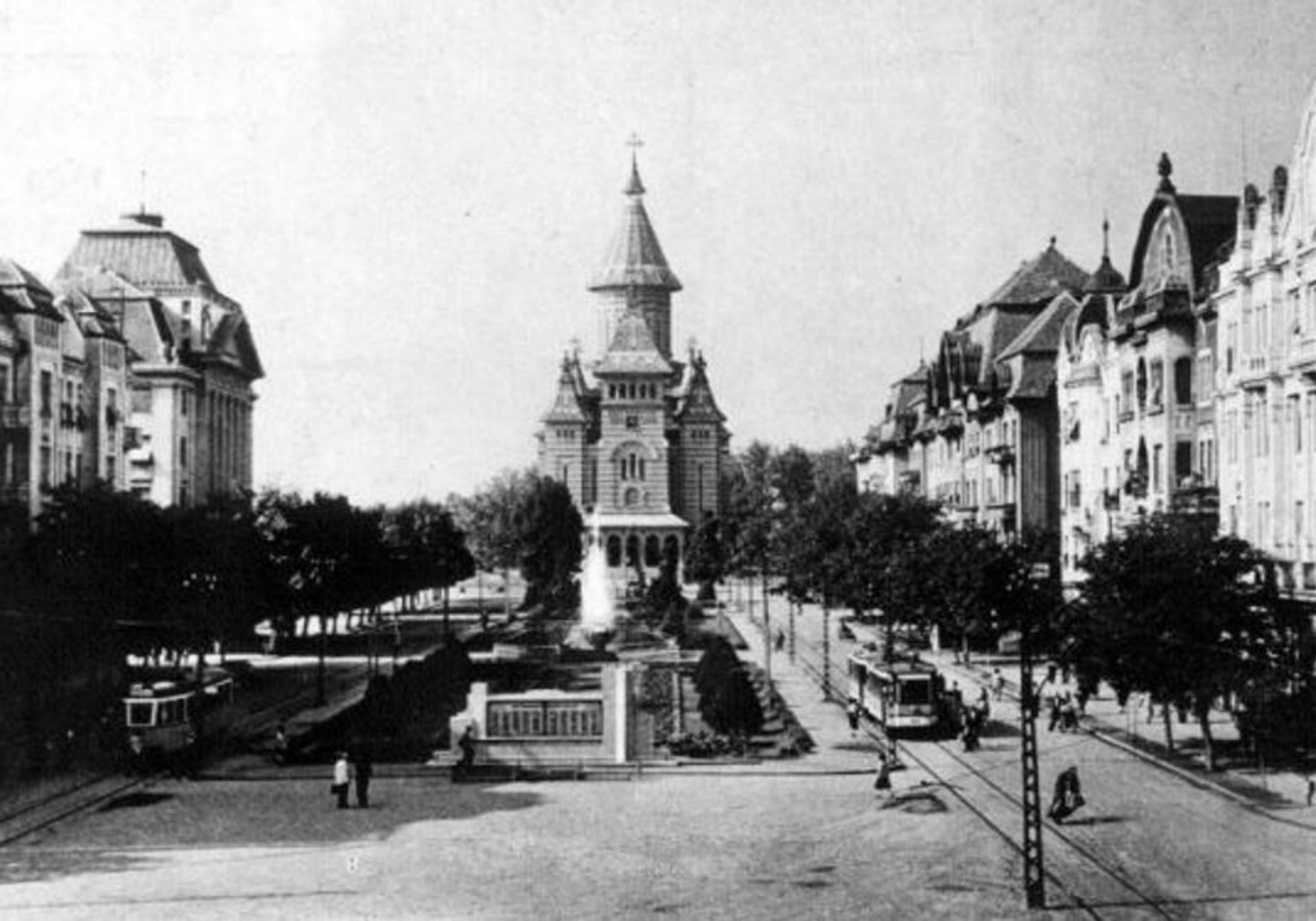
Timișoara (centrul orașului în perioada interbelică)