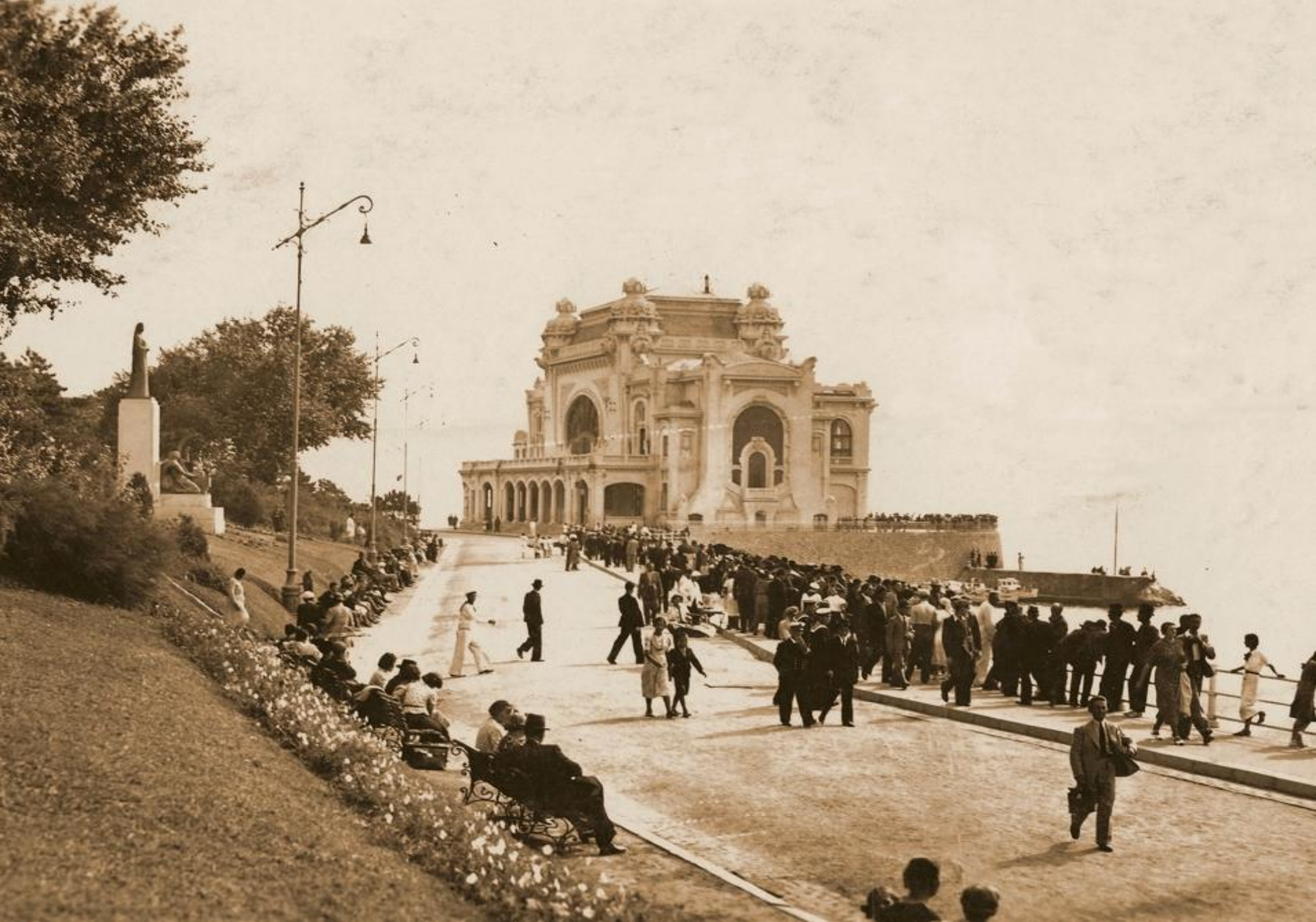
Constanța: clădirea Cazinoului (anii 1920)