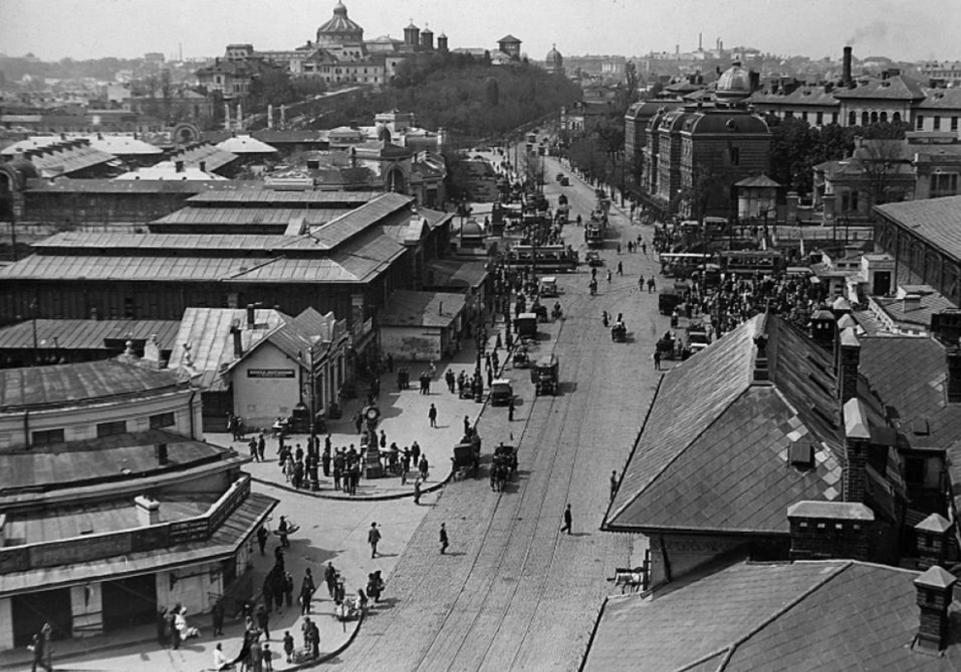
Bucureștiul interbelic: bulevard aglomerat