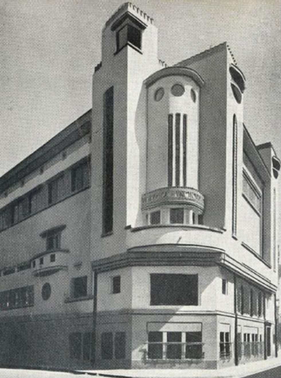
Clădirea ARCUB (Palatul Societății Funcționarilor Comunali) - actualul Palat al Artei