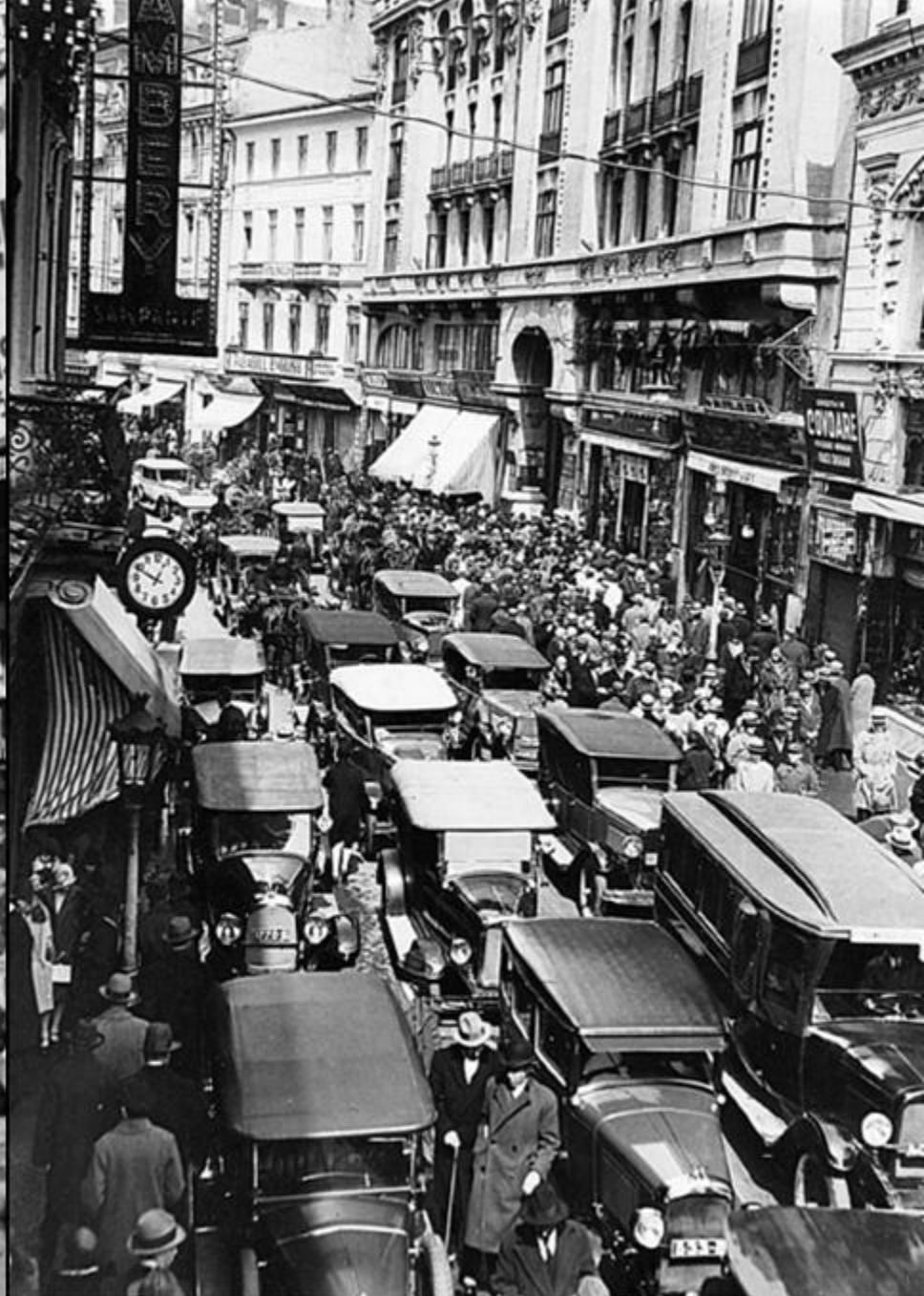
Calea Victoriei (București, 1923)