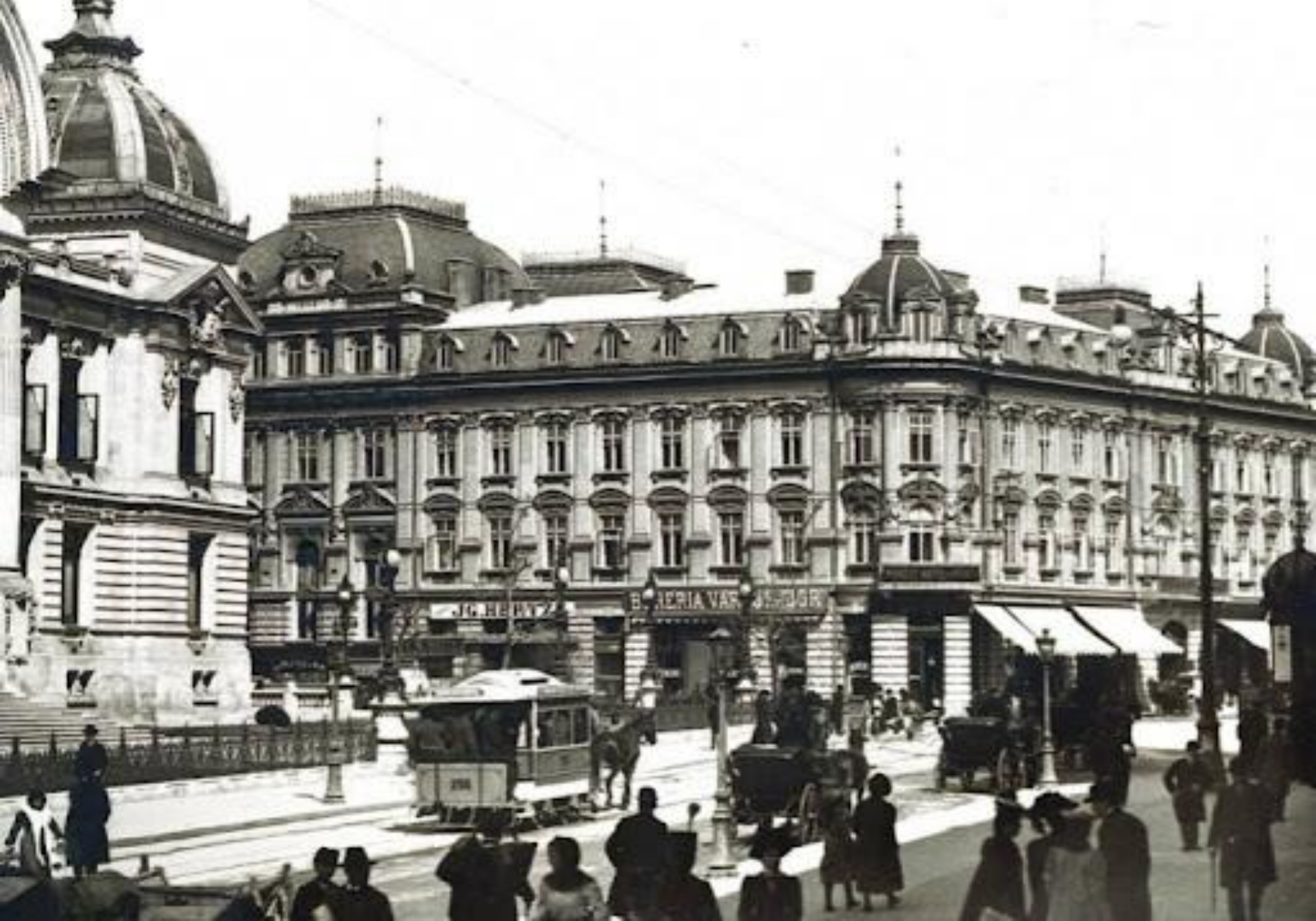
Bucureștiul interbelic: zona centrală