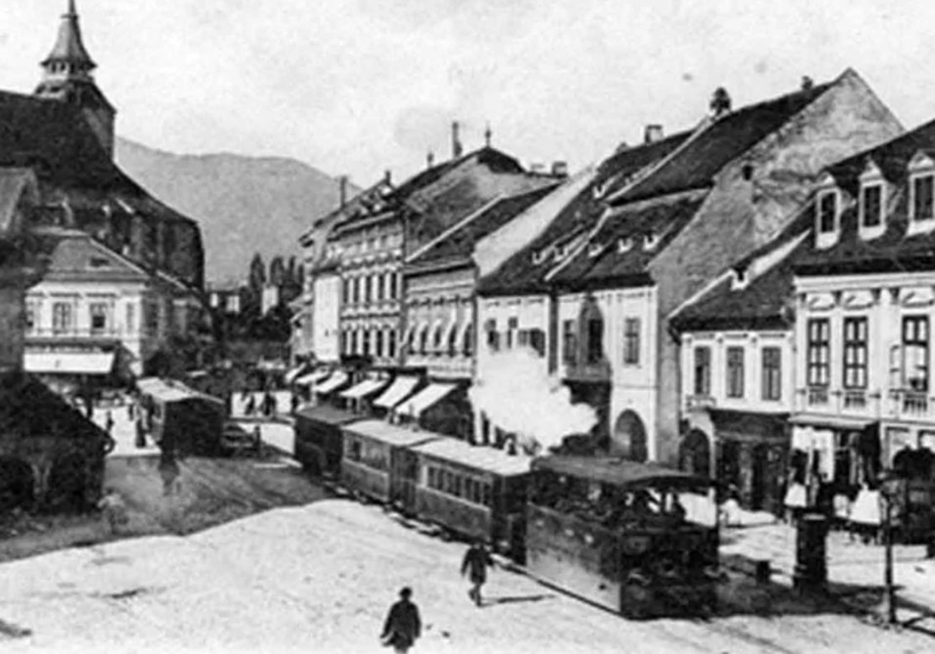
Brașov: Piața Sfatului