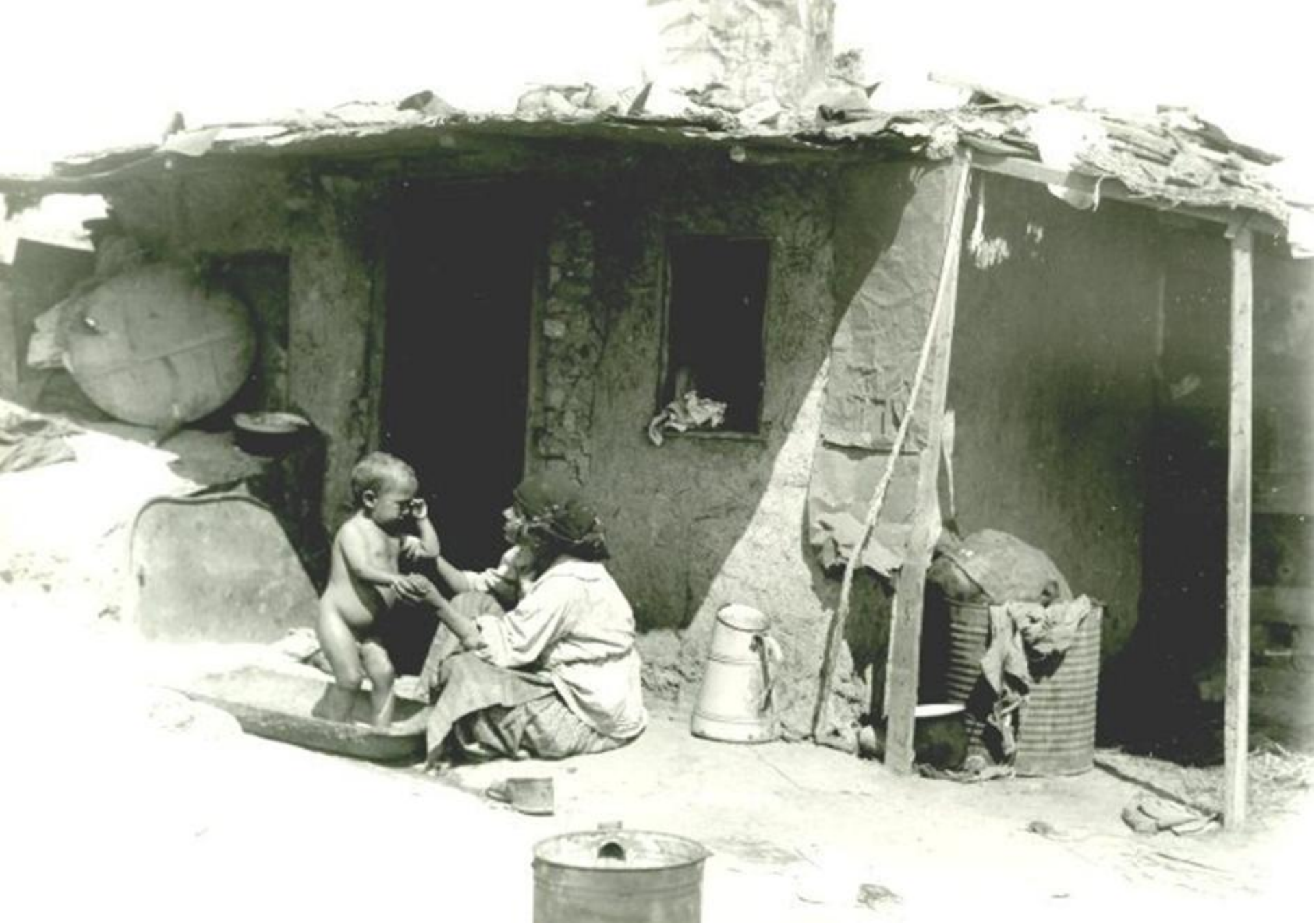
Mahalaua bucureșteană: locuință din „ Gropile lui Ouatu ” (anii 1930)