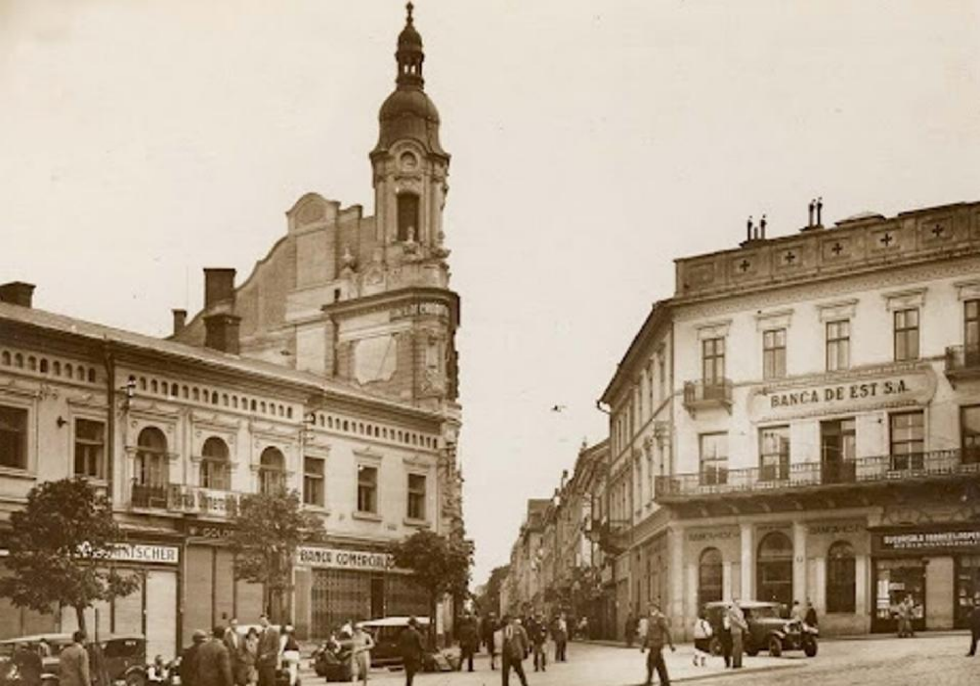
Un bulevard din orașul Cernăuți