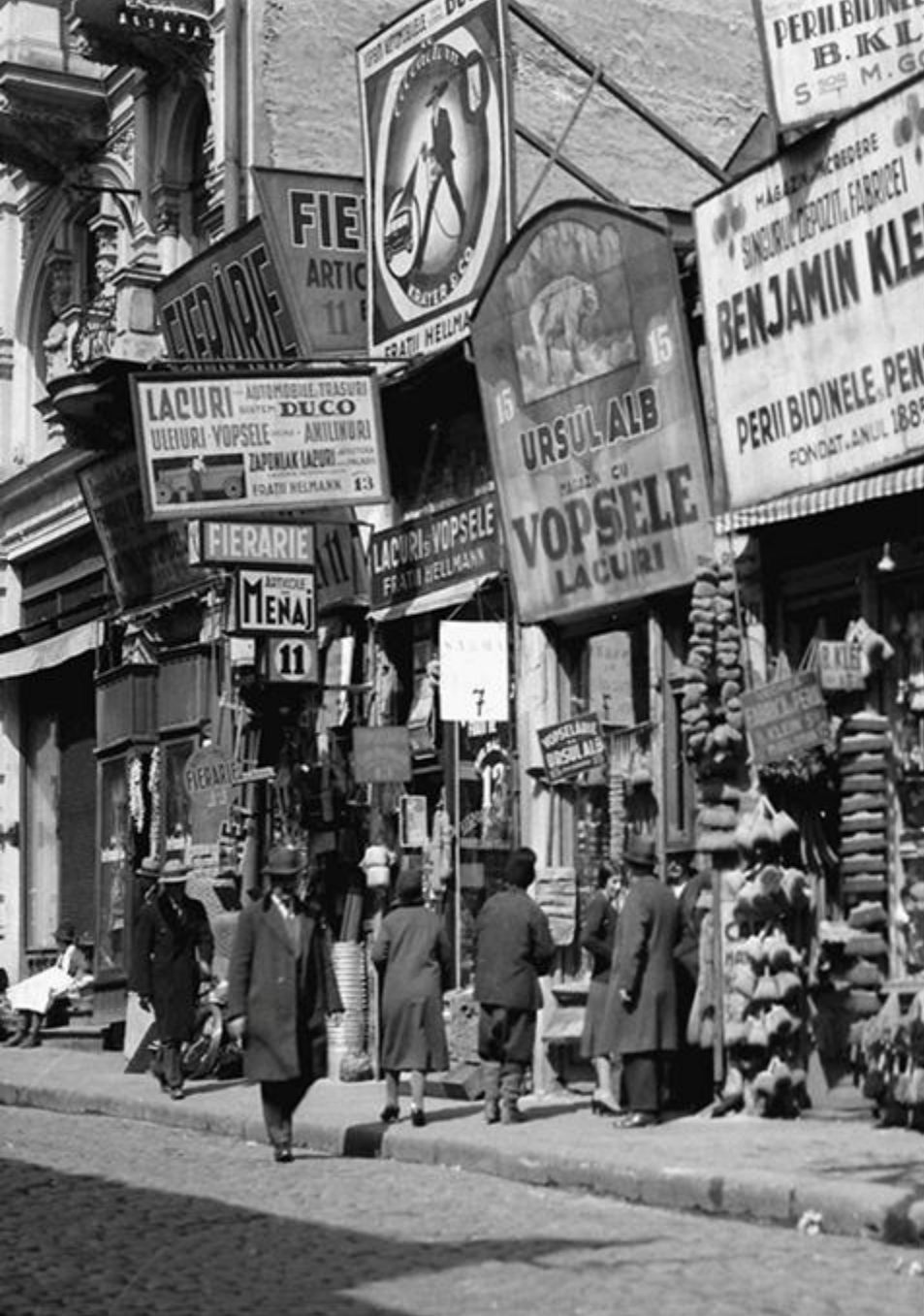
Magazine din centrul Capitalei