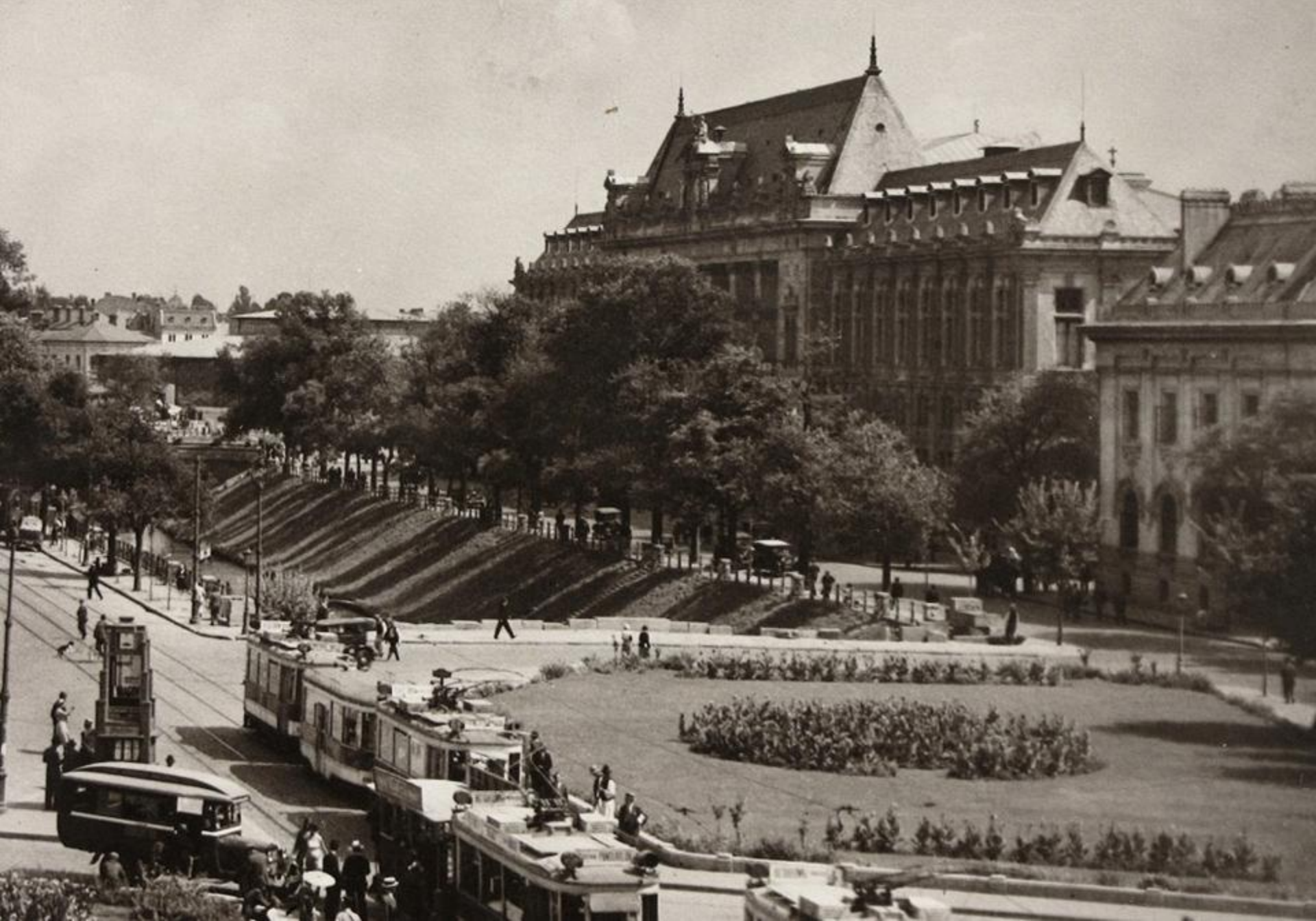
București: clădirea Palatului Justiției