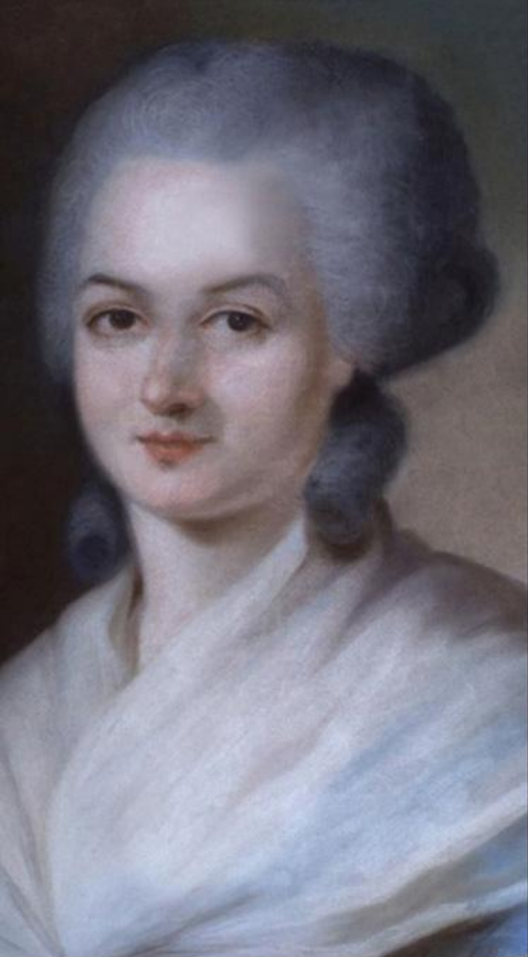
Olympe de Gouges