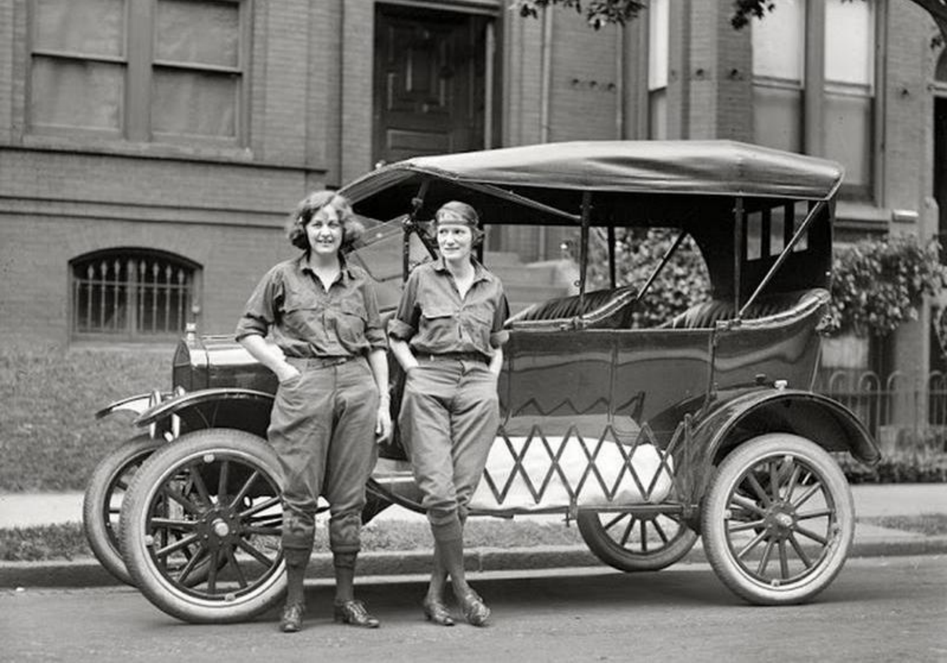
Femei la volan (S.U.A., 1922)