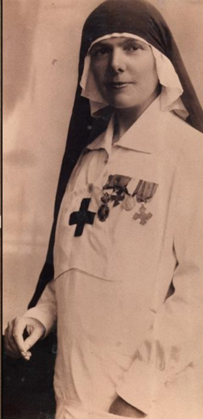
Elisa Leonida Zamfirescu